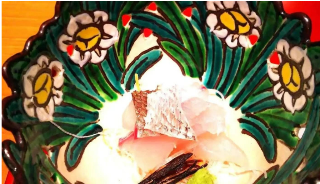
にしむら シーフード