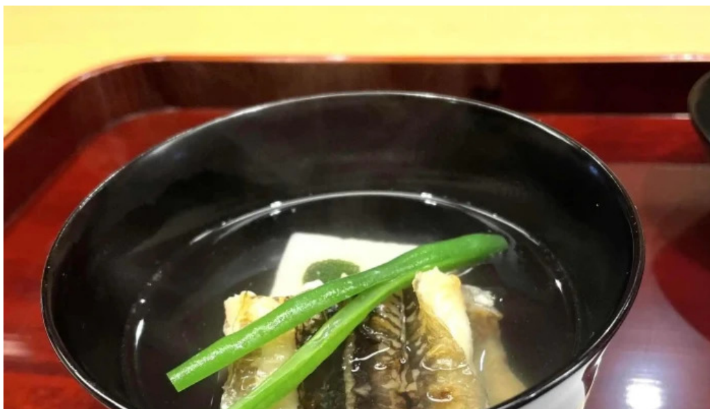
にしむら コメント