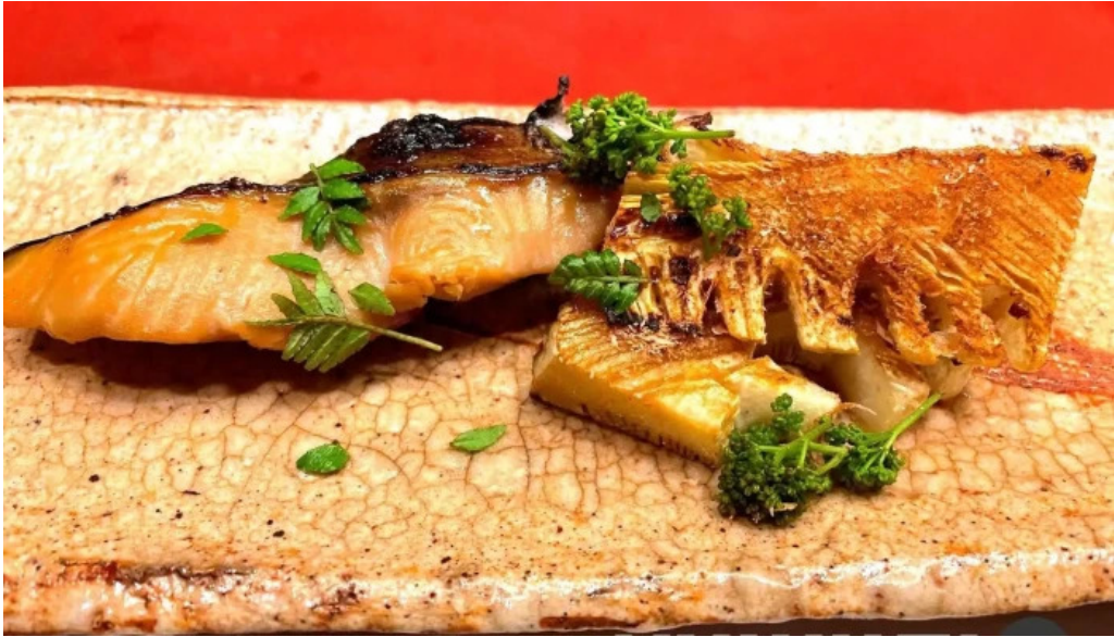
にしむら 料理飲み物