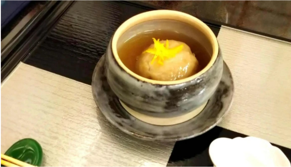
日本料理 大屋 エリア