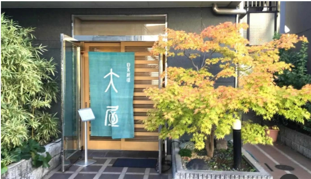
日本料理 大屋 オーナー提供