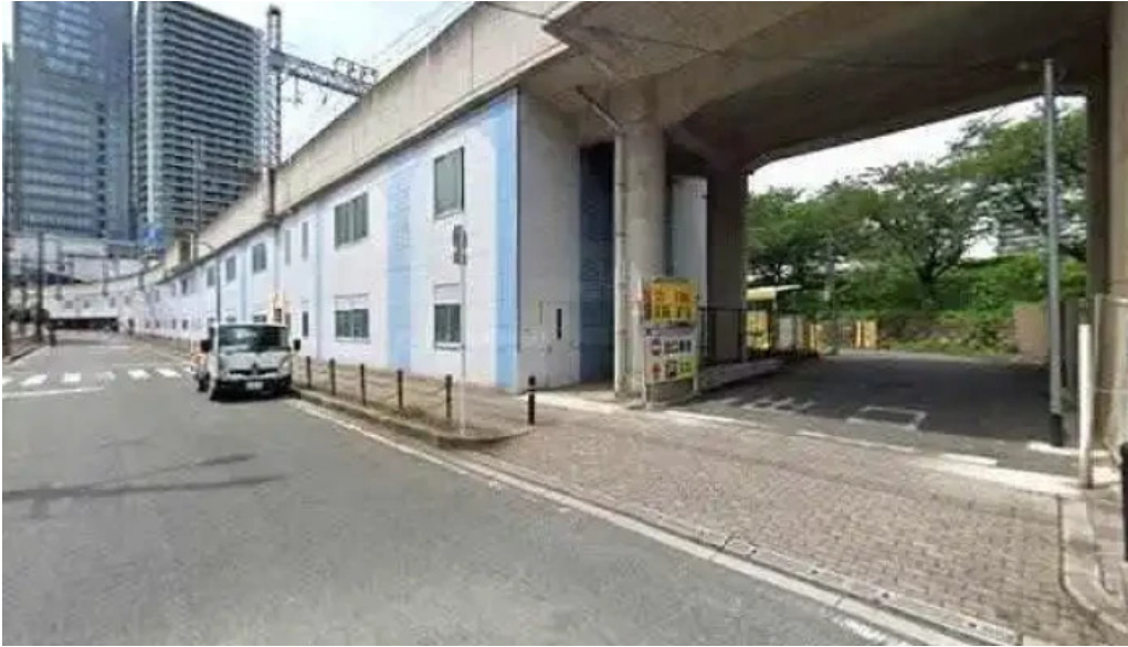
日本料理 大屋 枚方市