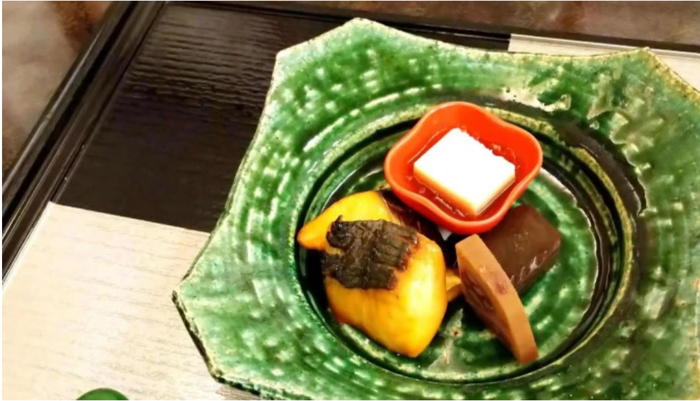
日本料理 大屋 口コミ