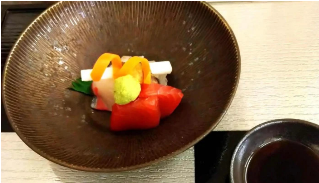
日本料理 大屋 所在地