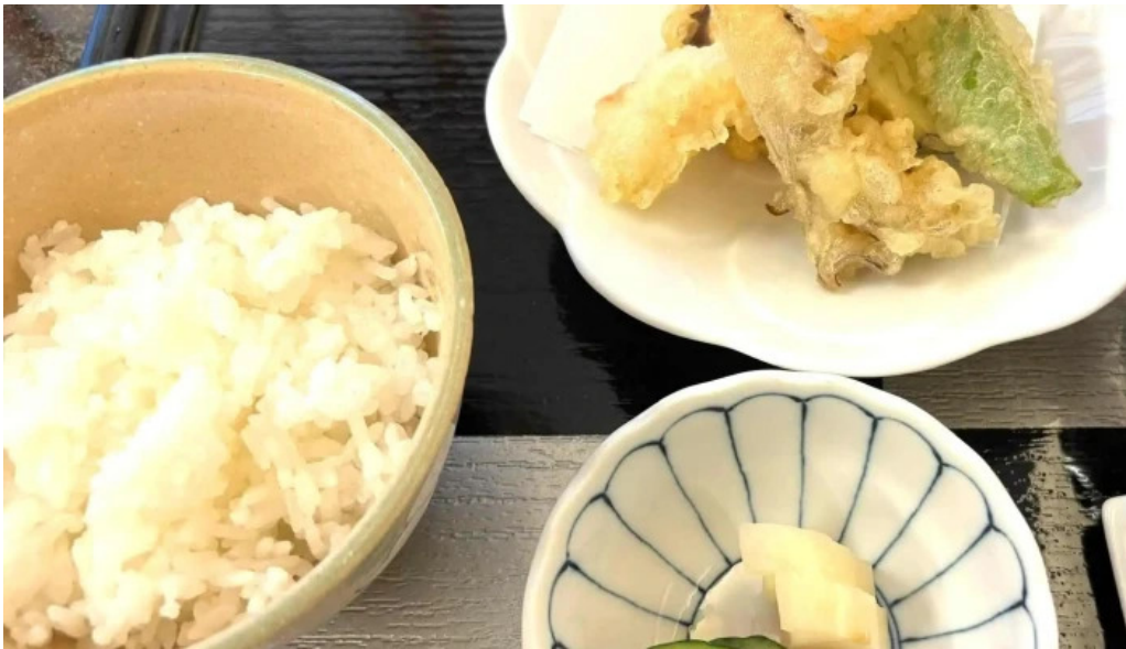
日本料理 大屋 動画