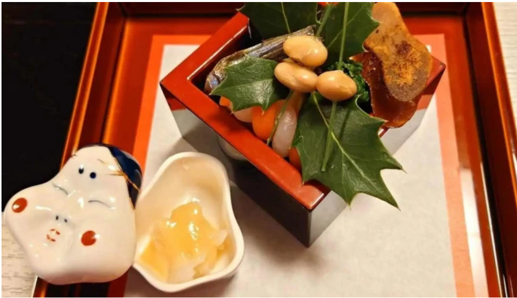
日本料理 大屋 料理飲み物