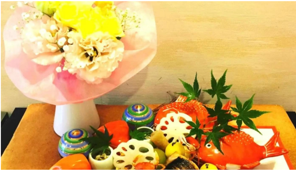
日本料理 大屋 懐石