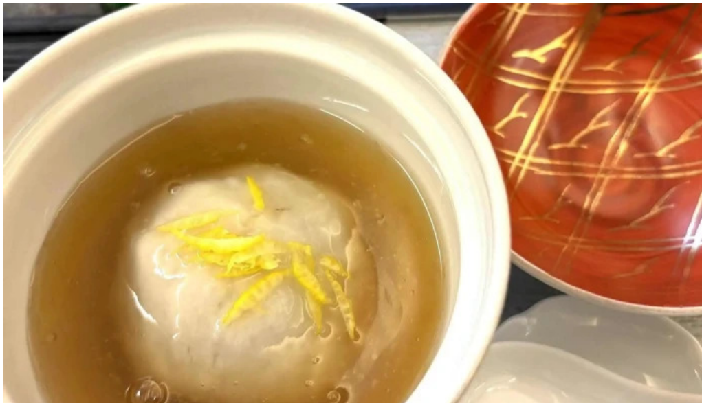
日本料理 大屋 番号