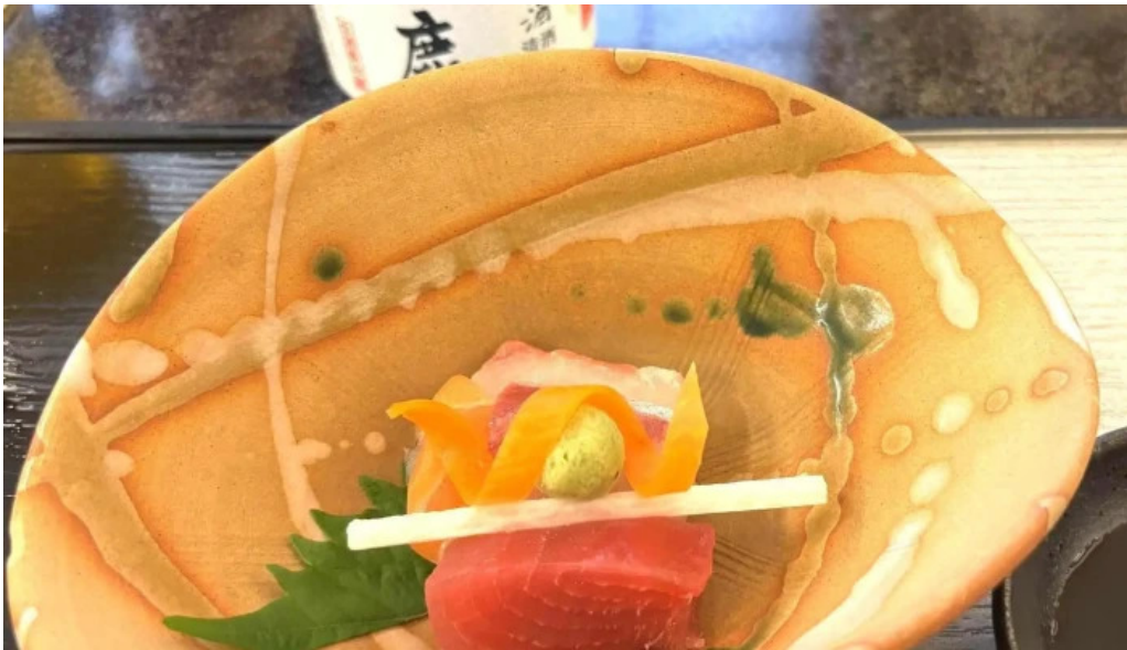
日本料理 大屋 instagram