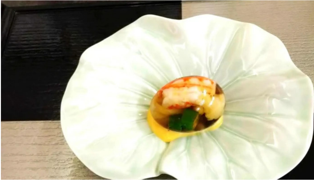
日本料理 大屋 コメント