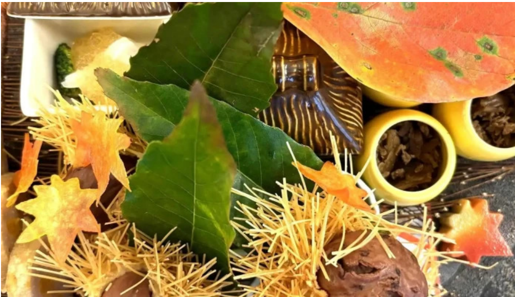
日本料理 大屋 料金