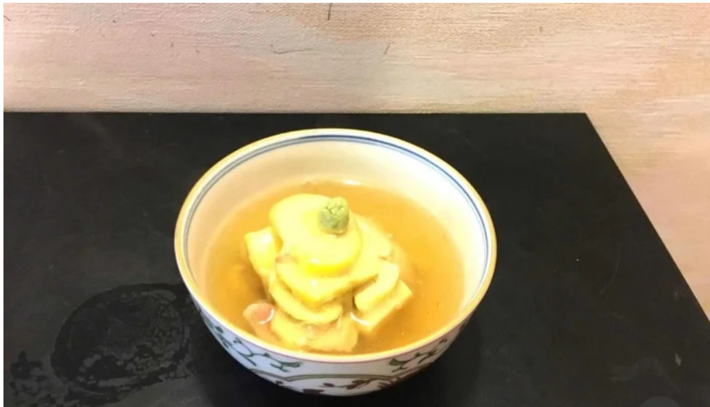
日本料理 大屋 スープ