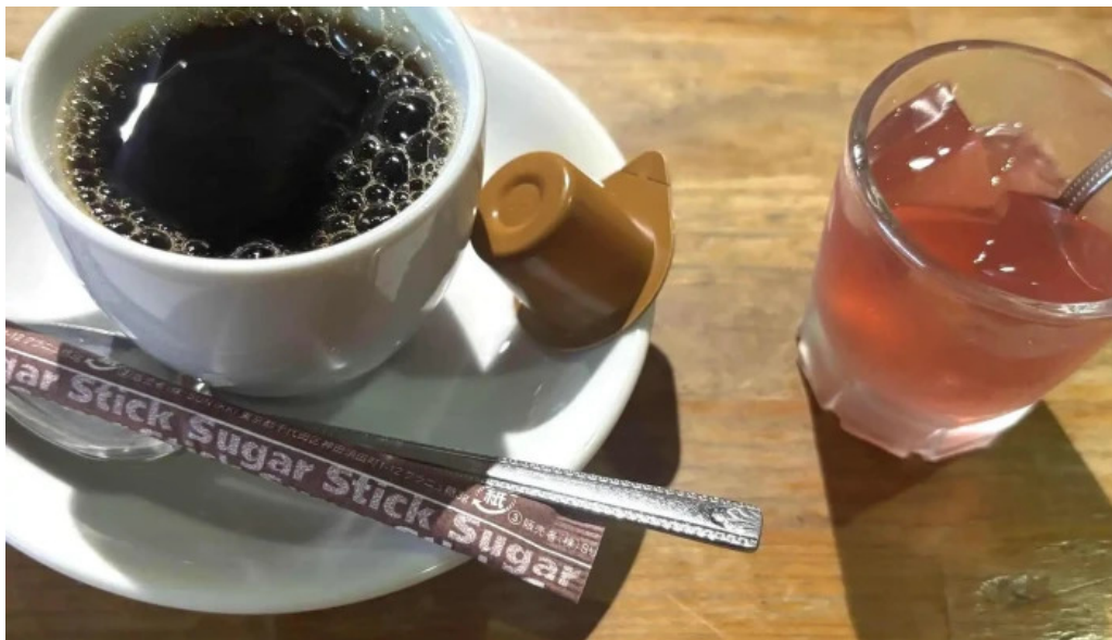
食彩酒房たきびたきび庵 料金