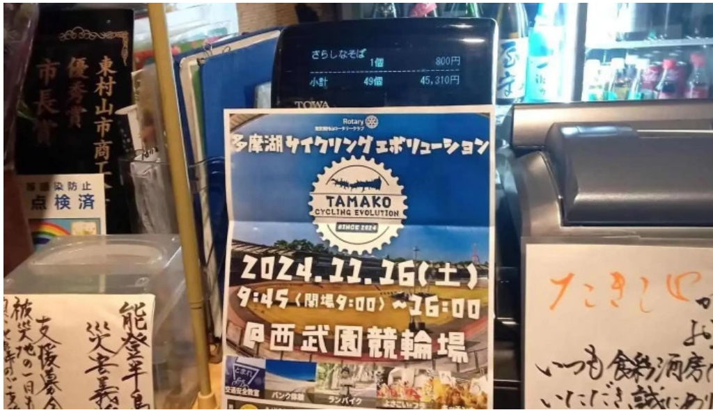
食彩酒房たきびたきび庵 最新