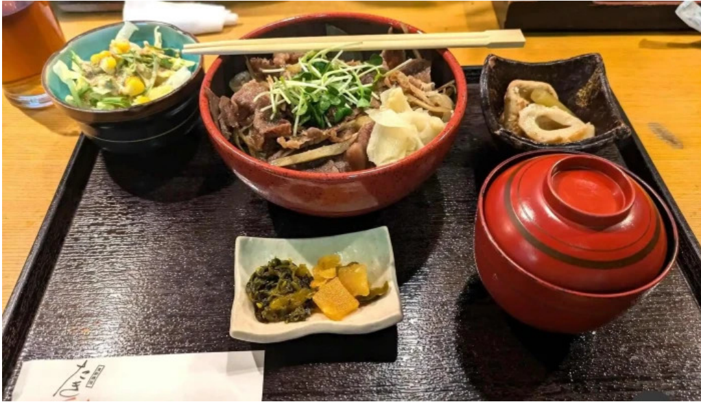
食彩酒房たきびたきび庵 蕎麦