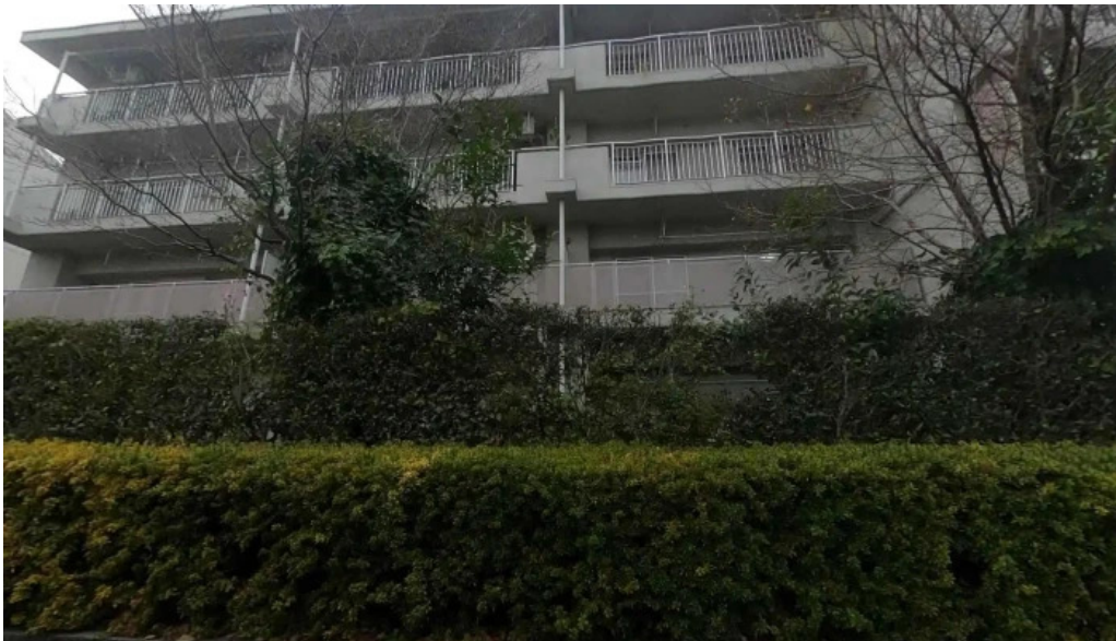
食彩酒房たきびたきび庵 東村山市