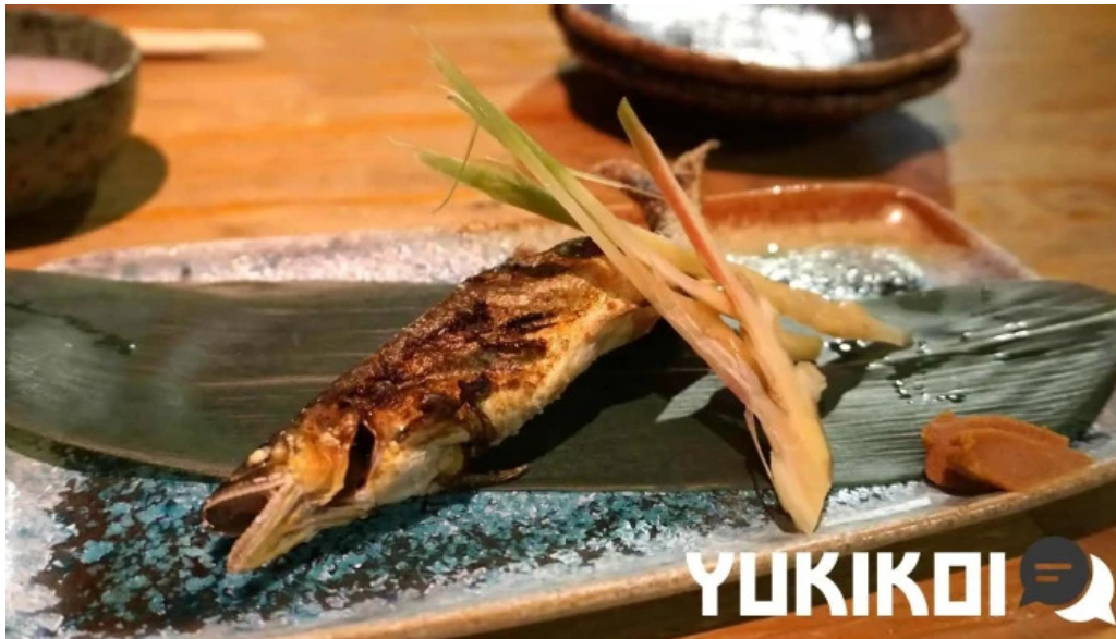
食彩酒房たきびたきび庵 シーフード