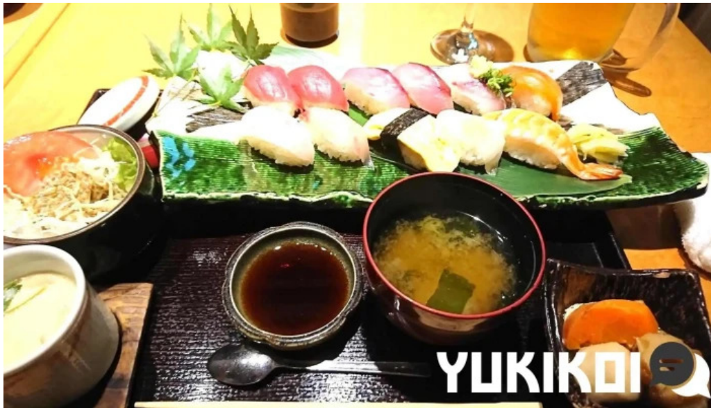
食彩酒房たきびたきび庵 スープ