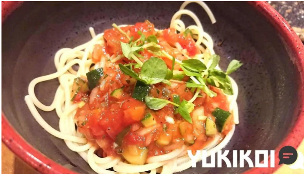
食彩酒房たきびたきび庵 料理飲み物