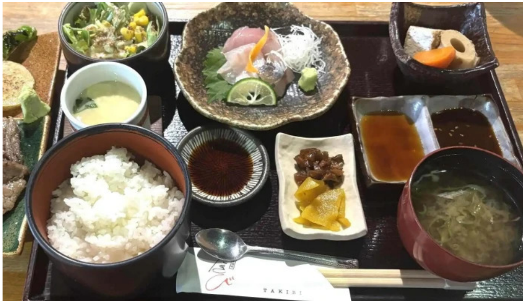
食彩酒房たきびたきび庵 住所