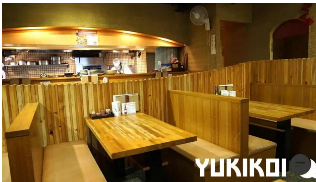
食彩酒房たきび&たきび庵 東村山市