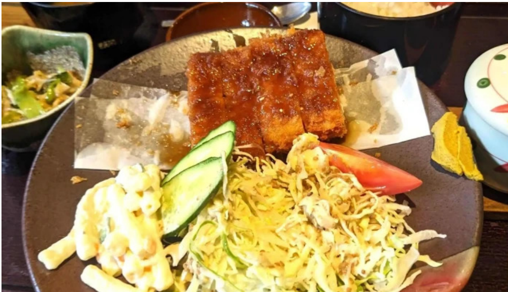
食彩酒房たきびたきび庵 どこ