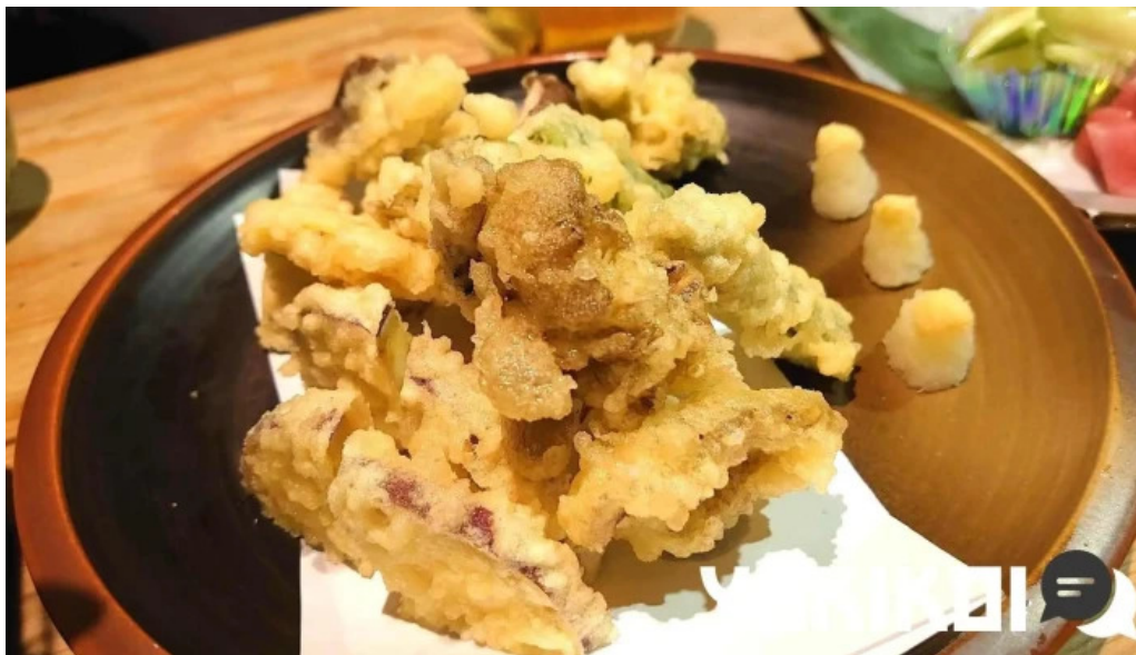
食彩酒房たきびたきび庵 天ぷら