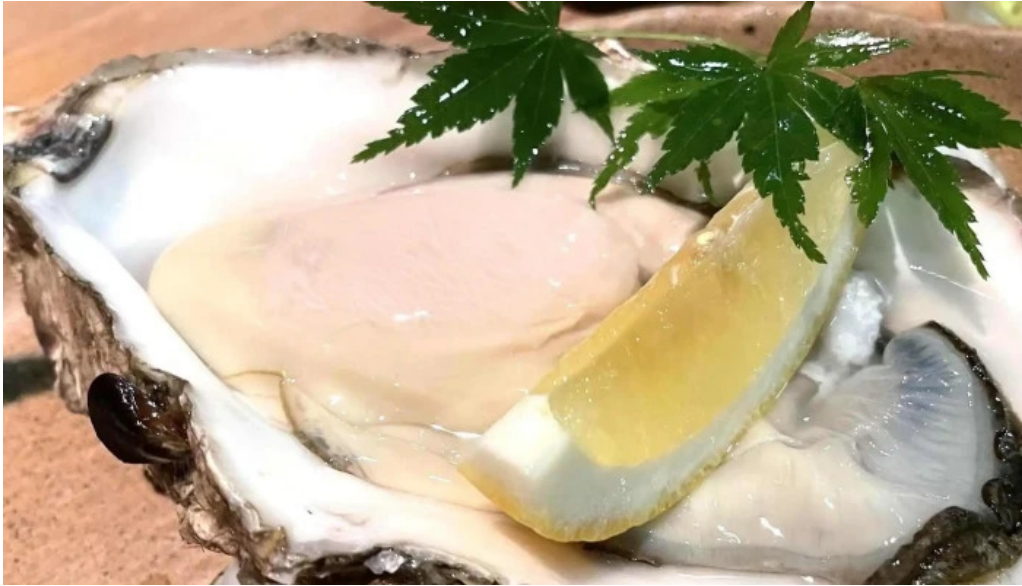
食彩酒房たきびたきび庵 エリア