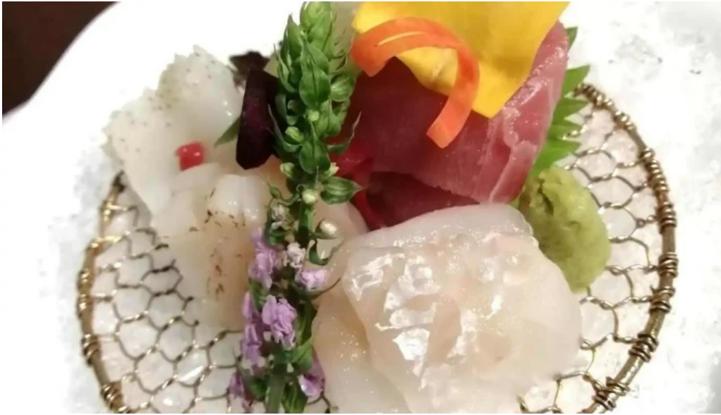
司季彩庵 久呂川 刺身