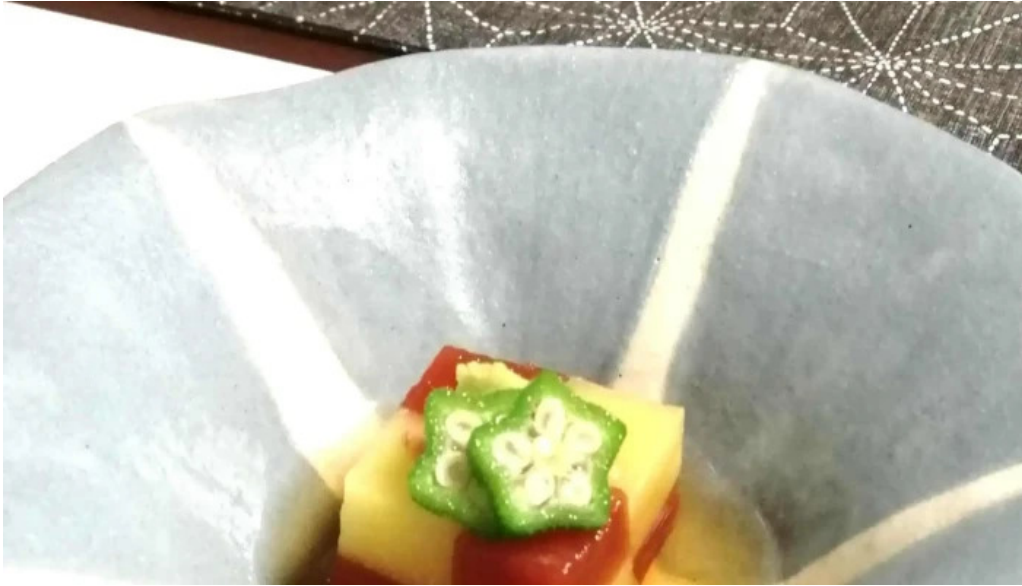
司季彩庵 久呂川 プロモーション