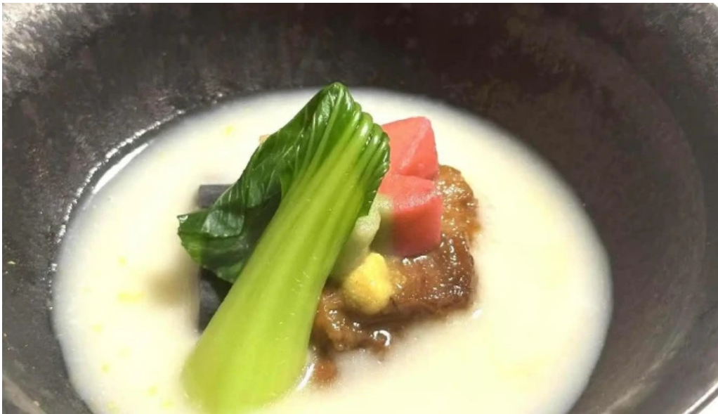
司季彩庵 久呂川 スープ