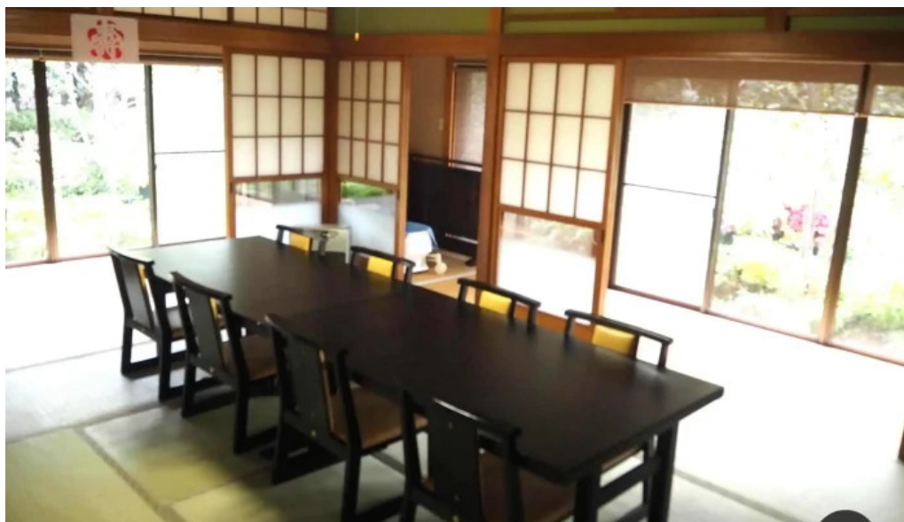
司季彩庵 久呂川 雰囲気