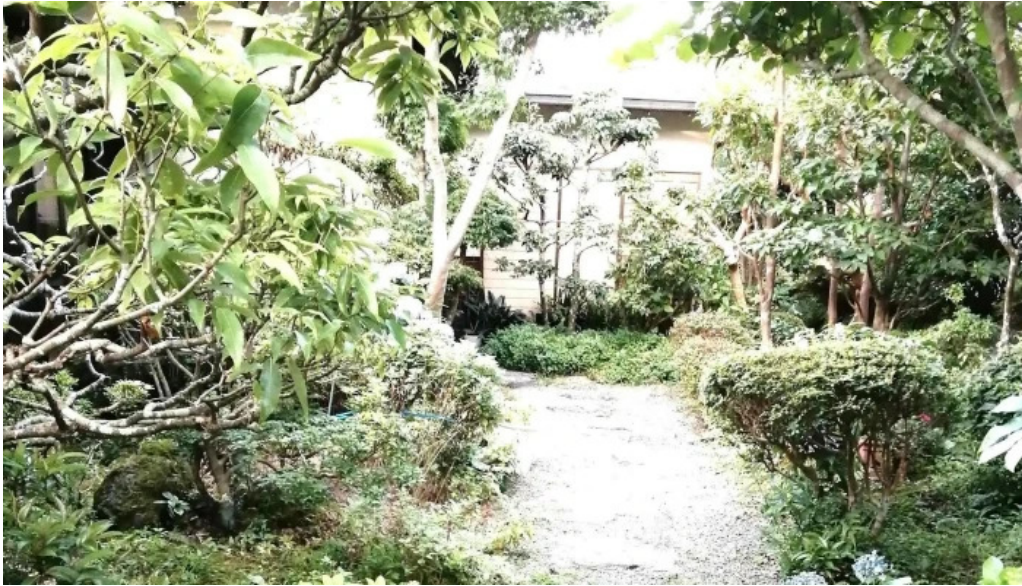
司季彩庵 久呂川 コメント