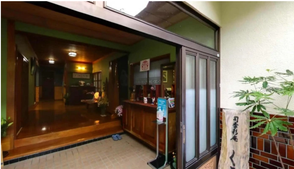
司季彩庵 久呂川 御殿場市