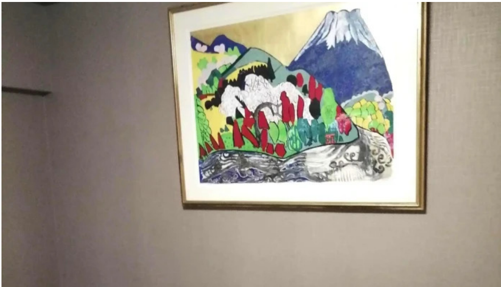
司季彩庵 久呂川 カタログ