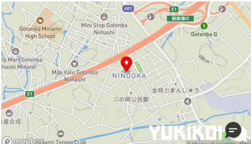
司季彩庵 久呂川 地図