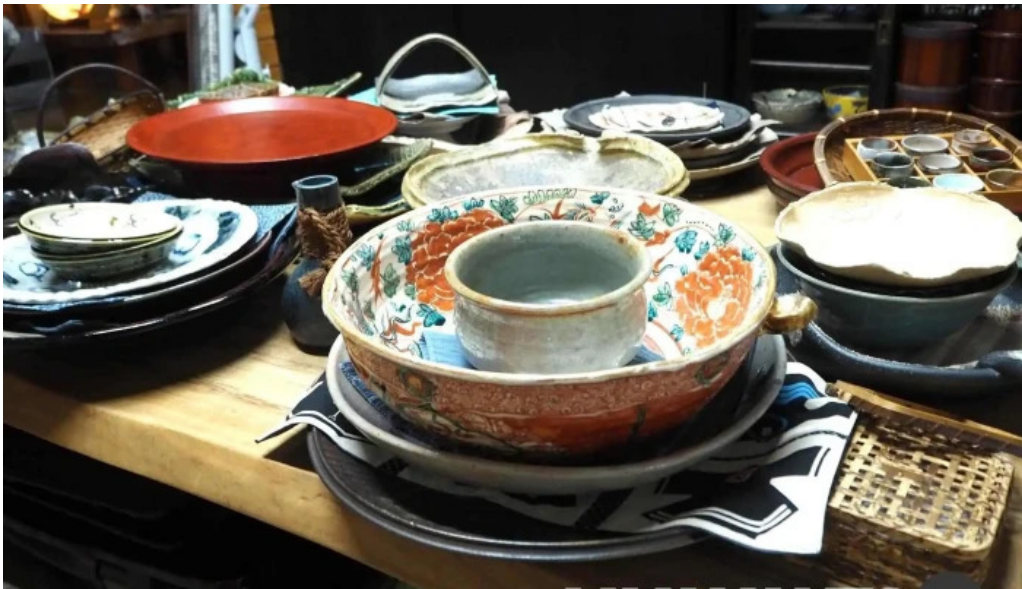
司季彩庵 久呂川 料理飲み物