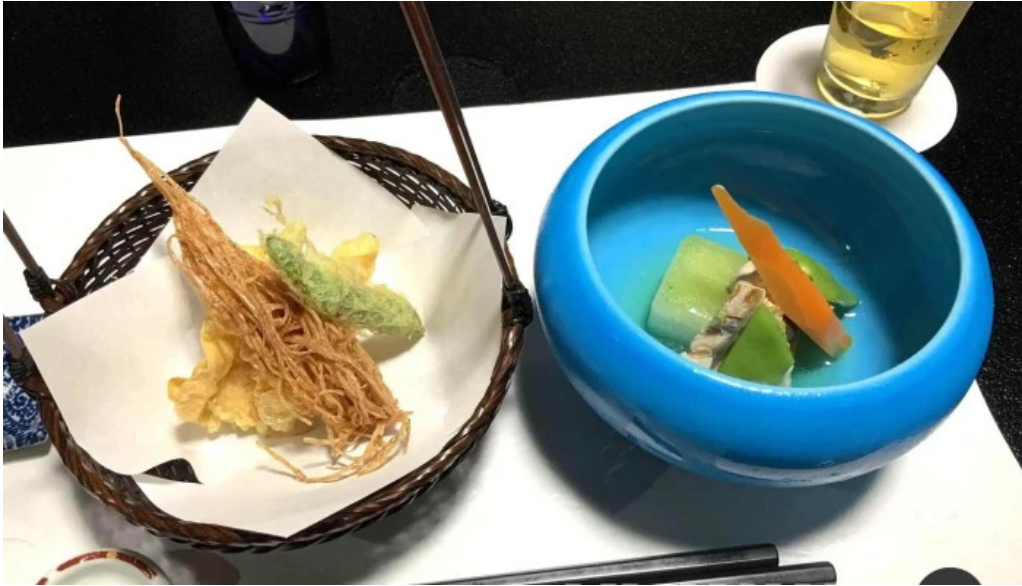
司季彩庵 久呂川 懐石