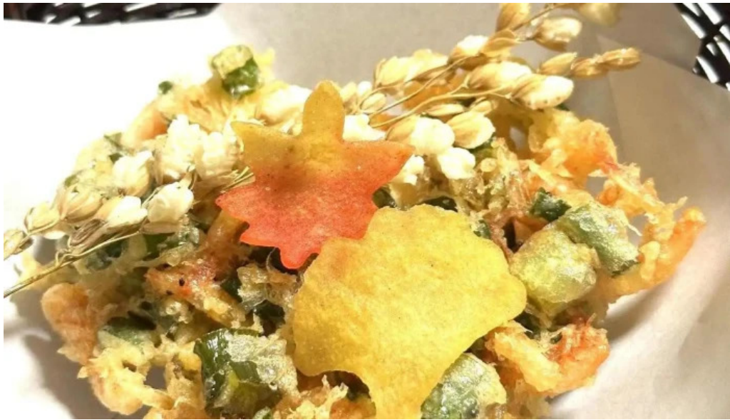
司季彩庵 久呂川 天ぷら