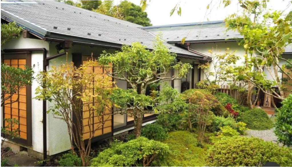
司季彩庵 久呂川 オーナー提供