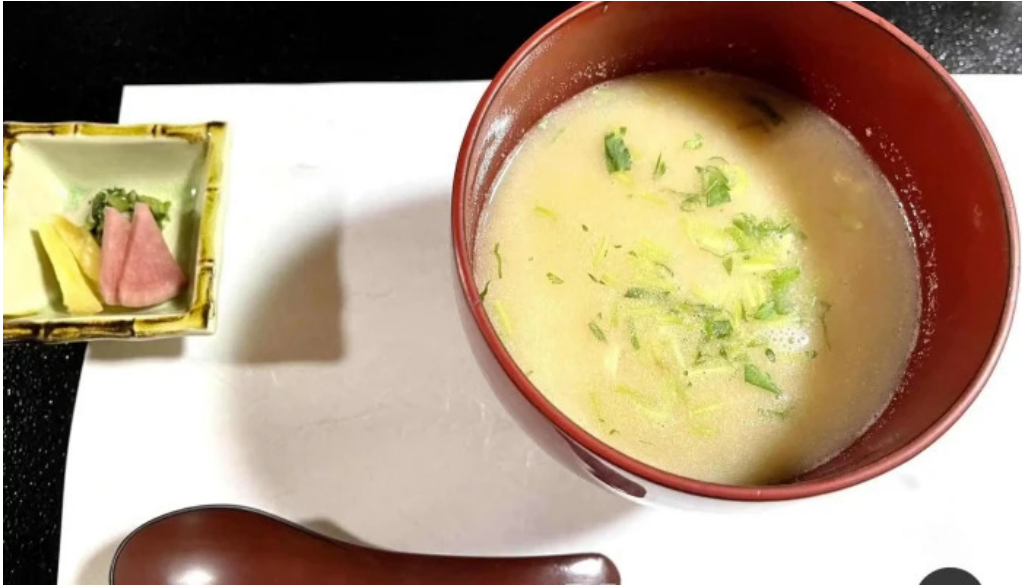
司季彩庵 久呂川 味噌汁