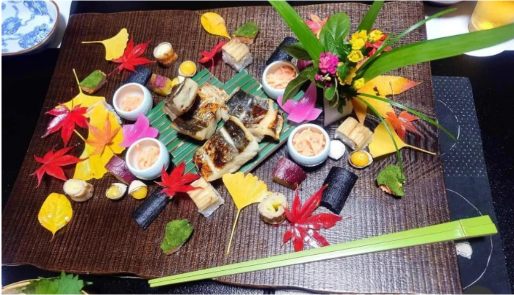
司季彩庵 久呂川 最新