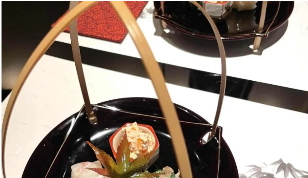
匠プロモーション