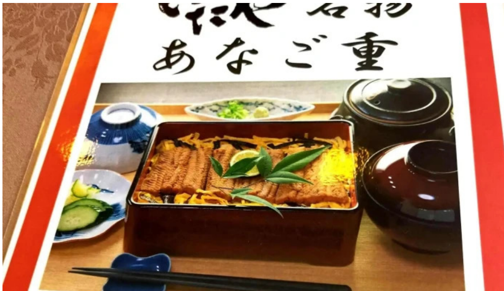
いたや comentario 3