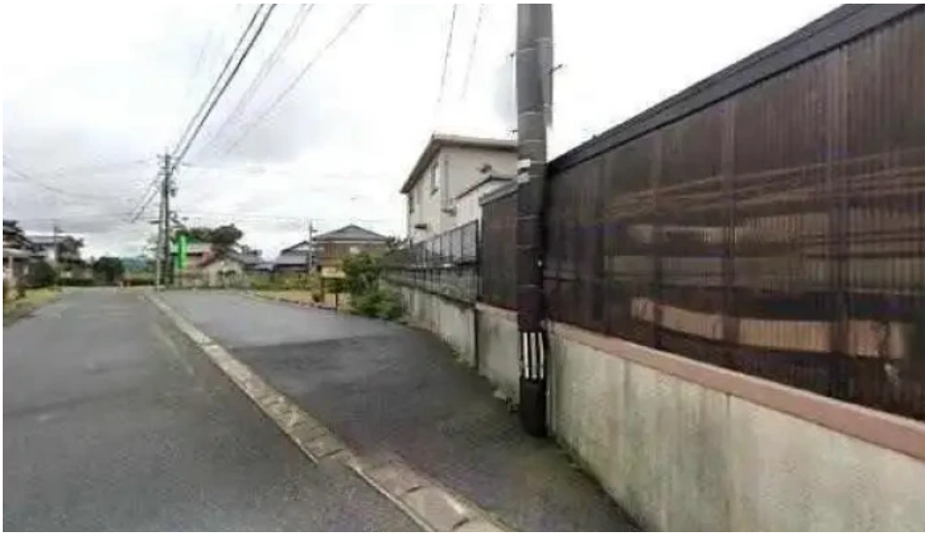
いたや ストリートビューと 360 ビュー