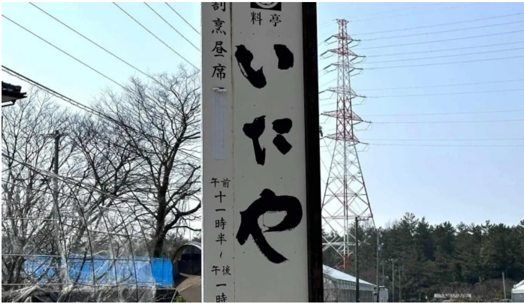
いたや comentario 6