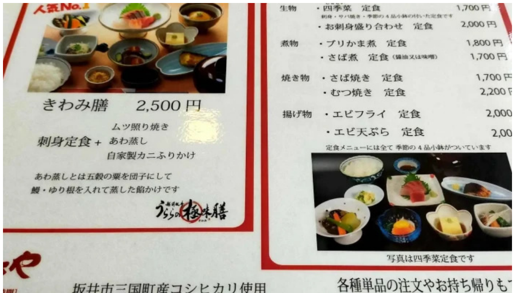
いたや comentario 2