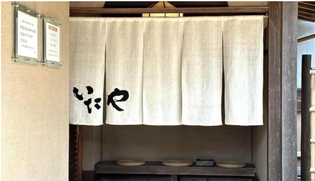
いたや comentario 7