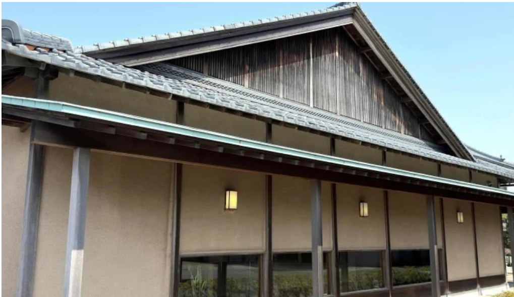
いたや comentario 5