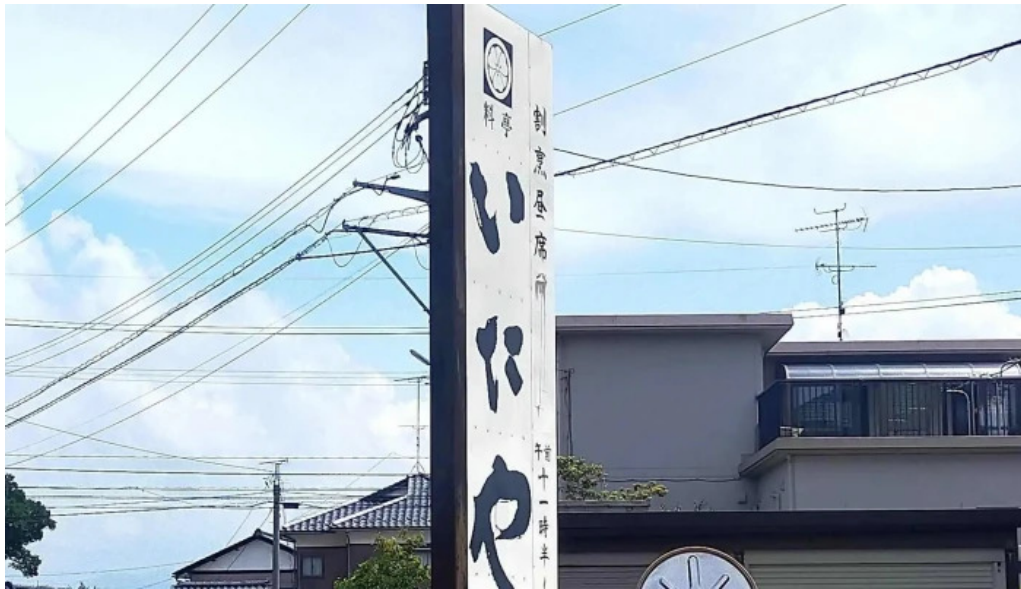
いたや comentario 1