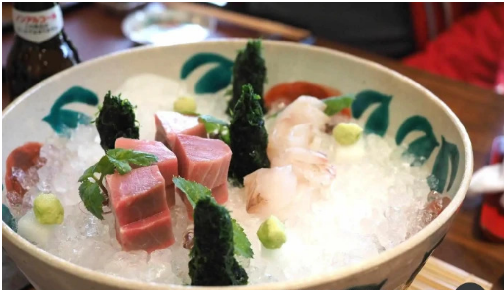
竜湖畔 壹傳 スープ