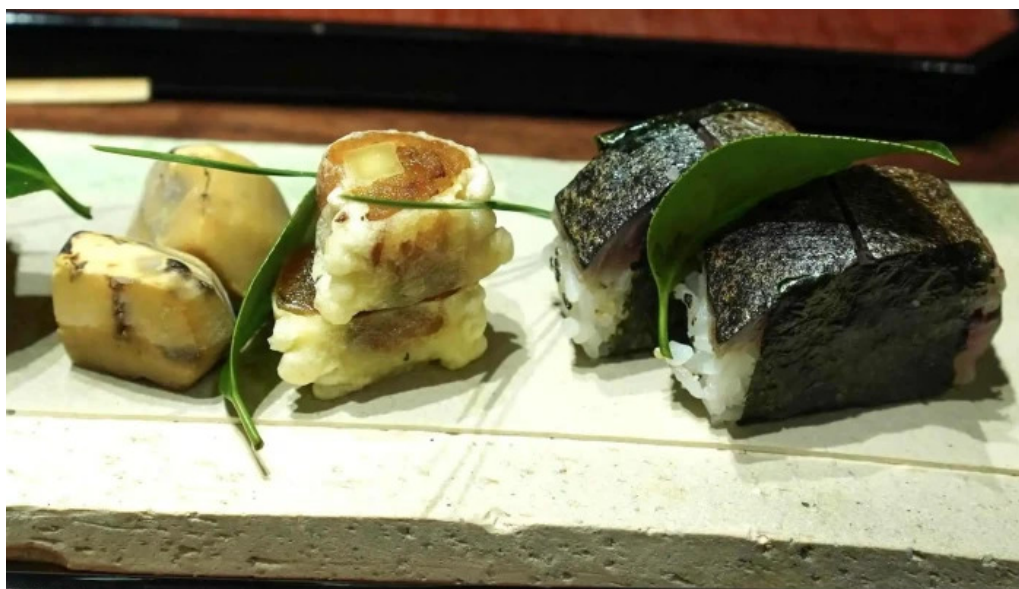
竜湖畔 壹傳 電話