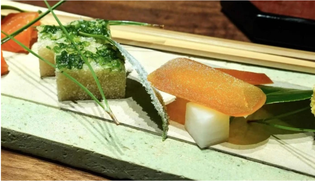
竜湖畔 壹傳 営業時間