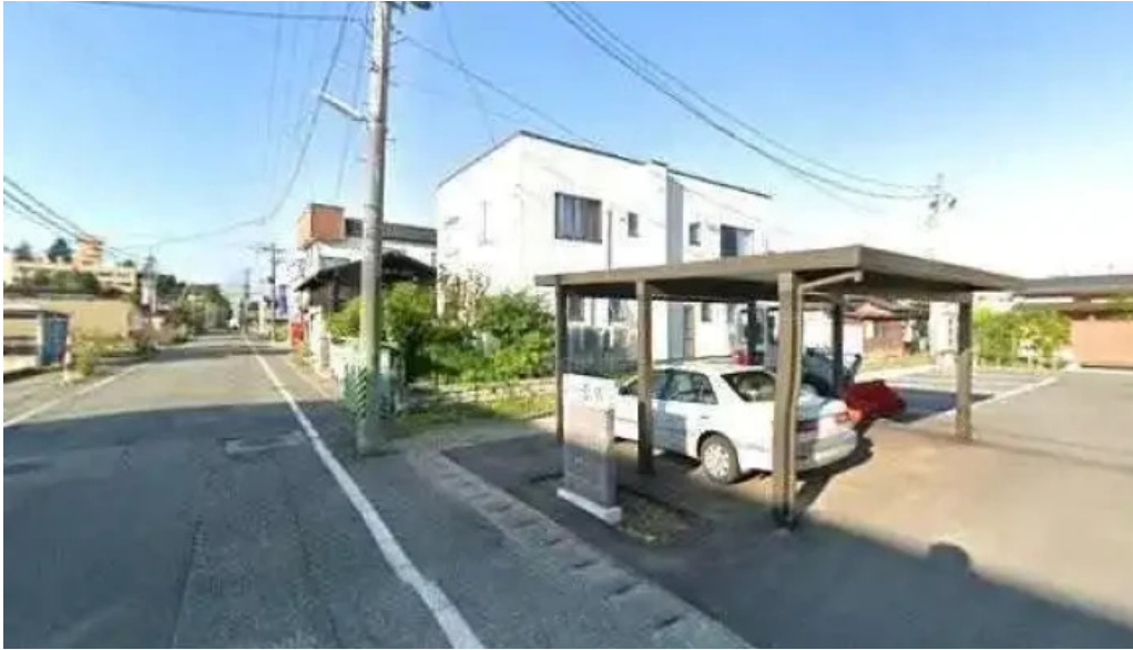
龍湖畔 壹傳 南陽市