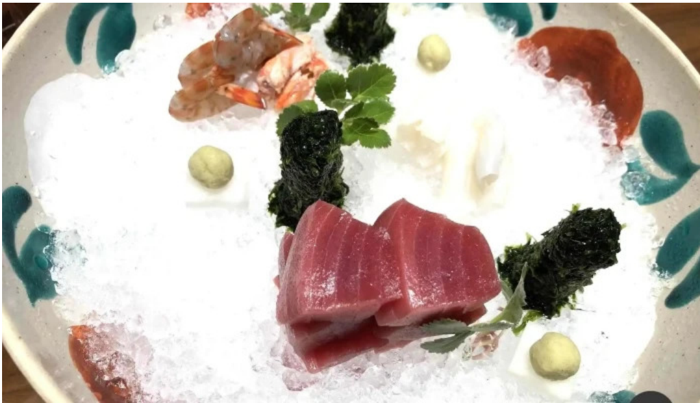
龍湖畔 壹傳 刺身