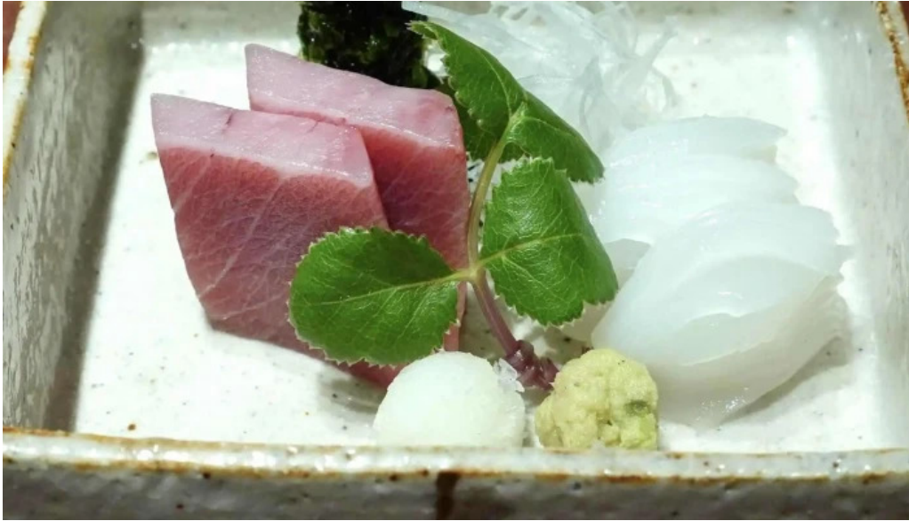
竜湖畔 壹傳 所在地