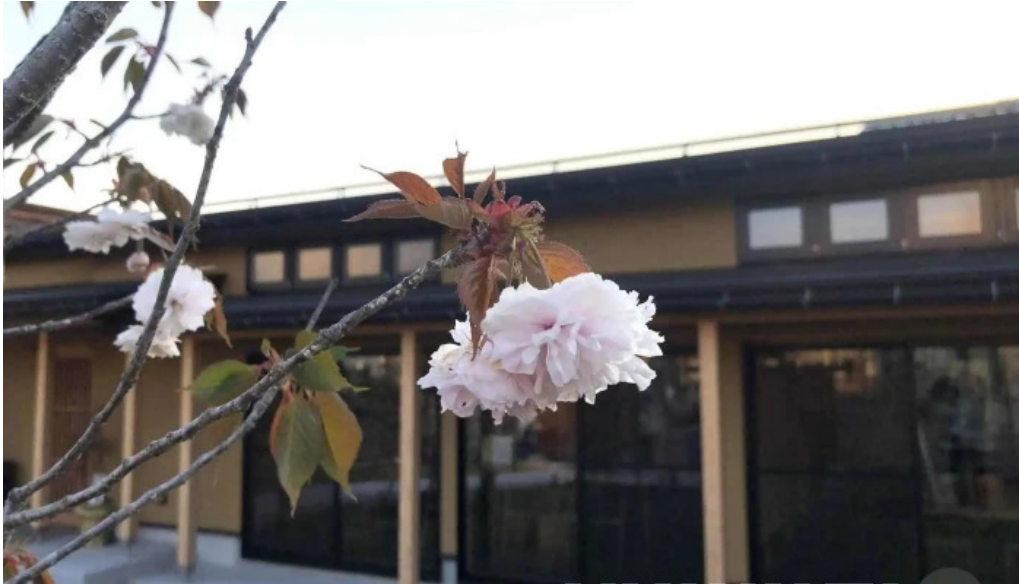
竜湖畔 壹傳