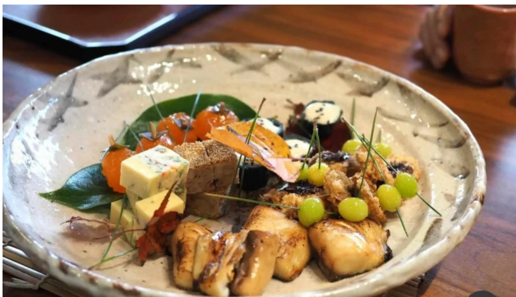
竜湖畔 壹傳 料理飲み物