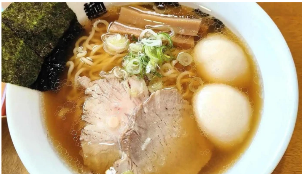
竜湖畔 壹傳 最新