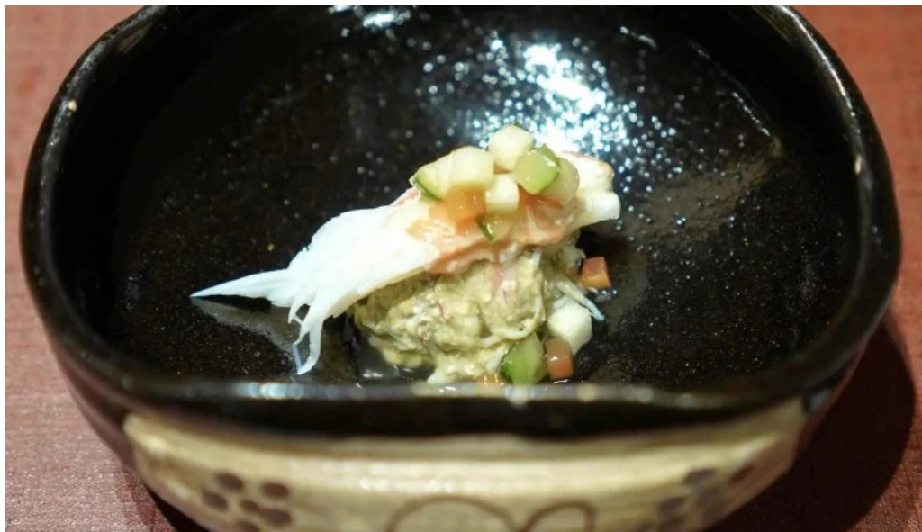
竜湖畔 壹傳 カタログ