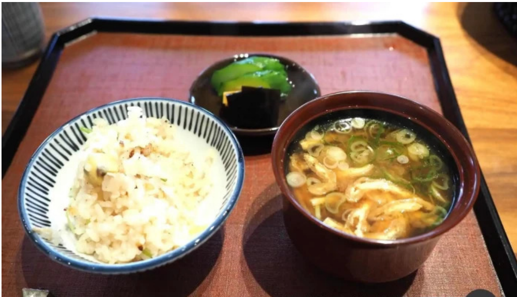
竜湖畔 壹傳 味噌汁