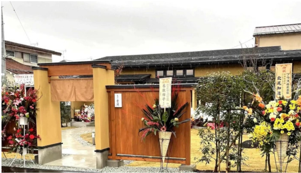
竜湖畔 壹傳 スコア