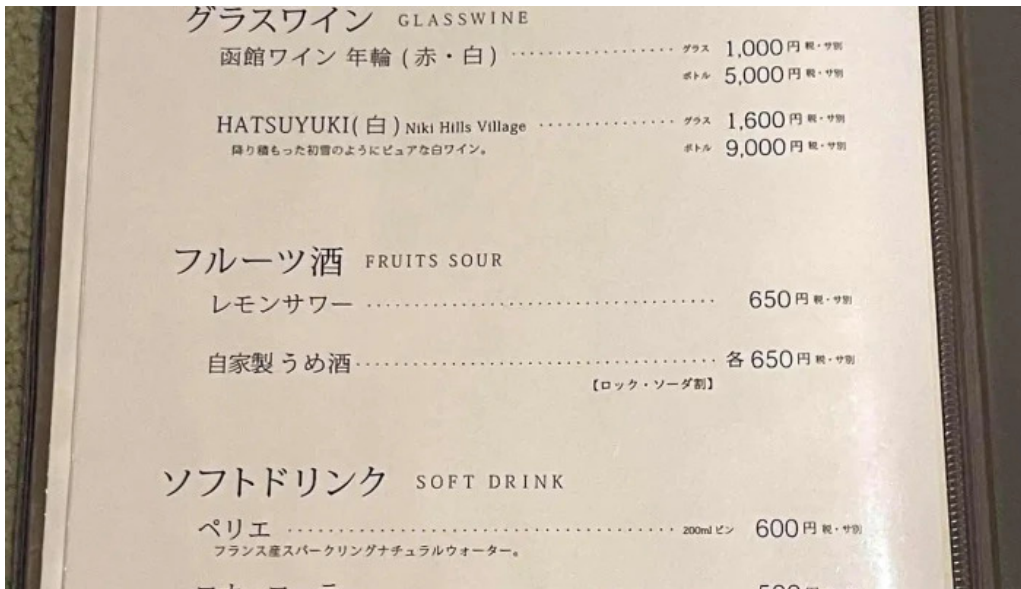
料亭富茂登 メニュー