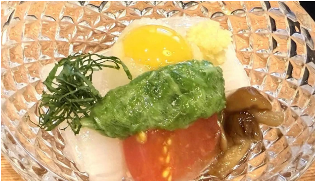
料亭富茂登 ウェブサイト