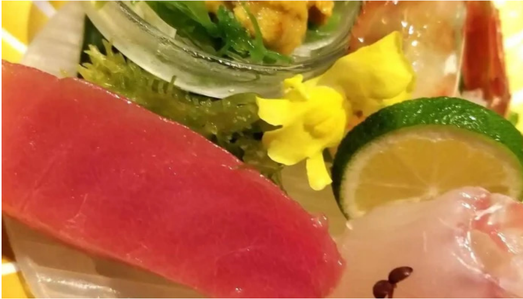
料亭富茂登 シーフード