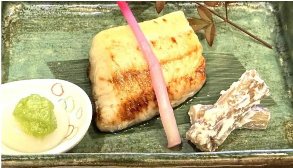
料亭富茂登 スコア