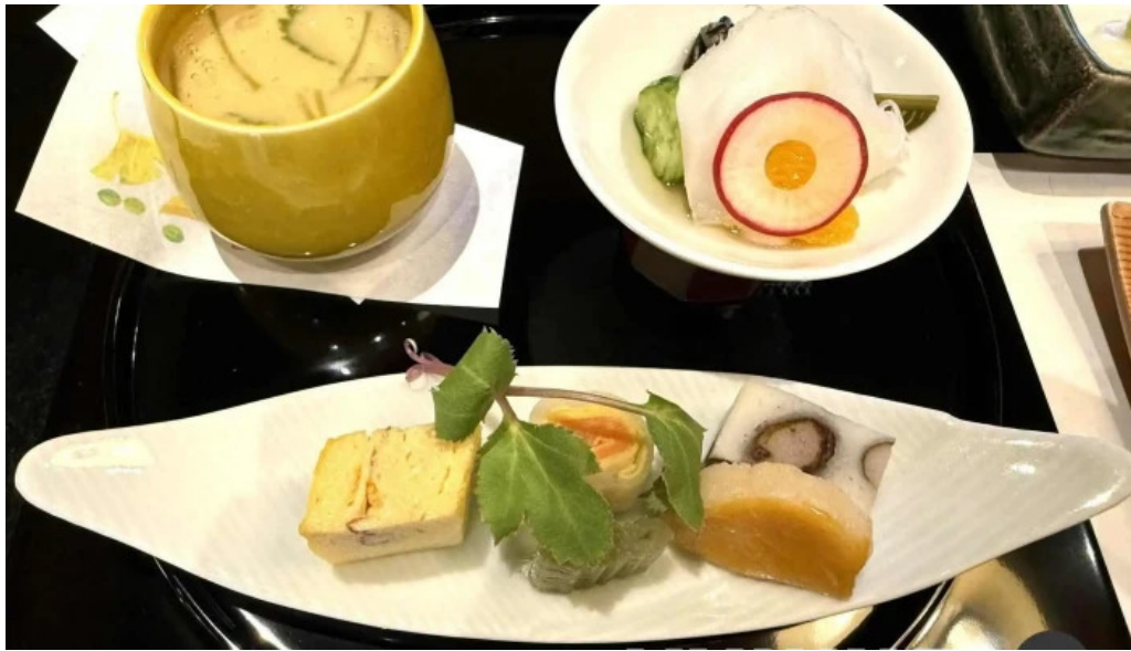
料亭富茂登 スープ