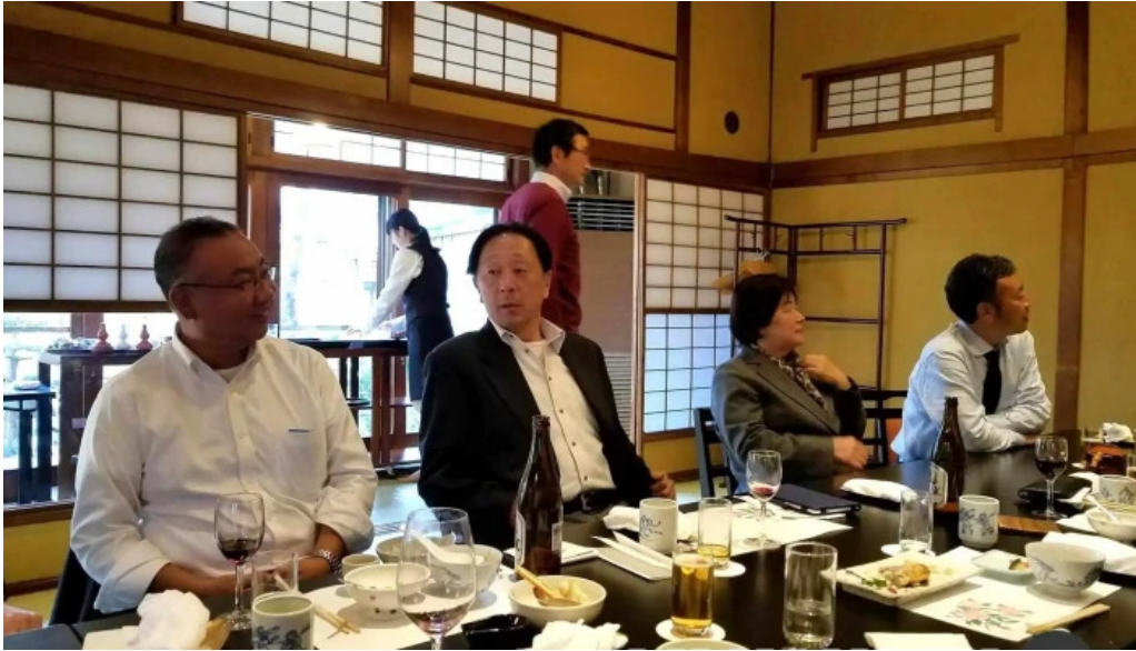
料亭富茂登 雰囲気