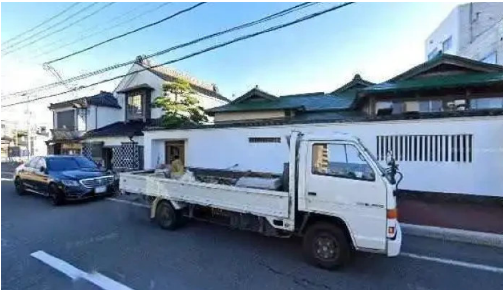
料亭富茂登 函館市