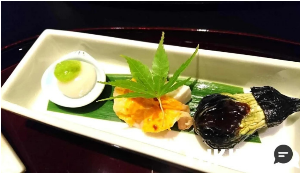
料亭富茂登 料理飲み物