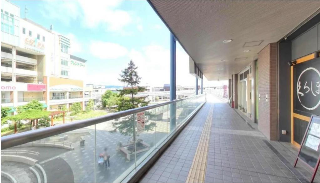
食育の店 旬菜魚 くらしま 長岡京市