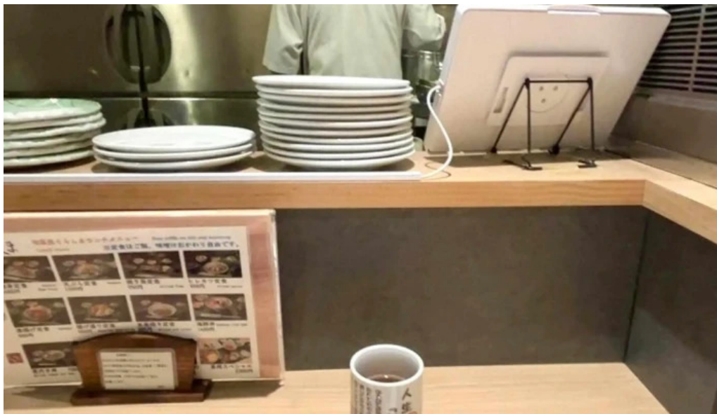
食育の店 旬菜魚 くらしま プロモーション