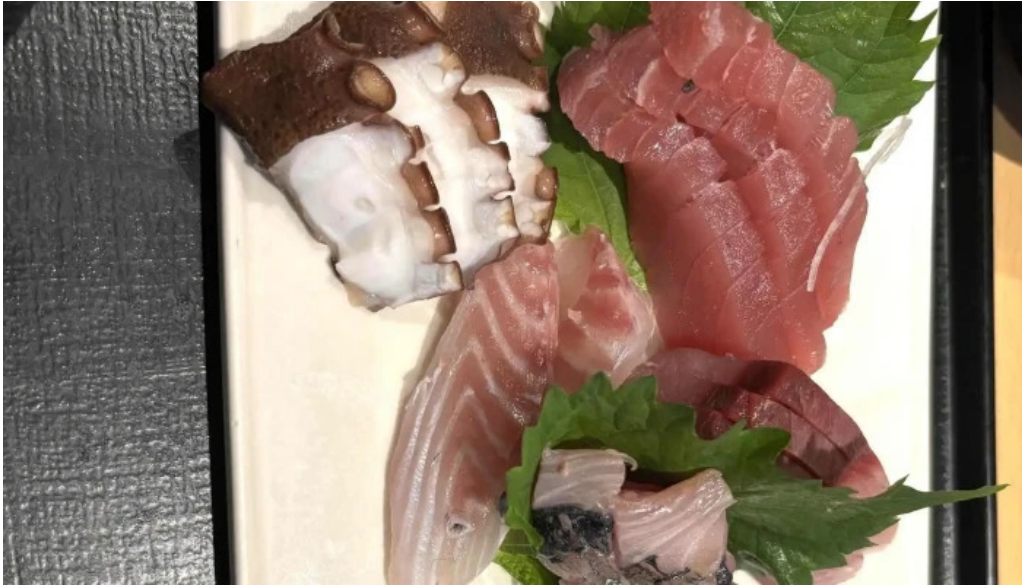
食育の店 旬菜魚 くらしま 動画