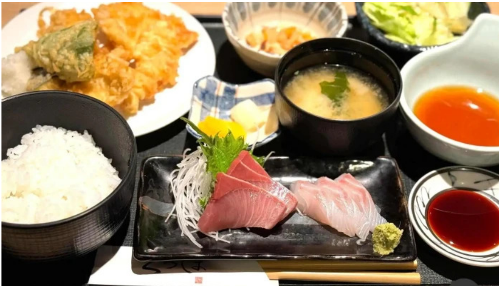
食育の店 旬菜魚 くらしま 刺身