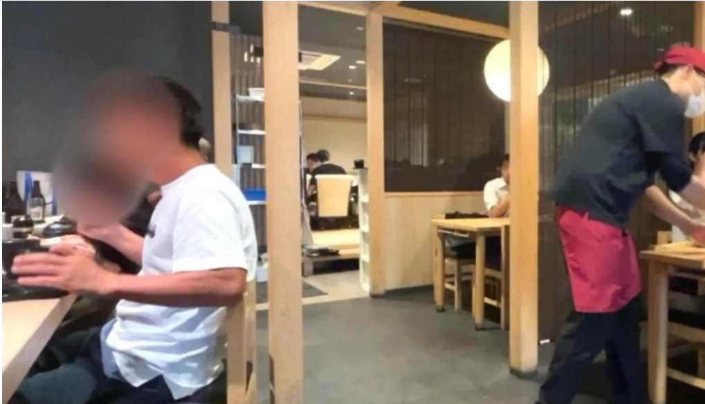
食育の店 旬菜魚 くらしま instagram