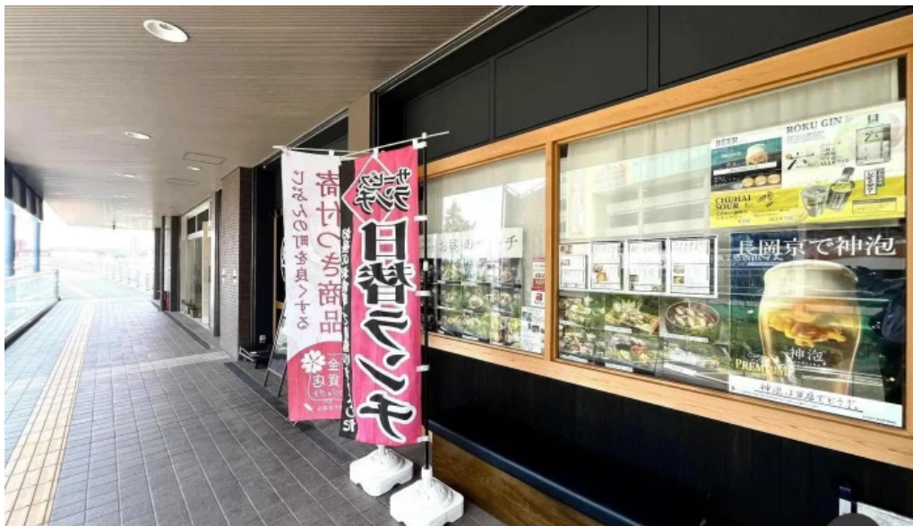
食育の店 旬菜魚 くらしま 雰囲気