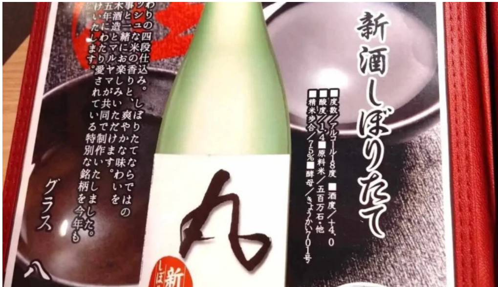
食育の店 旬菜魚 くらしま メニュー