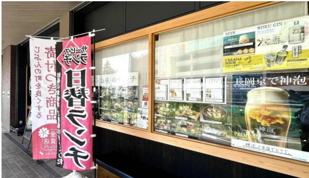
食育の店 旬菜魚 くらしま 料金