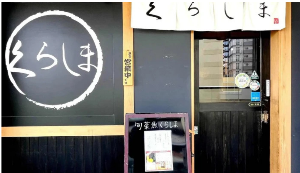
食育の店 旬菜魚 くらしま コメント