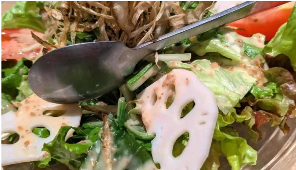
食育の店 旬菜魚 くらしま 料理飲み物