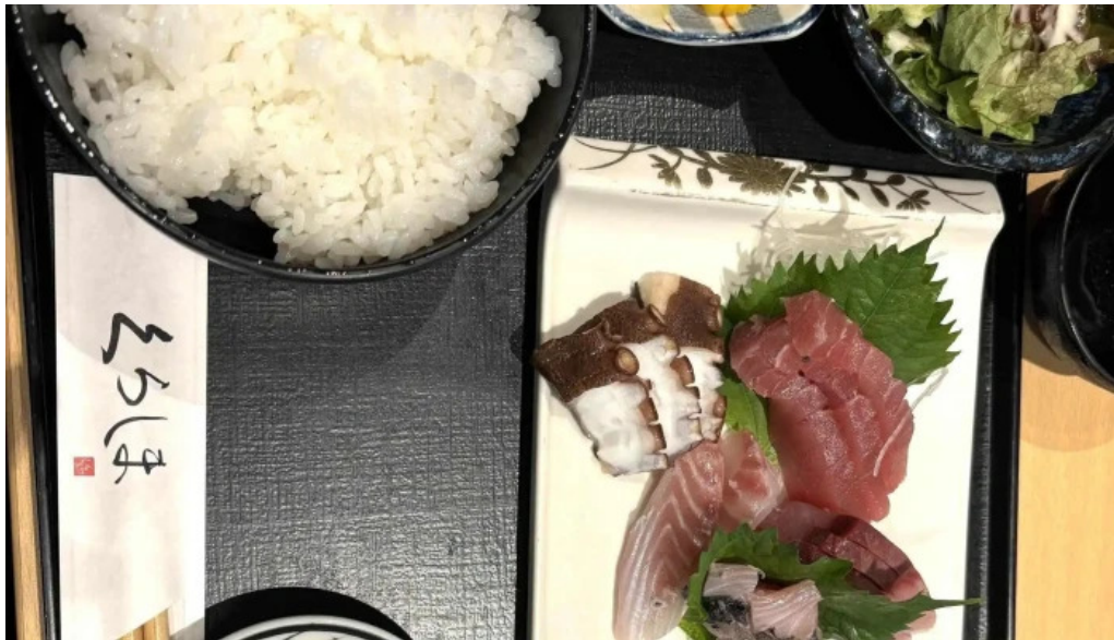
食育の店 旬菜魚 くらしま スコア