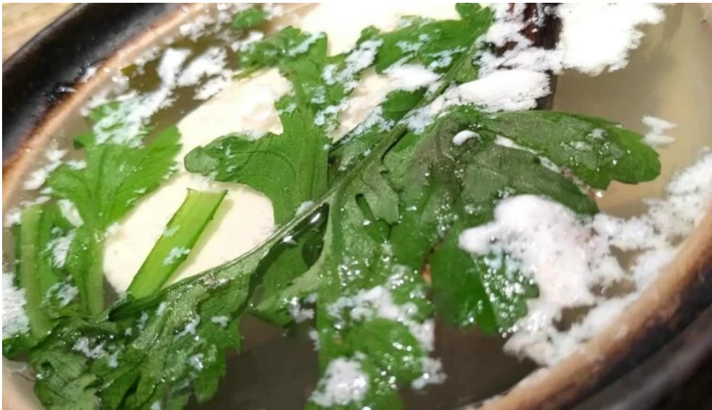
食育の店 旬菜魚 くらしま 最新