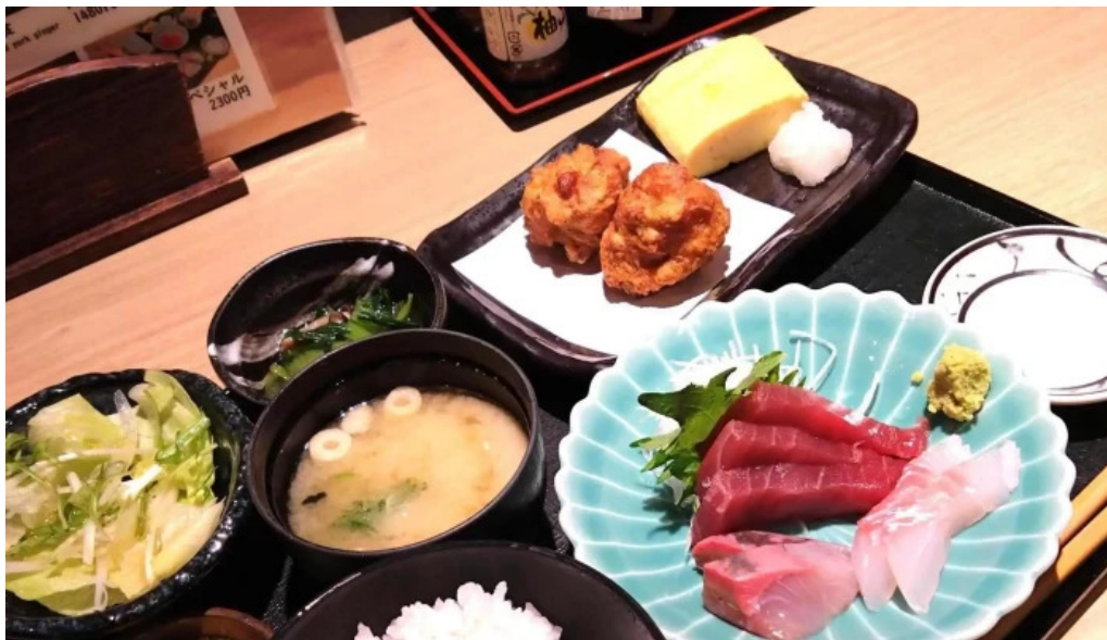
食育の店 旬菜魚 くらしま 口コミ