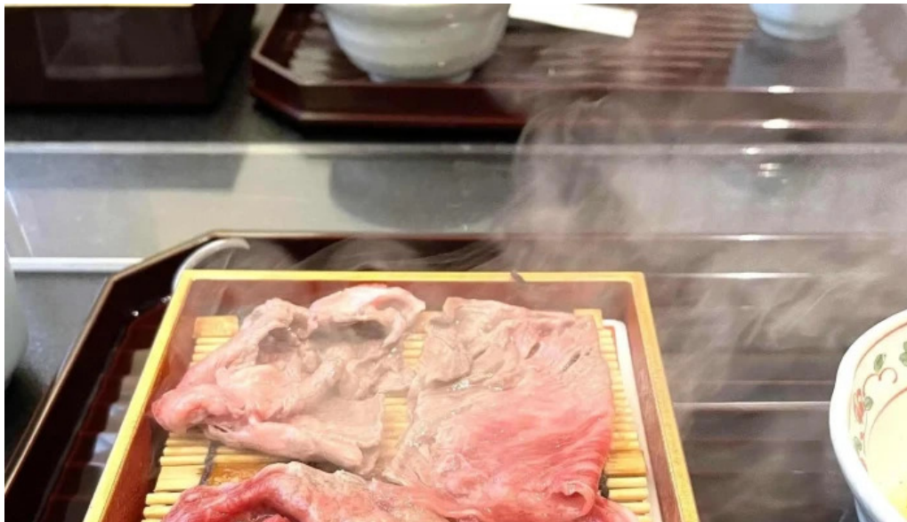
いっづく亭 光明寺門前店 営業中