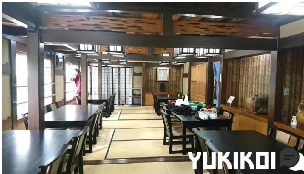
いっぷく亭 光明寺門前店 雰囲気