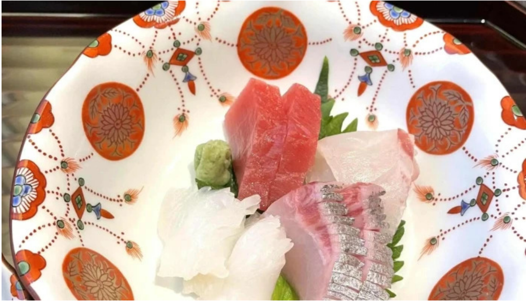
いっぶく亭 光明寺門前店 口コミ