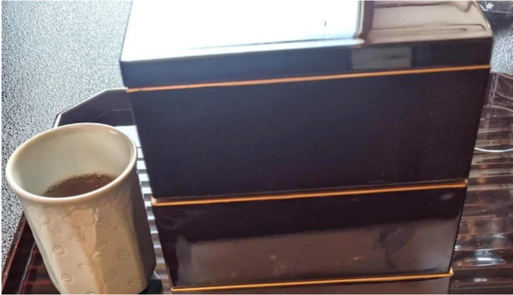
いっぽく亭 光明寺門前店 エリア