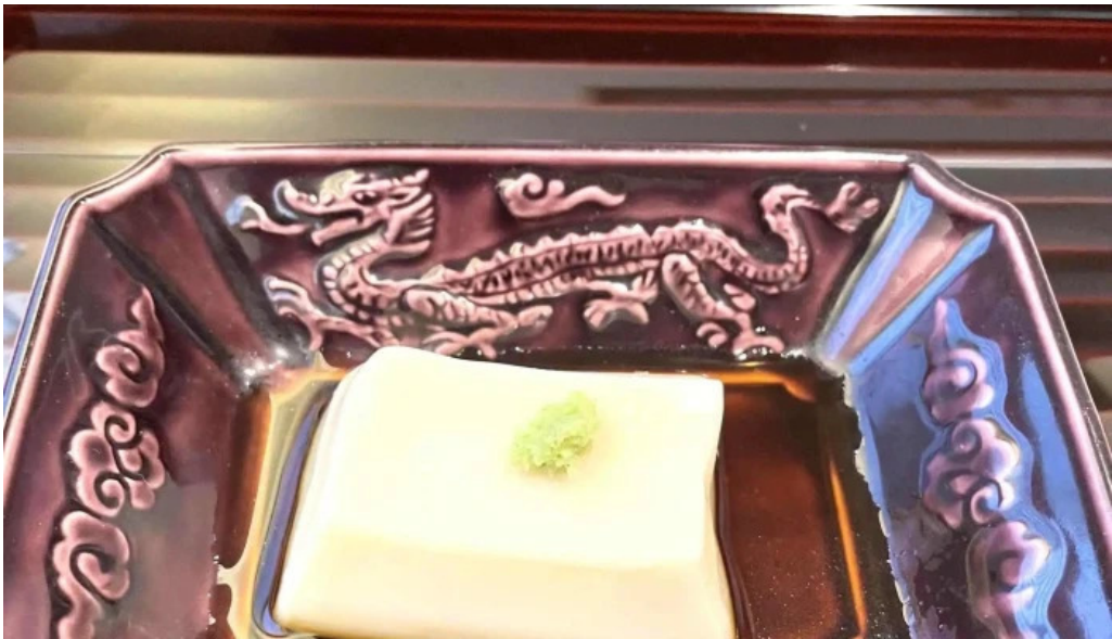
いっぶく亭 光明寺門前店 写真