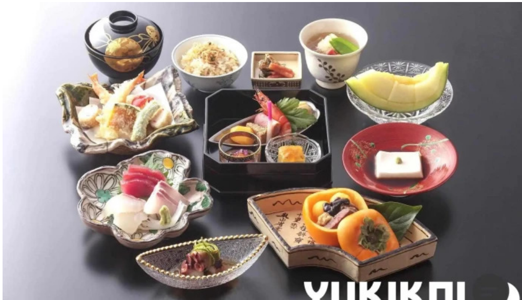
いっづく亭 光明寺門前店 懐石