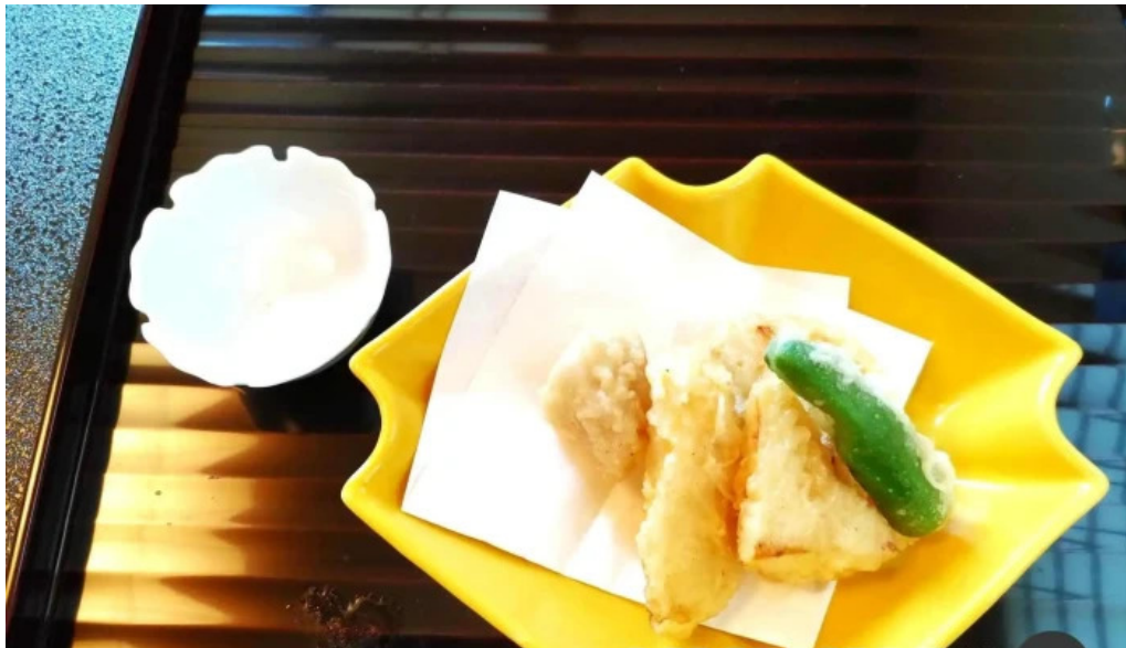
いっづく亭 光明寺門前店 天ぷら