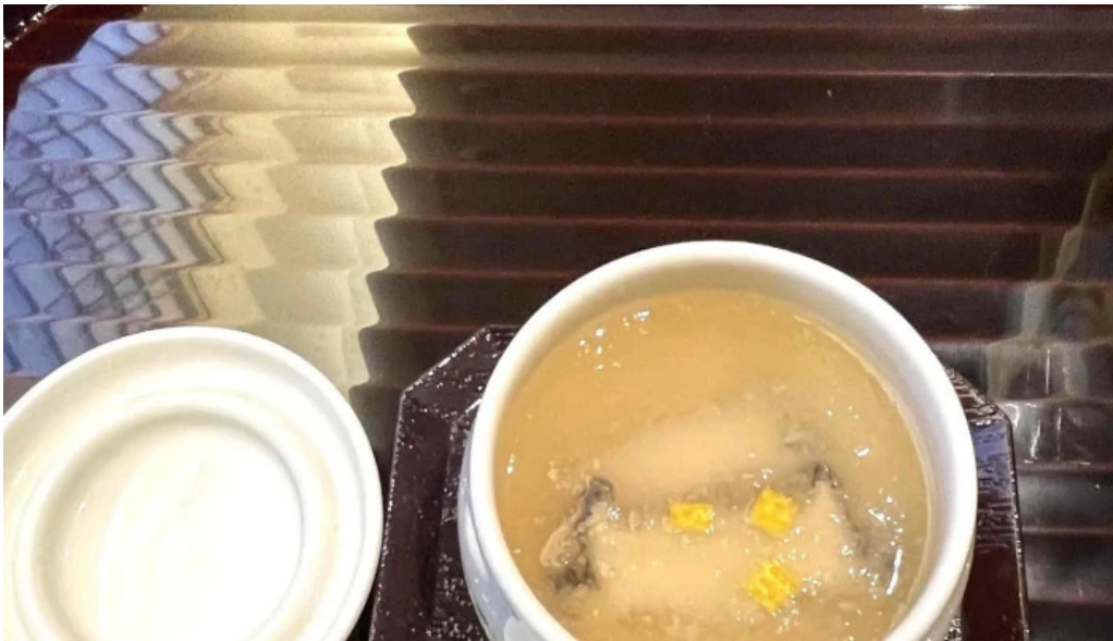
いっぶく亭 光明寺門前店 番号