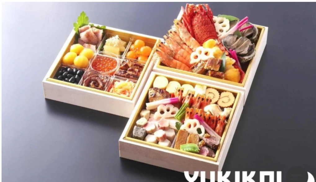
いっぶく亭 光明寺門前店 料理飲み物