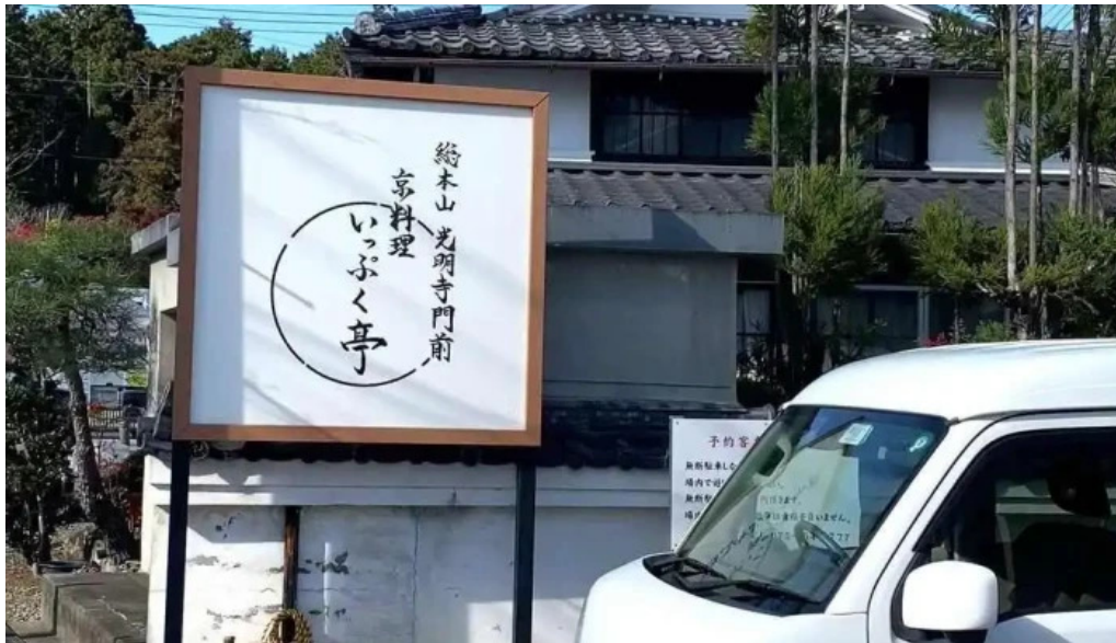
いっぶく亭 光明寺門前店 最新