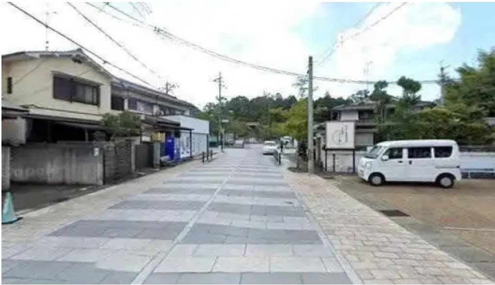
いっぶく亭 光明寺門前店 長岡京市