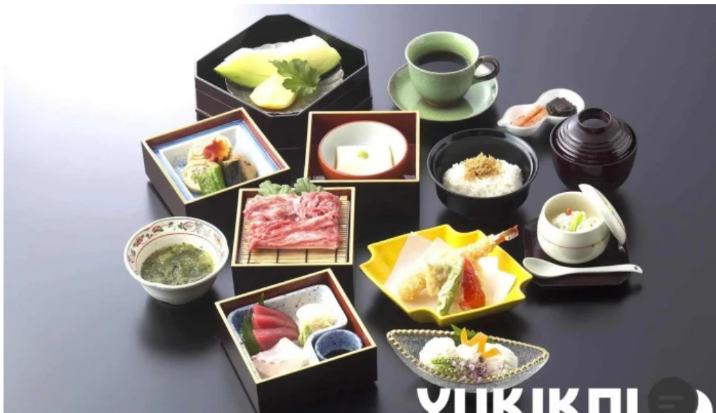
いっぽく亭 光明寺門前店