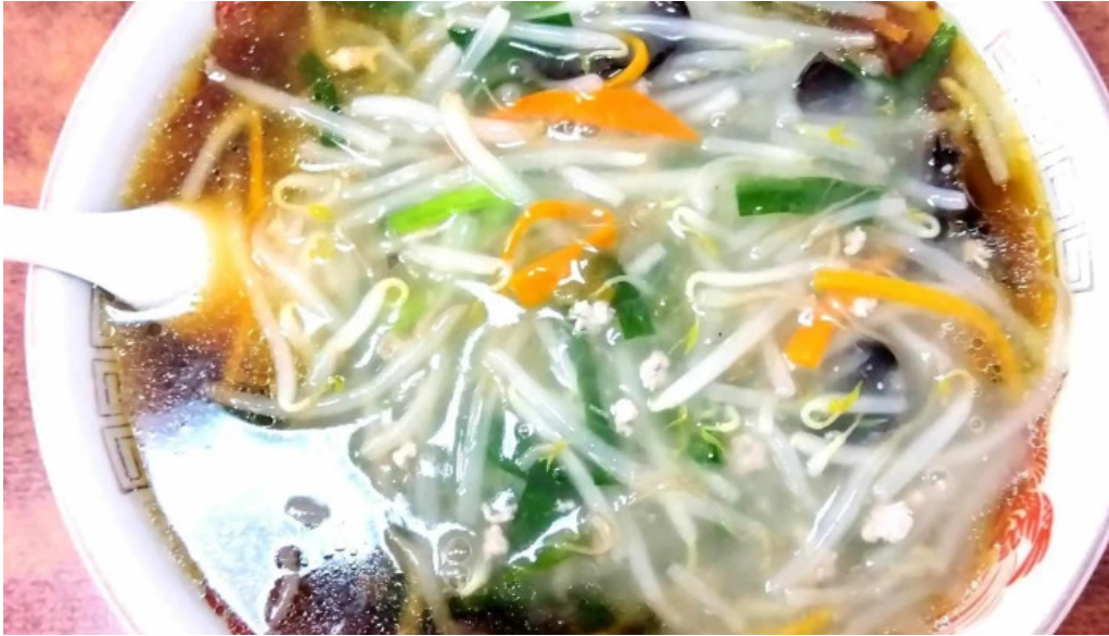
白龍 プロモーション