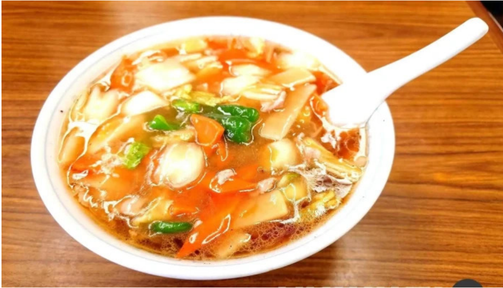
天心楼 料理飲み物