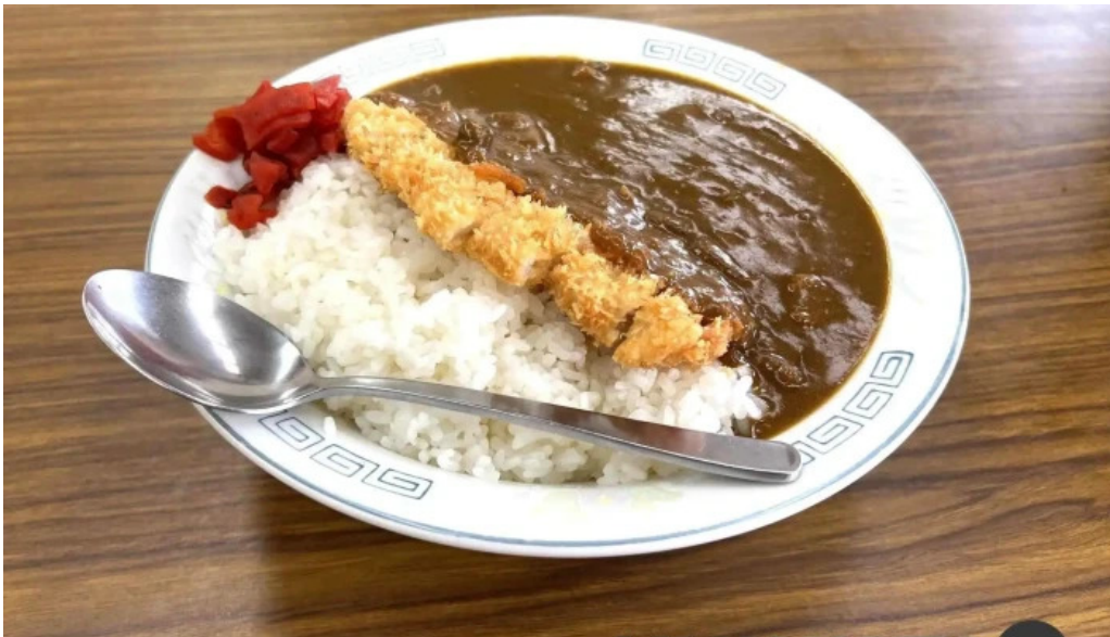
天心楼 日本のカレー