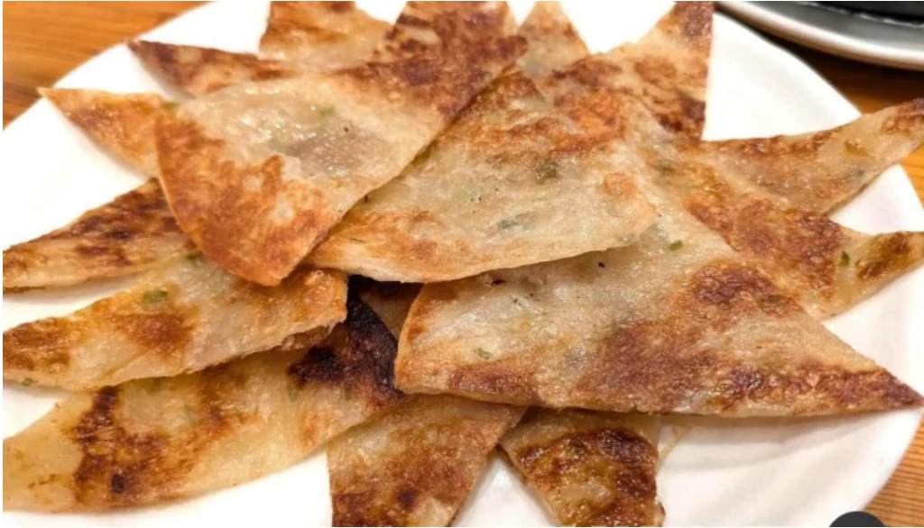
元祥 野田店 最新