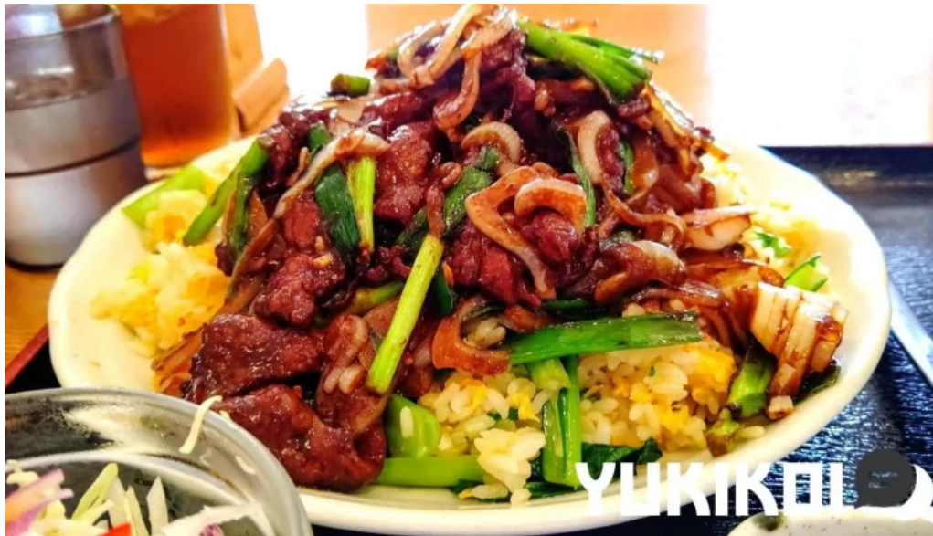
元祥 野田店 モンゴリアンビーフ