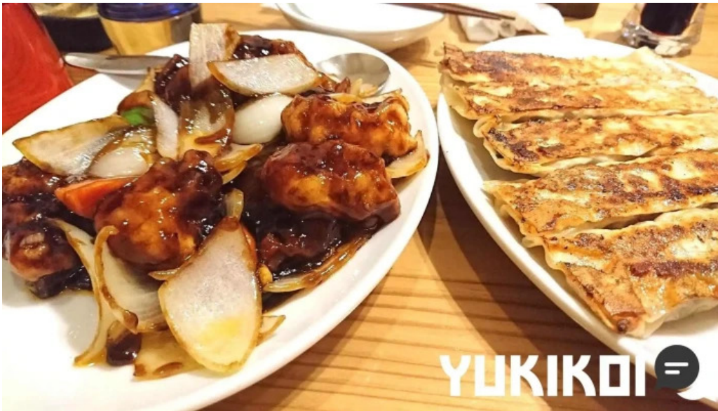
元祥 野田店 料理飲み物