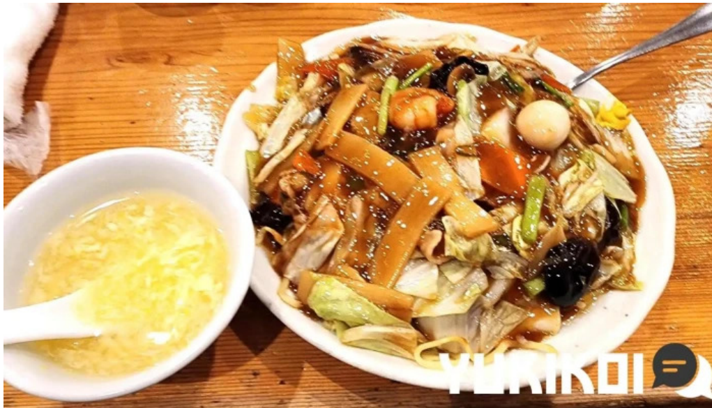
元祥 野田店 スープ