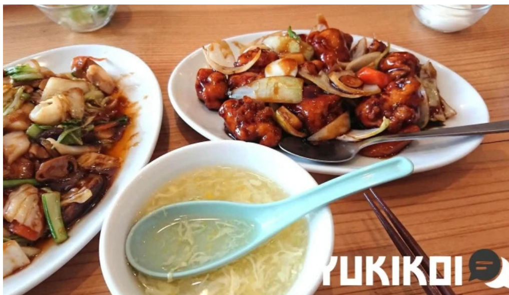
元祥 野田店 麺