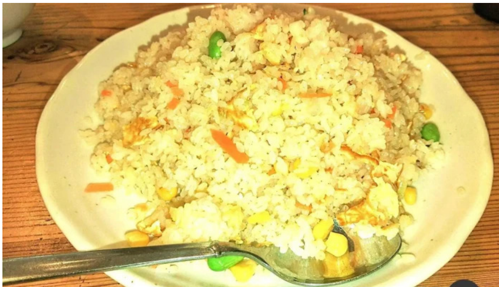
元祥 野田店 焼き飯