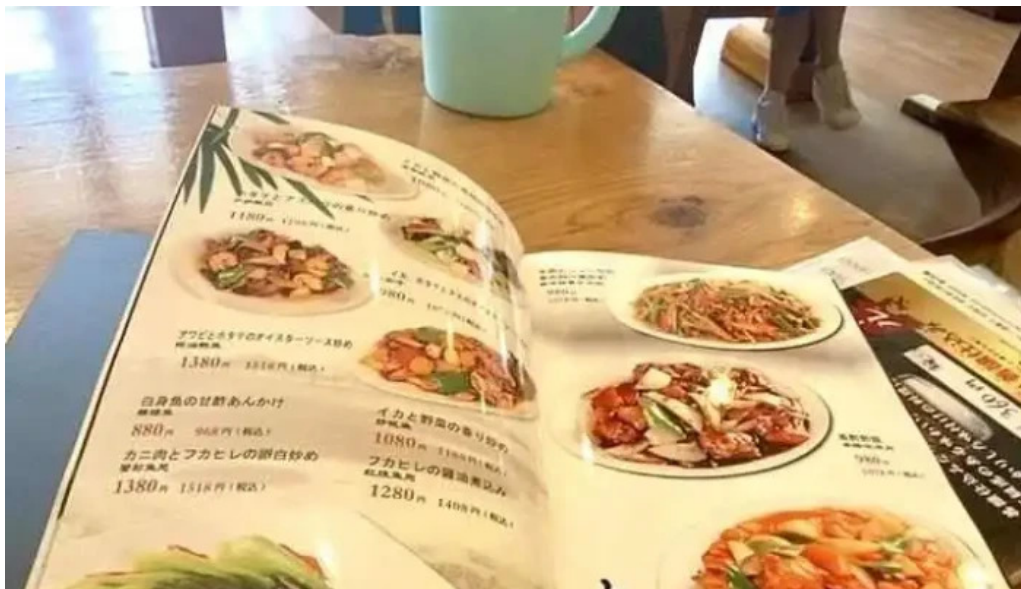
元祥 野田店 メニュー