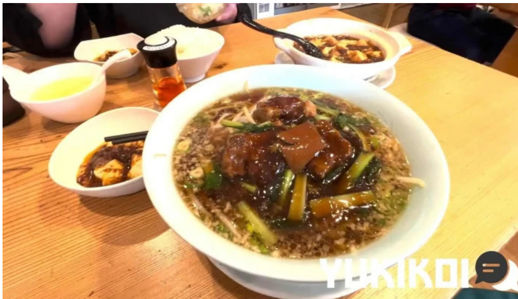
元祥 野田店 動画