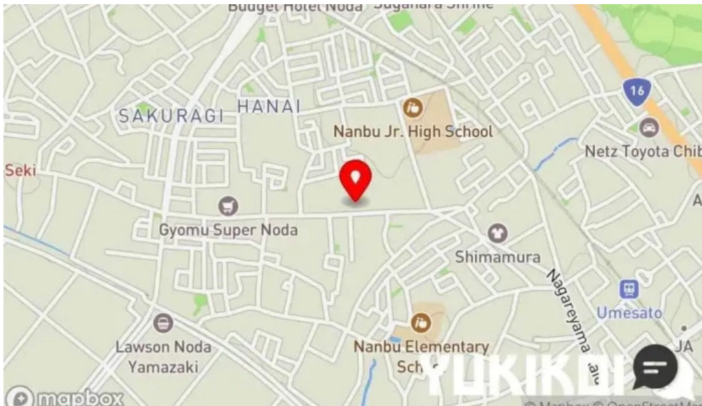
元祥 野田店 地図