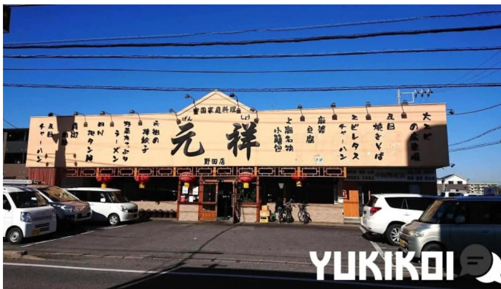
元祥 野田店 野田市