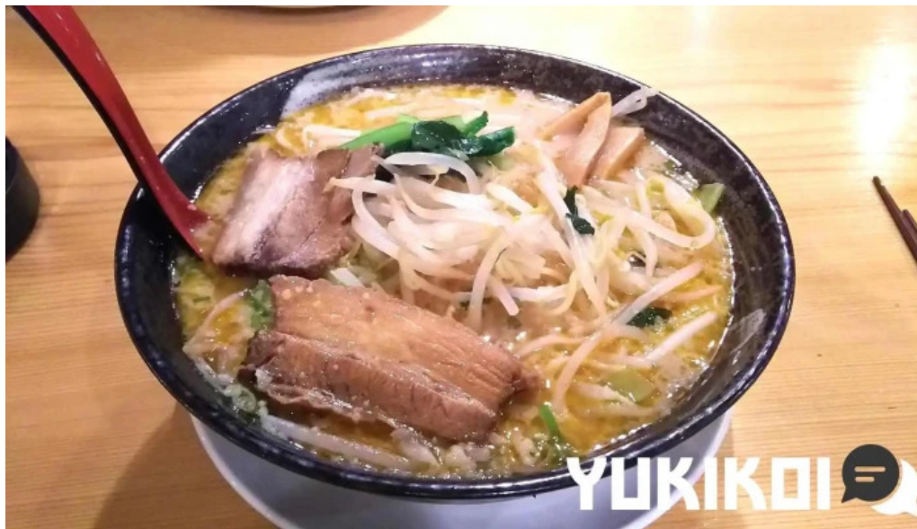
元祥 野田店 ラーメン