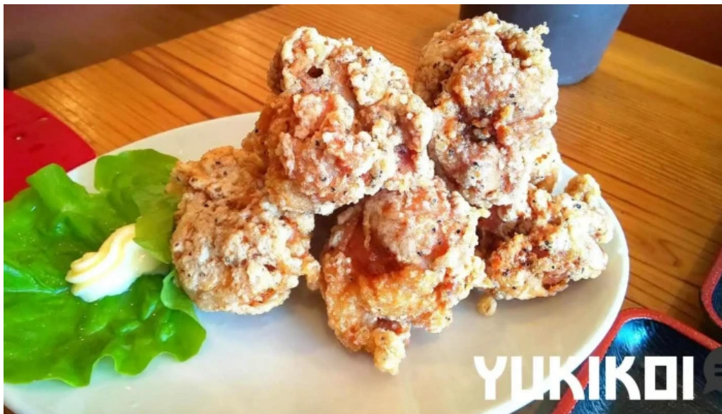
元祥 野田店 から揚げ