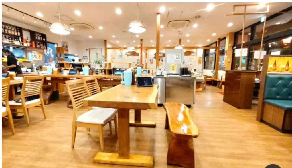
元祥 野田店 雰囲気