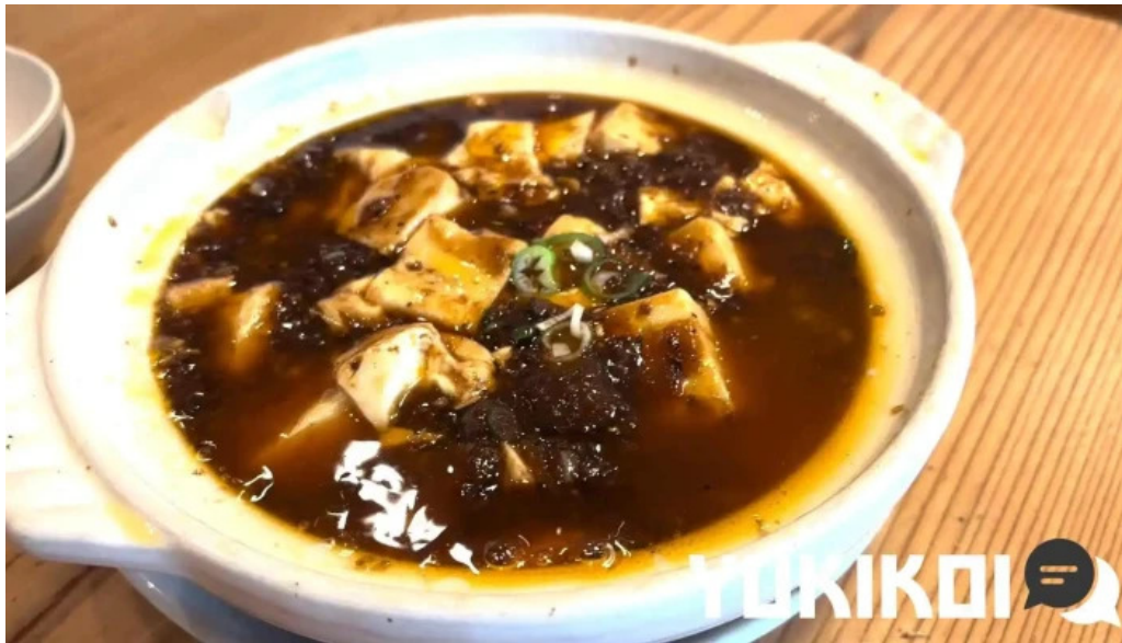
元祥 野田店 酸辣湯