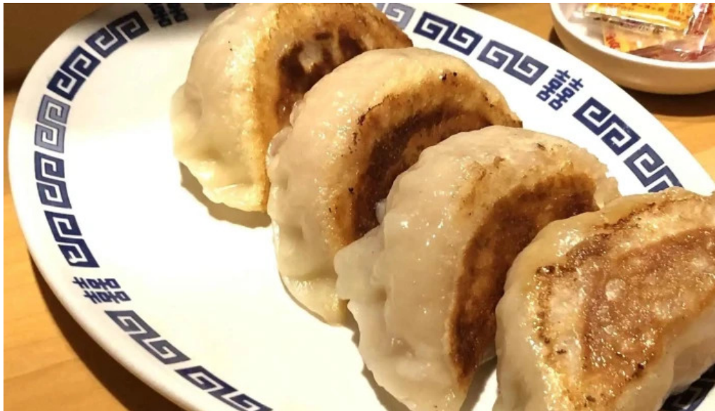
中華工房 菜華 ダンプリング