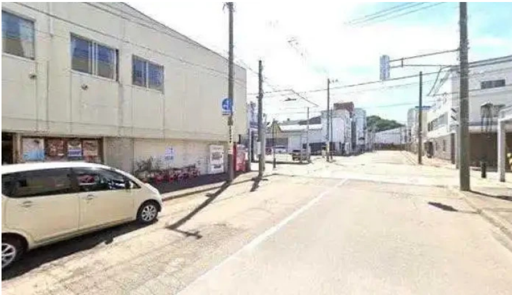
中華工房 菜華 ストリートビューと 360 ビュー