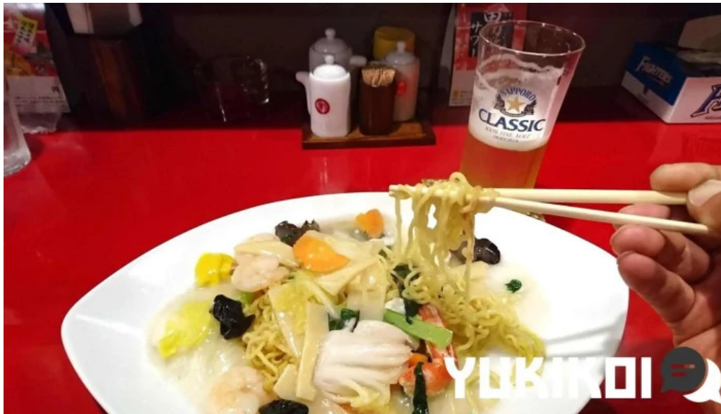
中華工房 菜華 麵