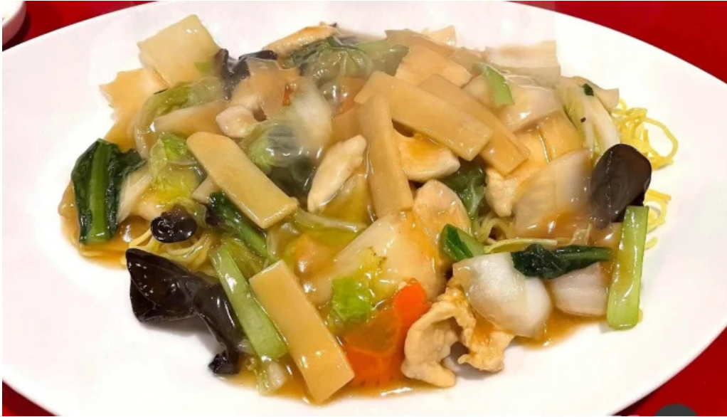
中華工房 菜華 料理飲み物