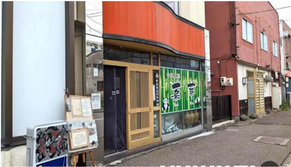
中華工房 菜華 網走市