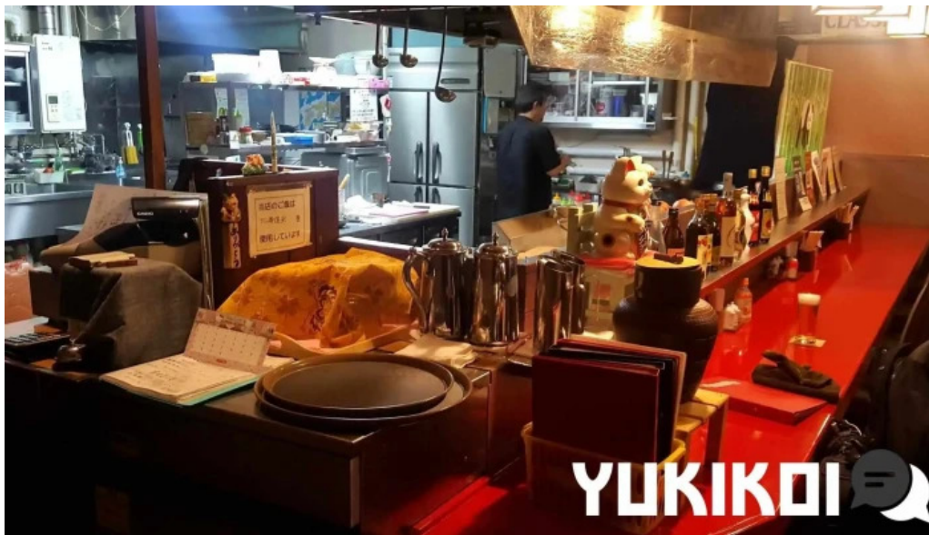
中華工房 菜華 霧囿氣