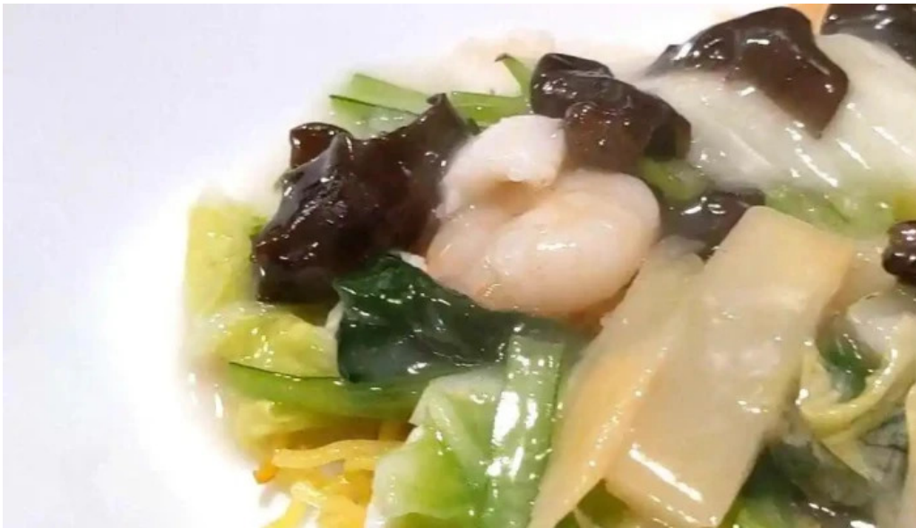
中華工房 菜華 動画