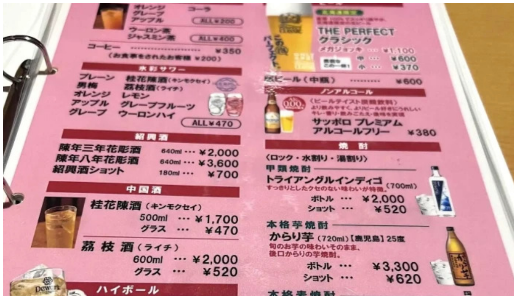
中華工房 菜華 comentario 2