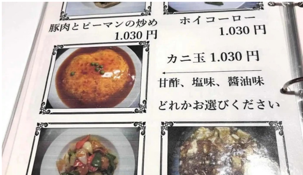
中華工房 菜華 メニュー