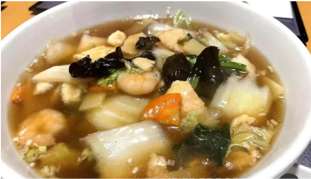
中華工房 菜華 スープ