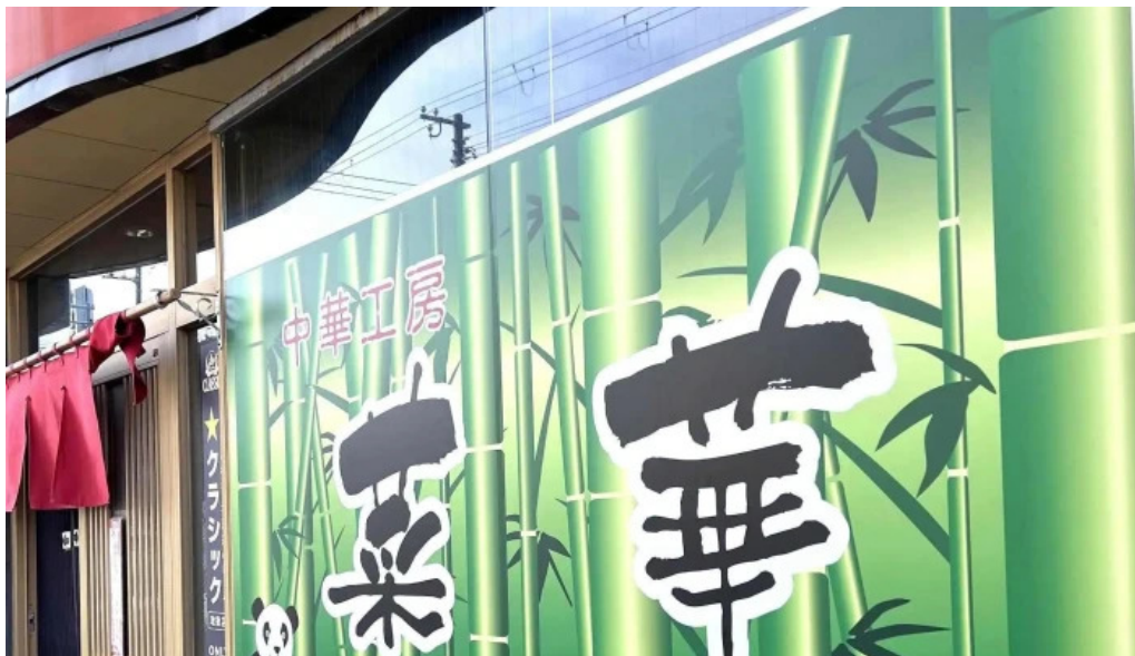
中華工房 菜華 comentario 1