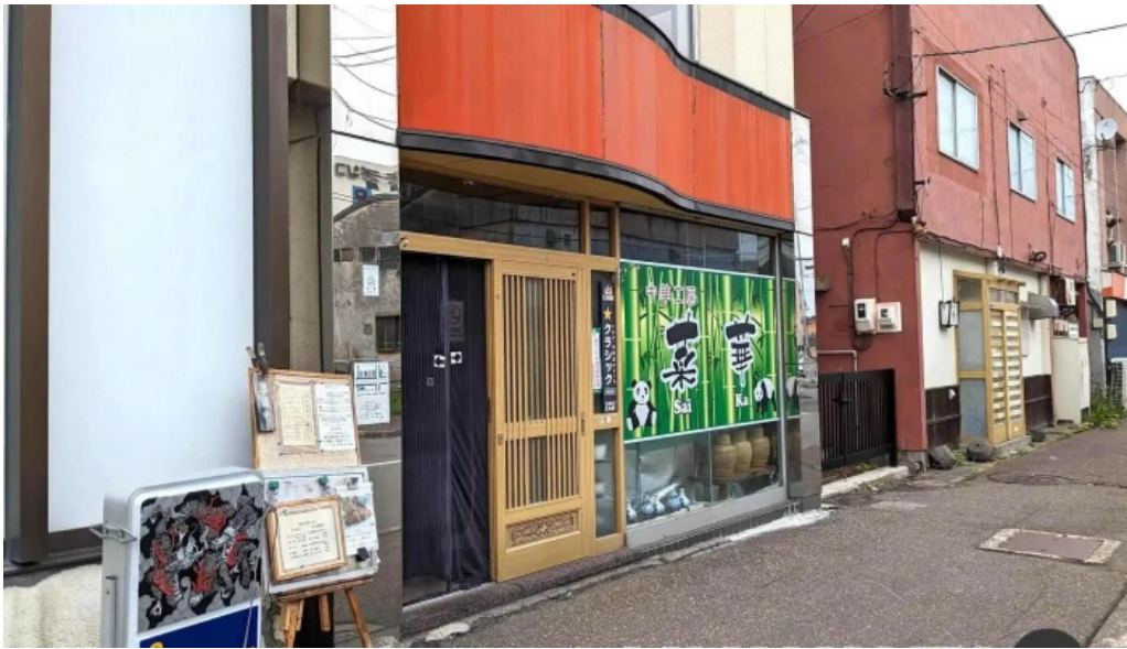
中華工房 菜華 すべて