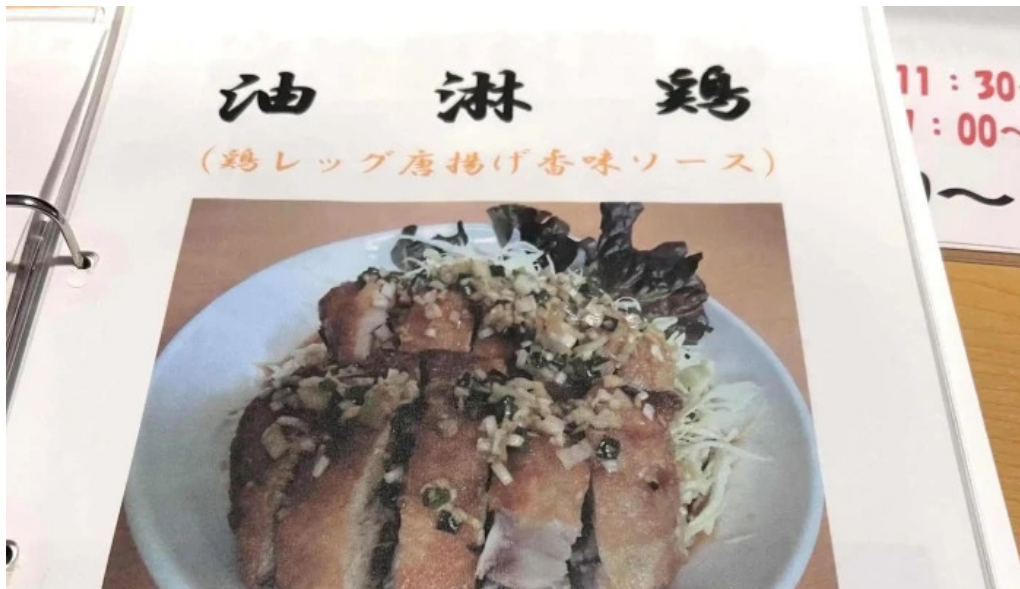
中華工房 菜華 comentario 3