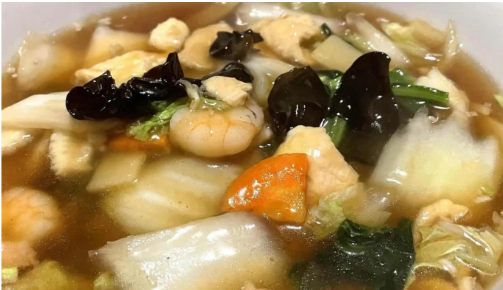
中華工房 菜華 comentario 5