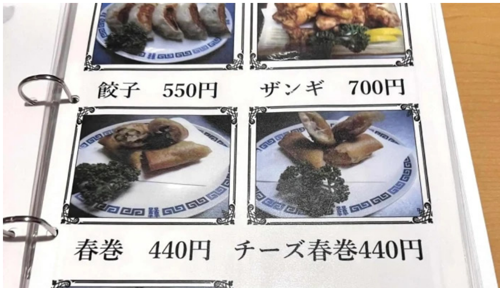
中華工房 菜華 comentario 4