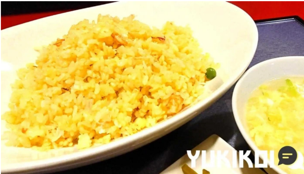
中華工房 菜華 焼き飯