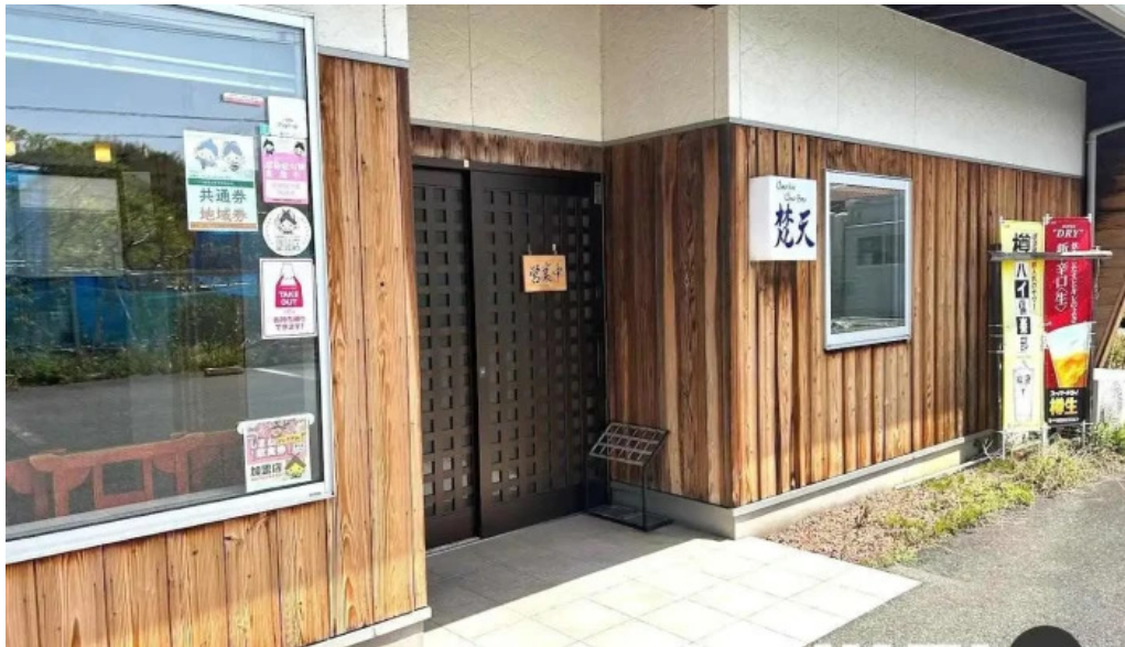
Chu ka chu bou 梵天 江津市