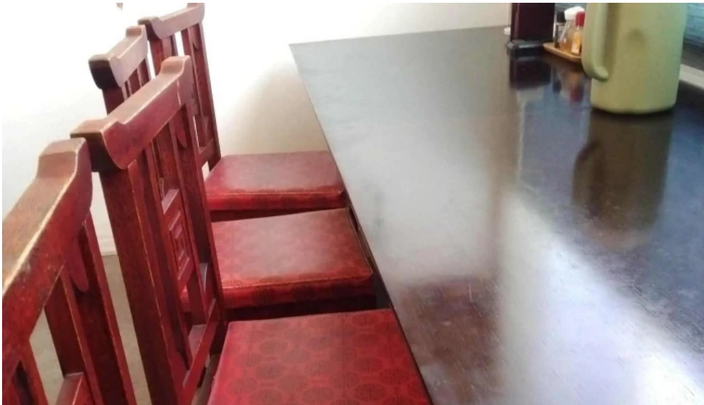
Chu ka chu bou 梵天 comentario 2