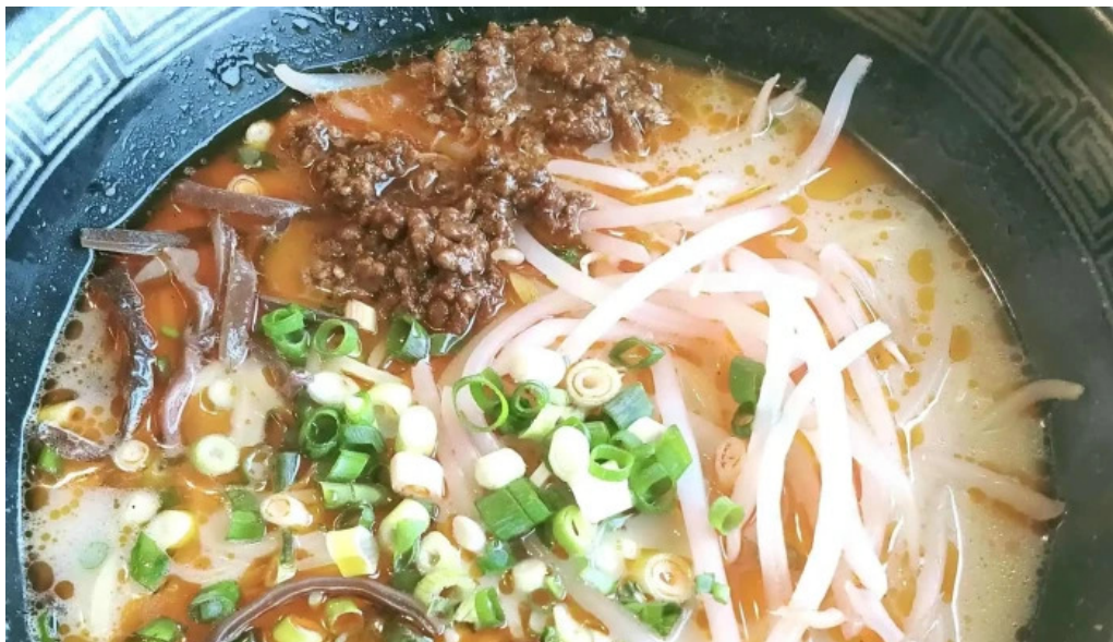
Chu ka chu bou 梵天 comentario 7