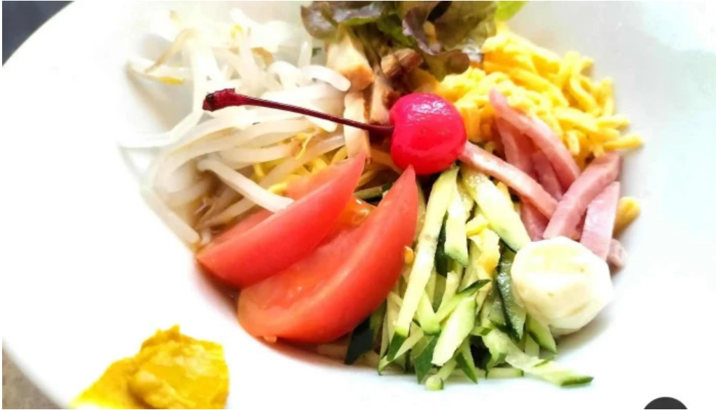
Chu ka chu bou 梵天 麵