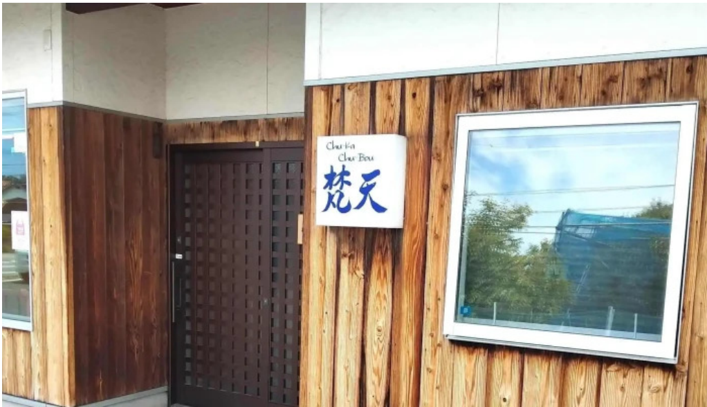
Chu ka chu bou 梵天 comentario 3