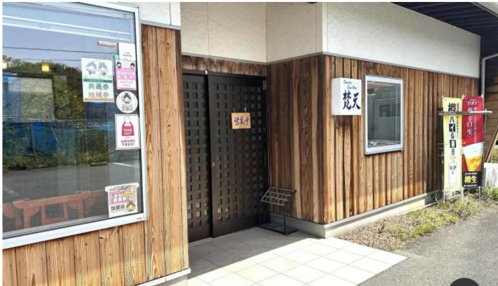
Chu ka chu bou 梵天 すべて