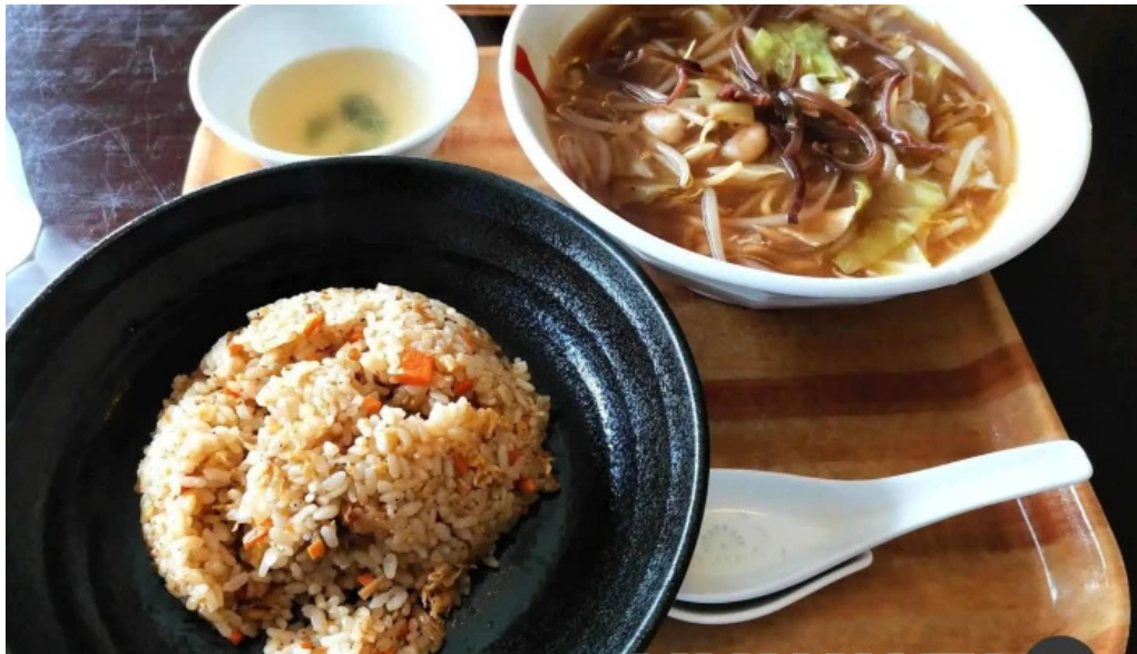
Chu ka chu bou 梵天 ラーメン