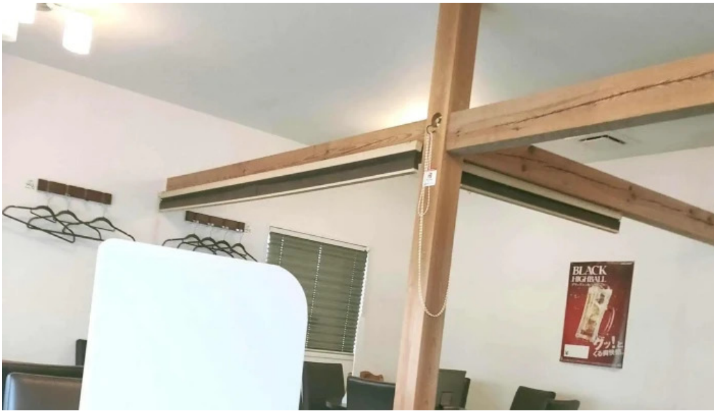
Chu ka chu bou 梵天 comentario 4