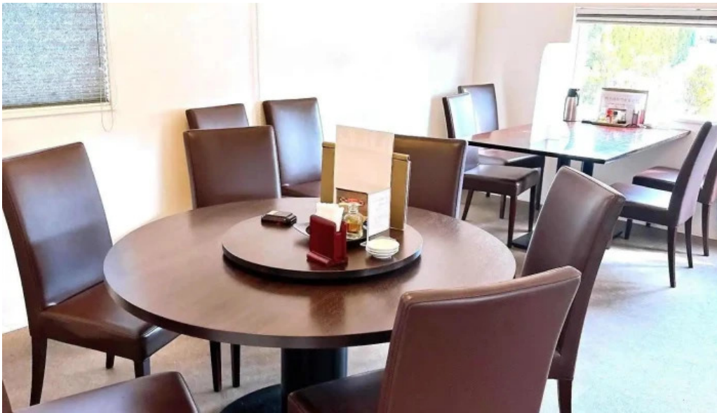
Chu ka chu bou 梵天 雰囲気