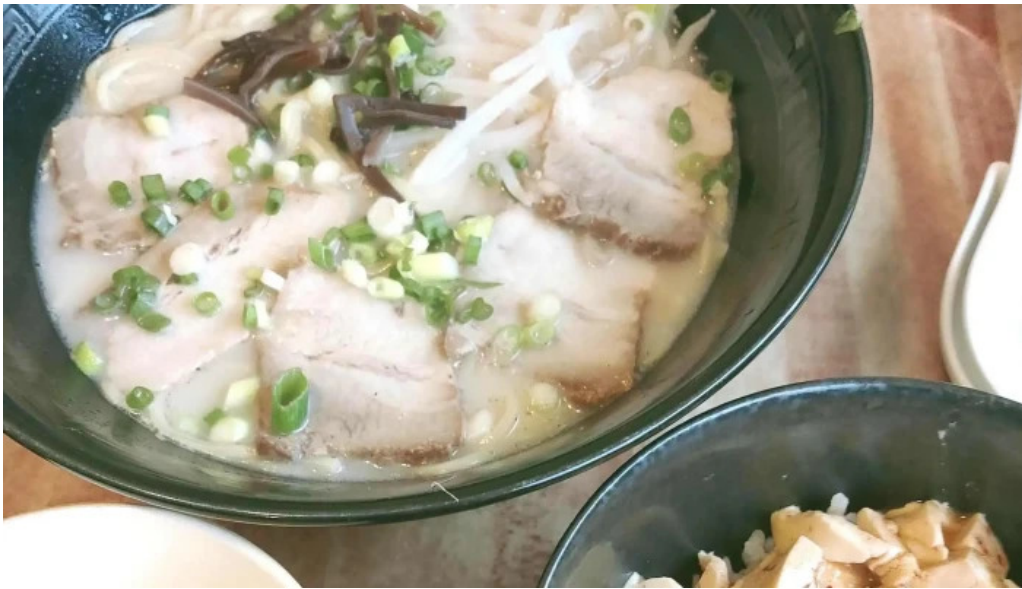
Chu ka chu bou 梵天 comentario 6