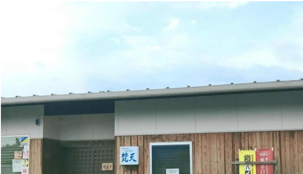
Chu ka chu bou 梵天 comentario 5