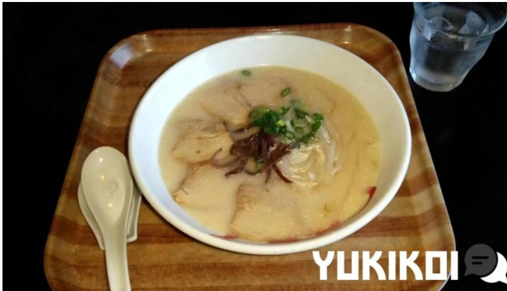
Chu ka chu bou 梵天 スープ