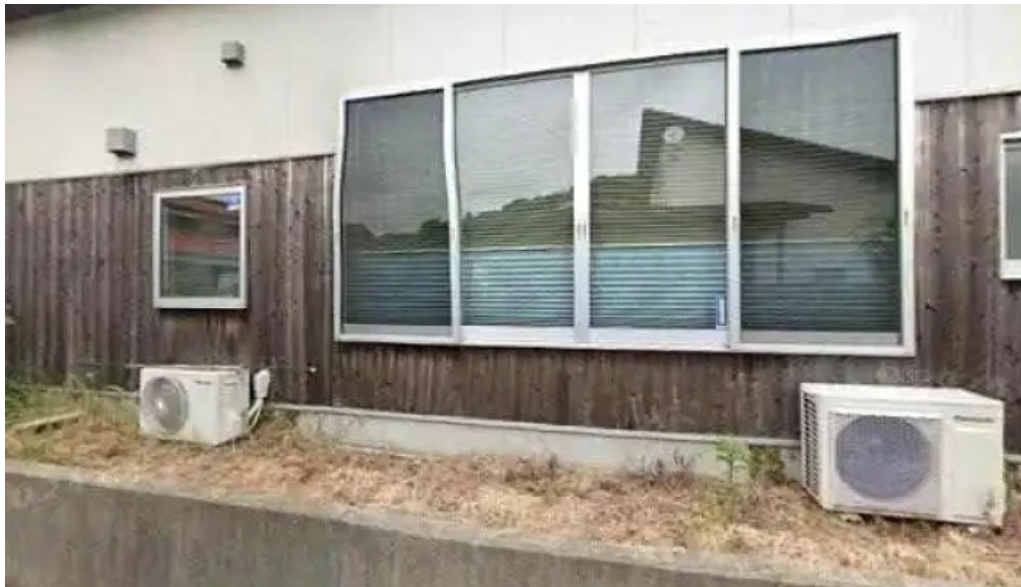
Chu ka chu bou 梵天 ストリートビューと 360 ビュー