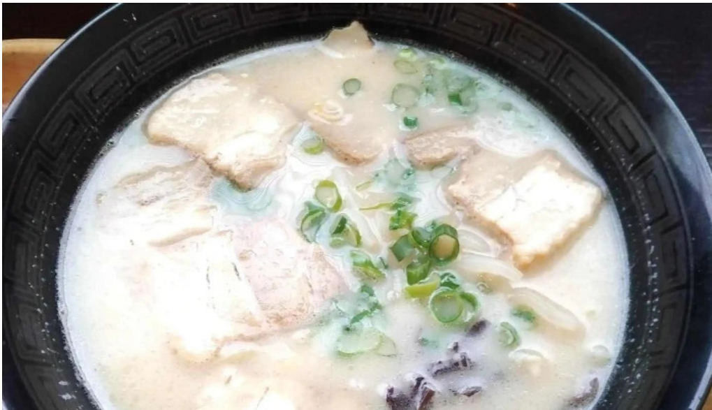
Chu ka chu bou 梵天 comentario 1