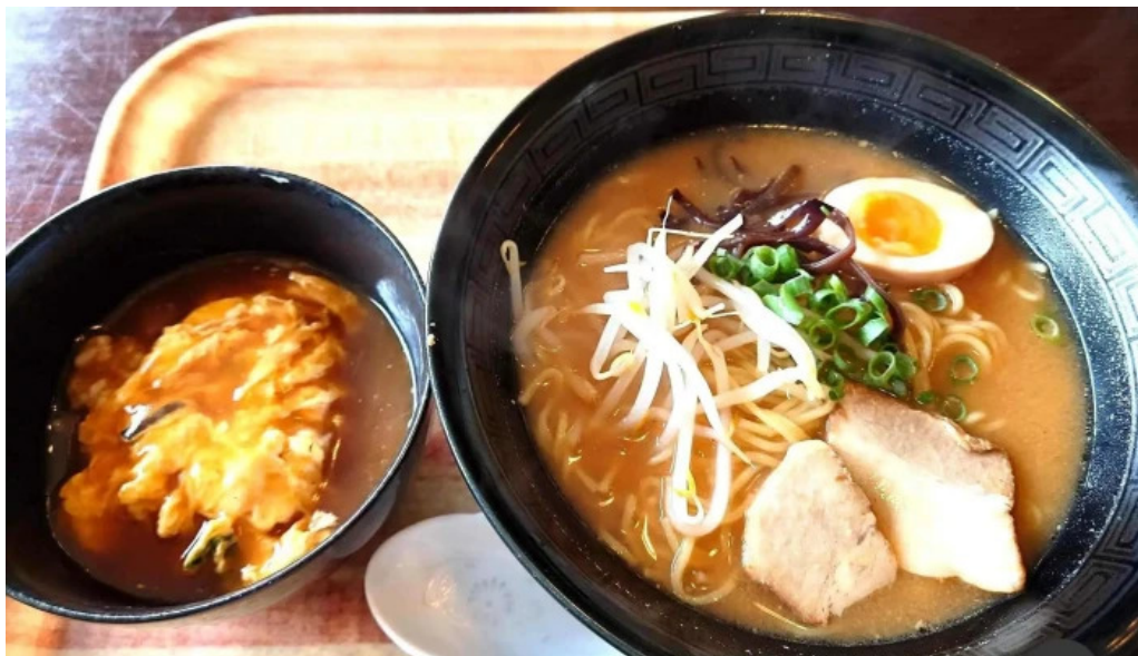
Chu ka chu bou 梵天 料理飲み物