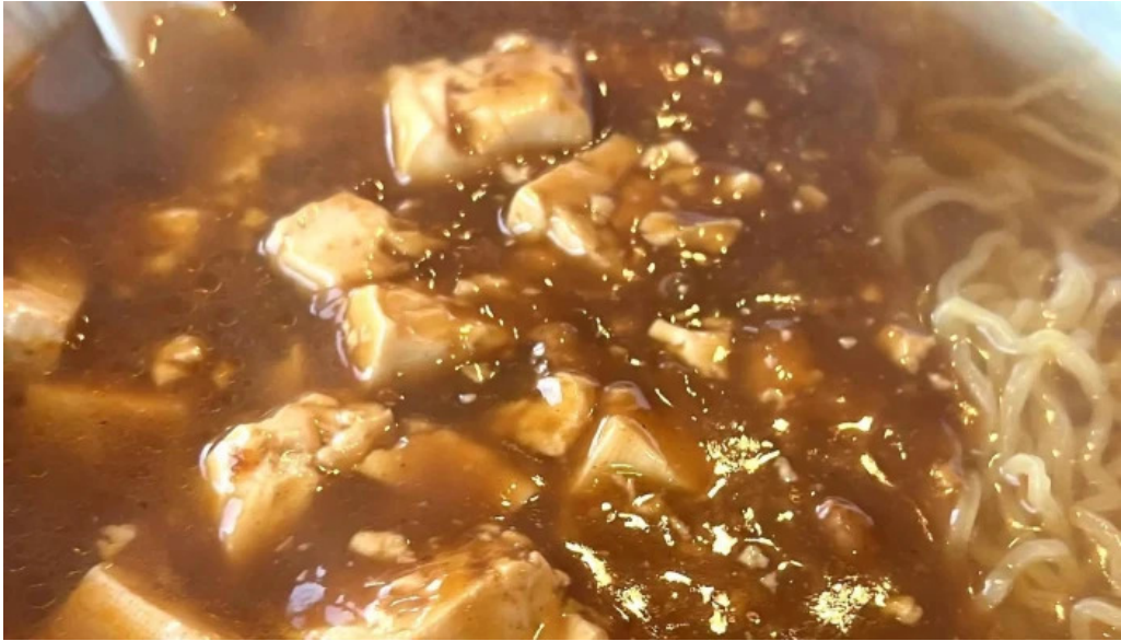
昇龍軒 柏崎店 営業中