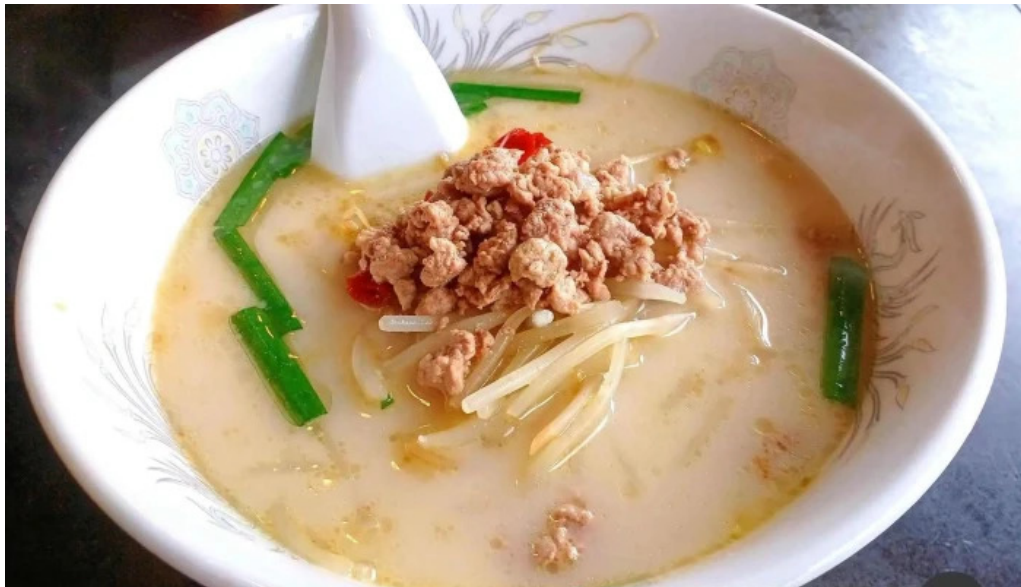
異龍軒 柏崎店 スープ