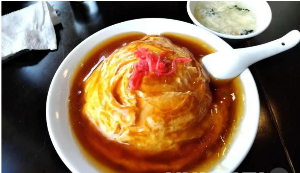
昇龍軒 柏崎店 中華料理