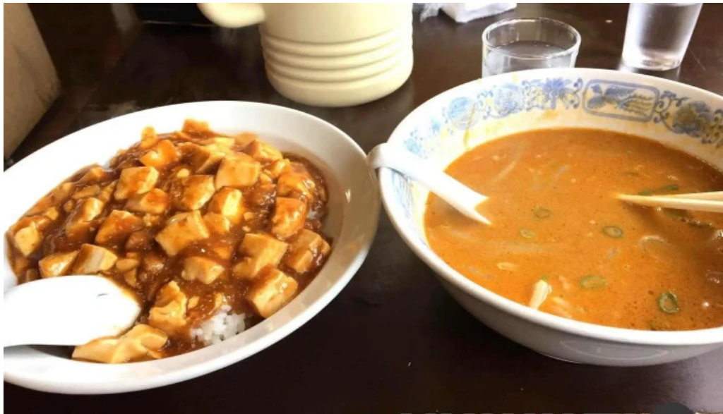
昇龍軒 柏崎店 料理飲み物