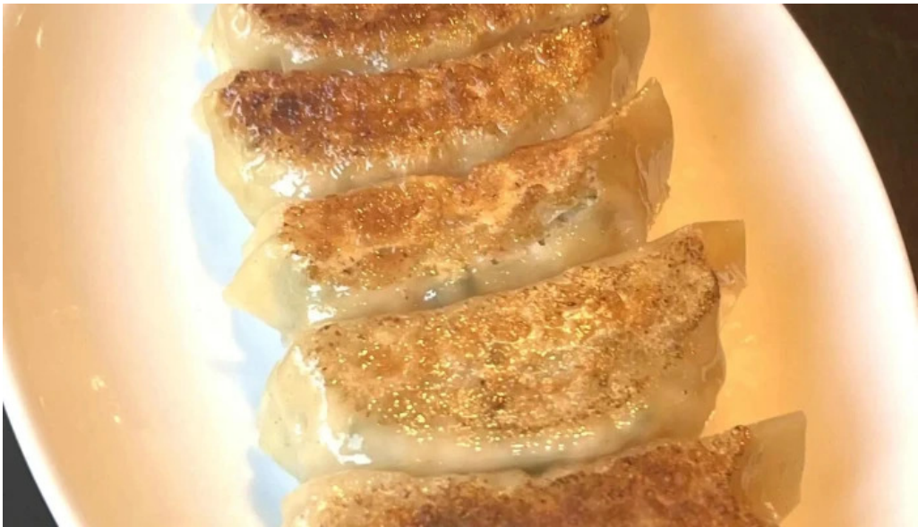
昇龍軒 柏崎店 動画