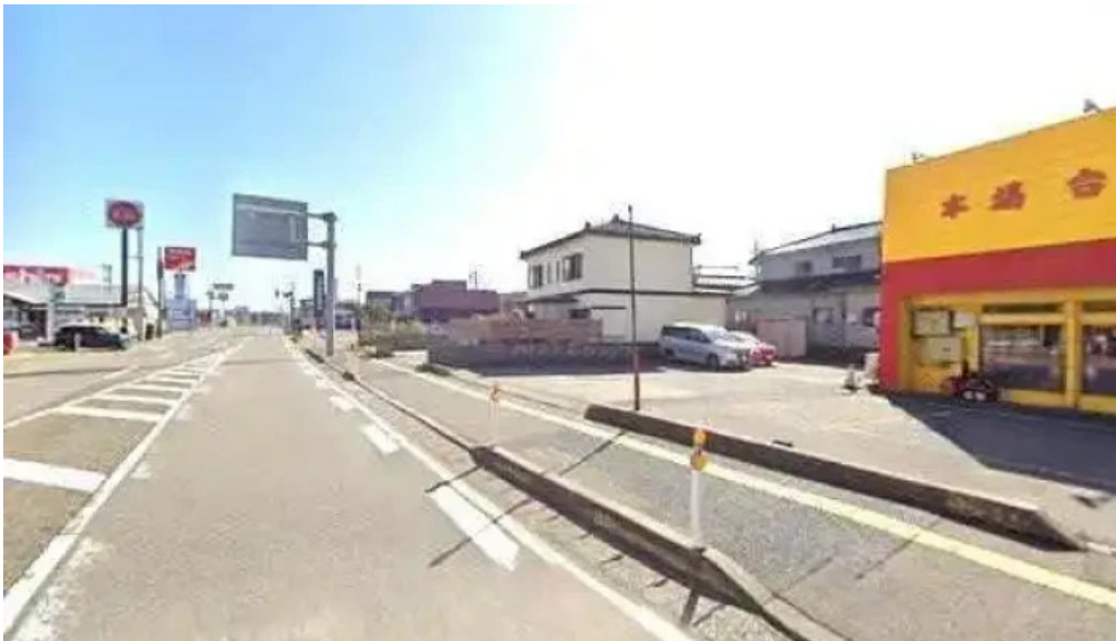
昇龍軒 柏崎店 柏崎市