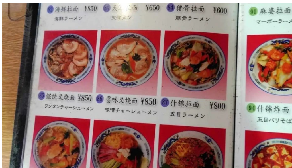
昇龍軒 柏崎店 麵