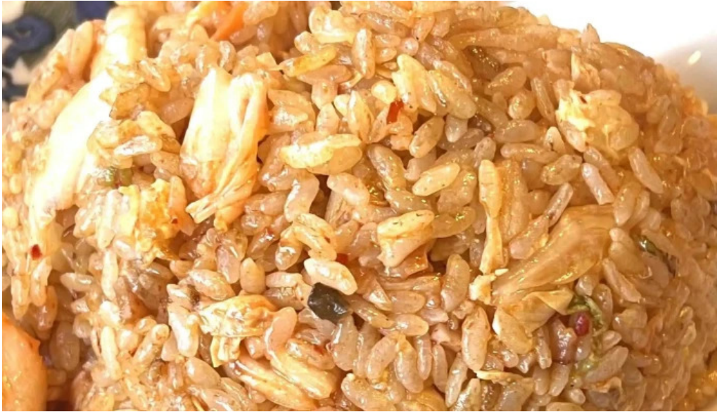
昇龍軒 柏崎店 カタログ