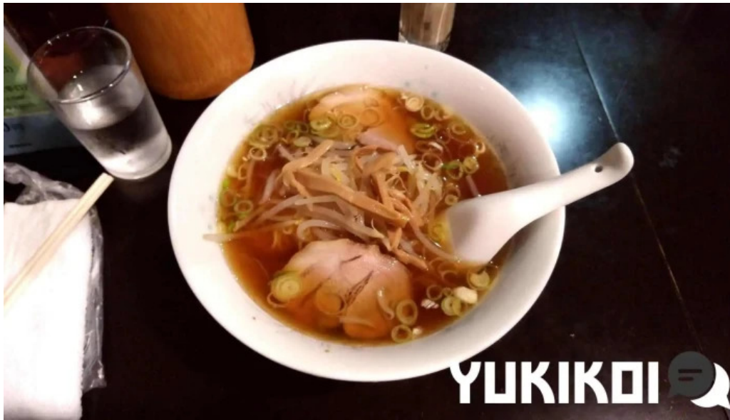
昇龍軒 柏崎店 ラーメン