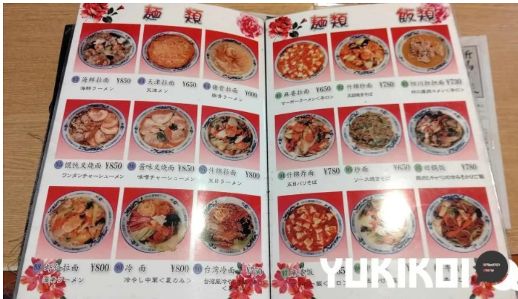
異龍軒 柏崎店 メニュー