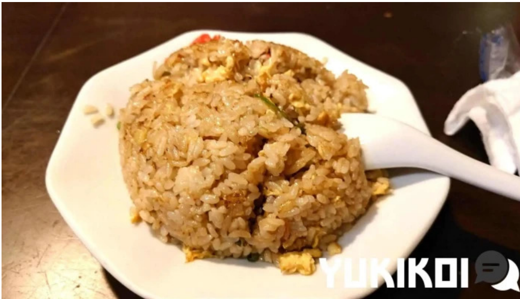
昇龍軒 柏崎店 焼き飯