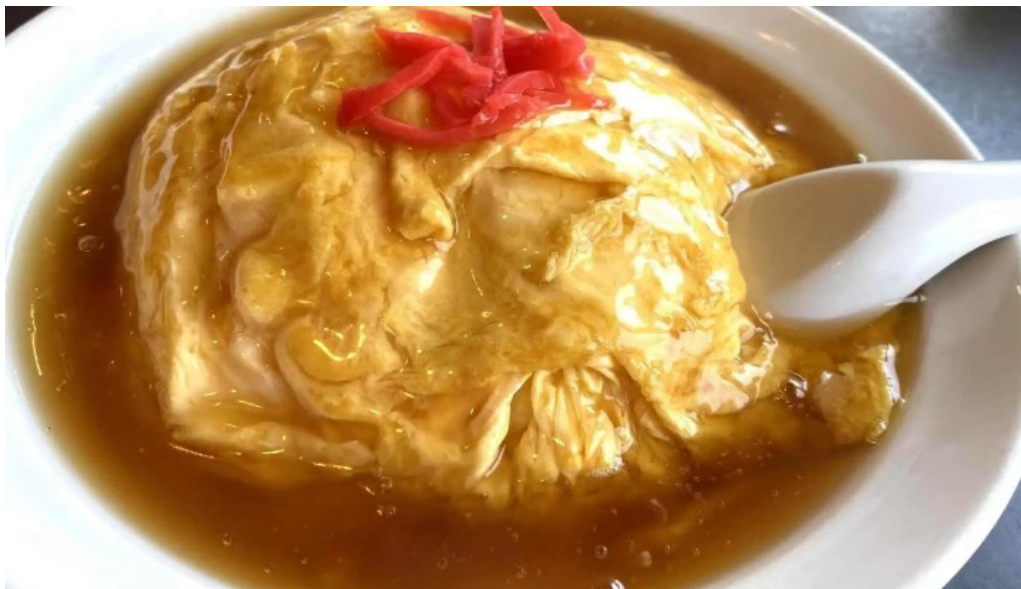
昇龍軒 柏崎店 営業時間