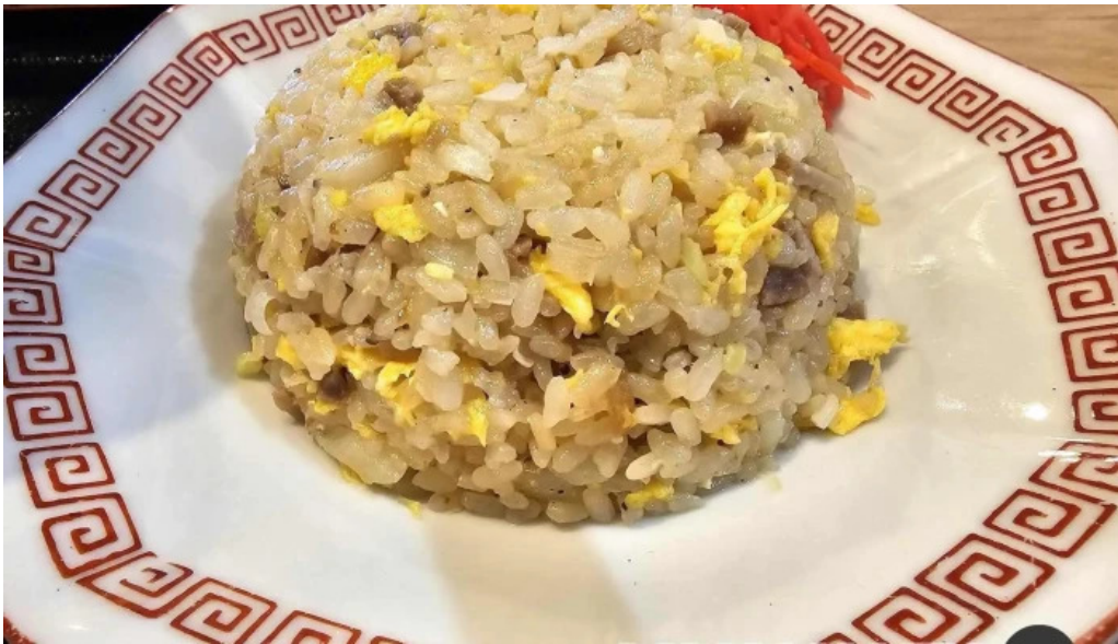
かしわざき中華食堂 竜王 焼き飯