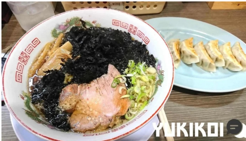
かしわぎ中華食堂 竜王 ダンプリング