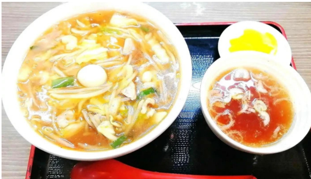
かしわざき中華食堂 竜王 ラーメン