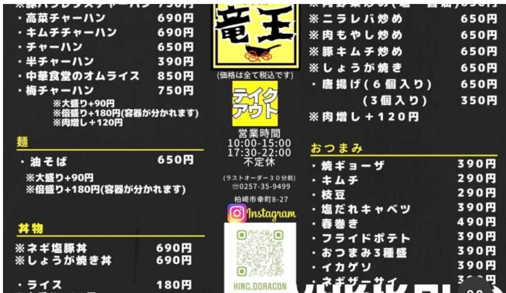
かしわぎ中華食堂 竜王 メニュー