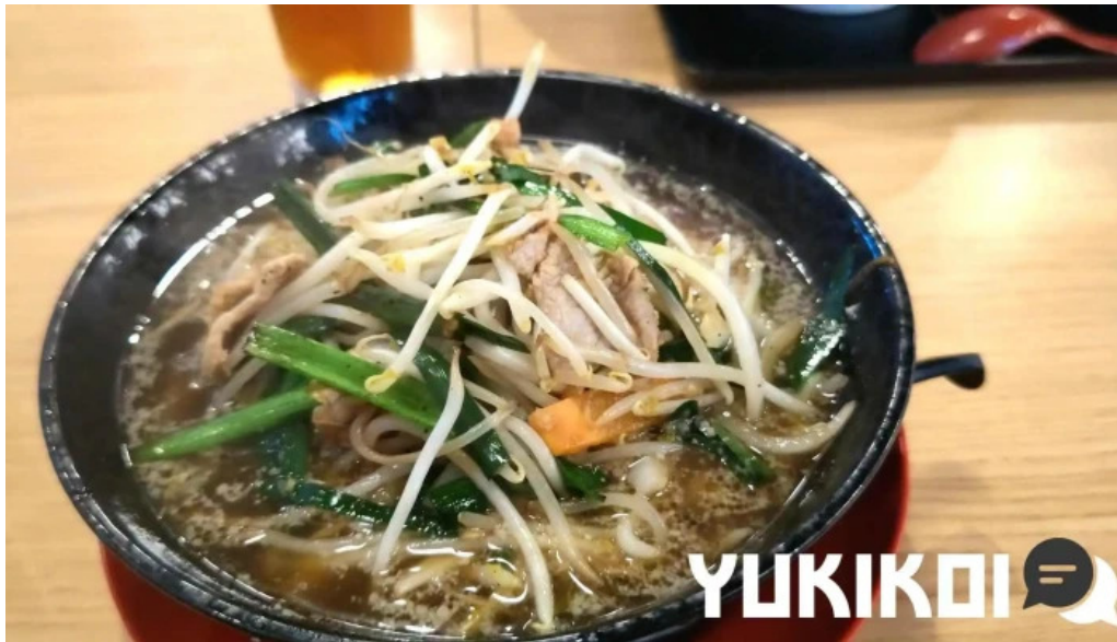
かしわざき中華食堂 竜王 動画