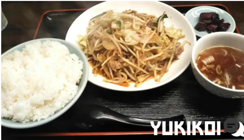
かしわざき中華食堂 竜王 焼きそば