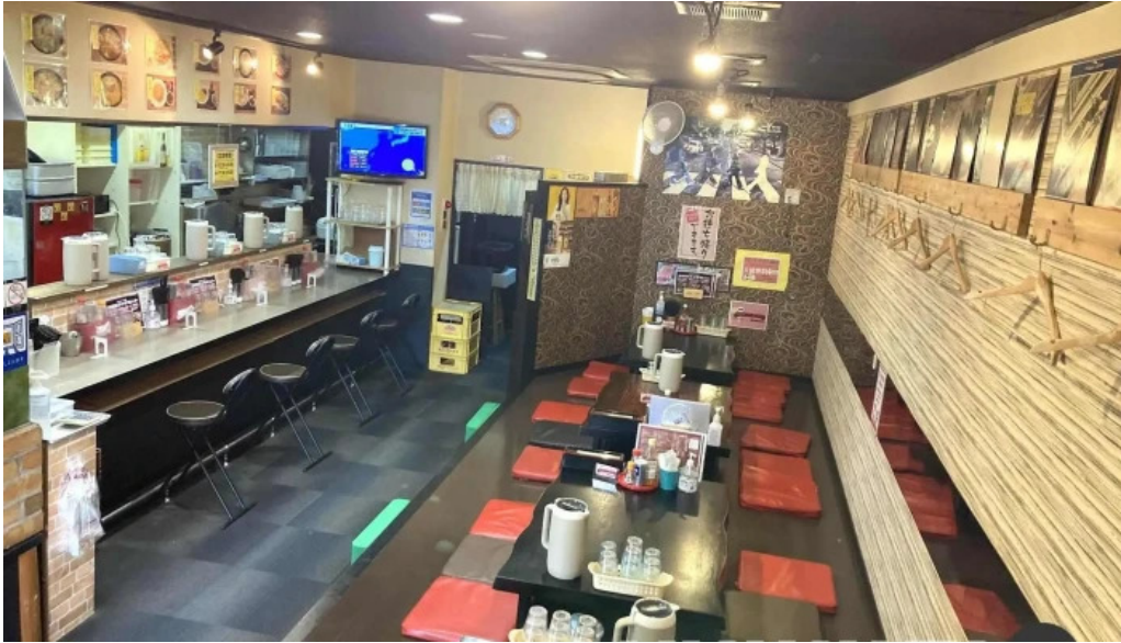
かしわざき中華食堂 竜王 雰囲気