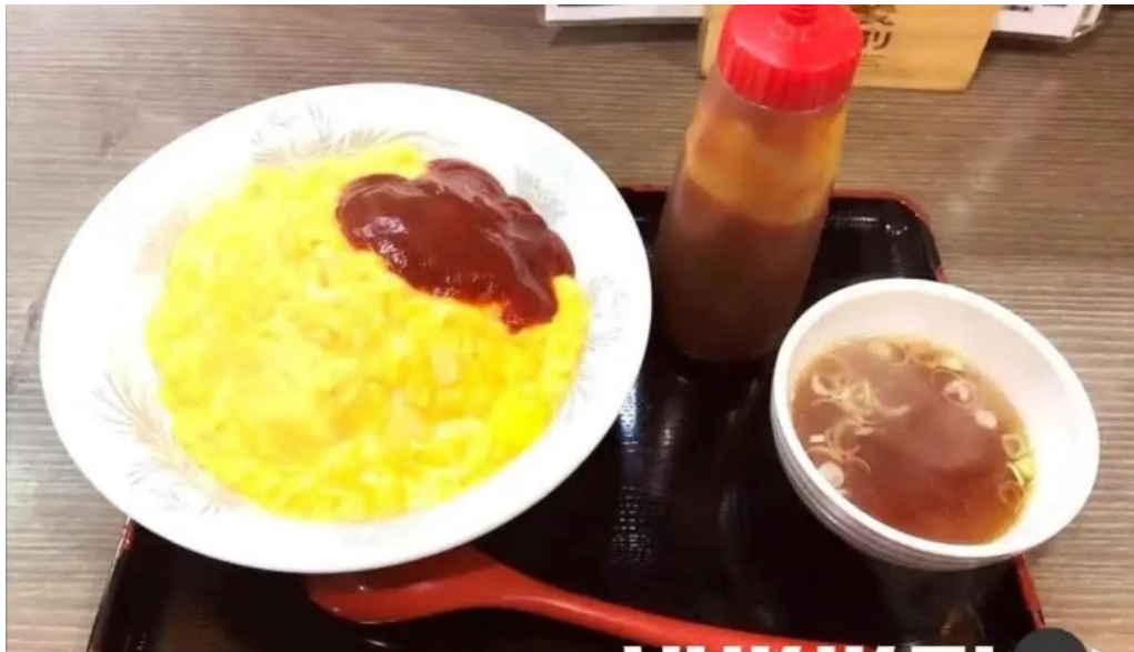
かしのざき中華食堂 竜王 オムライス