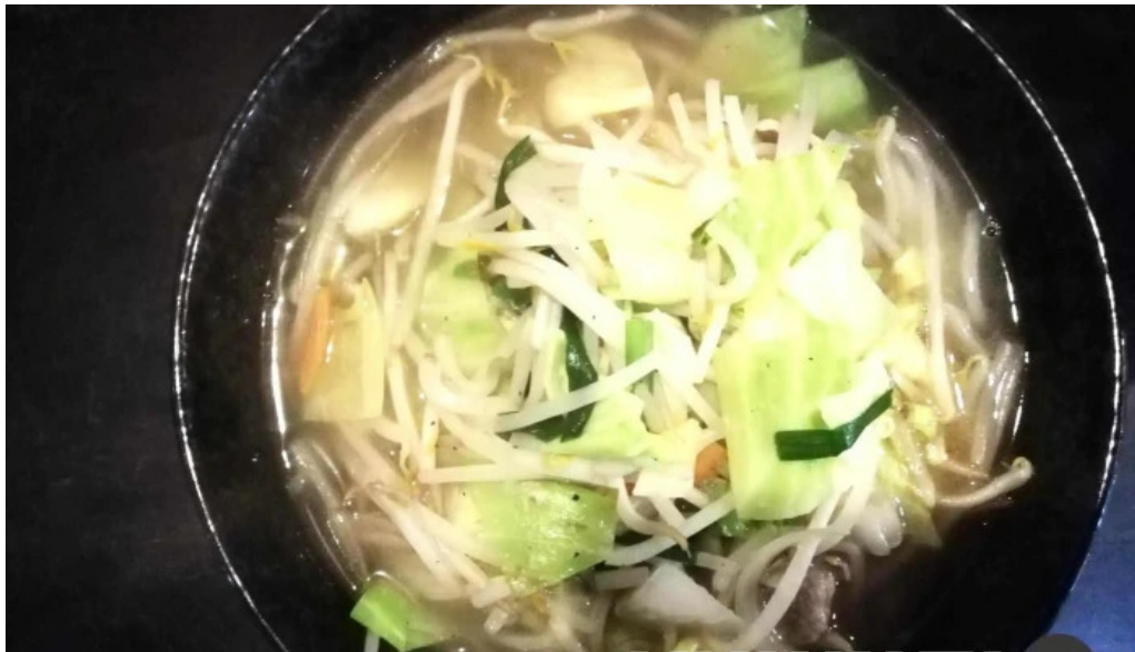
かしわざき中華食堂 竜王 ちゃんぽん