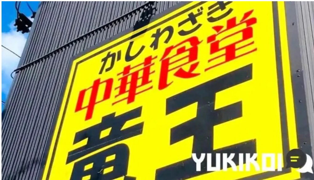
かしのざき中華食堂 竜王