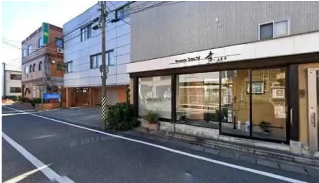
かしわざき中華食堂 竜王 柏崎市