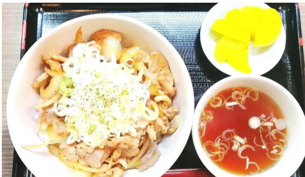
かしわざき中華食堂 竜王 麺