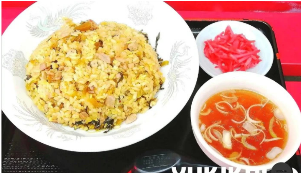
かしわざき中華食堂 竜王 料理飲み物