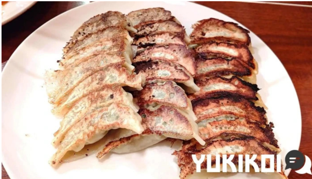
牡丹江 枚方店 ダンプリング