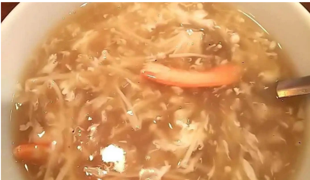
牡丹江 枚方店 麵