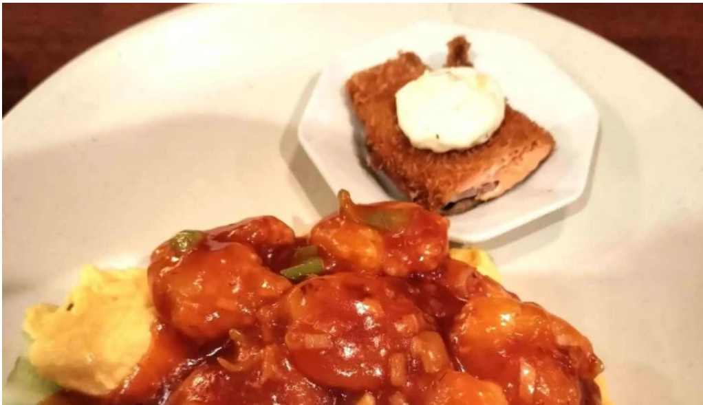
牡丹江 枚方店 エリア