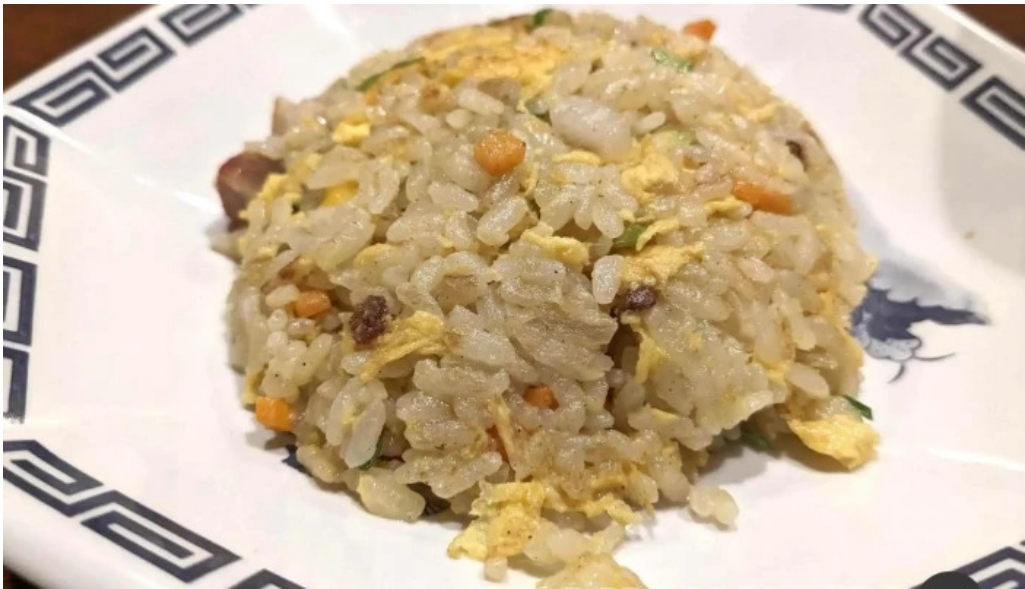
牡丹江 枚方店 焼き飯