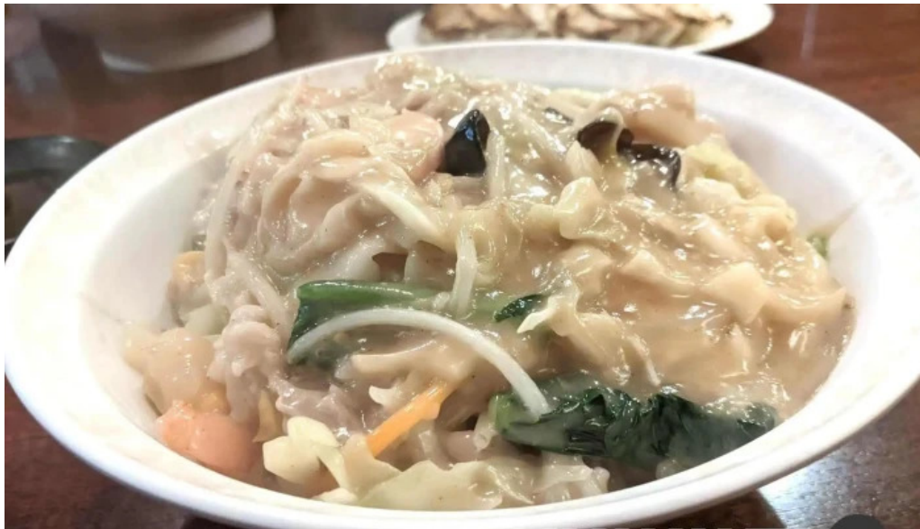
牡丹江 枚方店 ラーメン