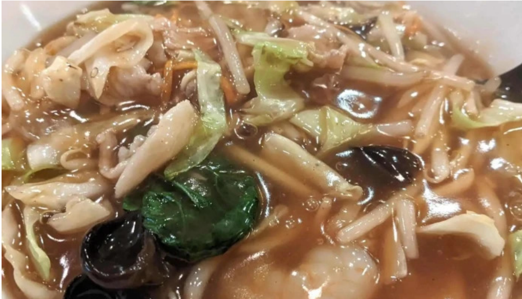
牡丹江 枚方店 instagram