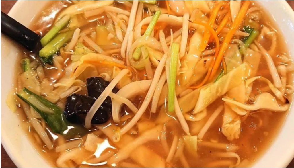
牡丹江 枚方店 番号