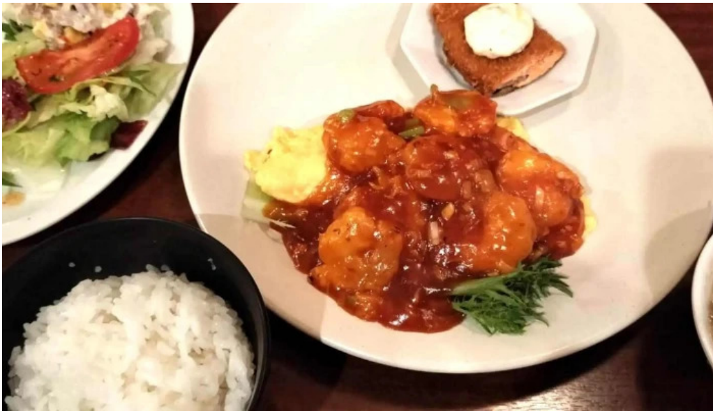
牡丹江 枚方店 口コミ