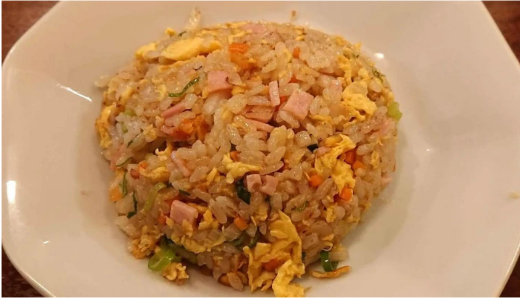
牡丹江 枚方店 スコア