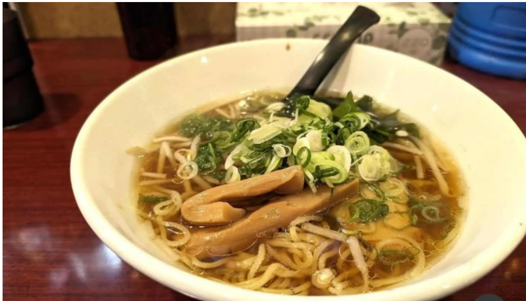
牡丹江 枚方店 スープ