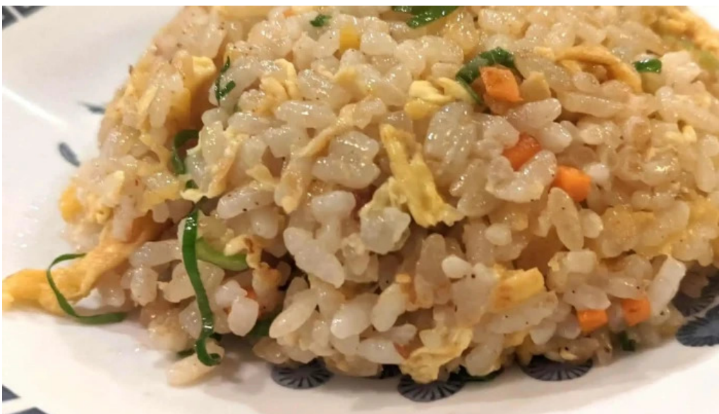
牡丹江 枚方店 電話