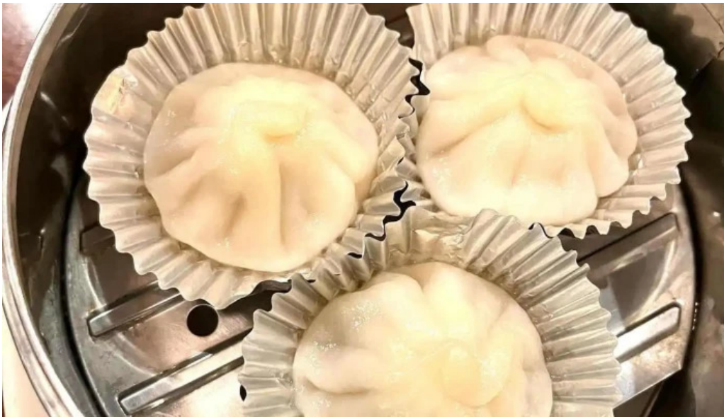
牡丹江 枚方店 料理飲み物