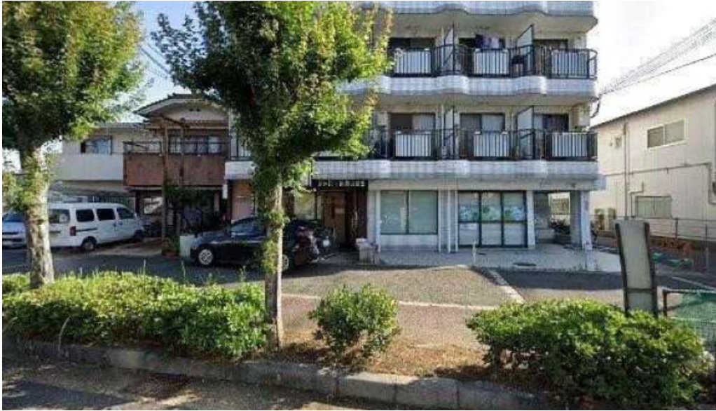
牡丹江 枚方店 枚方市