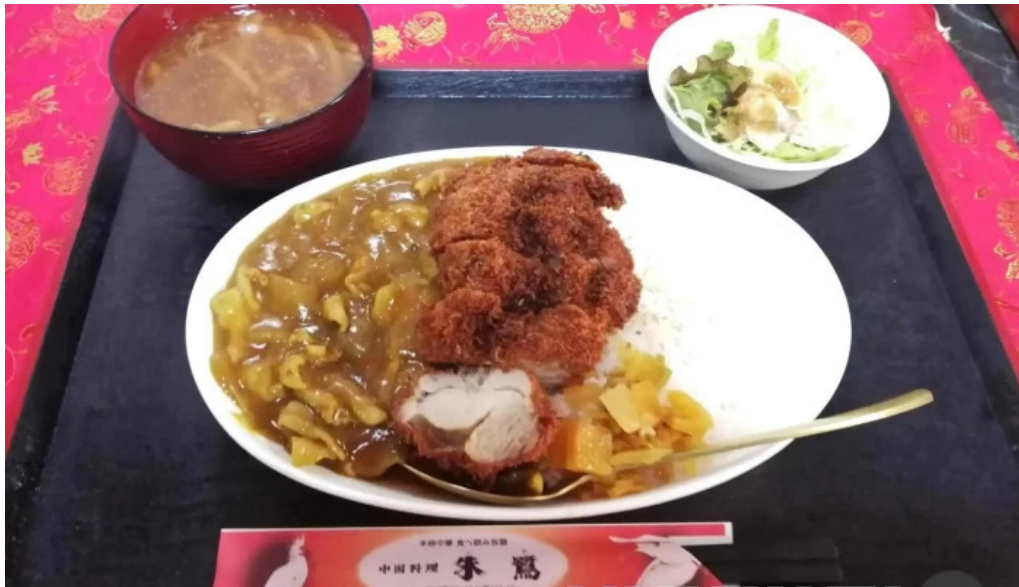
中国料理 朱鷺 枚方店