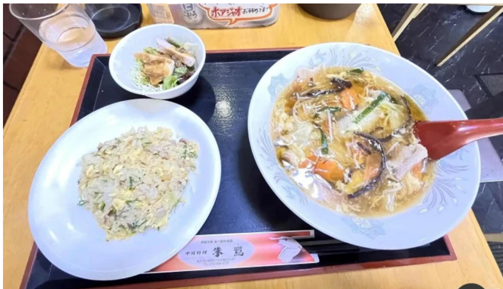
中国料理 朱鷺 枚方店 麺