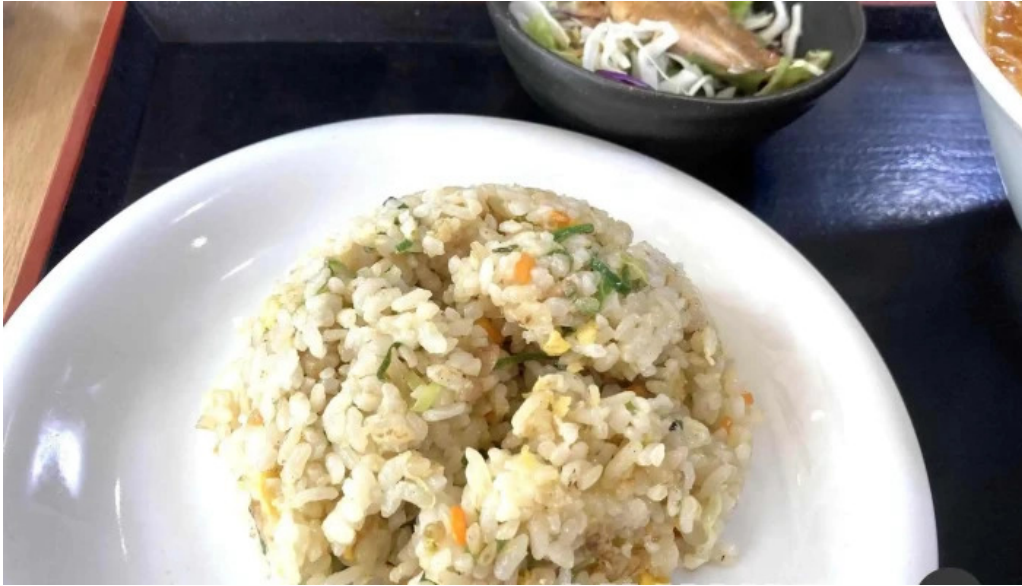
中国料理 朱鷺 枚方店 焼き飯