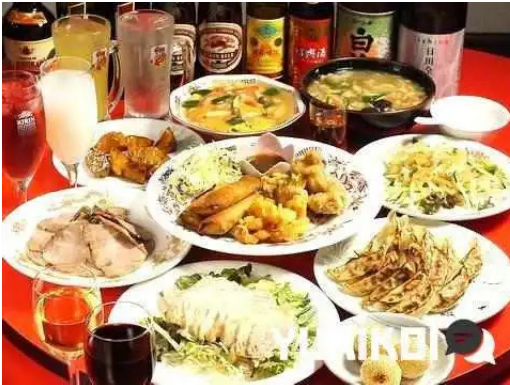
中国料理 朱鷺 枚方店 料理飲み物