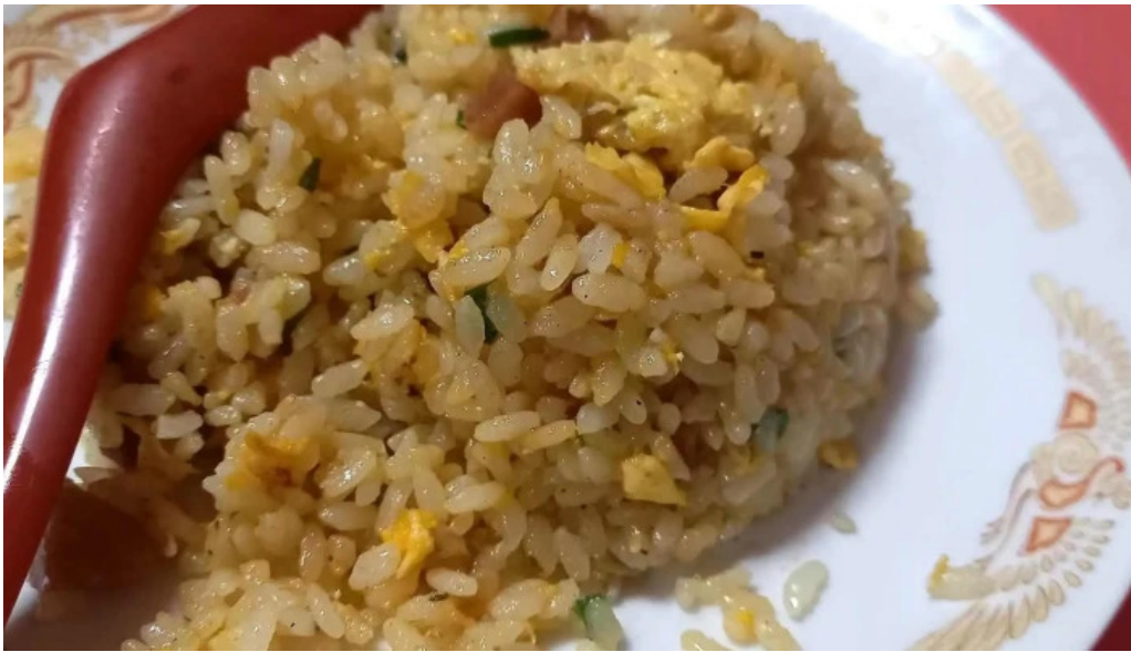
中国料理 朱鷺 枚方店 行き方