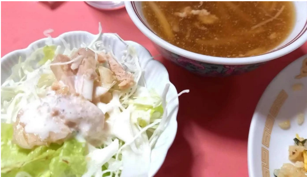
中国料理 朱鷺 枚方店 番号