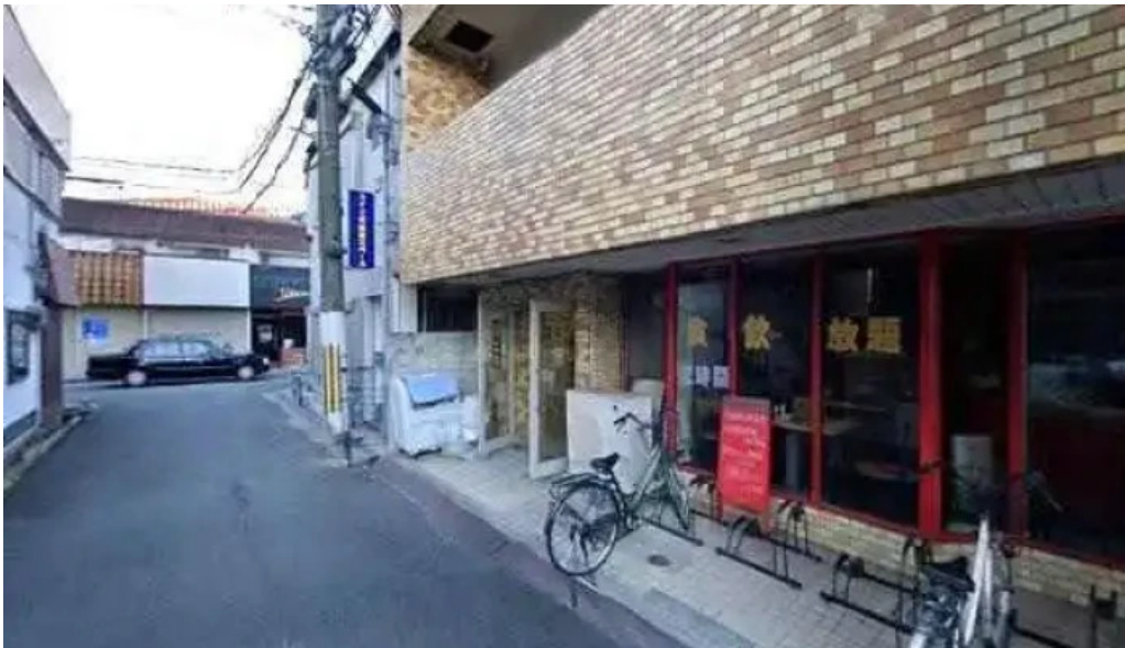
中国料理 朱鷺 枚方店 枚方市