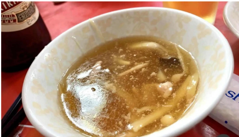
中国料理 朱鷺 枚方店 スープ