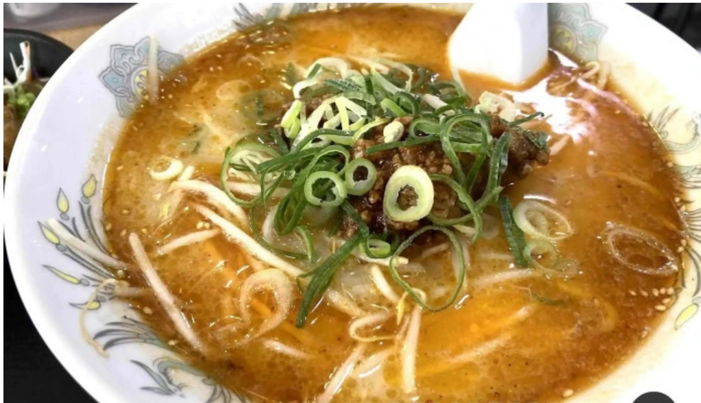
中国料理 朱鷺 枚方店 ラーメン