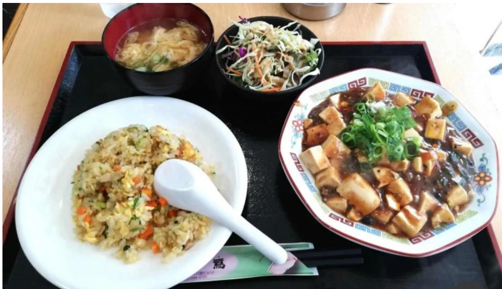
中国料理 朱鷺 枚方店 中華料理