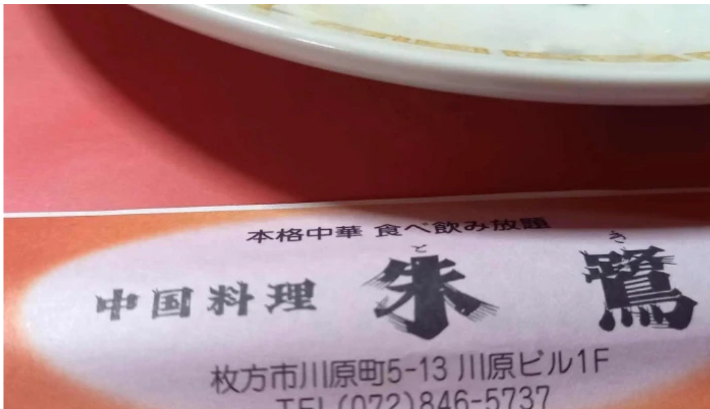
中国料理 朱鷺 枚方店 プロモーション