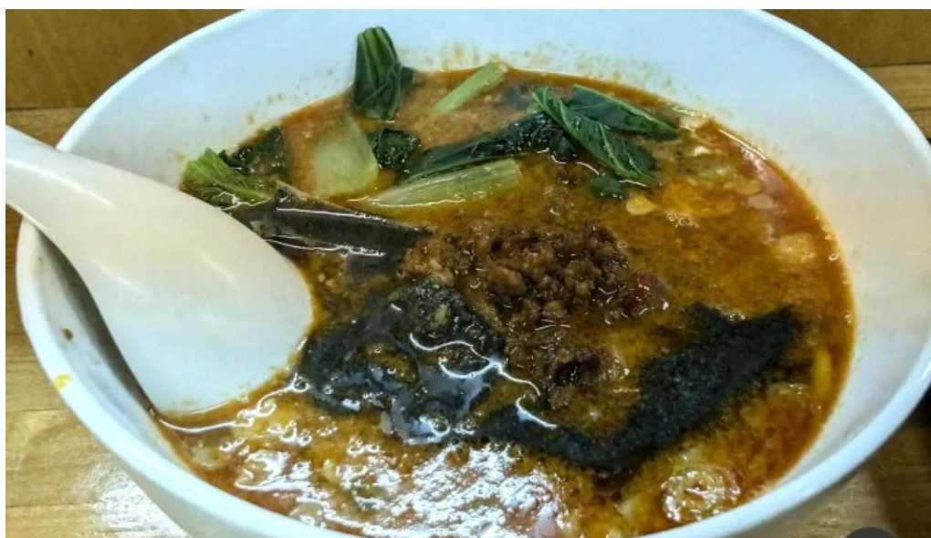
茉莉花 料理飲み物