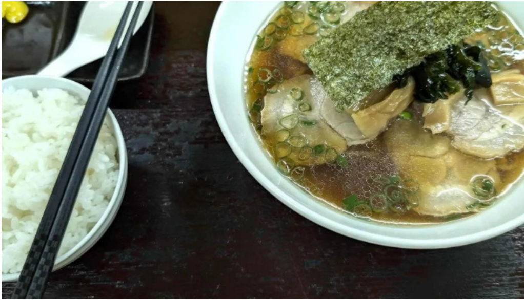
茉莉花 プロモーション