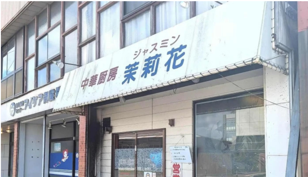
茉莉花 ウェブサイト