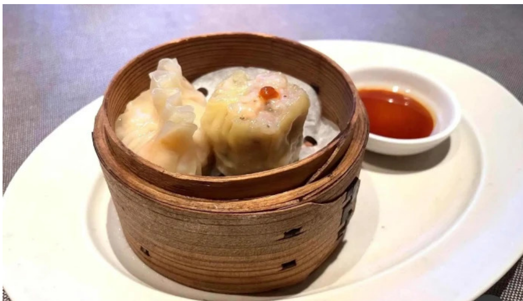
たから亭 ダンプリング