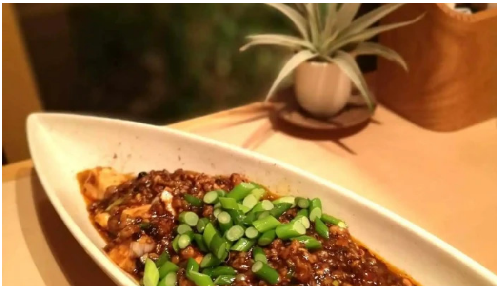
たから亭 麻婆豆腐