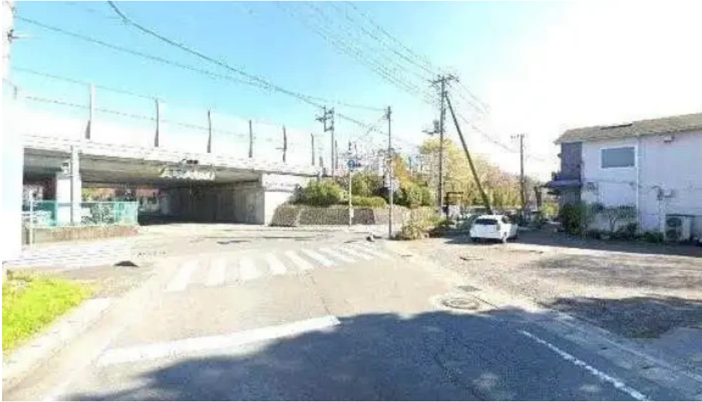
たから亭 御殿場市