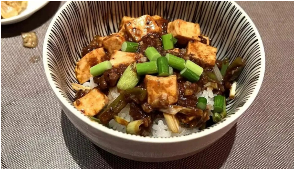
たから亭 料理飲み物