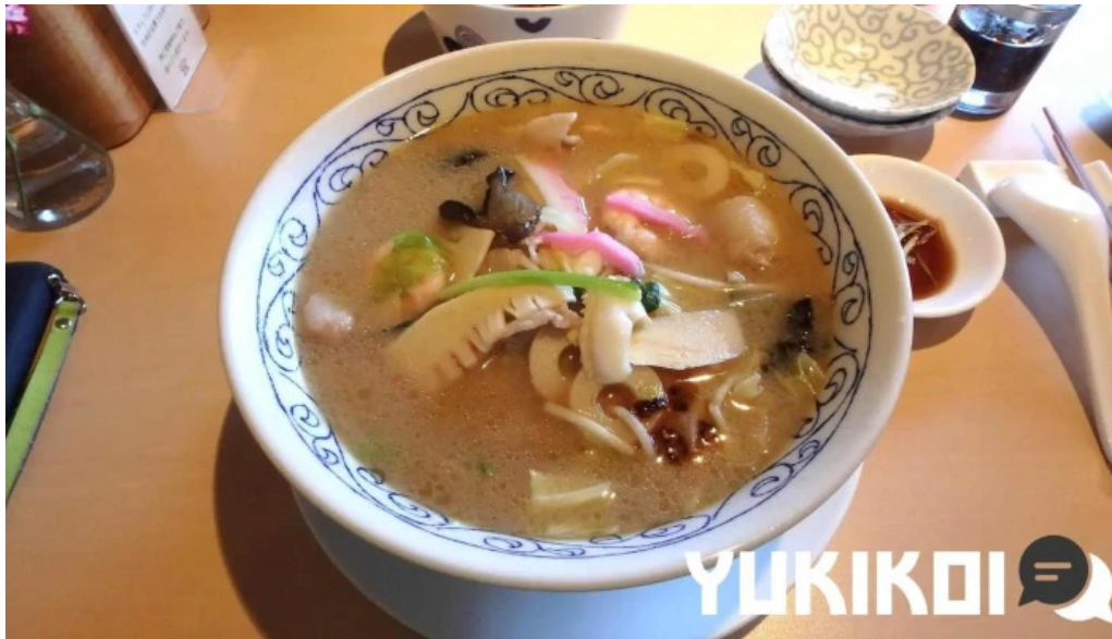
たから亭 ラーメン