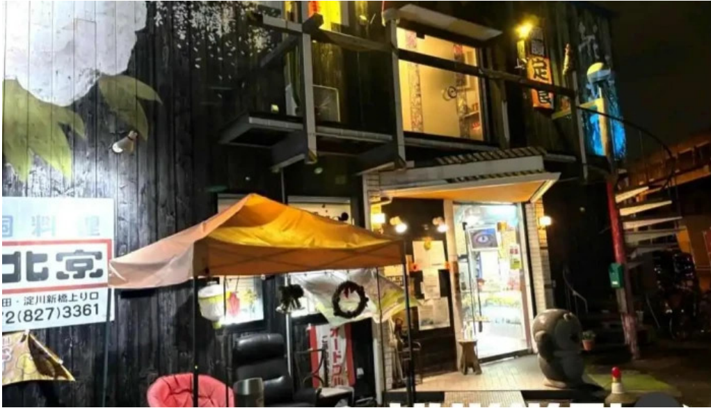
中華料理 花北京 最新