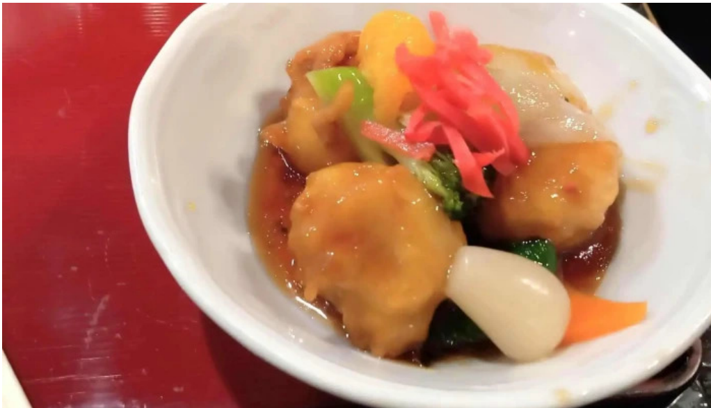
中華料理 花北京 コメント