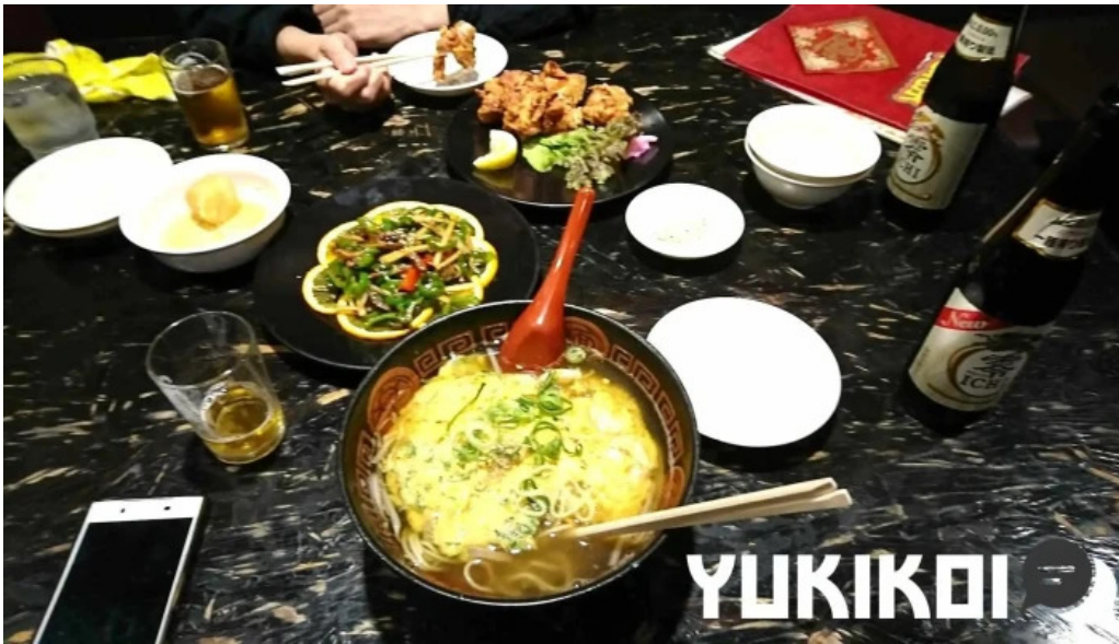
中華料理 花北京 料理飲み物