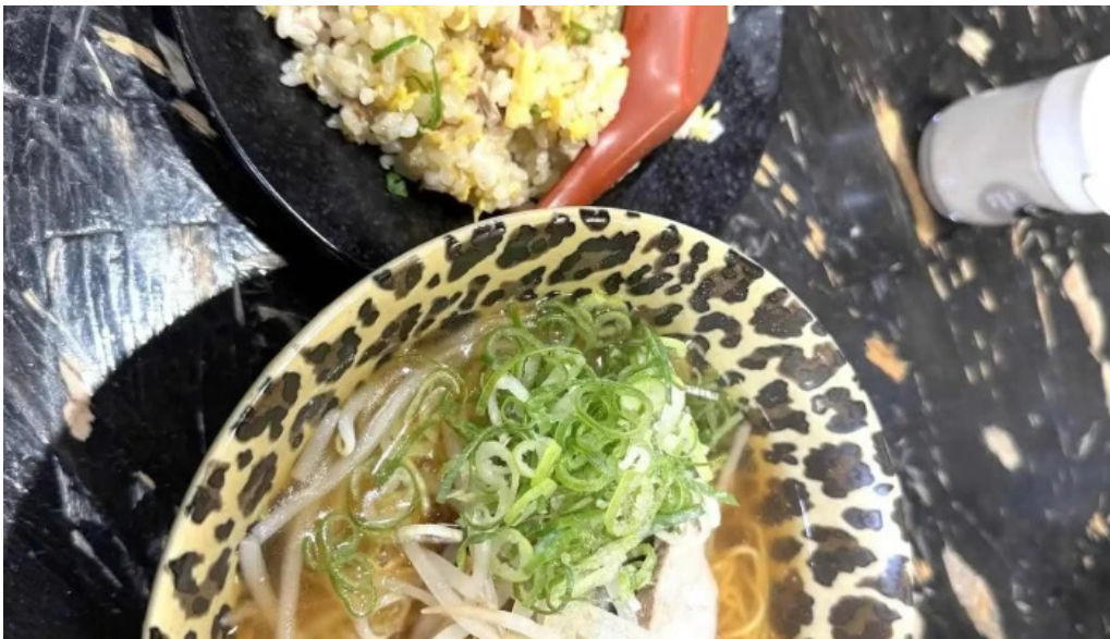
中華料理 花北京 麵