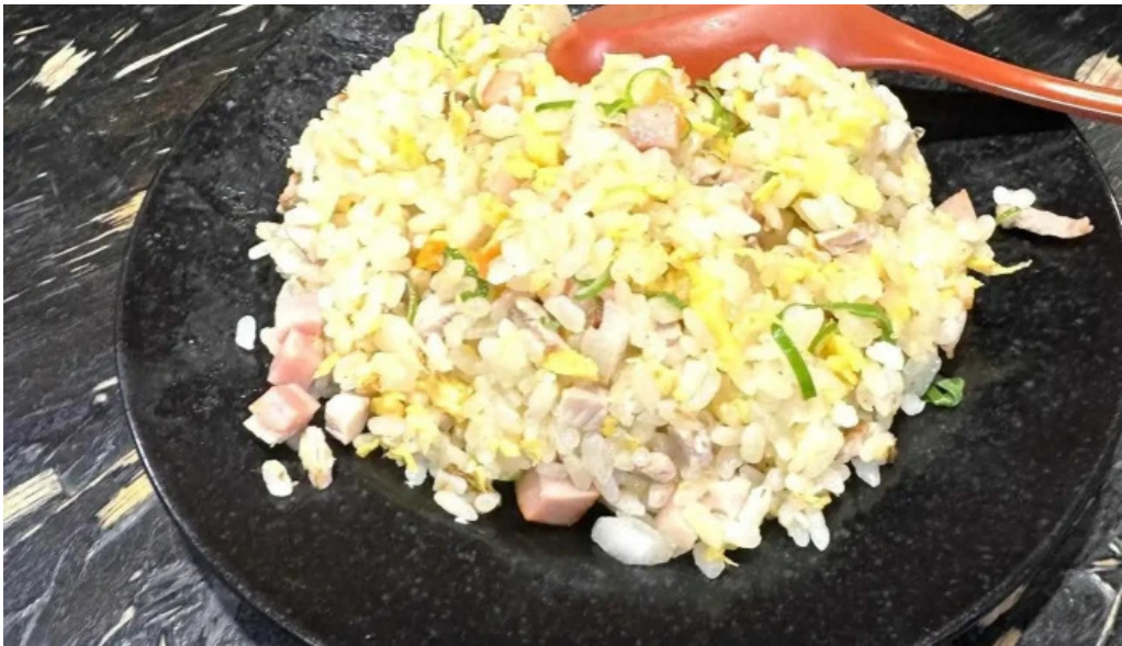
中華料理 花北京 焼き飯