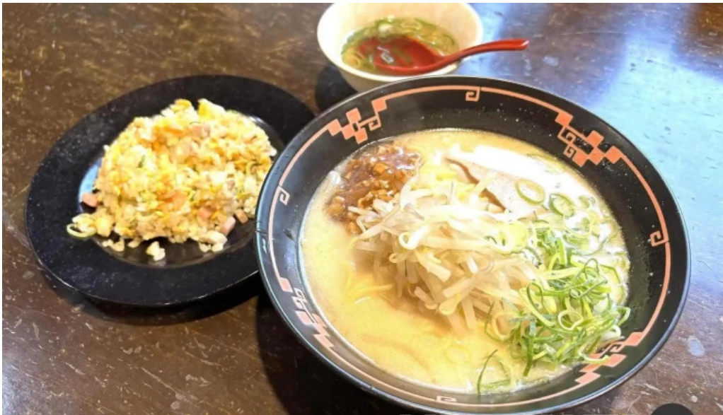
中華料理 花北京 ラーメン