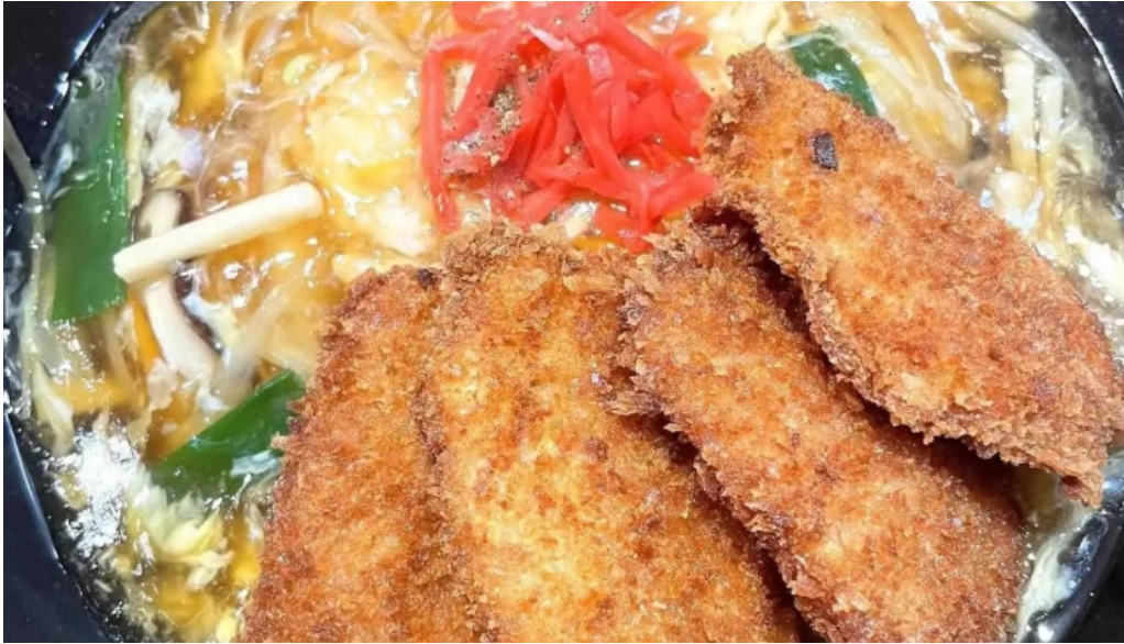
中華料理 花北京 豚カツ