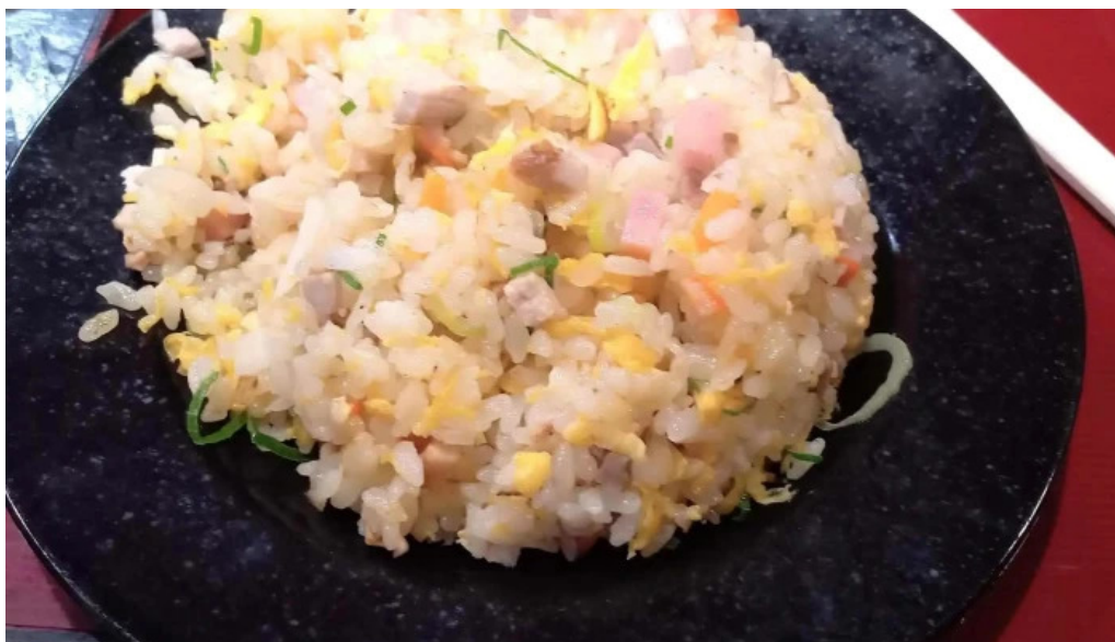
中華料理 花北京 カタログ