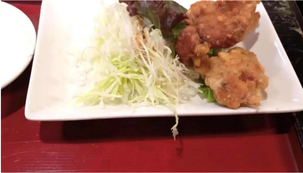
中華料理 花北京 営業中