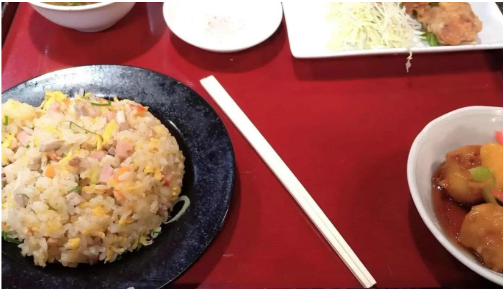
中華料理 花北京 写真