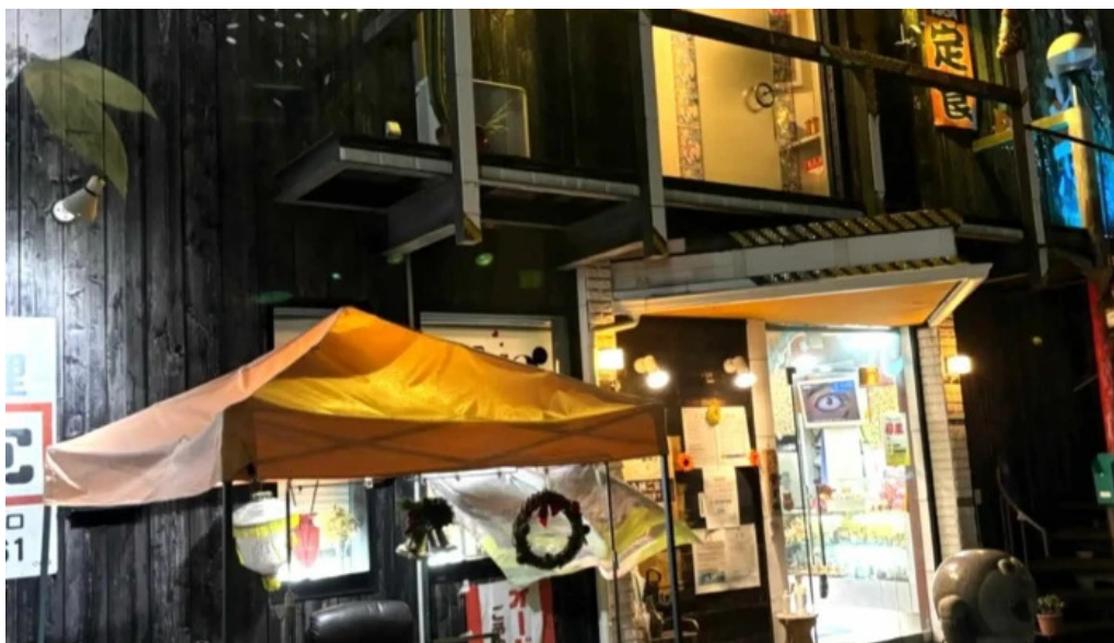
中華料理 花北京 エリア