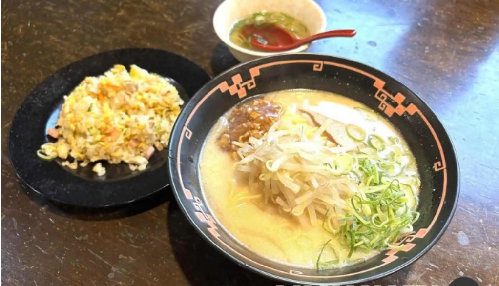
中華料理 花北京 スープ