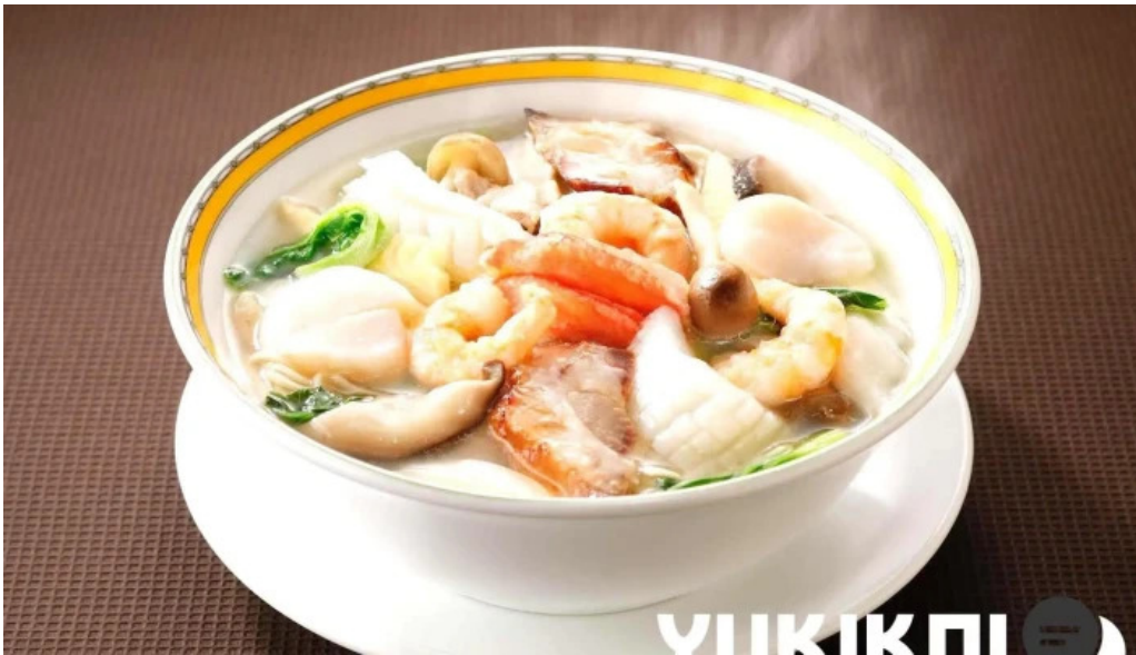
銀座アスター 目黒テラス スープ