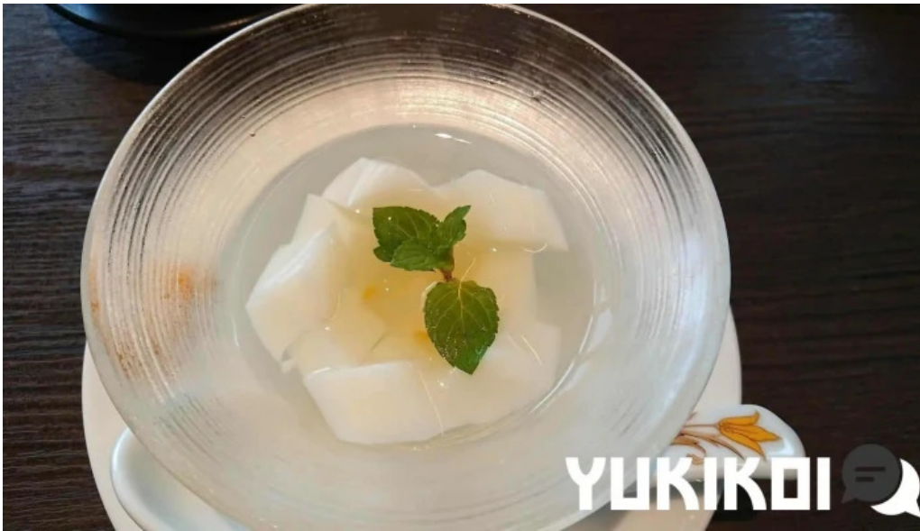
銀座アスター 目黒テラス 杏仁豆腐