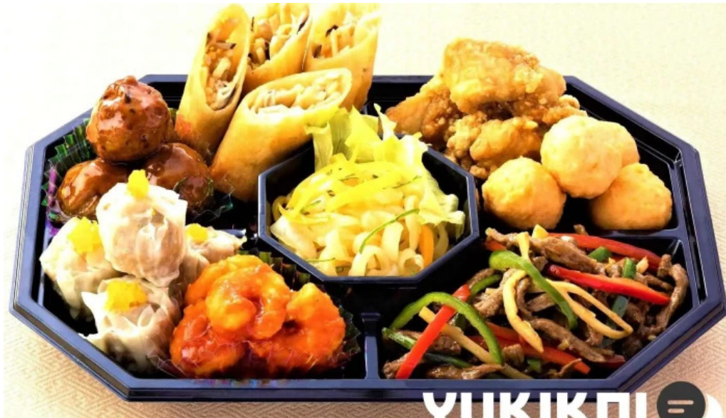
銀座アスター 目黒テラス 料理飲み物