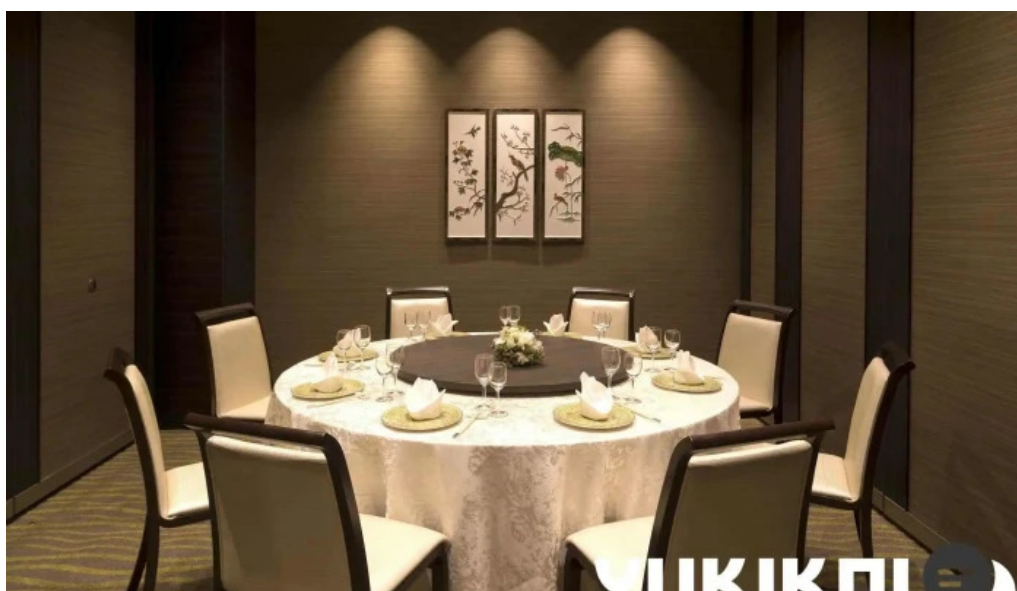
銀座アスター 目黒テラス 雰囲気