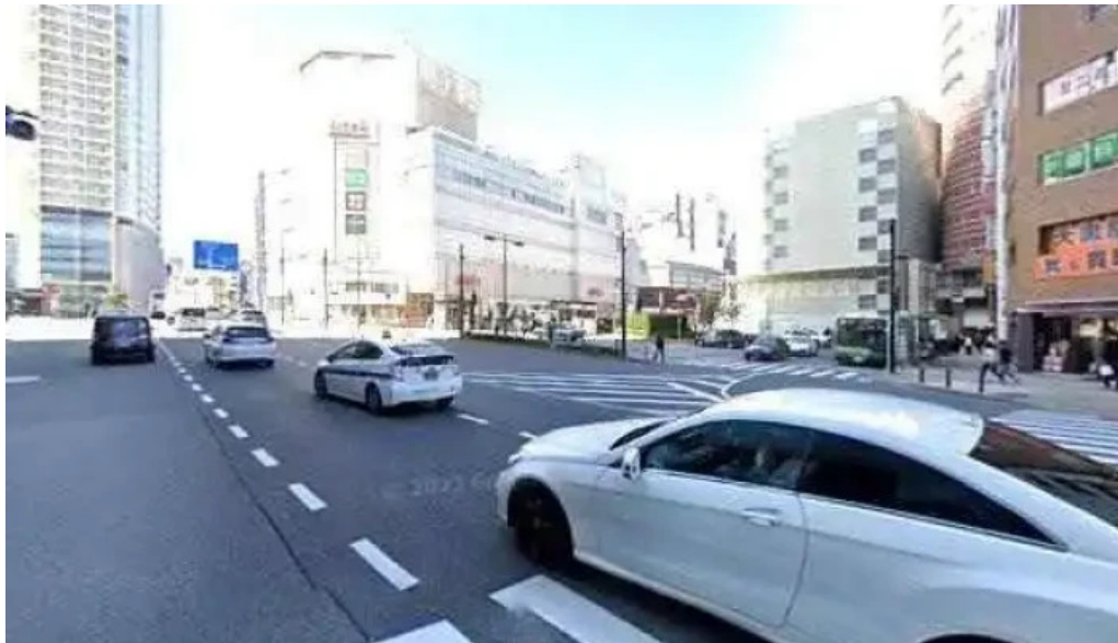
銀座アスター 目黒テラス 品川区