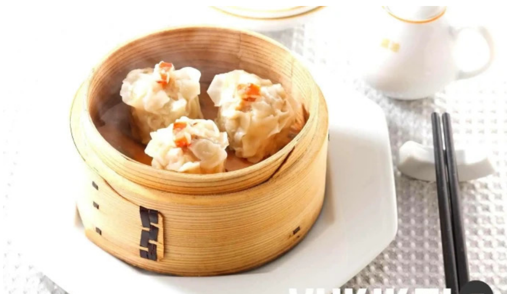
銀座アスター 目黒テラス 焼売