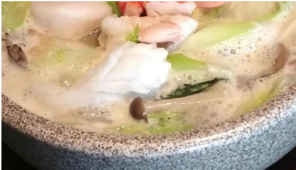
銀座アスター 目黒テラス 動画