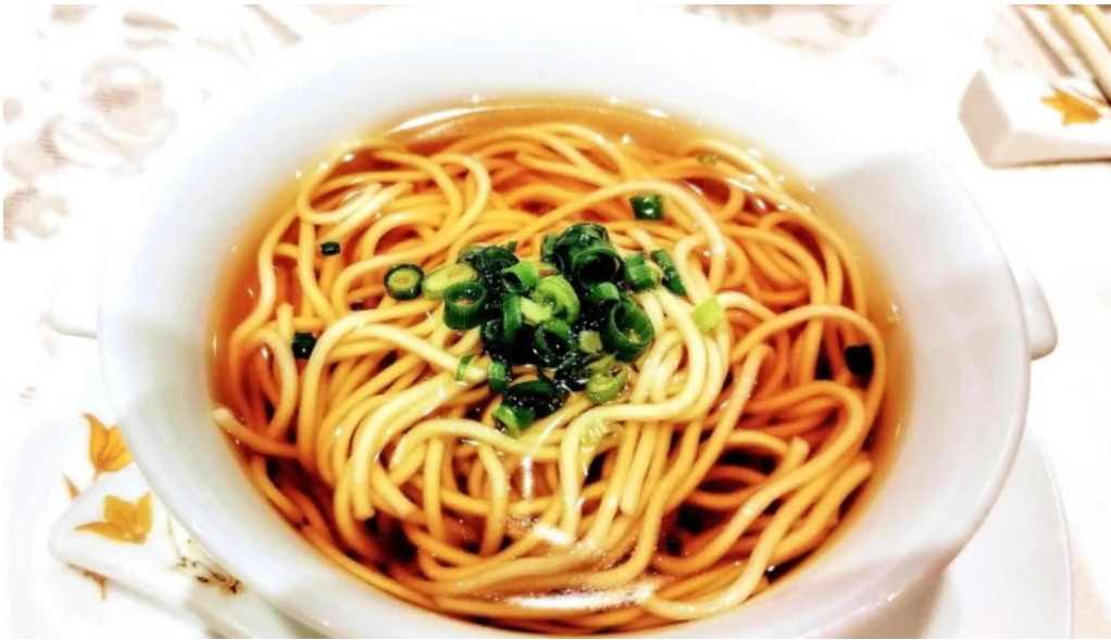
銀座アスター 目黒テラス ピスコサワー