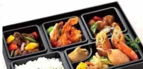
銀座アスター 目黒テラス 弁当