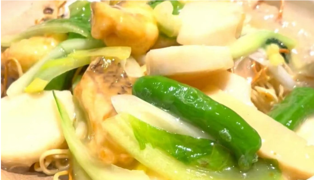
銀座アスター 目黒テラス ウェブサイト