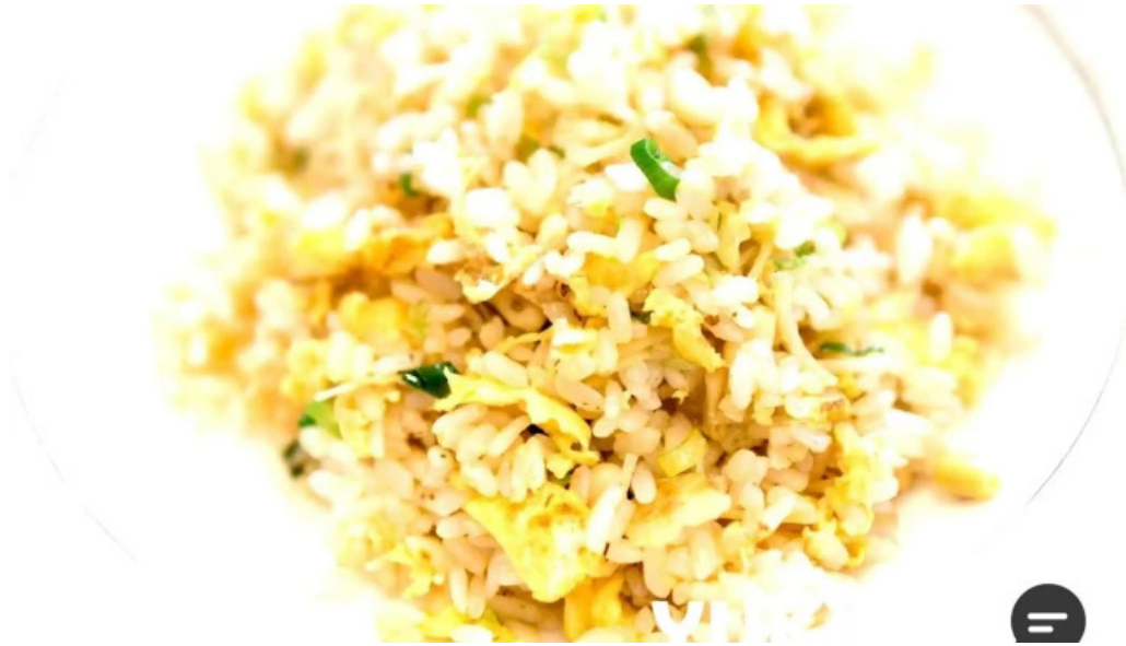
銀座アスター 目黒テラス 焼き飯