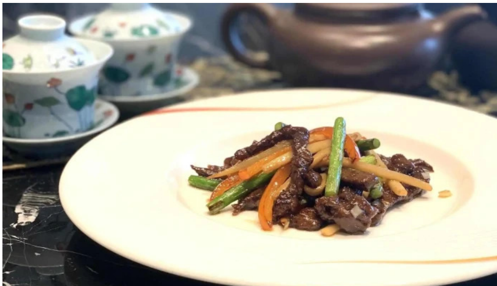
銀座アスター 目黒テラス