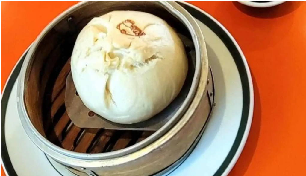
美食人 エピキュア 歓歡ほあんほあん 点心