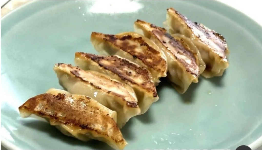
美食人 エピキュア 歓歡ほあんほあん 餃子