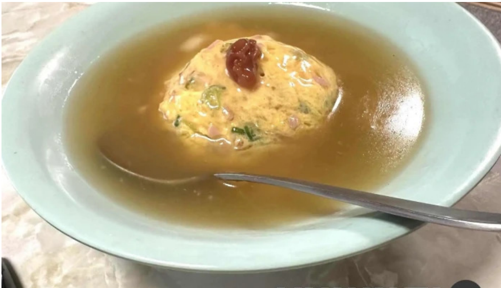
美食人 エピキュア 歓歡ほあんほあん チキンスープ