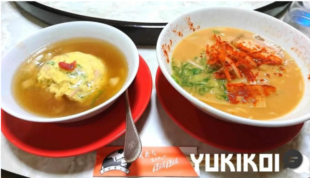
美食人 エピキュア 歓歡ほあんほあん スープ