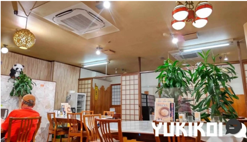
美食人 エピキュア 歓歡ほあんほあん 雰囲気