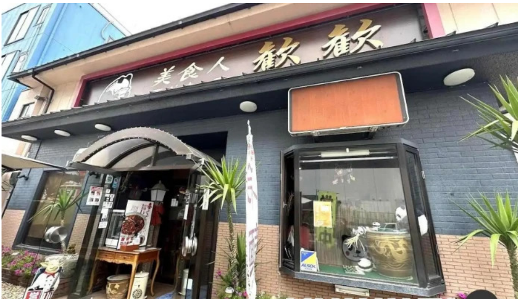
美食人 エピキュア 歓歡ほあんほあん 向日市