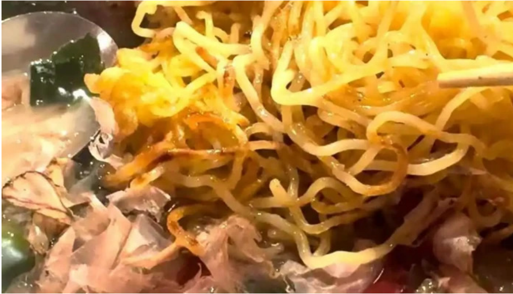
美食人 エピキュア 歓歡ほあんほあん 動画