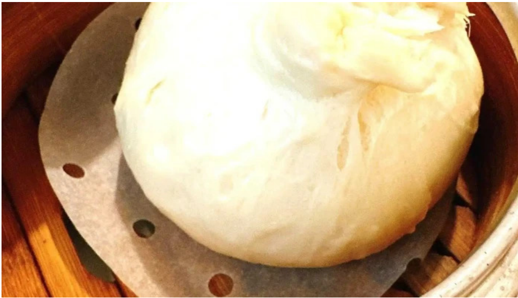
美食人 エピキュア 歓歡ほあんほあん 最新