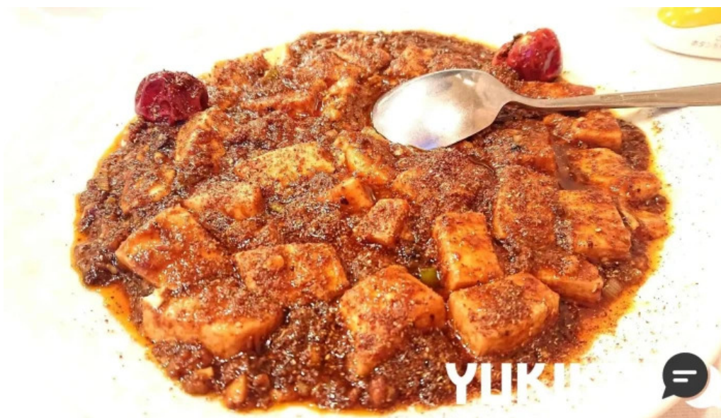
美食人 エピキュア 歓歡ほあんほあん 麻婆豆腐