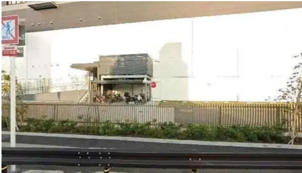
美食人 エピキュア 歓歡ほあんほあん 向日市