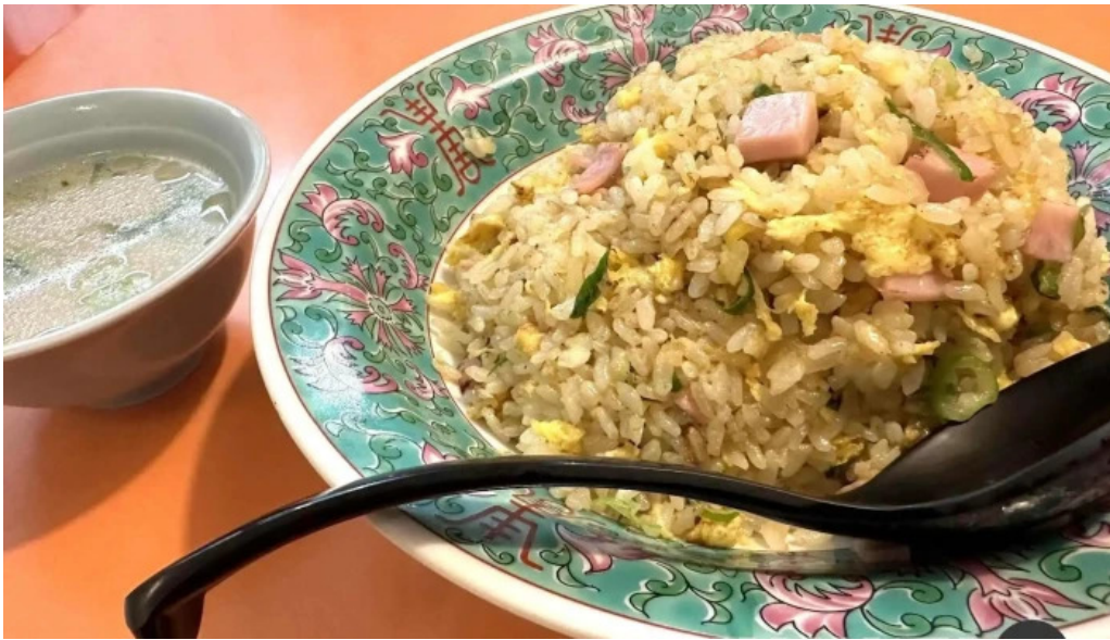
美食人 エピキュア 歓歡ほあんほあん 焼き飯