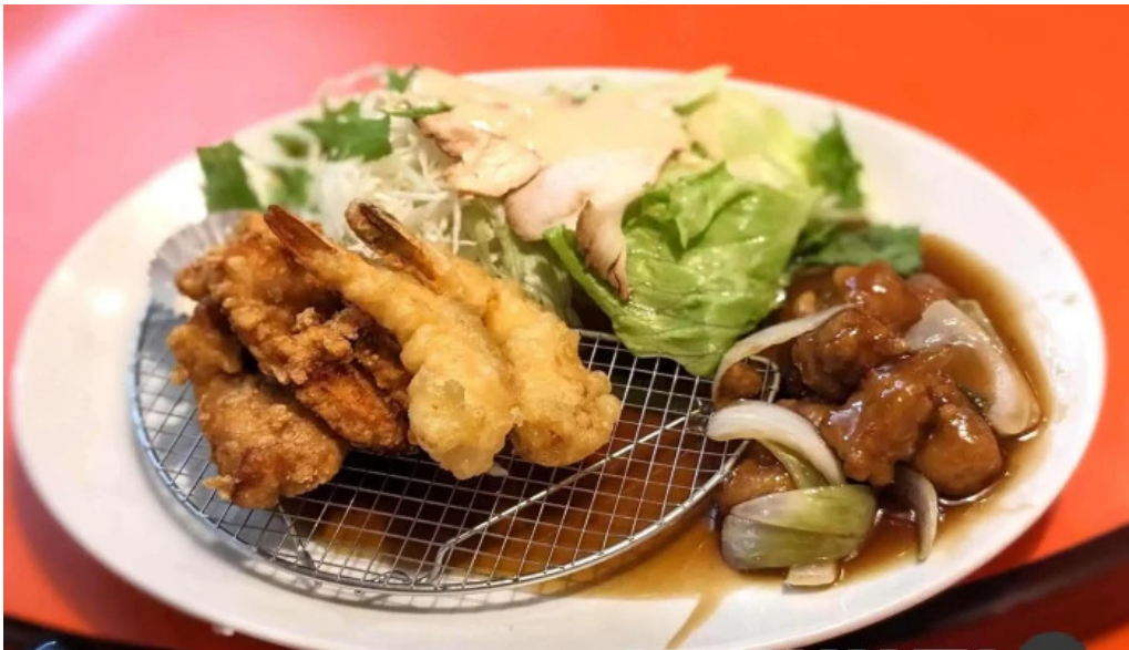
美食人 エピキュア 歓歡ほあんほあん から揚げ