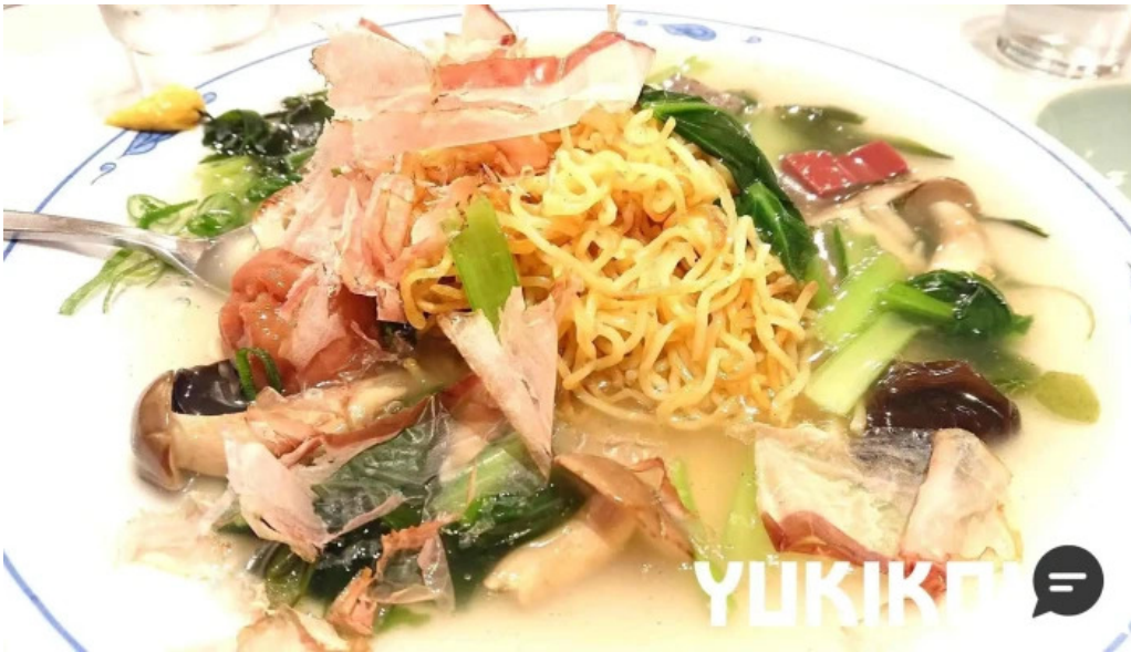
美食人 エピキュア 歓歡ほあんほあん 料理飲み物