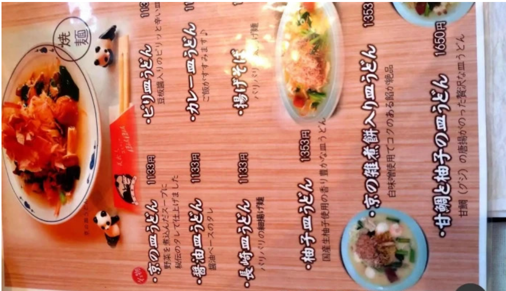
美食人 エピキュア 歓歡ほあんほあん メニュー