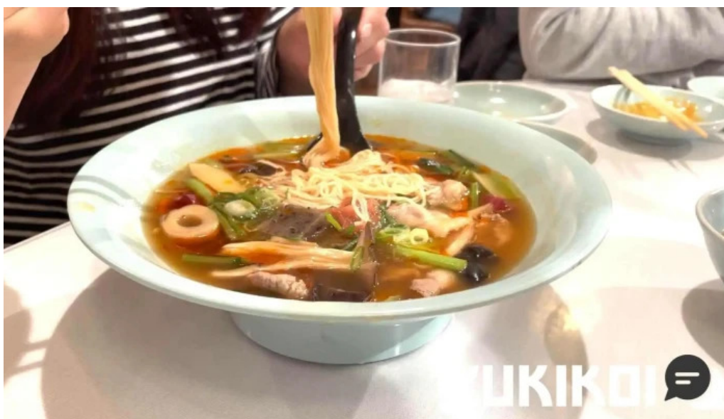
美食人 エピキュア 歓歡ほあんほあん 麺