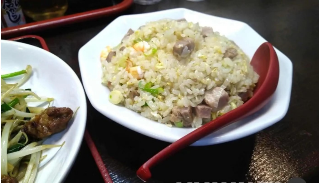
中華料理 小龍姫 焼き飯