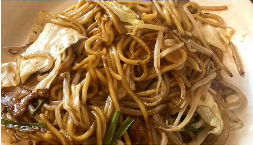
中華料理 小龍姫 住所