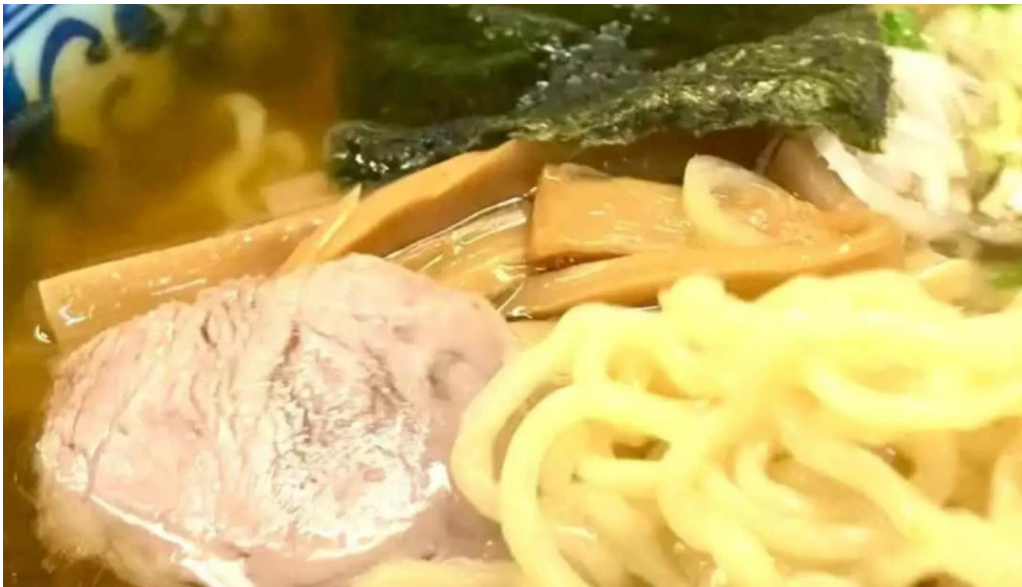
中華料理 小龍姫 動画