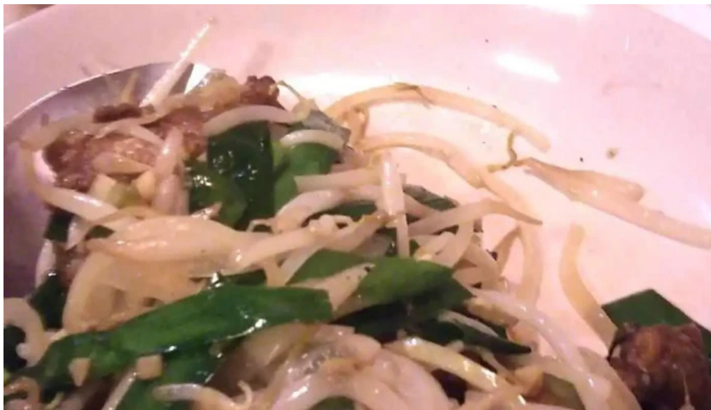
中華料理 小龍姬 麵