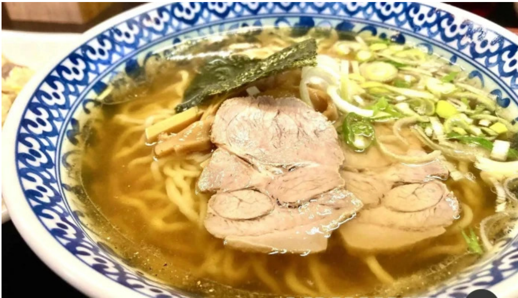
中華料理 小龍姫 ラーメン