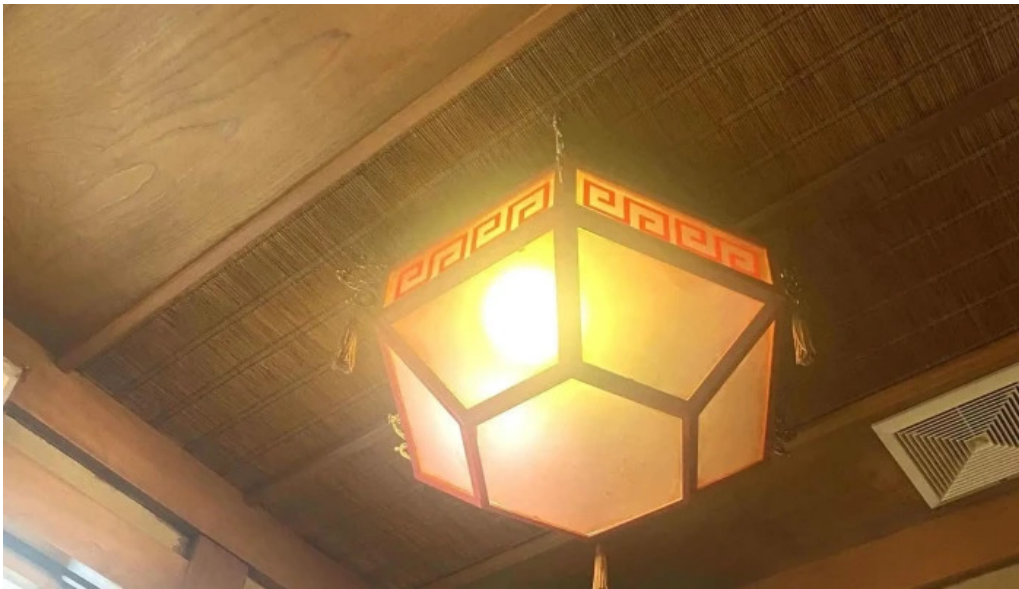
中華料理 小龍姫 営業中