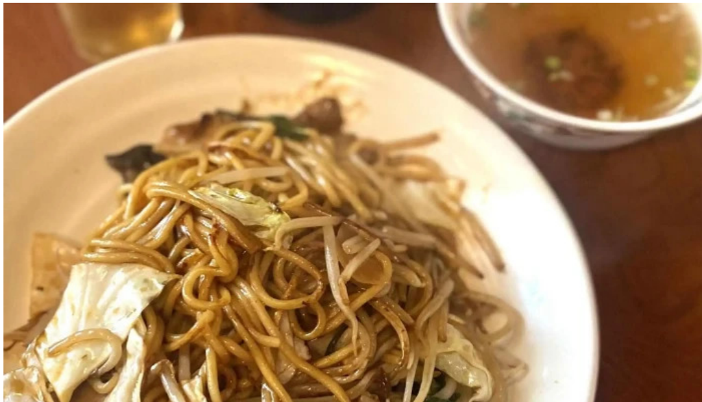
中華料理 小龍姫 番号