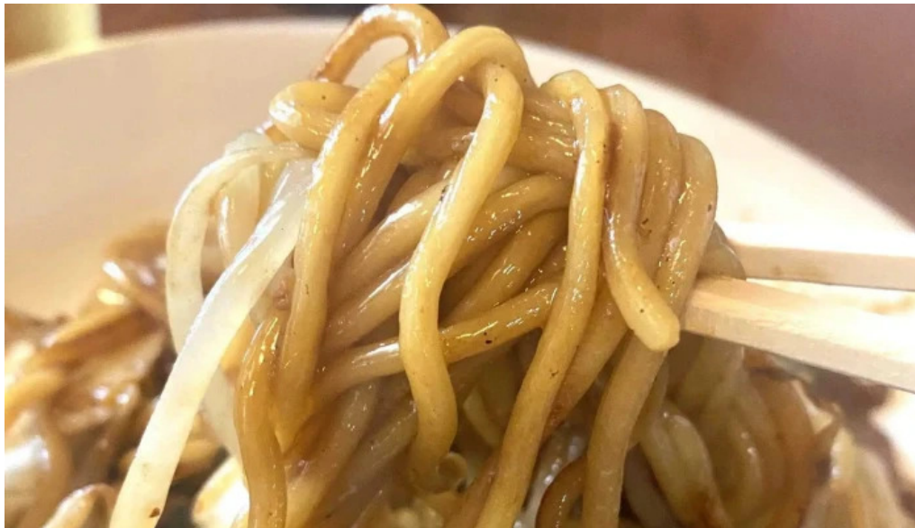
中華料理 小龍姫 コメント