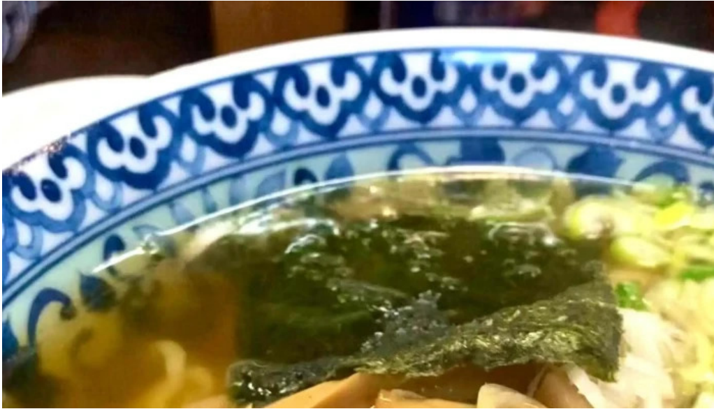
中華料理 小龍姫 どこ