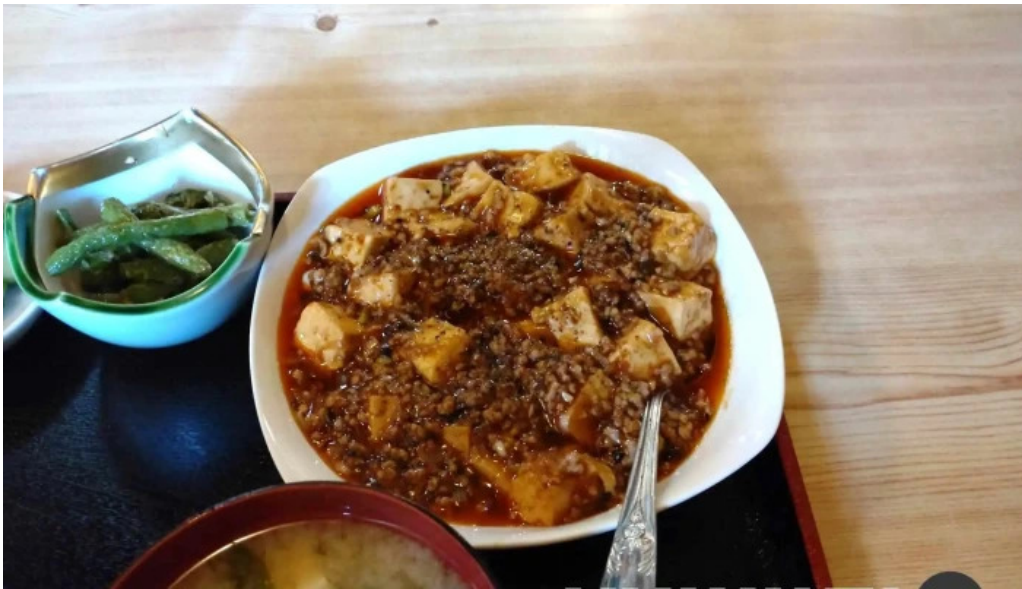
中華料理 小龍姫 料理飲み物