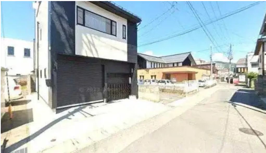
中華料理 小龍姫 南陽市