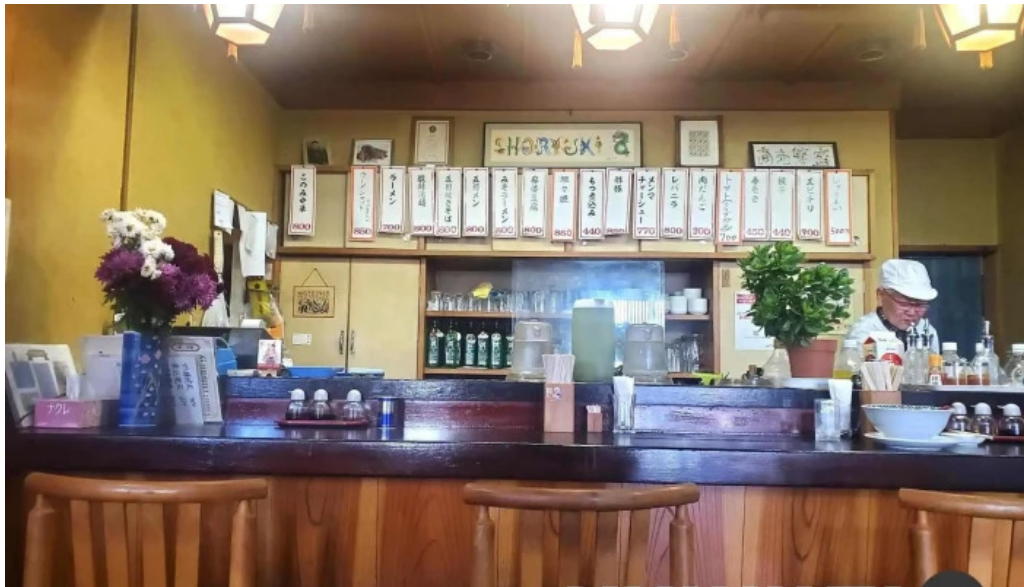
中華料理 小龍姫 雰囲気