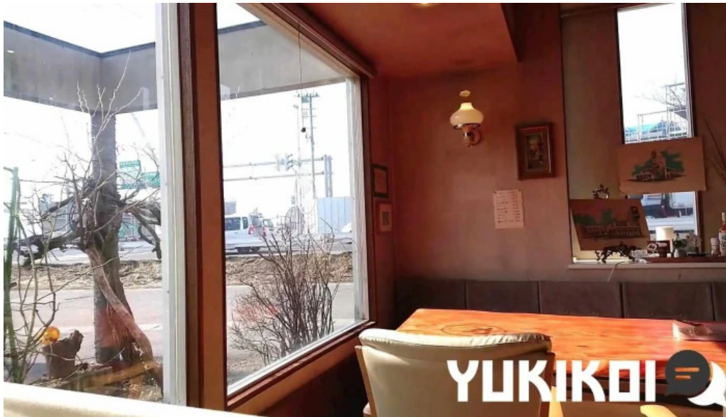
有風月堂 本店 動画