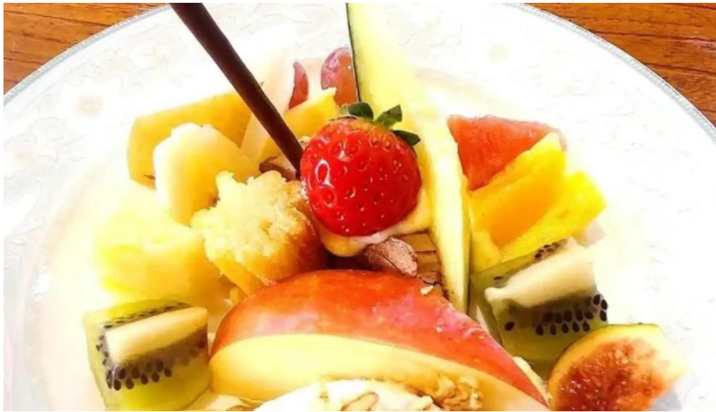
有風月堂 本店 最新