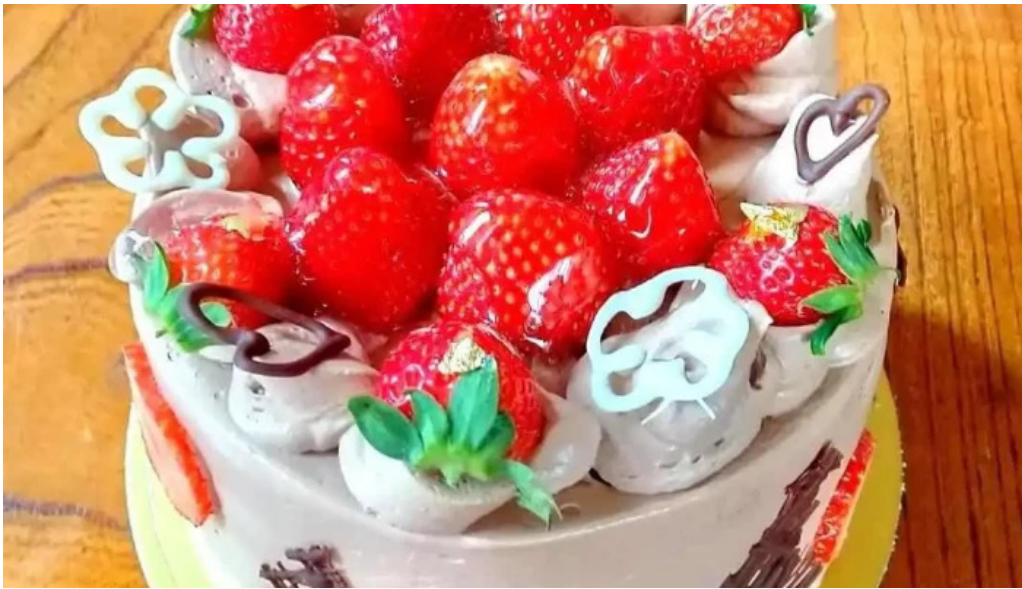
有風月堂 本店 ケーキ