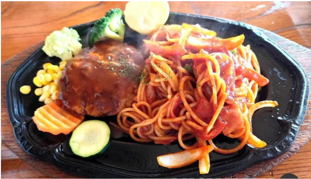
有風月堂 本店 ナポリタン