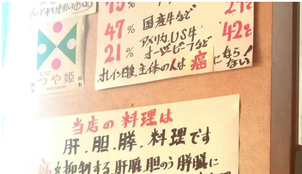
有風月堂 本店 instagram