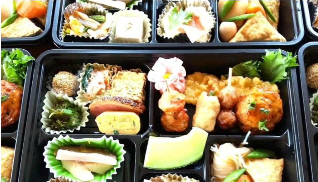
有風月堂 本店 弁当