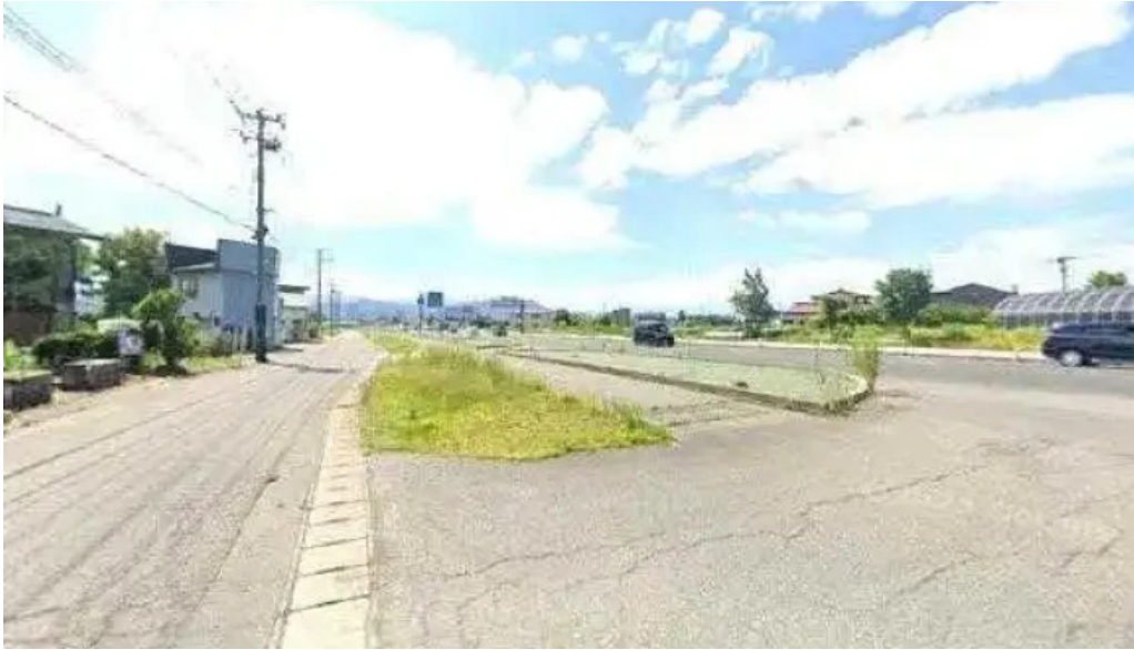
有風月堂 本店 高島町