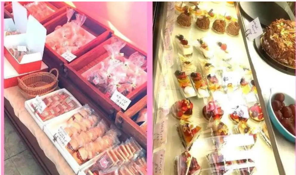
(有) 風月堂 本店 高畠町