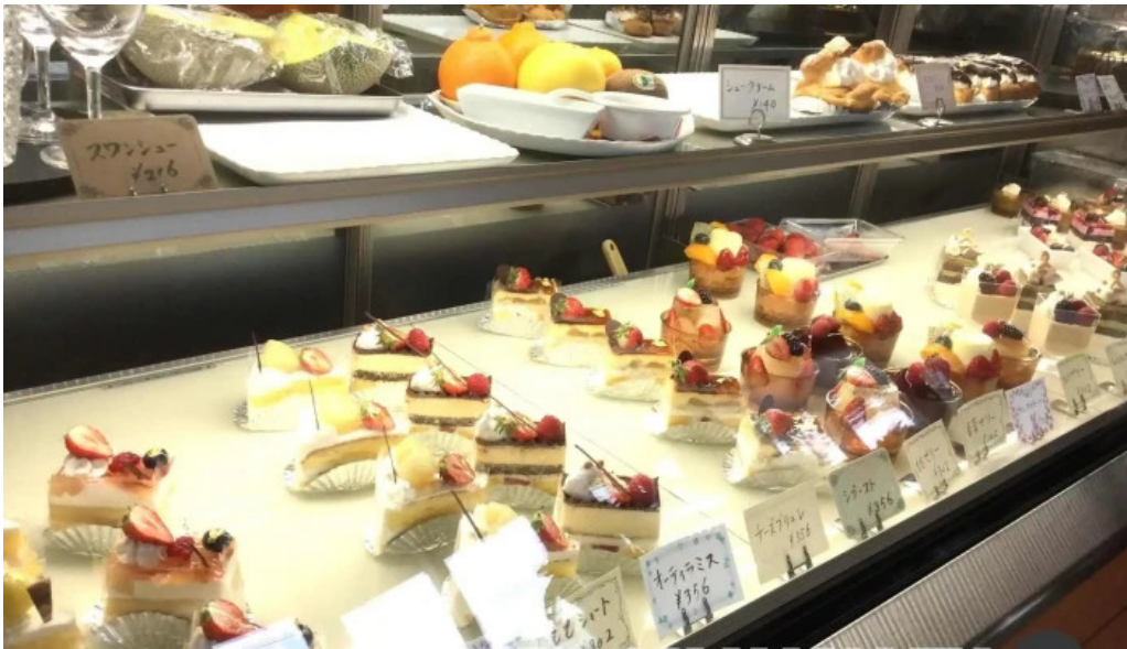
有風月堂 本店 雰囲気