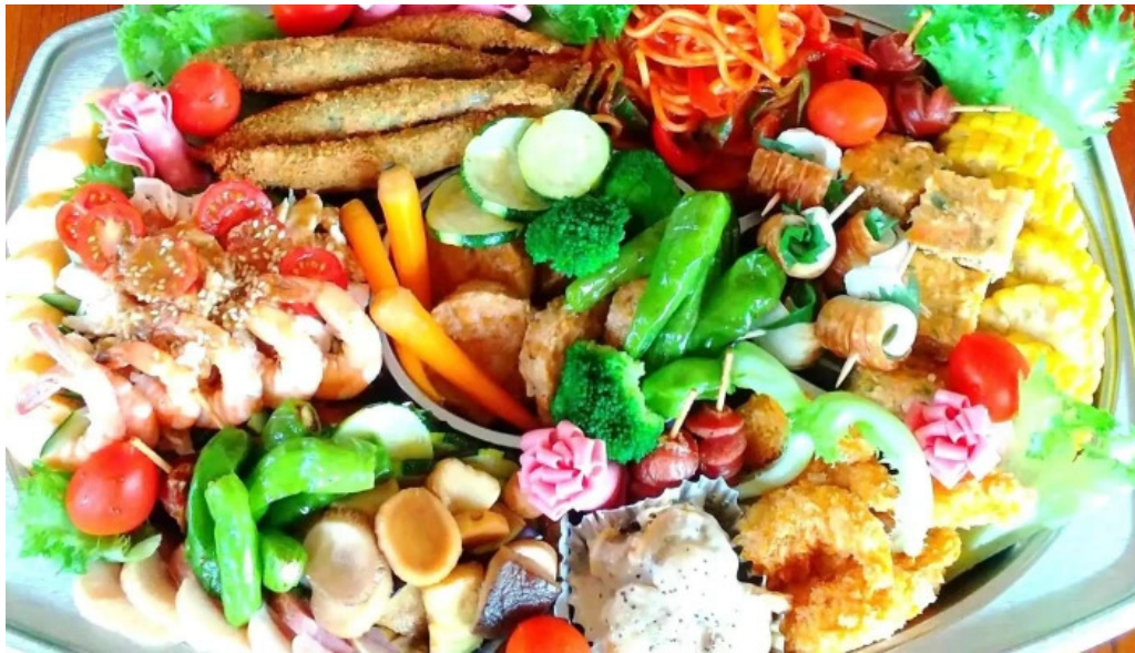
有風月堂 本店 料理飲み物