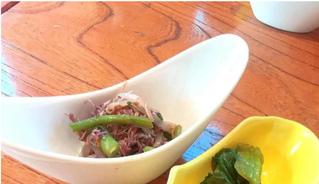
有風月堂 本店 スコア