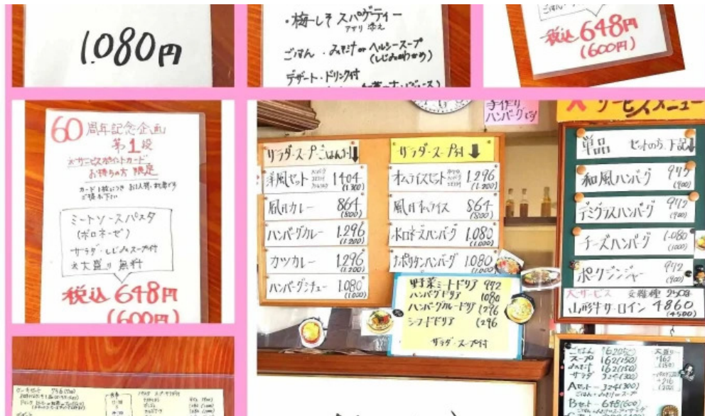
有風月堂 本店 メニュー