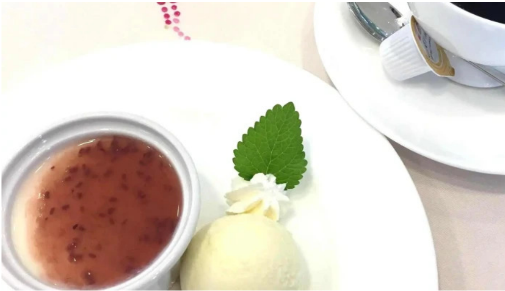
カフェレストラン poco a poco スコア