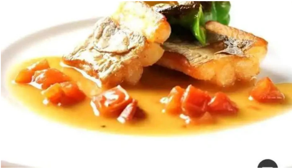
カフェレストラン poco a poco 料理飲み物