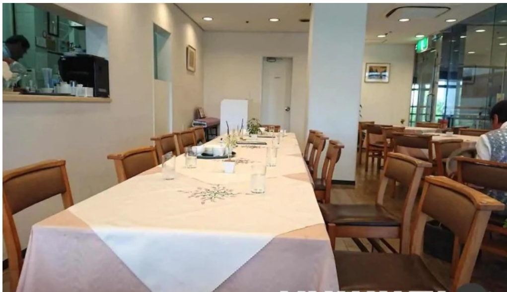
カフェ レストラン poco a poco 長岡京市