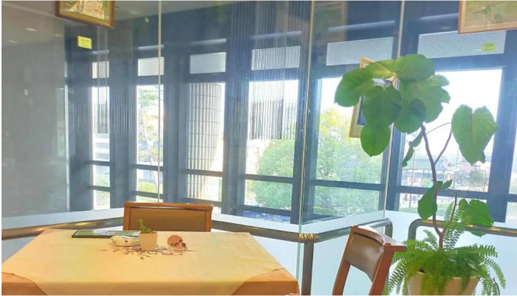
カフェレストラン poco a poco 近く