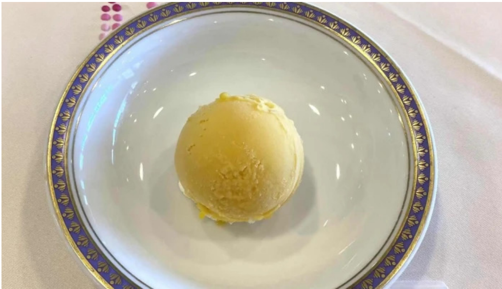
カフェレストラン poco a poco コメント