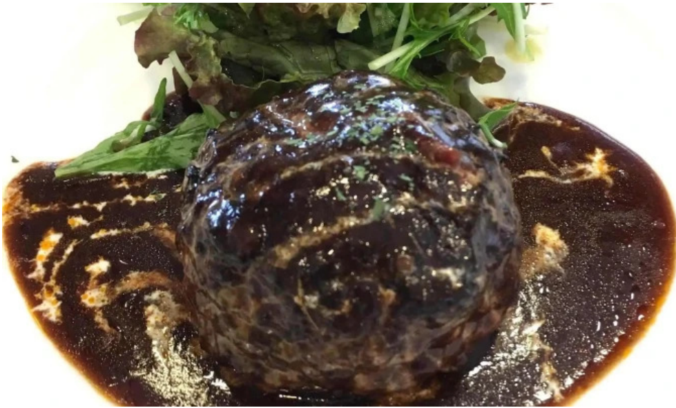
カフェレストラン poco a poco 所在地