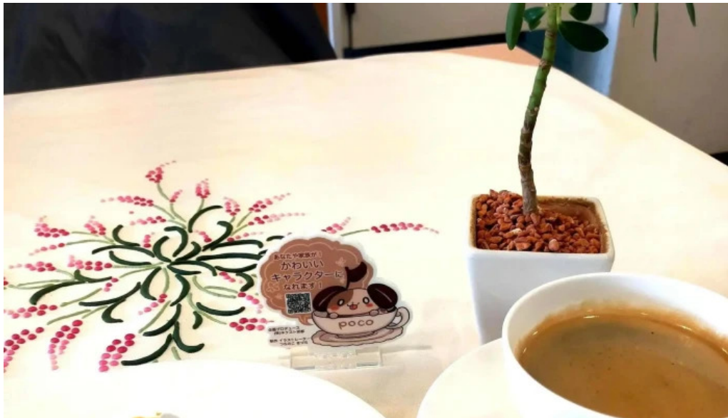
カフェレストラン poco a poco ウェブサイト