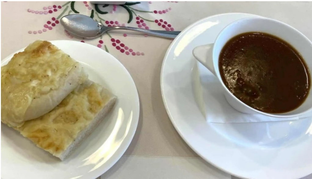
カフェレストラン poco a poco 行き方