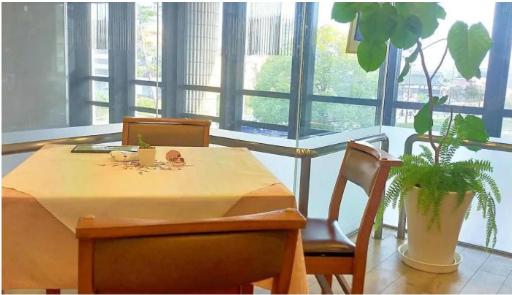
カフェレストラン poco a poco 雰囲気