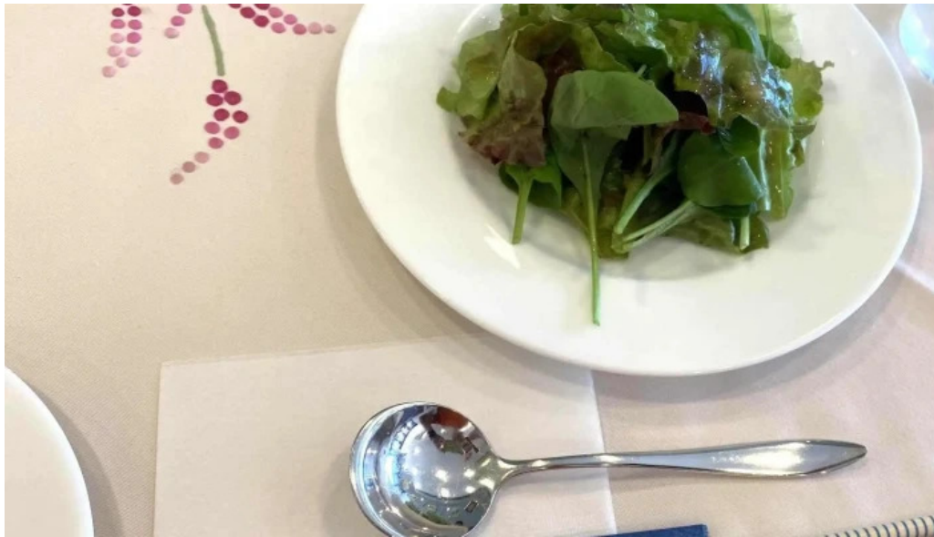
カフェレストラン poco a poco 口コミ