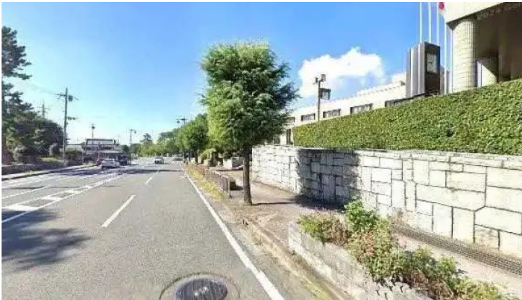
カフェレストラン poco a poco 長岡京市