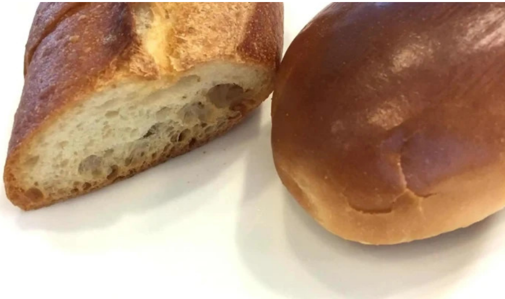
カフェレストラン poco a poco カタログ