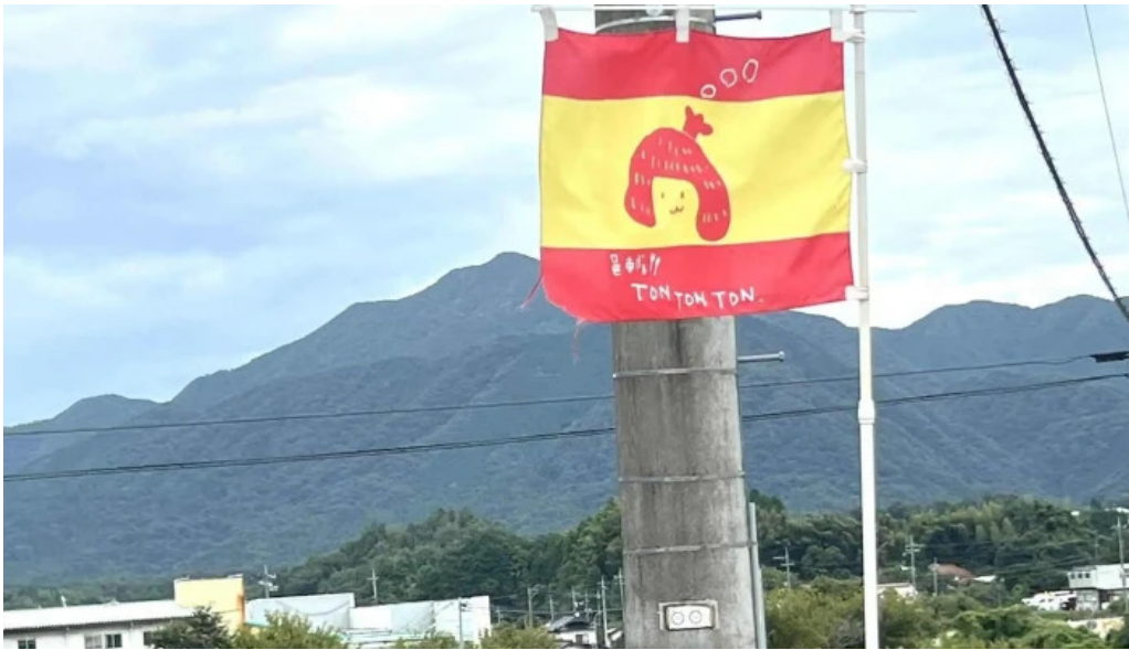
邑南バル ton ton ton comentario 6