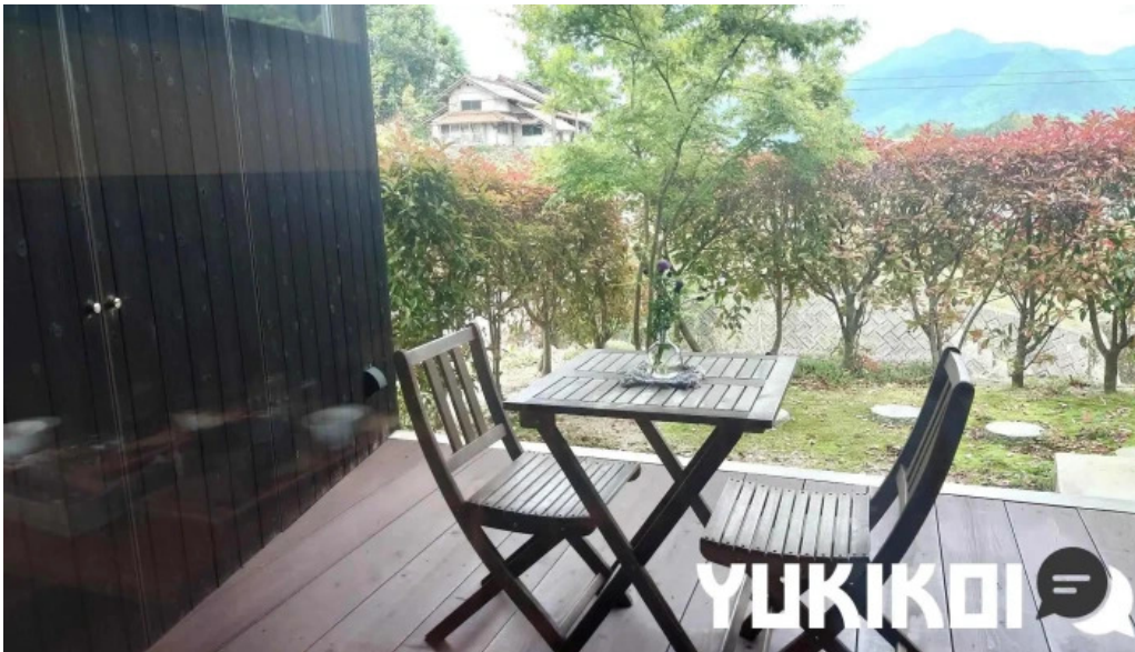
邑南バル ton ton ton すべて