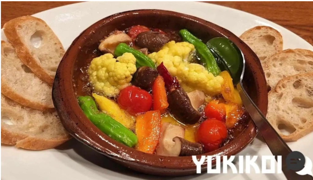
邑南バル ton ton ton 動画