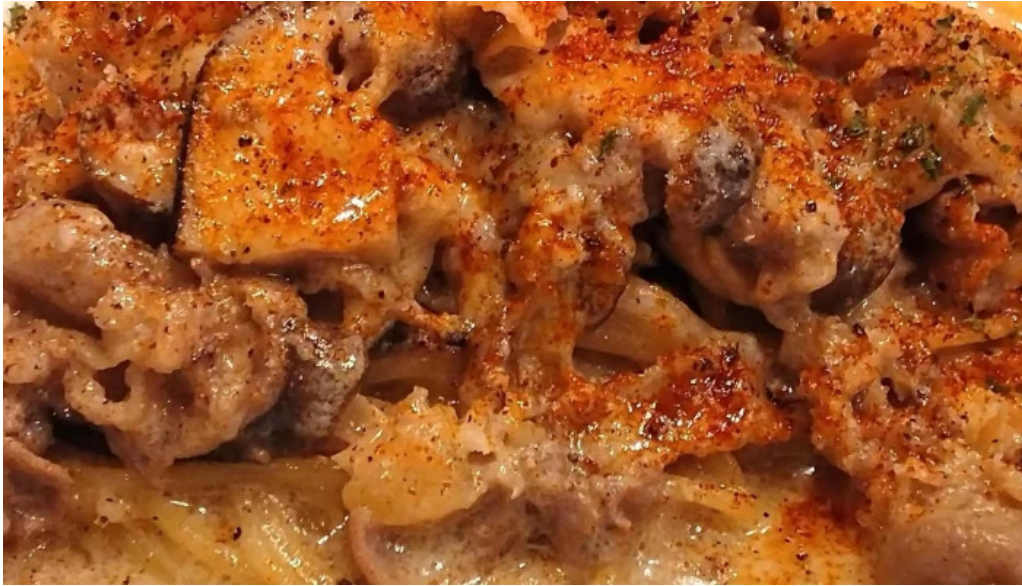
邑南バル ton ton ton comentario 2