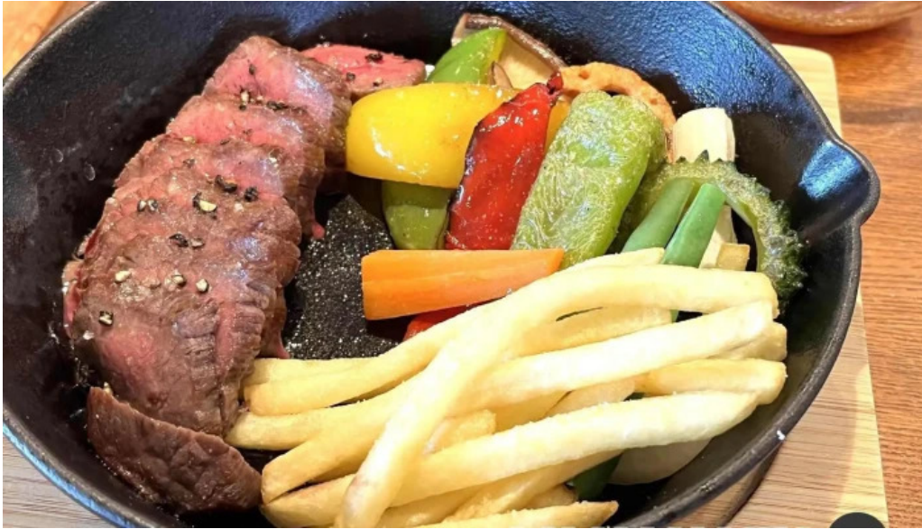
邑南バル ton ton ton ステーキ