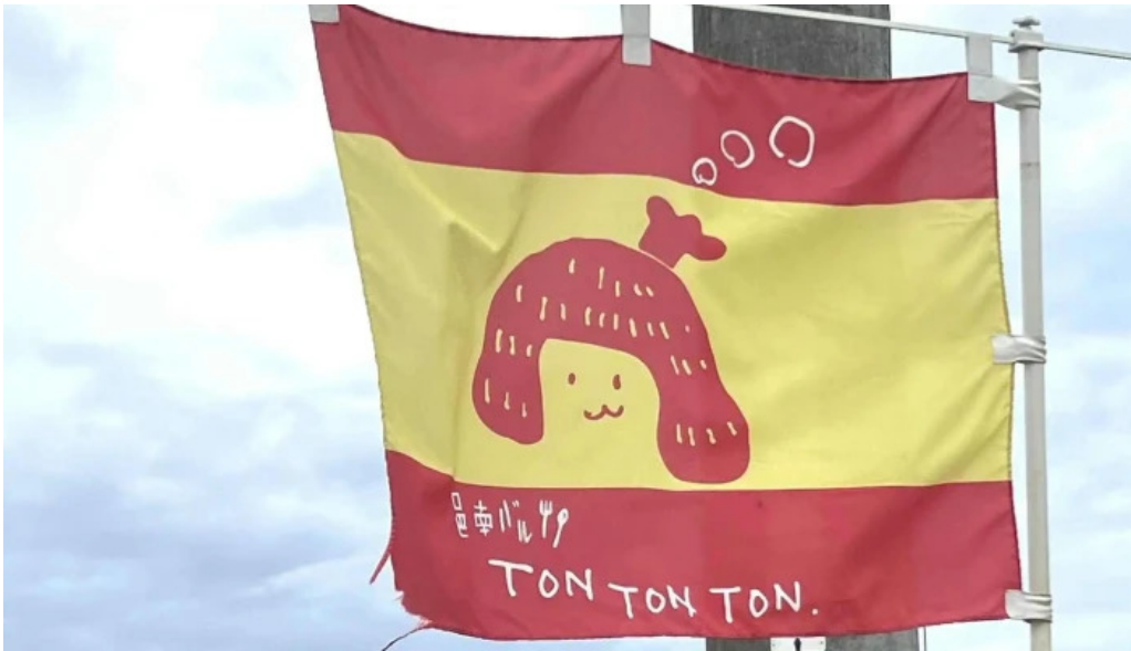
邑南バル ton ton ton comentario 7