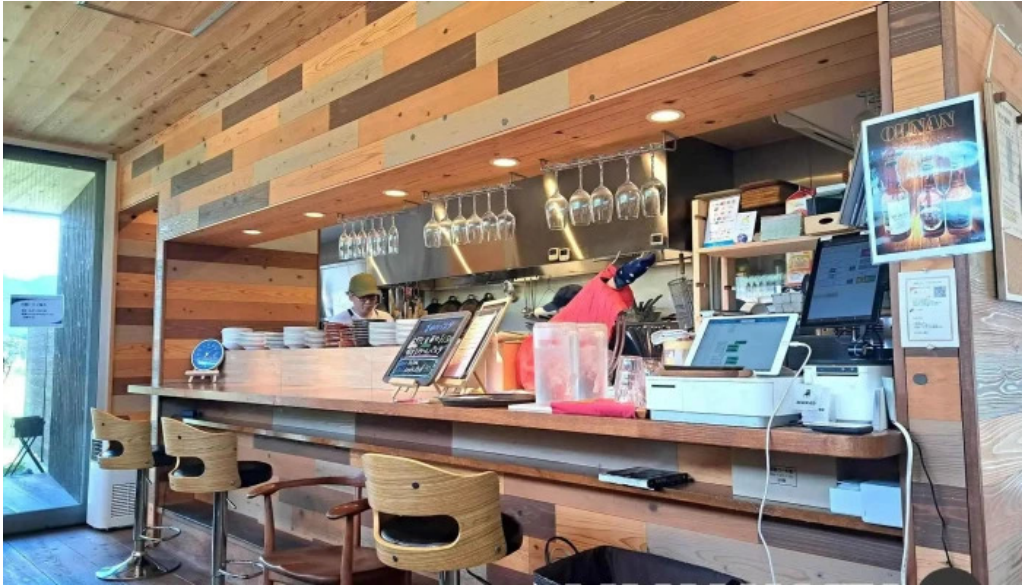
邑南バル ton ton ton 雰囲気