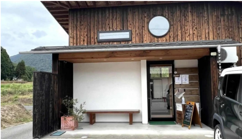
邑南バル ton ton ton comentario 5