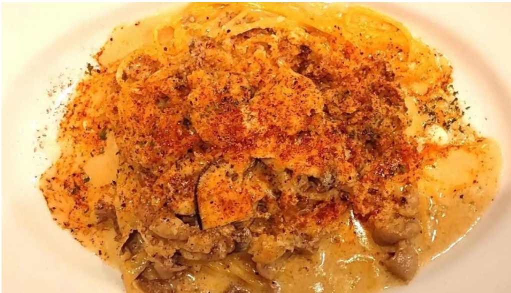
邑南バル ton ton ton comentario 1