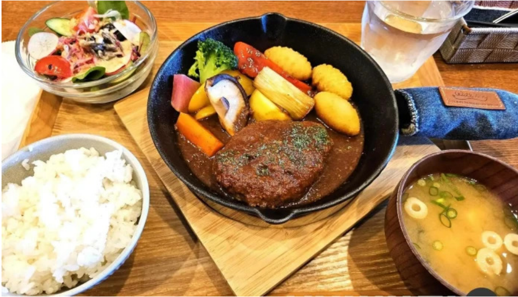
邑南バル ton ton ton 料理飲み物