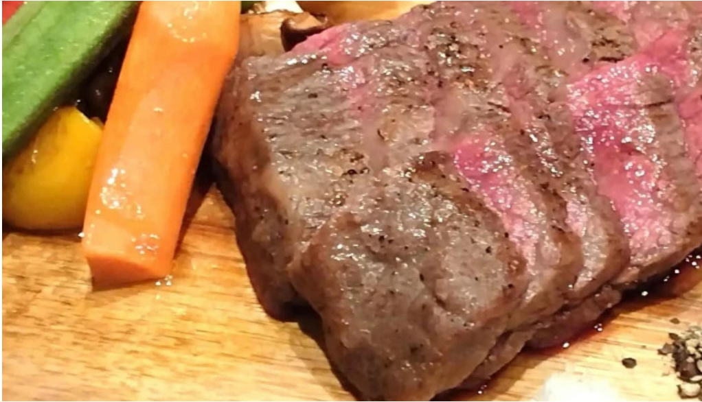
邑南バル ton ton ton comentario 4