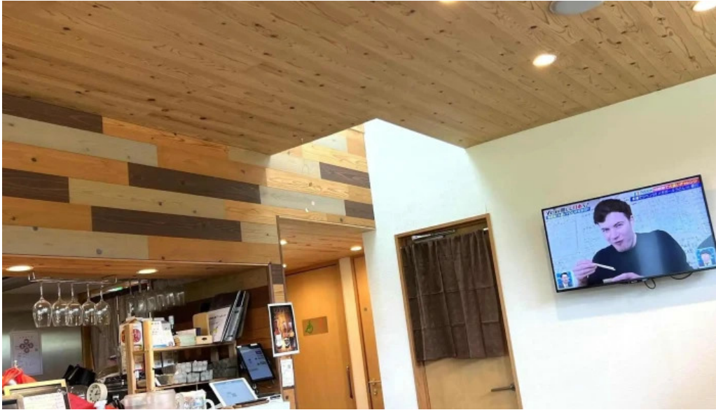
邑南バル ton ton ton comentario 8