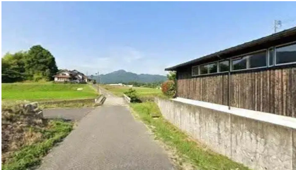
邑南バル ton ton ton ストリートビューと 360ビュー