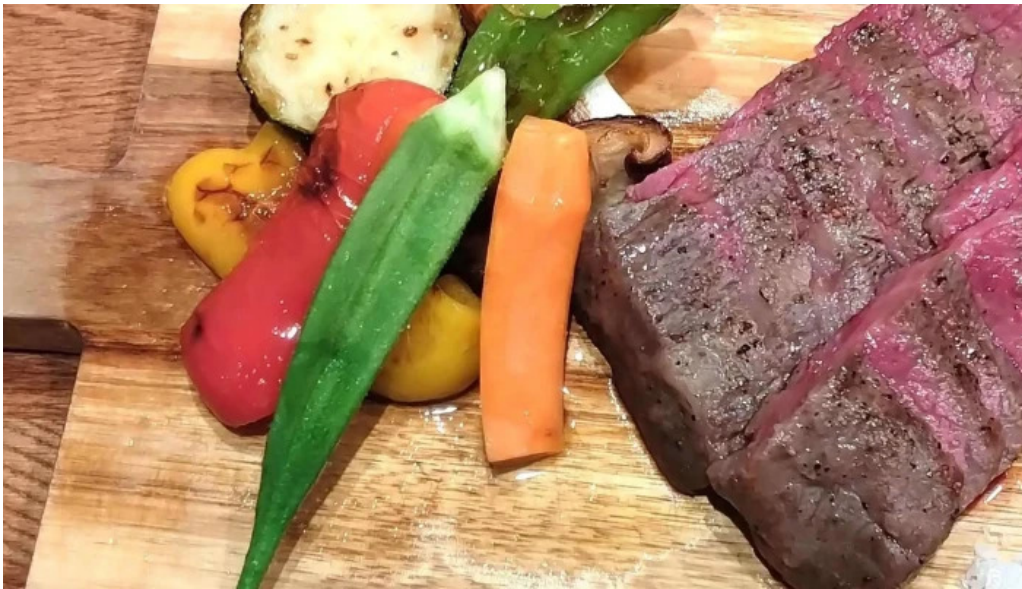
邑南バル ton ton ton comentario 3