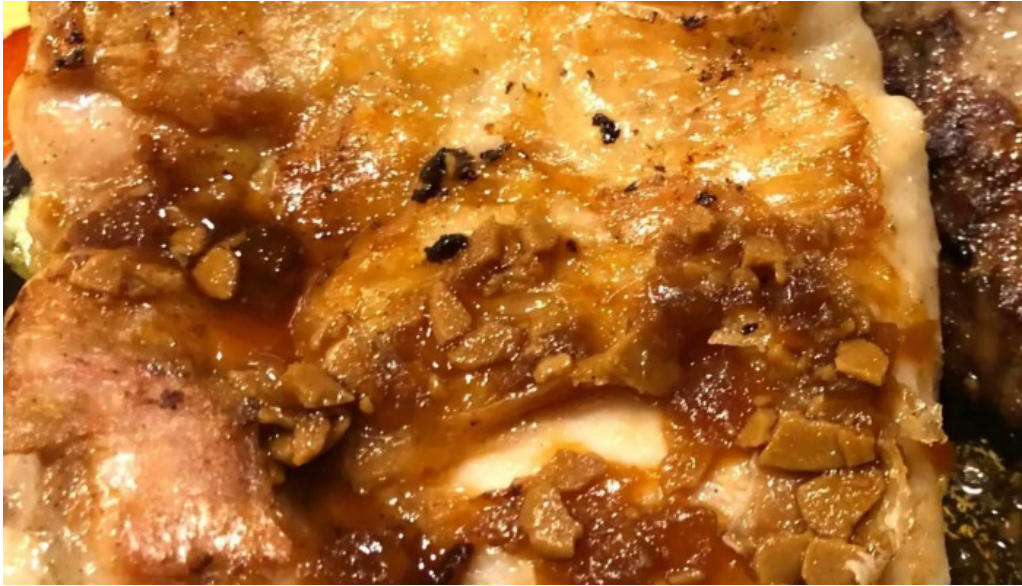
ジョイフル 観音寺中央店 割引