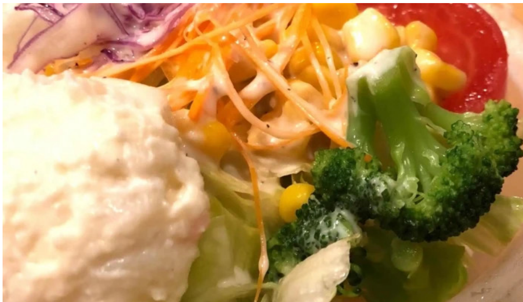
ジョイフル 観音寺中央店 プロモーション