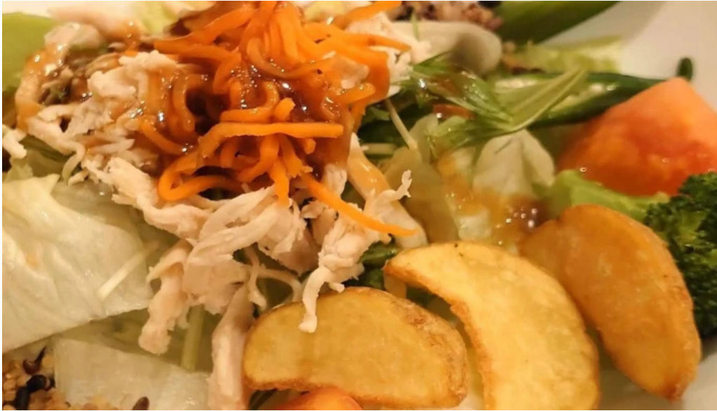
ジョイフル 観音寺中央店 ウェブサイト