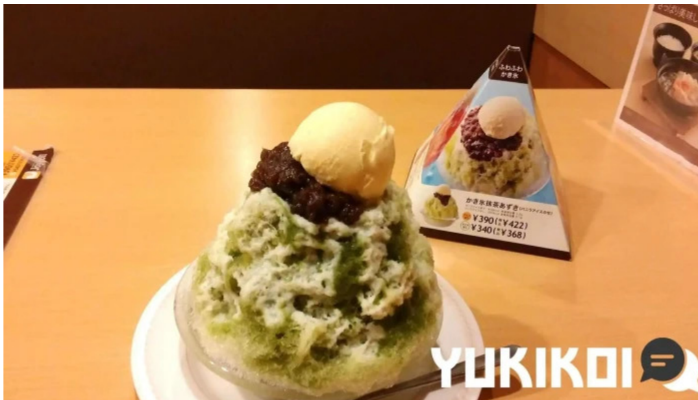
ジョイフル 観音寺中央店 かき氷