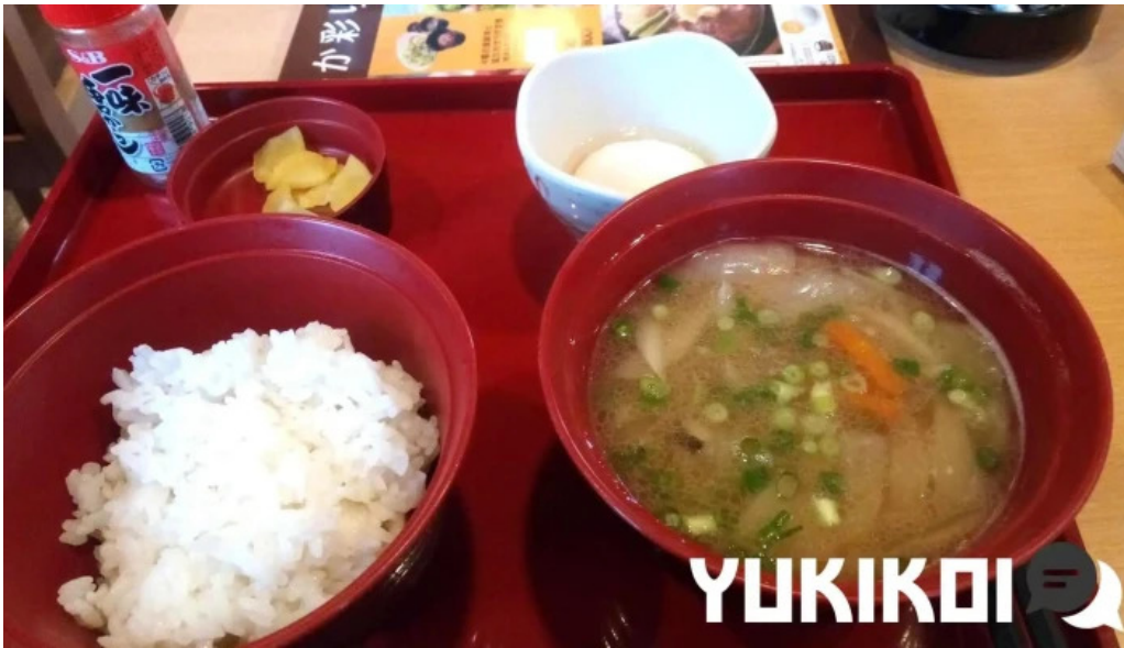
ジョイフル 観音寺中央店 味噌汁