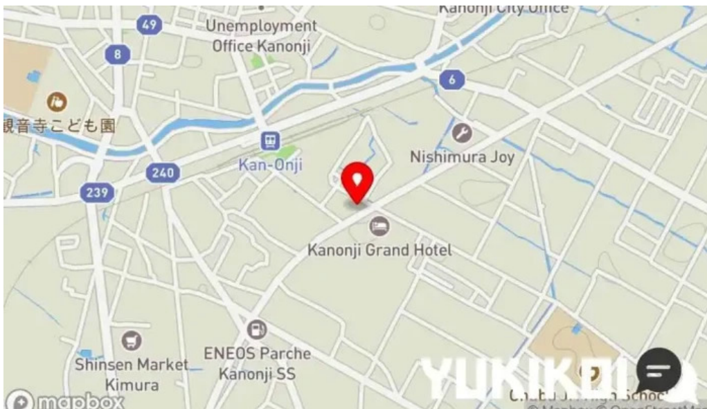
ジョイフル 観音寺中央店 地図