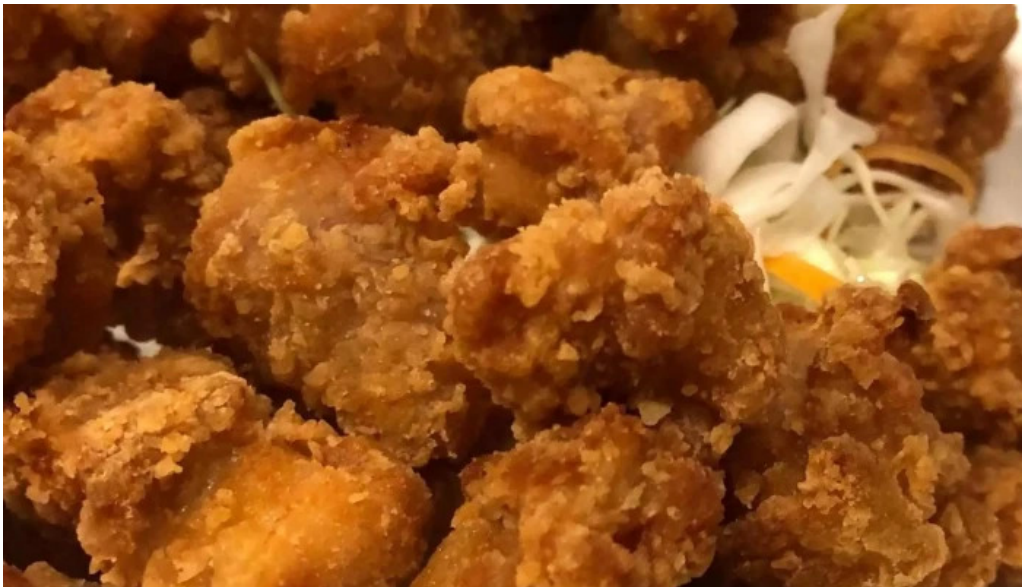
ジョイフル 観音寺中央店 カタログ