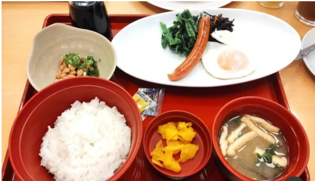
ジョイフル 観音寺中央店 料理飲み物