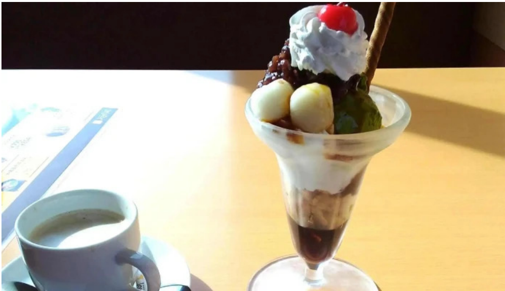
ジョイフル 観音寺中央店 どこ