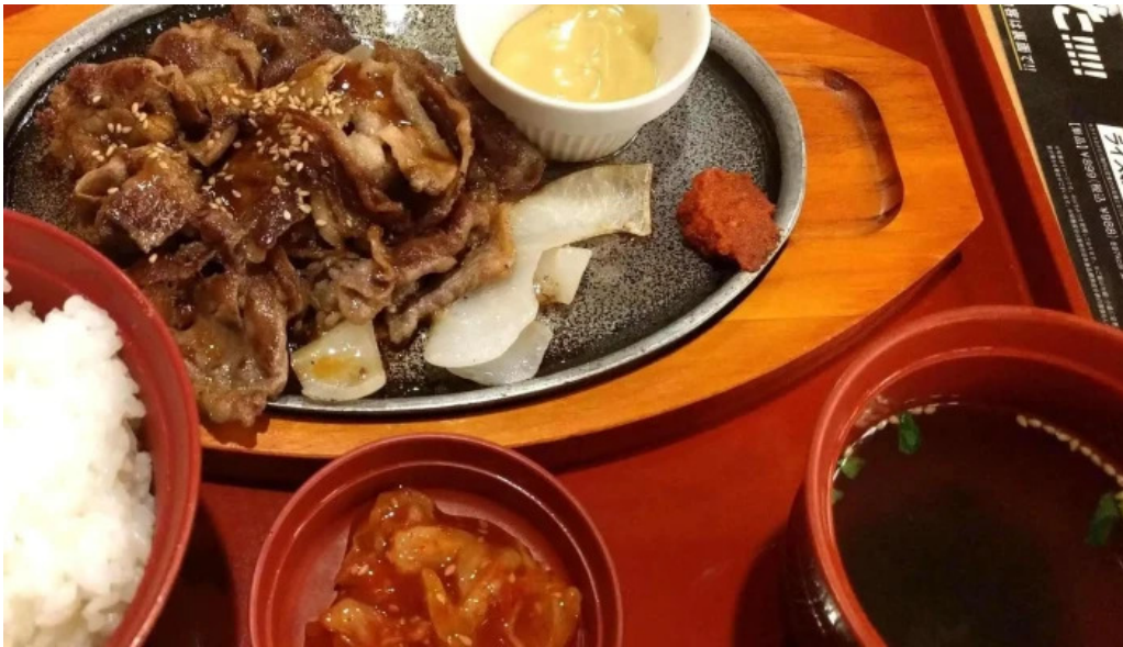
ジョイフル 観音寺中央店 写真