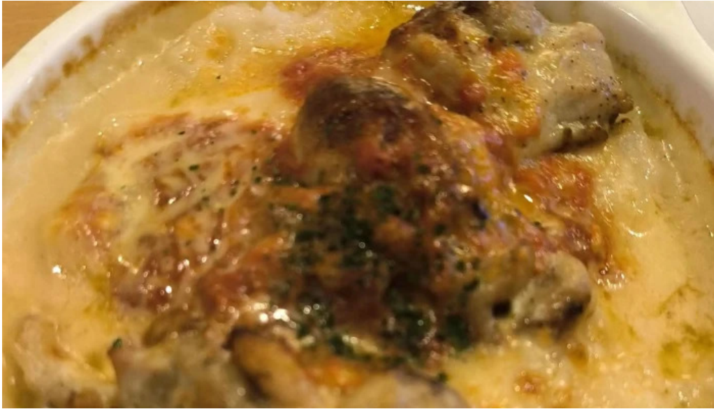
ジョイフル 観音寺中央店 コメント