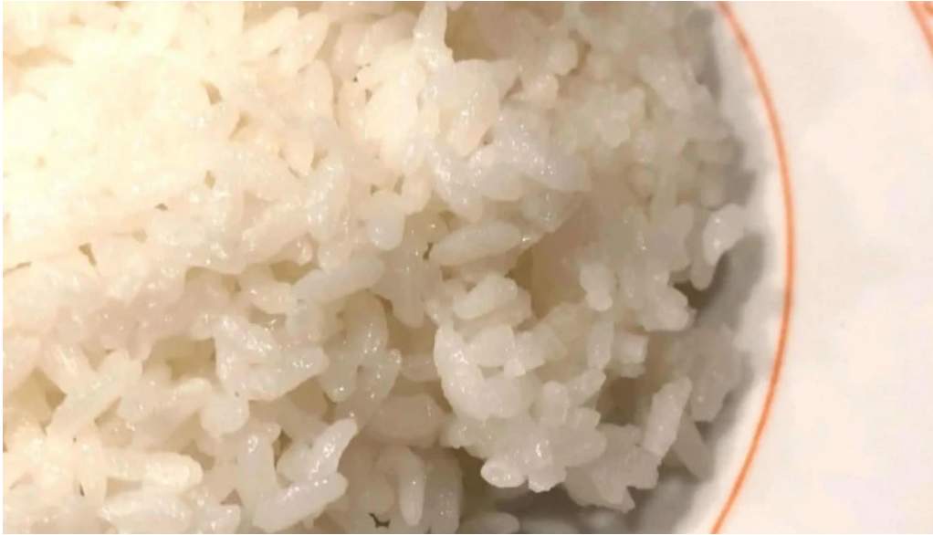
ジョイフル 観音寺中央店 営業中