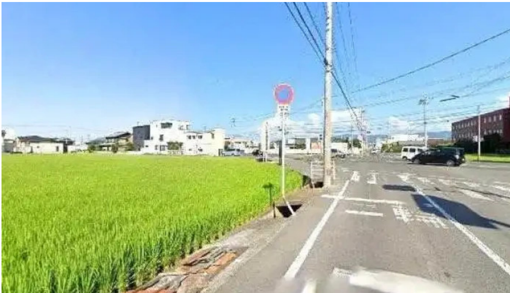
ジョイフル 観音寺中央店 観音寺市