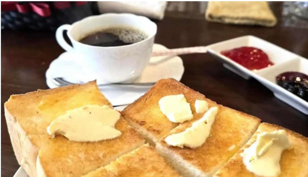
Jia kahue tanpopo Liao Li Yin miWu