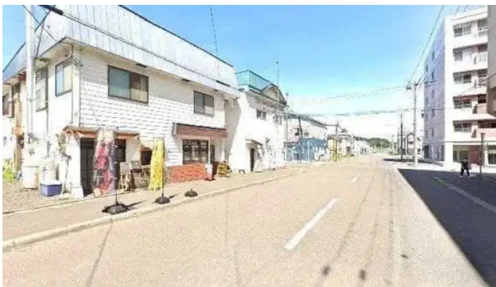
Jia kahue tanpopo sutori tobiyu to 360 biyu