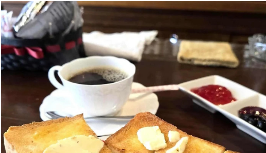
Jia kahue tanpopo comentario 3