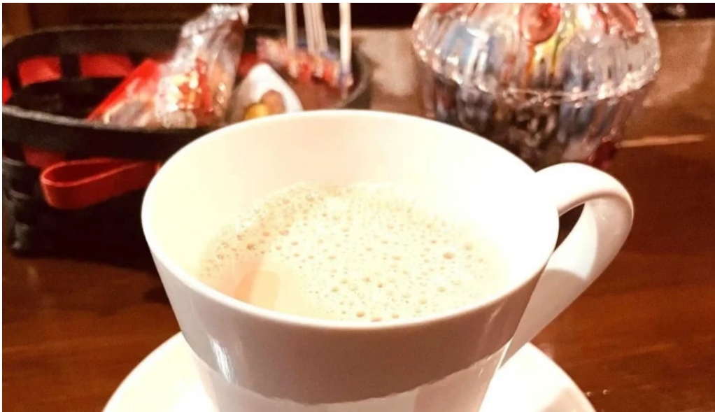
Jia kahue tanpopo comentario 1