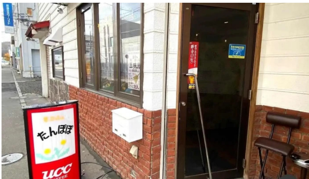
家かふえ たんぽぽ 網走市