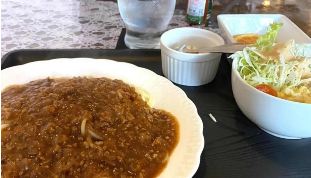
Jia kahue tanpopo comentario 2