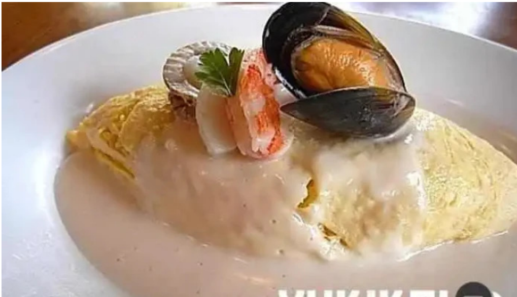
Kahue gurasuru tsu Liao Li Yin miWu