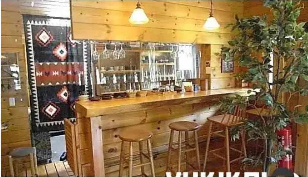
Kahue gurasuru tsu Fen Wei Qi