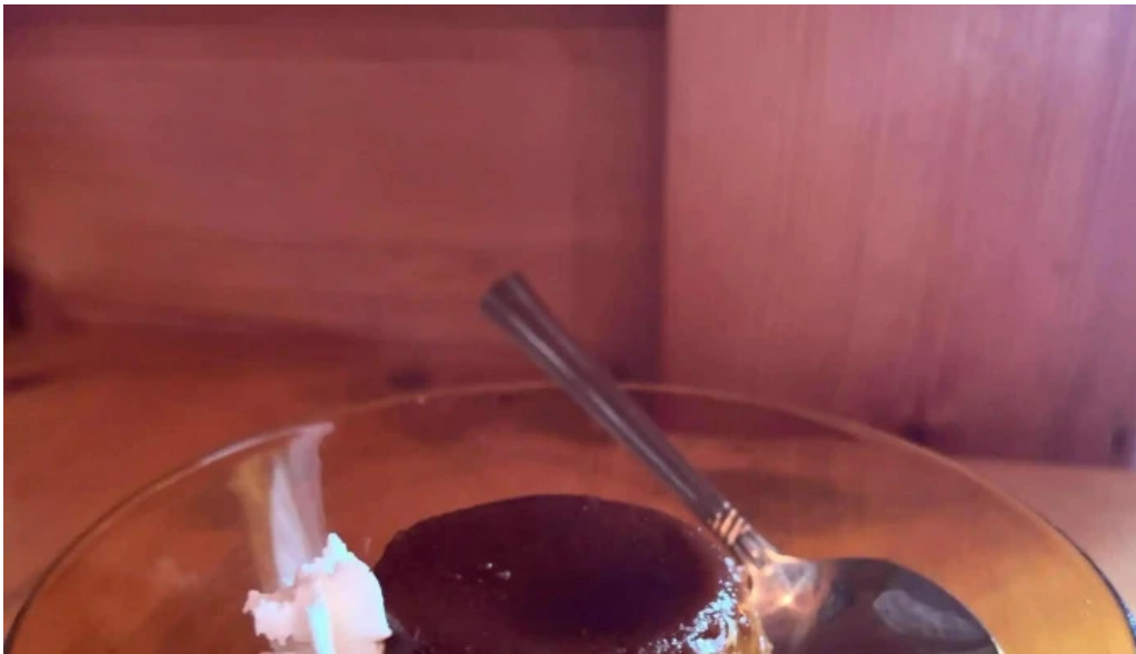
Kahue gurasuru tsu comentario 1