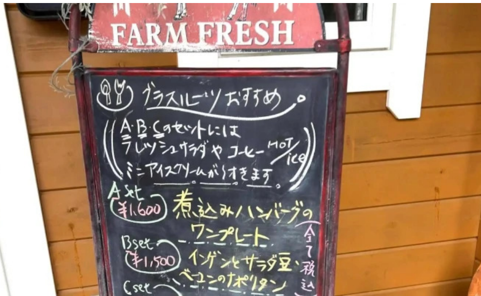
Kahue gurasuru tsu comentario 3