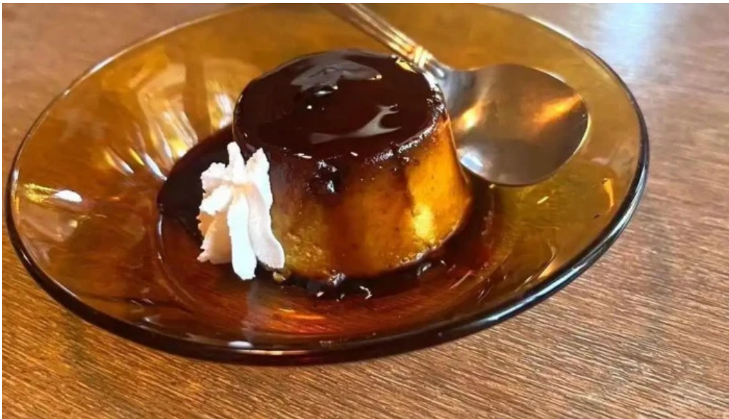
Kahue gurasuru tsu huran