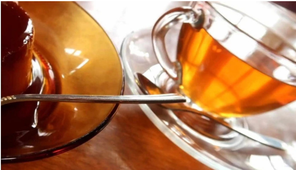
Kahue gurasuru tsu comentario 5