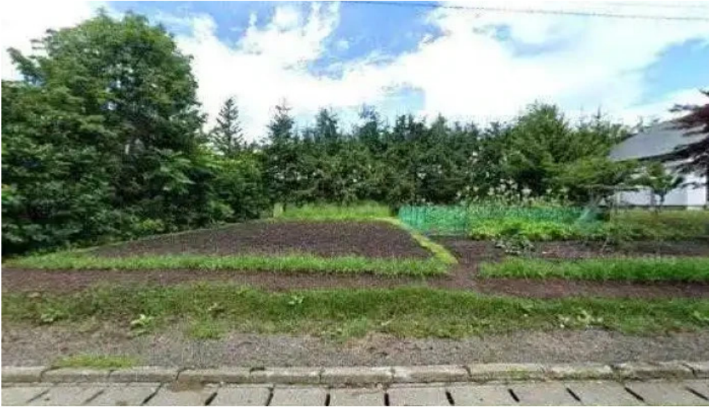
Kahue gurasuru tsu sutori tobiyu to 360 biyu