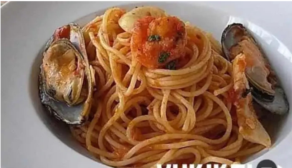
Kahue gurasuru tsu supagetsutei