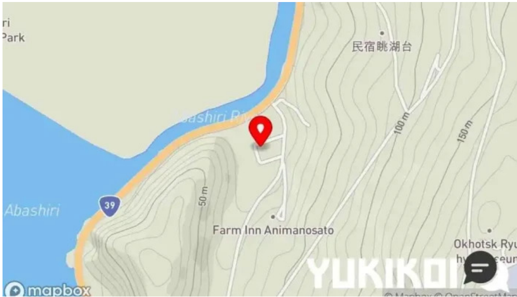
Kahue gurasuru tsu mapa