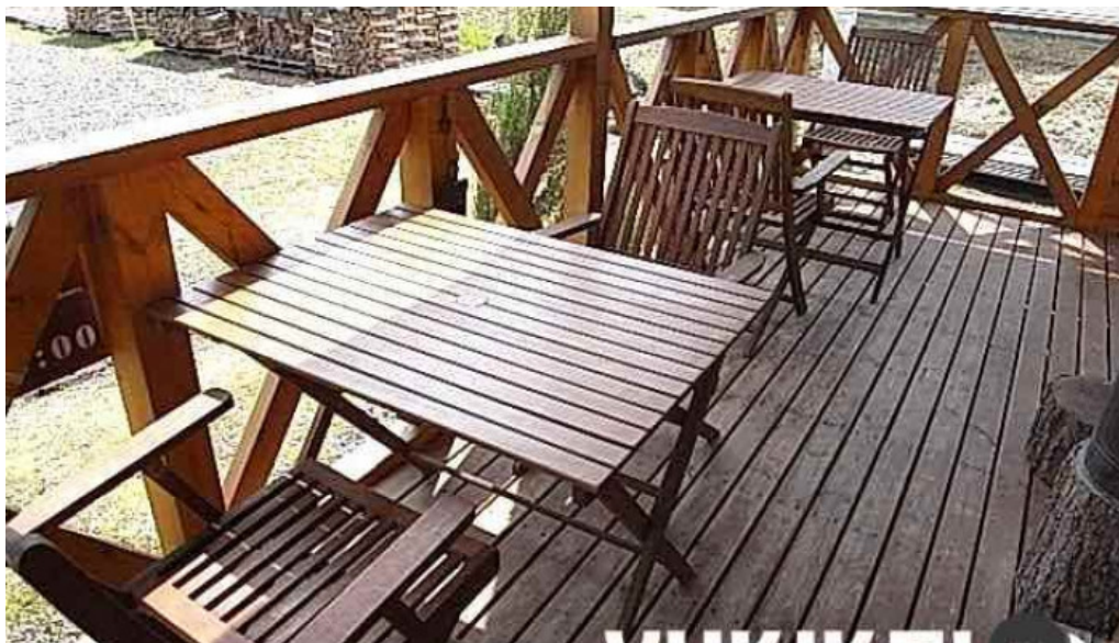
カフェ グラスルーツ 網走市