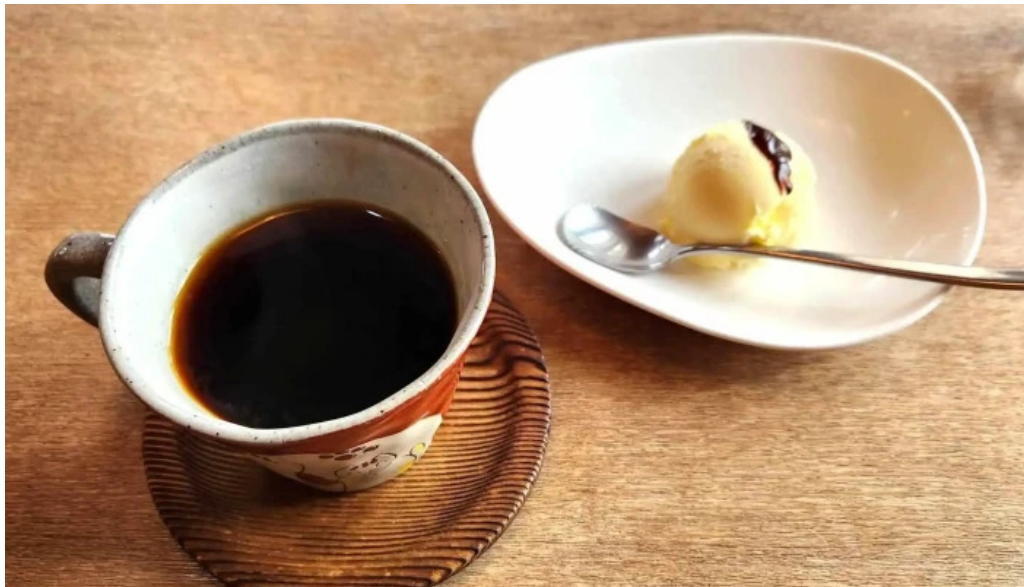
Kahue gurasuru tsu ko hi