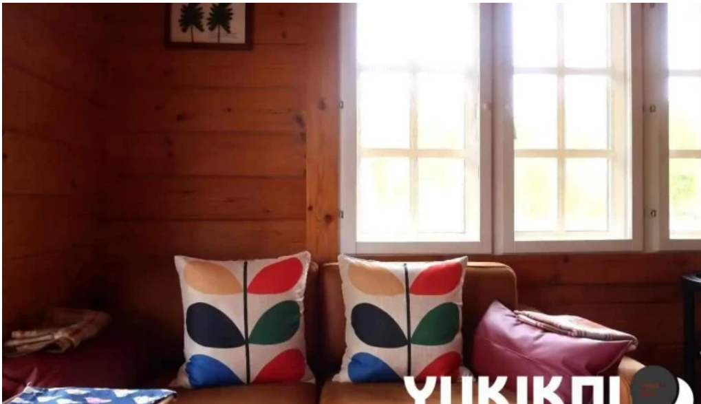
Kahue gurasuru tsu Zui Xin