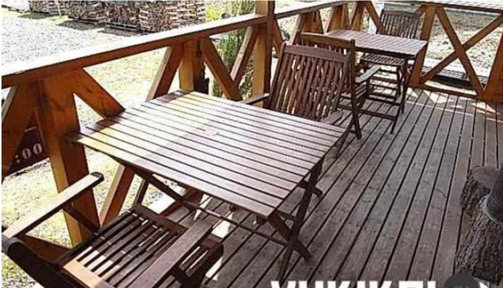
Kahue gurasuru tsu subete