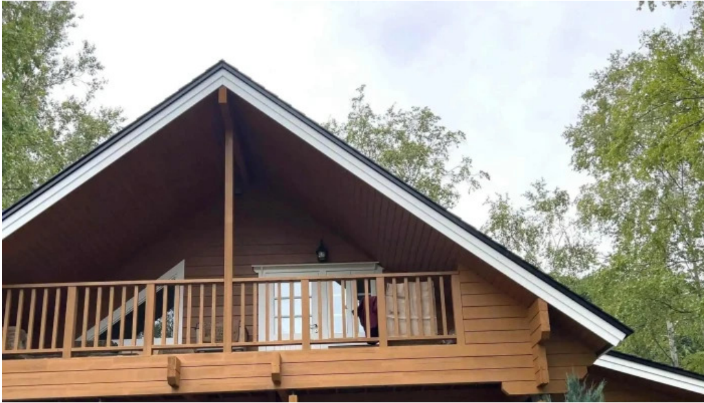
Kahue gurasuru tsu comentario 2