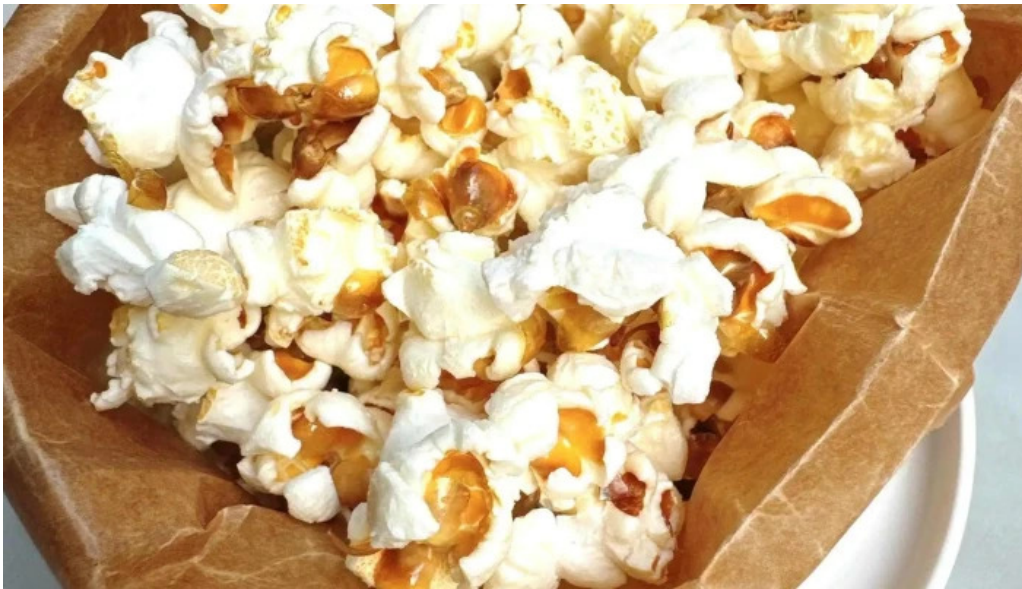
Domo nakameguro ピッツァとナチュラルワインと野菜 動画