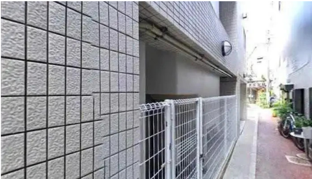
Domo nakameguro ピッツァとナチュラルワインと野菜 目黒区