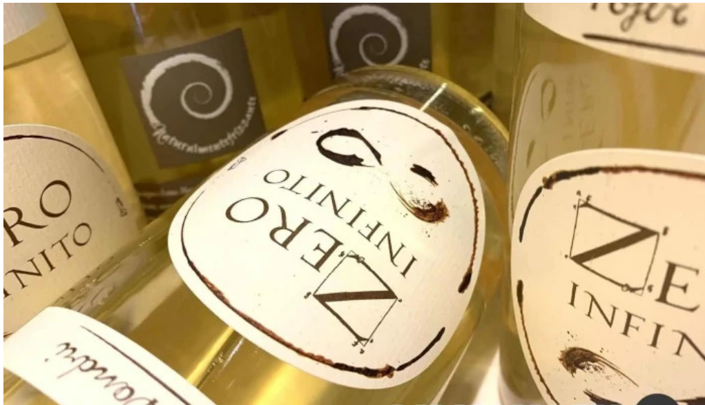
Domo nakameguro ピッツァとナチュラルワインと野菜