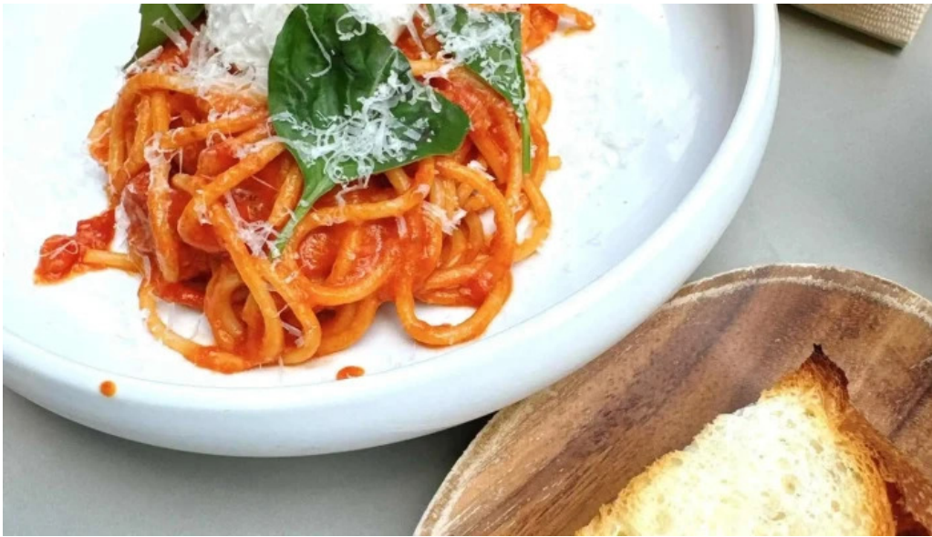
Domo nakameguro ピッツァとナチュラルワインと野菜 番号