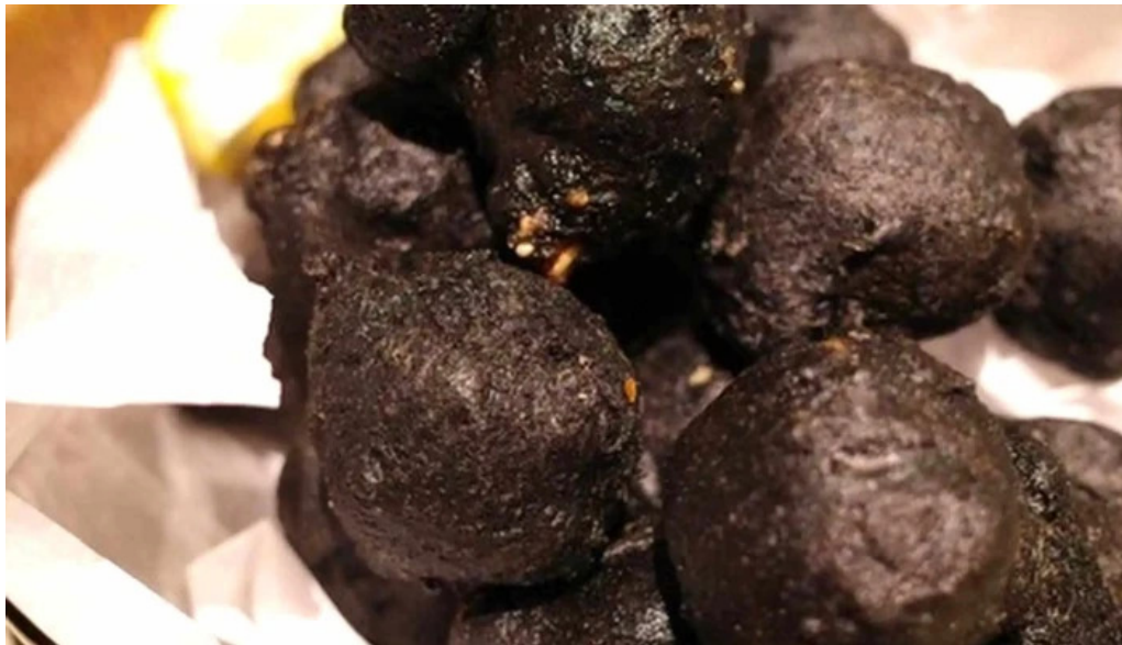
Domo nakameguro ピッツァとナチュラルワインと野菜 割引