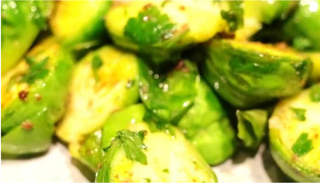
Domo nakameguro ピッツァとナチュラルワインと野菜 近く