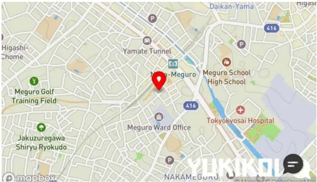
Domo nakameguro ピッツァとナチュラルワインと野菜 地図