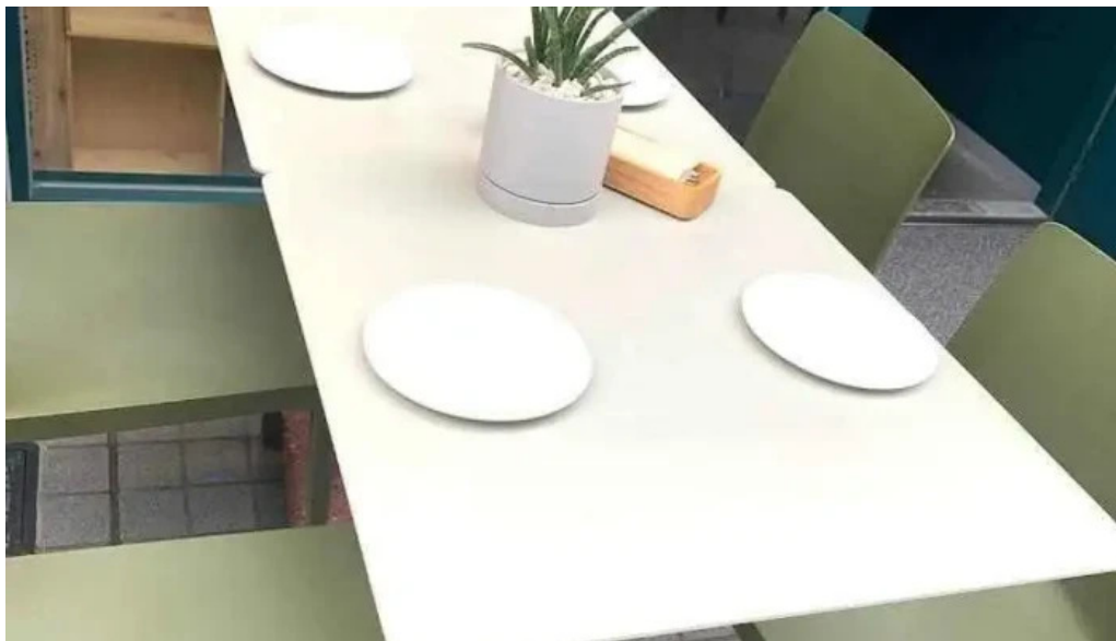
Domo nakameguro ～ピッツァとナチュラルワインと野菜～ 目黒区