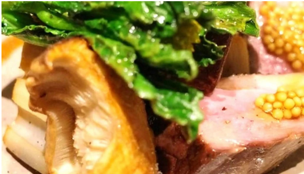
Domo nakameguro ピッツァとナチュラルワインと野菜 カタログ