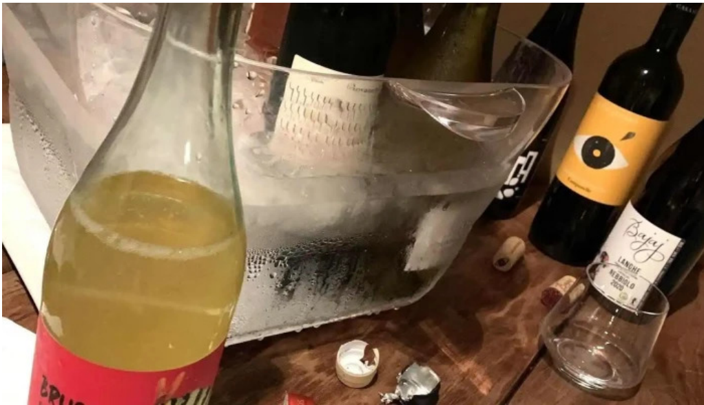
Domo nakameguro ピッツァとナチュラルワインと野菜 料理飲み物