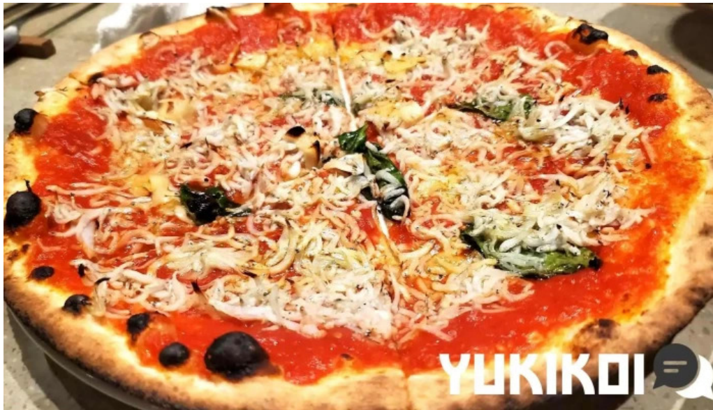
Domo nakameguro ピッツァとナチュラルワインと野菜 ピザ