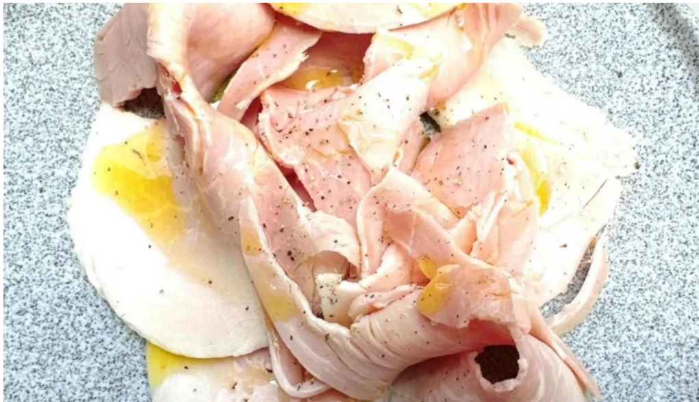
Domo nakameguro ピッツァとナチュラルワインと野菜 電話