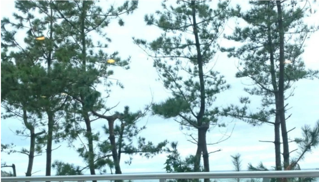
レストラン しおかぜ comentario 3