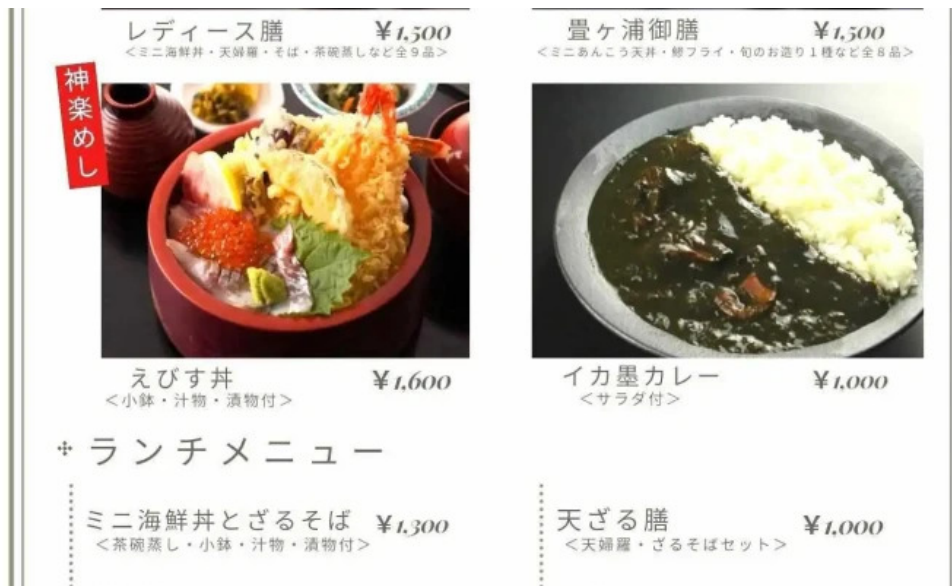
レストランしおかぜ メニュー