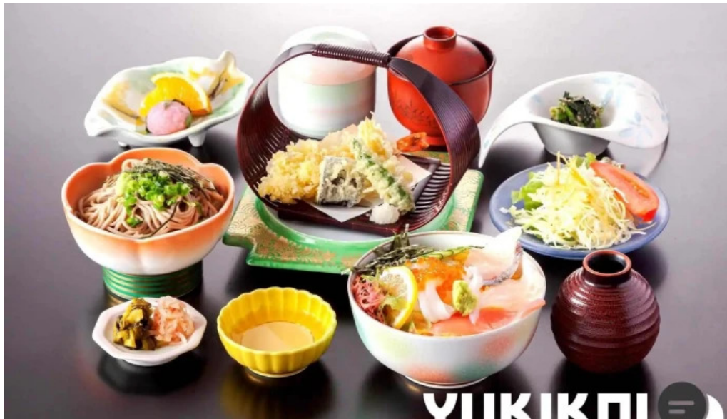
レストランしおかぜ 懐石