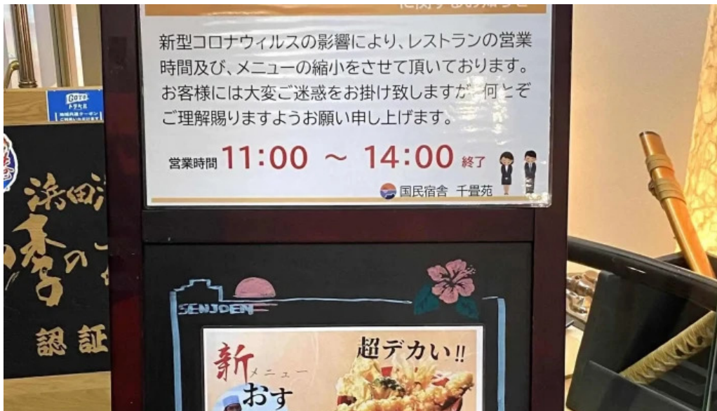
レストラン しおかぜ comentario 2