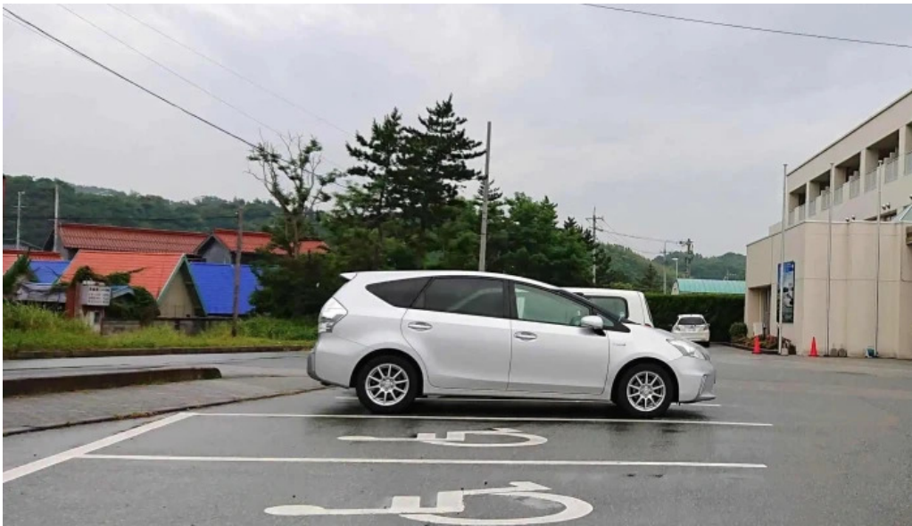
レストラン しおかぜ comentario 6