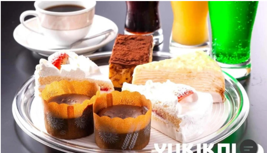
レストランしおかぜ 料理飲み物