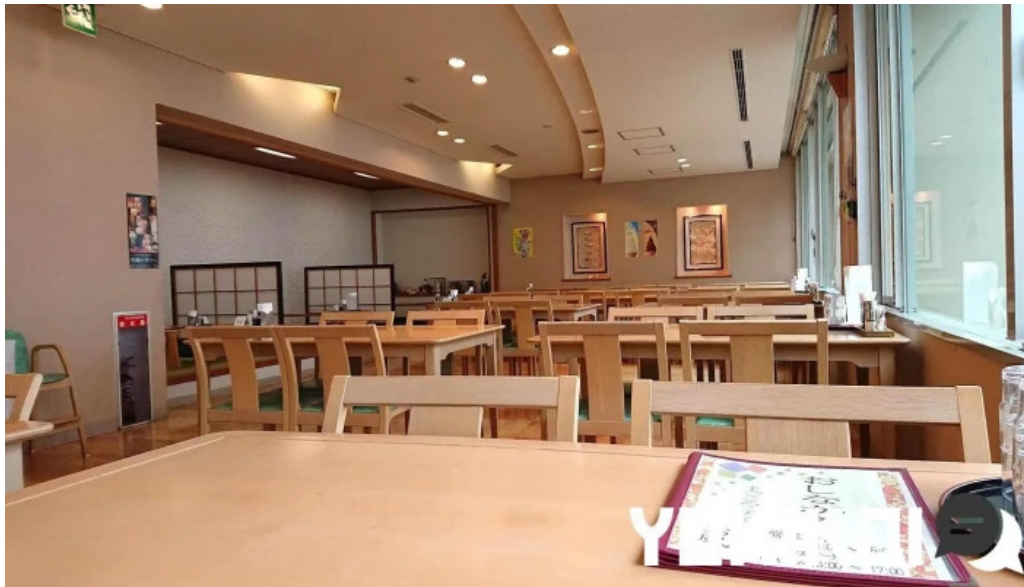
レストラン しかぜ 雰囲気