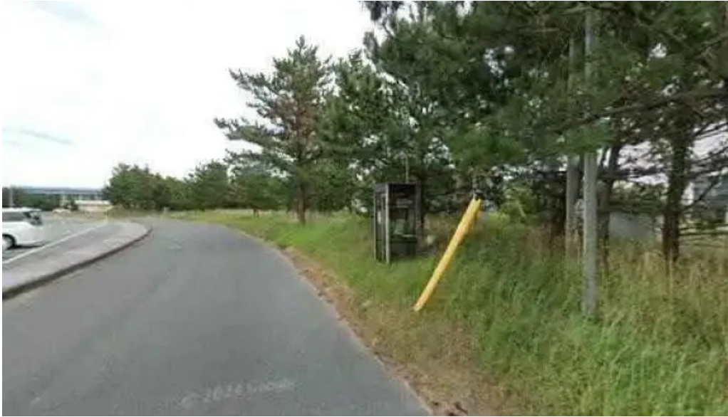
レストラン しかぜ ストリートビューと 360 ビュー