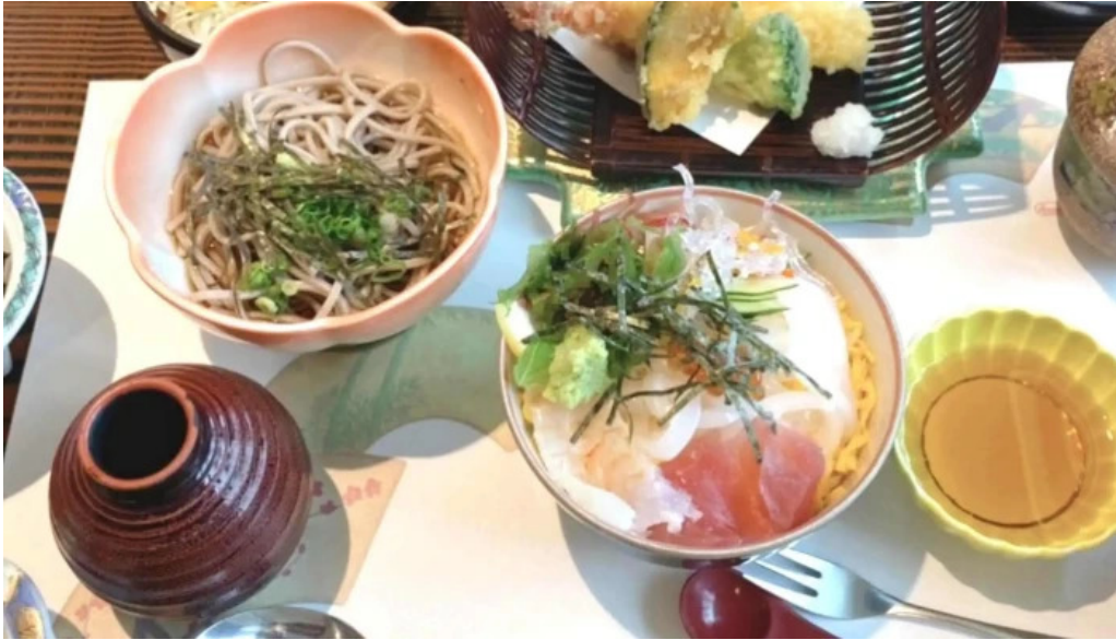
レストラン しおかぜ comentario 5