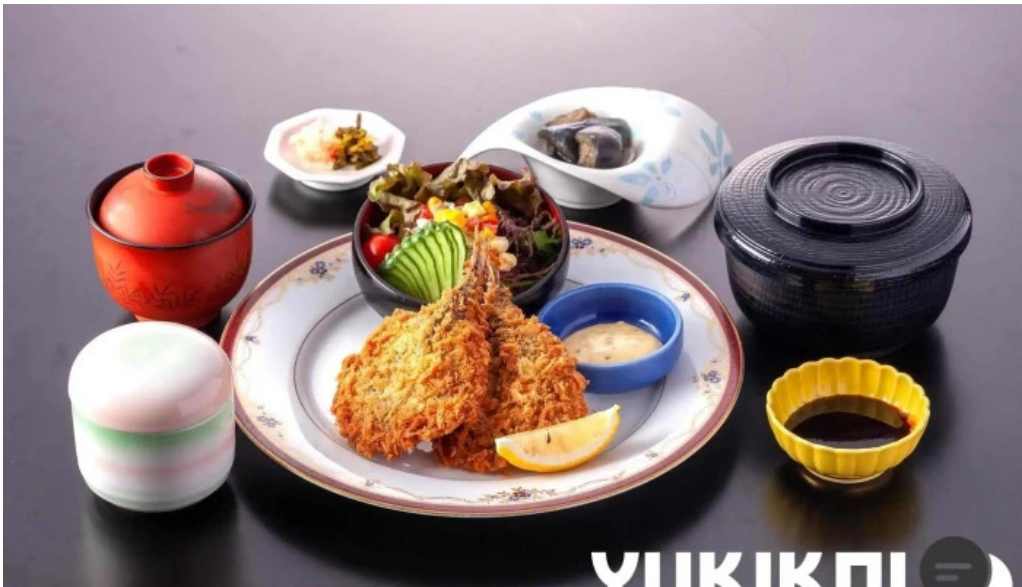
レストラン しかぜ オーナー提供