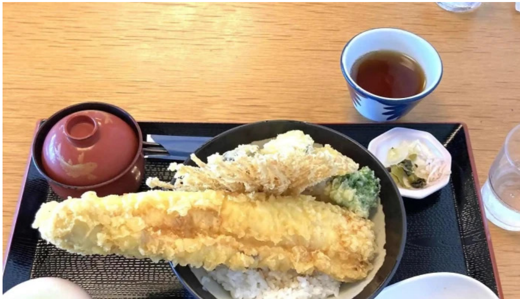
レストラン しおかぜ comentario 1