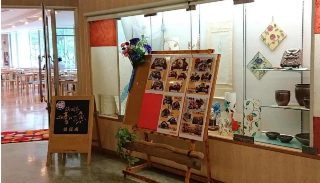
レストラン しおかぜ comentario 7