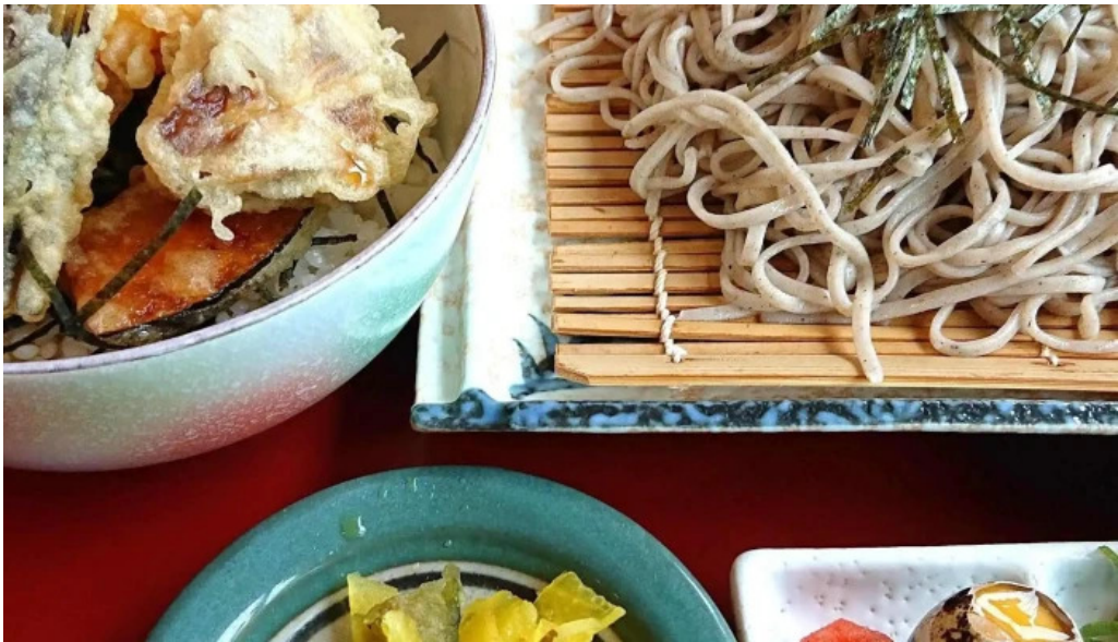
レストラン しおかぜ comentario 8