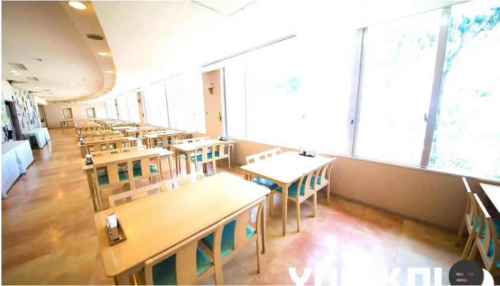
レストラン しおかぜ すべて