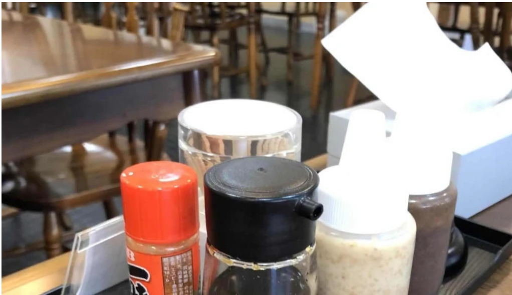
お食事処 美肌 comentario 3