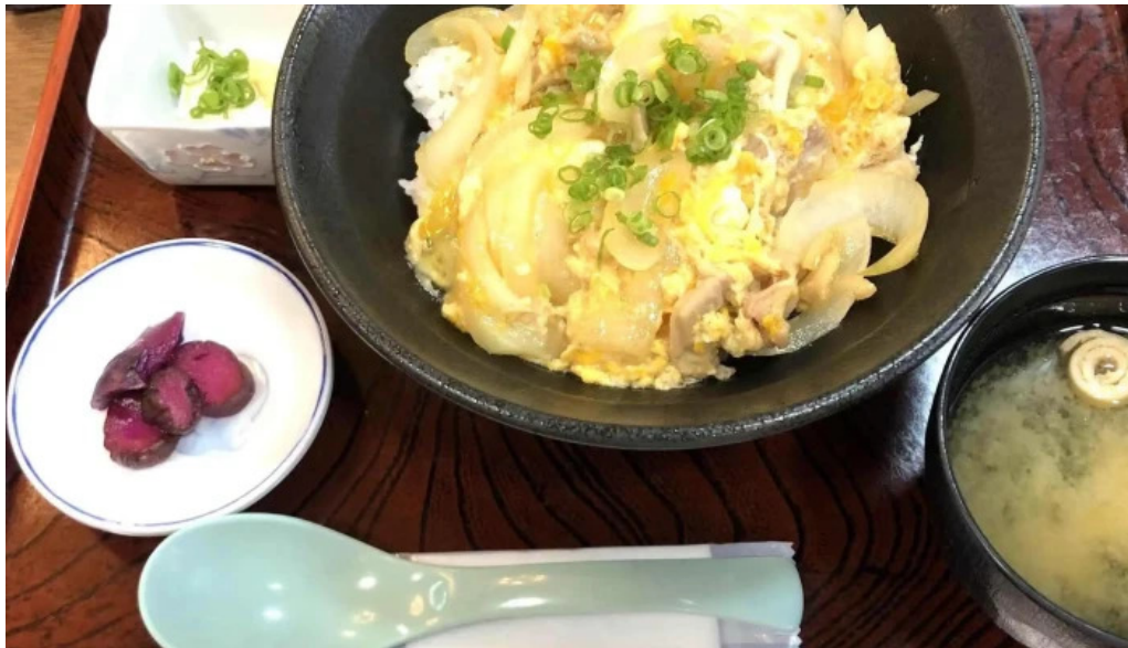
お食事処 美肌 comentario 2