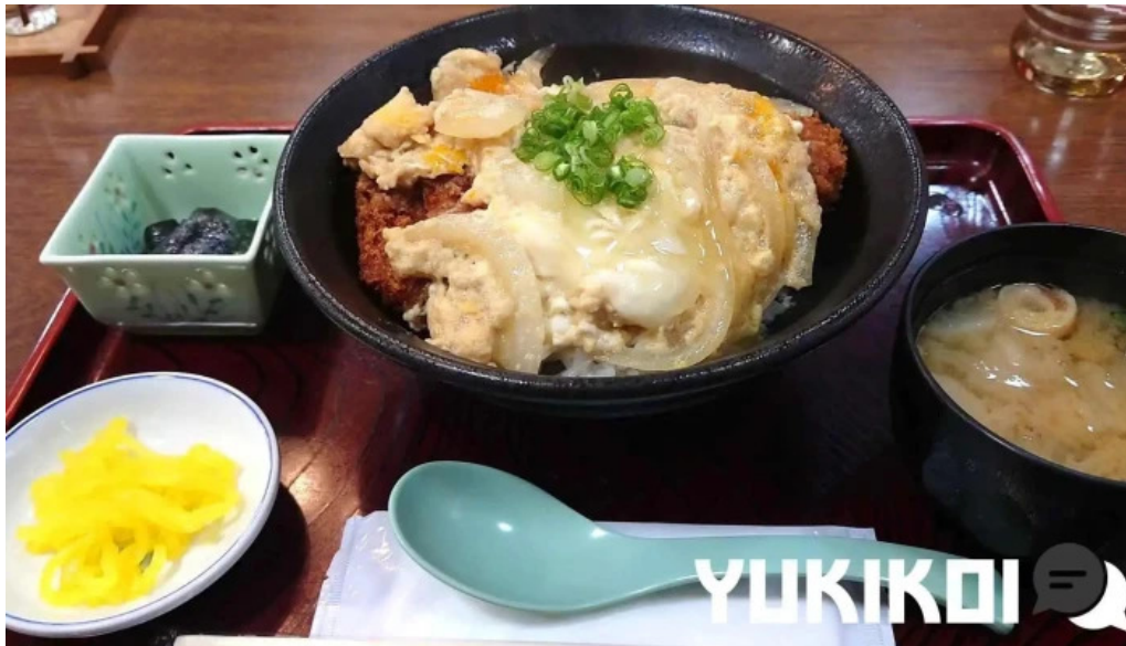
お食事処 美肌 動画