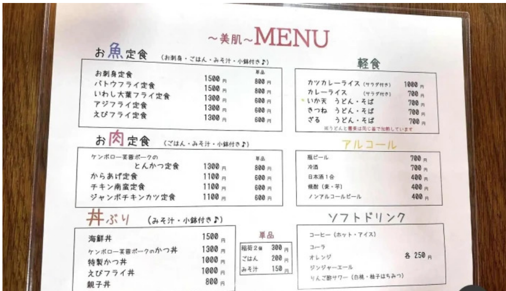
お食事処 美肌 メニュー