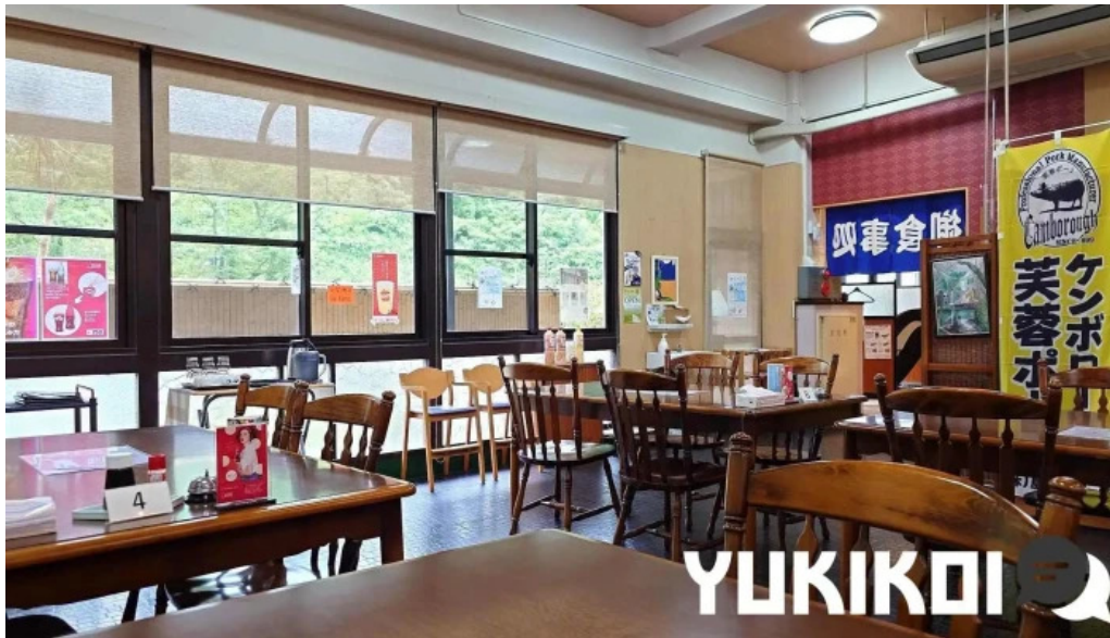
お食事処 美肌 浜田市