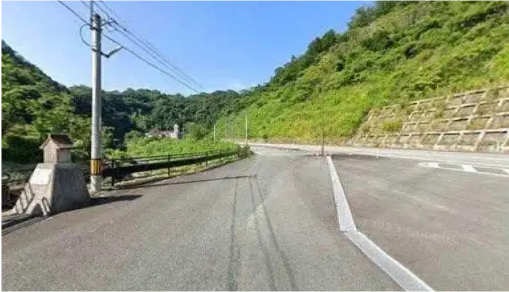
お食事処 美肌 ストリートビューと 360 ビュー