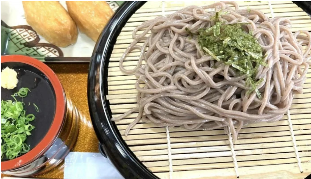
お食事処 美肌 comentario 5