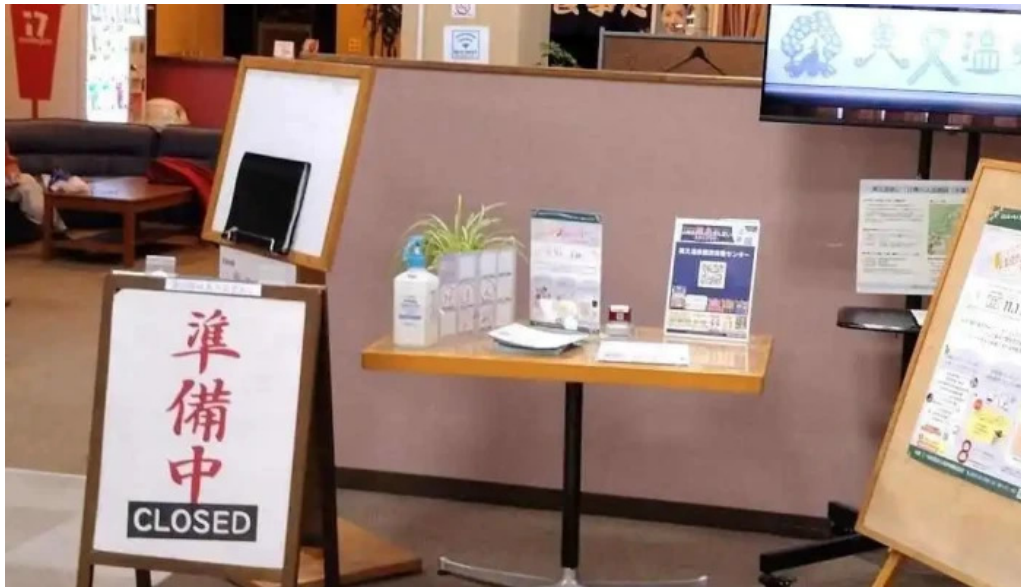
お食事処 美肌 最新