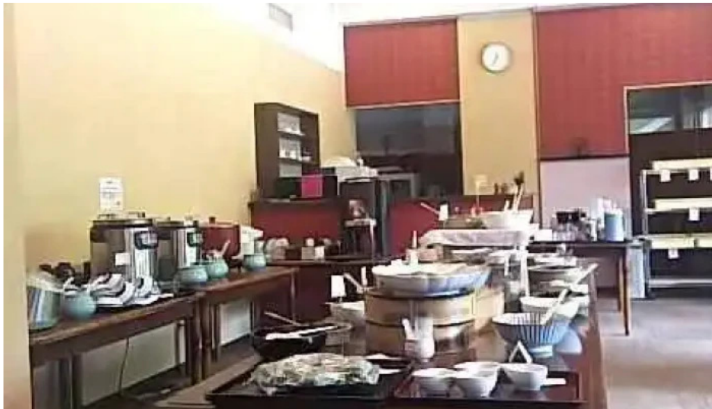
お食事処 美肌 霧田気