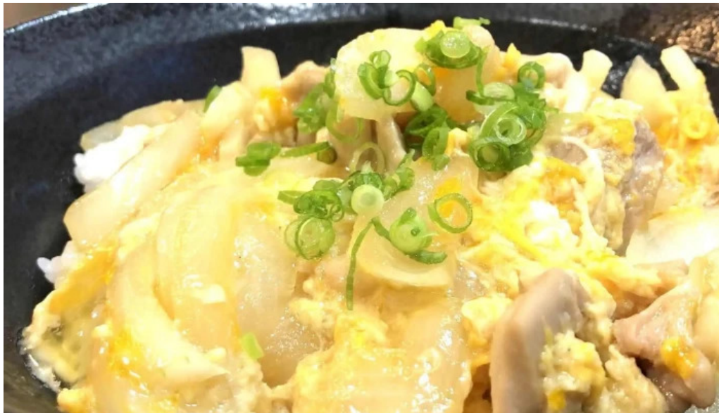
お食事処 美肌 comentario 1