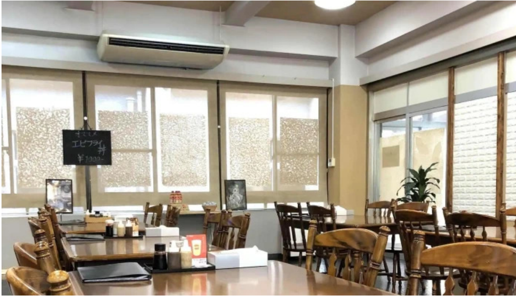
お食事処 美肌 comentario 4