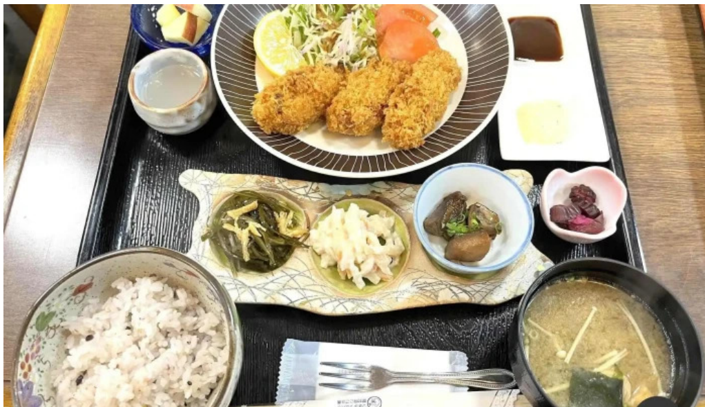
お食事処 美肌 料理飲み物