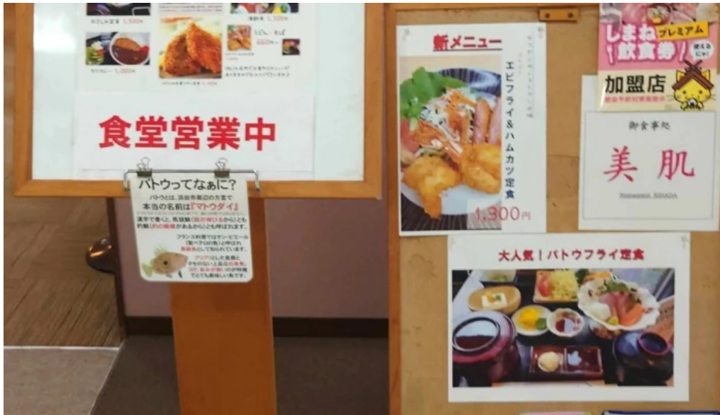
お食事処 美肌 comentario 6