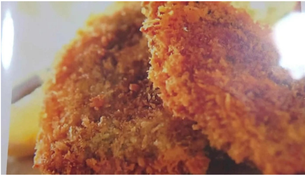
お食事処 美肌 comentario 8