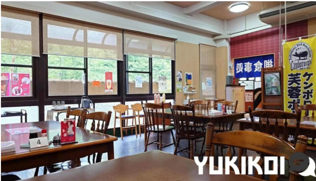
お食事処 美肌 すべて