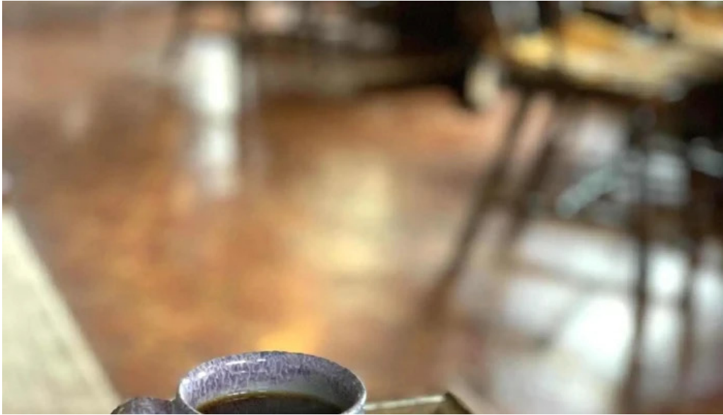
珈琲舎 道トルココーヒー