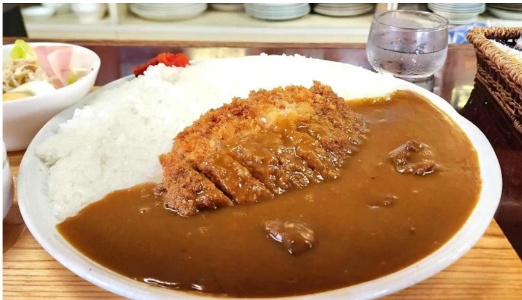
珈琲舍道料理飲み物