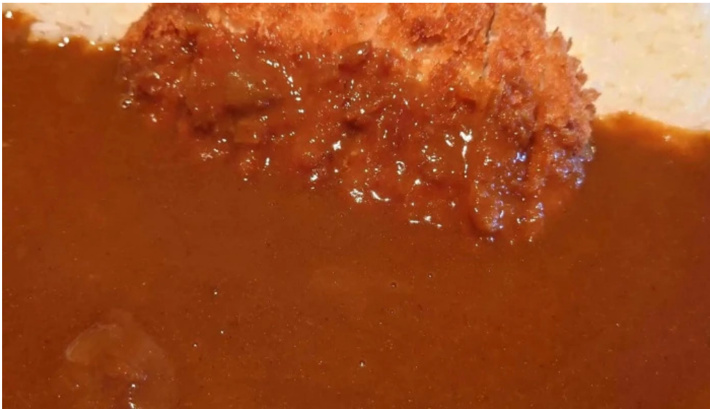
珈琲舎 道 comentario 5