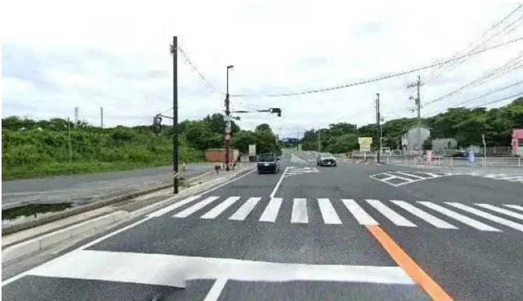
珈琲舎 道 ストリートビューと 360 ビュー