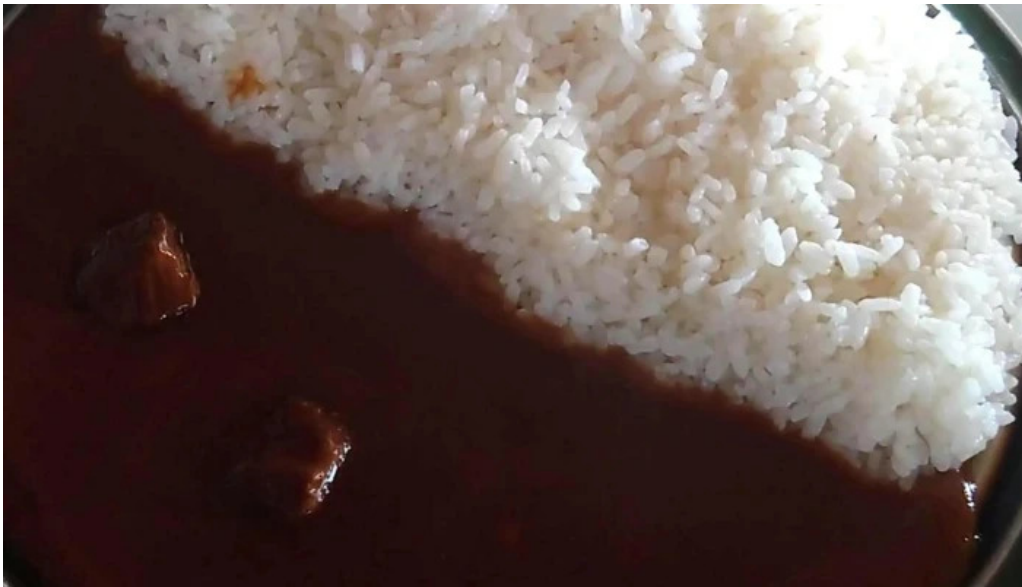
珈琲舎 道 comentario 4