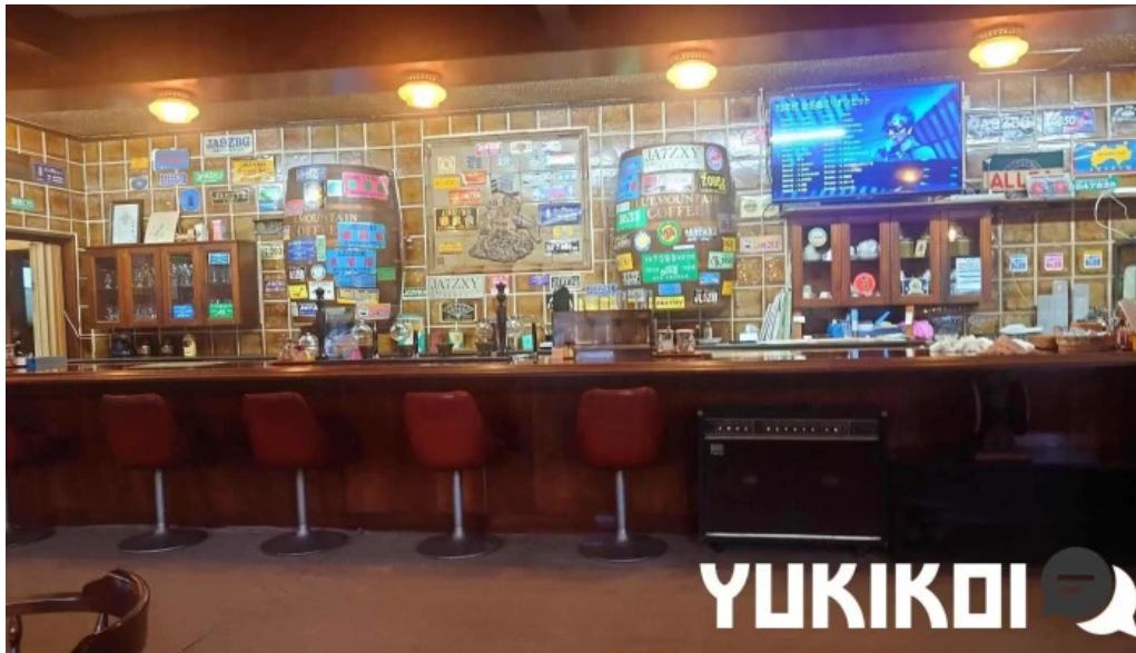
珈琲舎 道 霧岡気