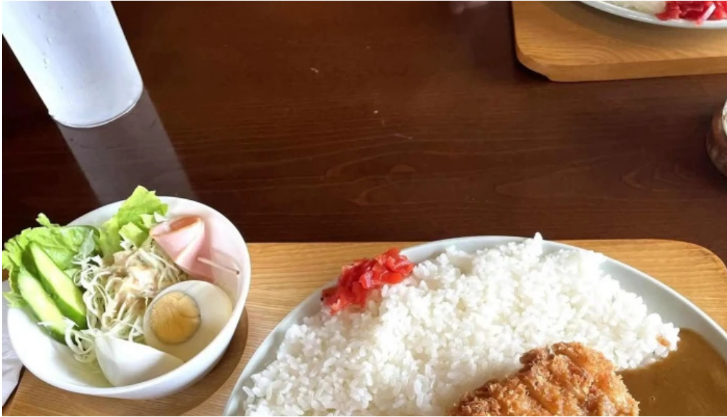
珈琲舎 道 comentario 2