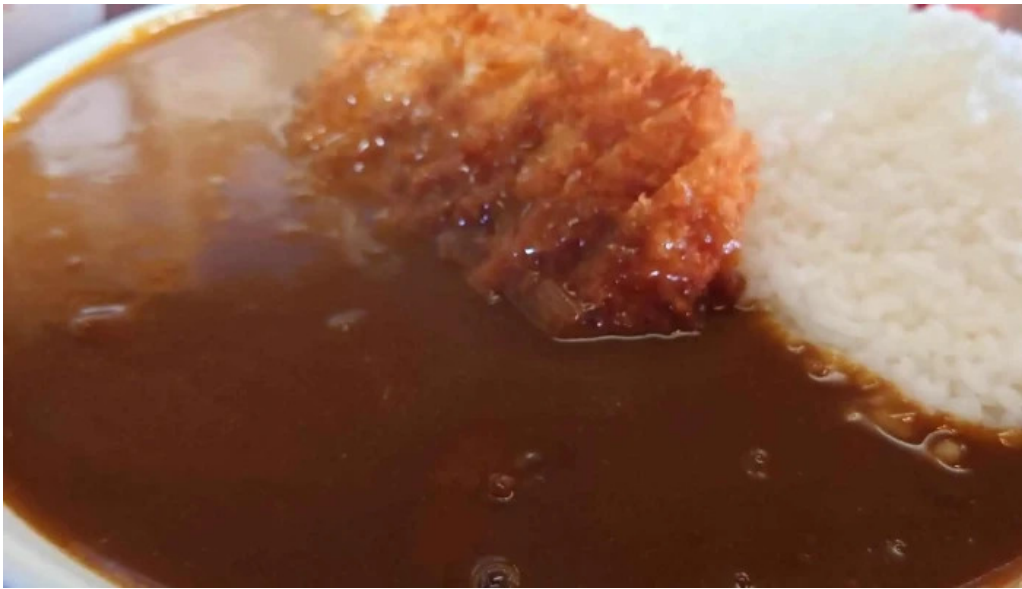
珈琲舎 道 comentario 6