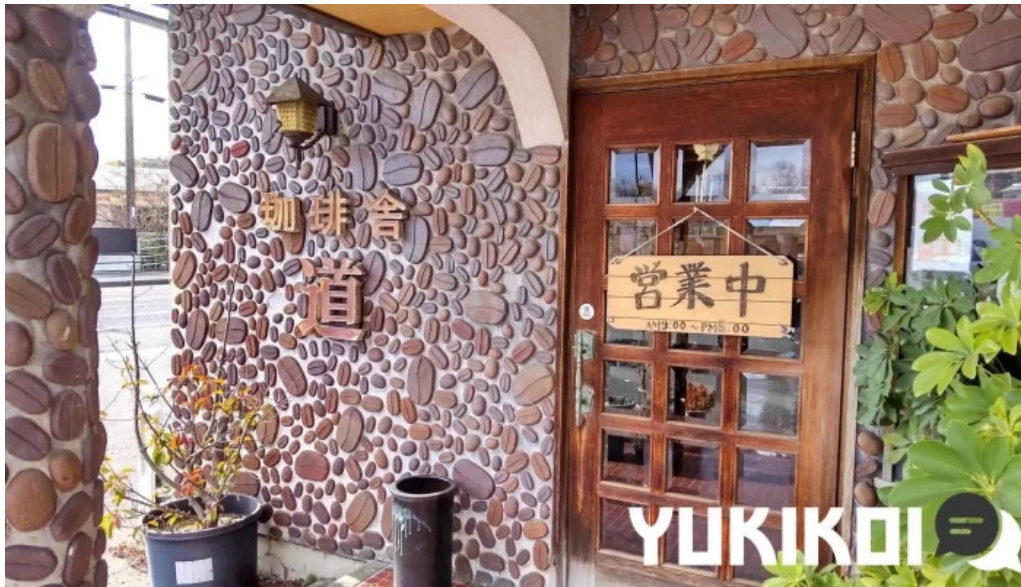
珈琲舎 道 江津市