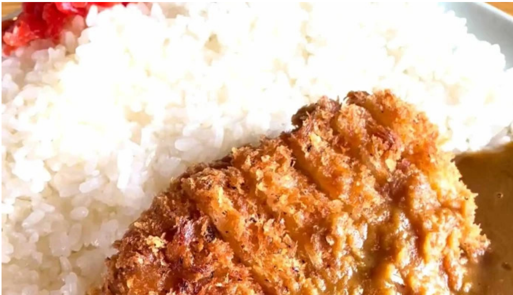
珈琲舎 道 comentario 1