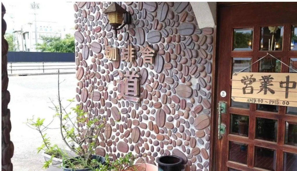
珈琲舎 道 comentario 7