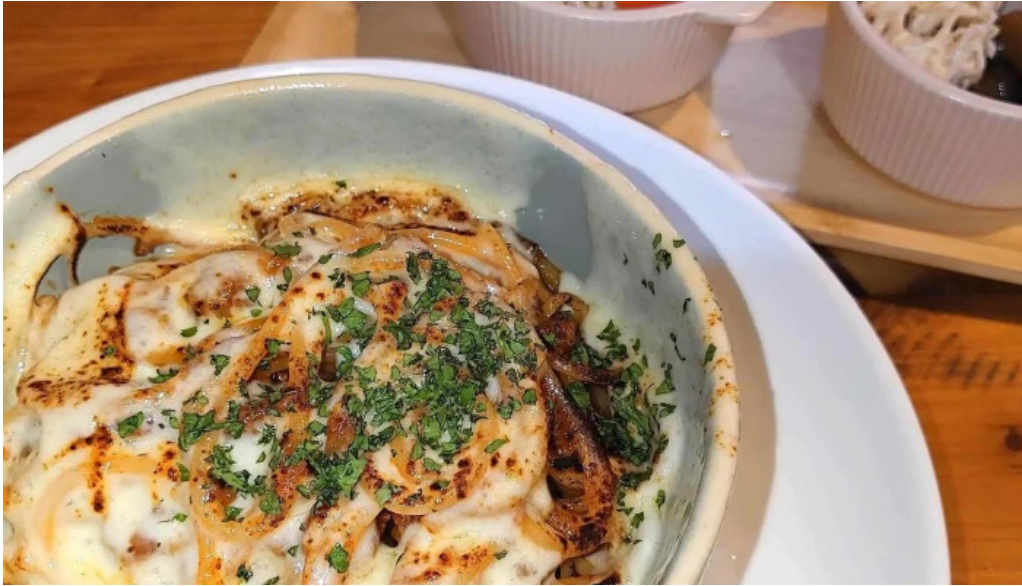
本町キッチン今出屋 comentario 6