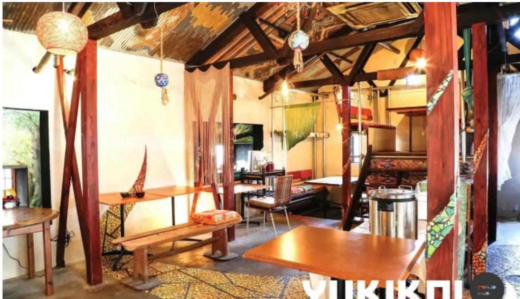
本町キッチン今出屋 すべて