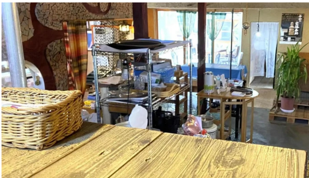
本町キッチン今出屋 comentario 2