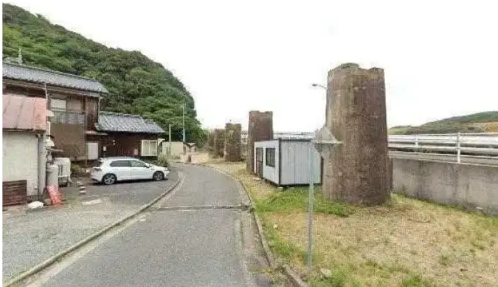
本町キッチン今出屋 ストリートビューと 360 ビュー