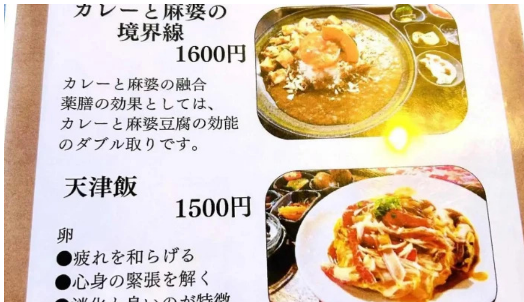
本町キッチン今出屋 メニュー