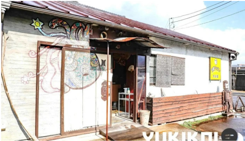
本町キッチン今出屋 オーナー提供