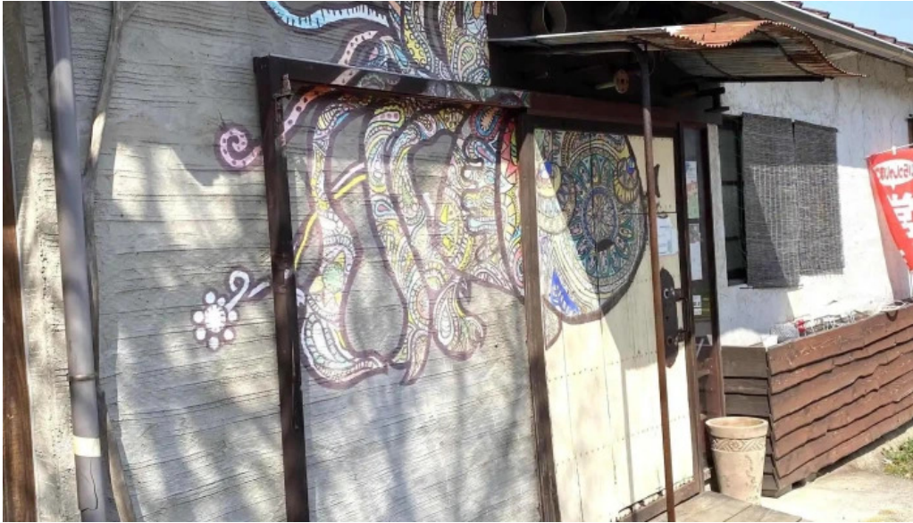
本町キッチン今出屋 comentario 4