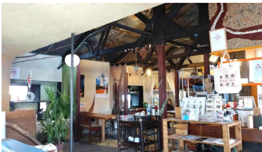
本町キッチン今出屋 雰囲気