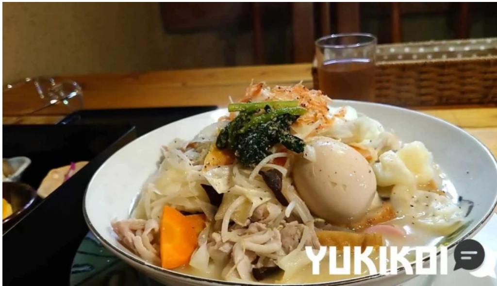
本町キッチン今出屋 動画