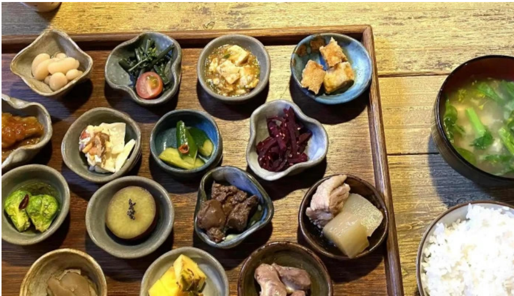
本町キッチン今出屋 comentario 3