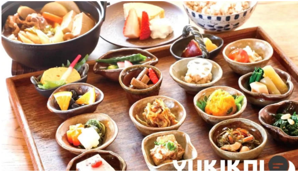
本町キッチン今出屋 懐石