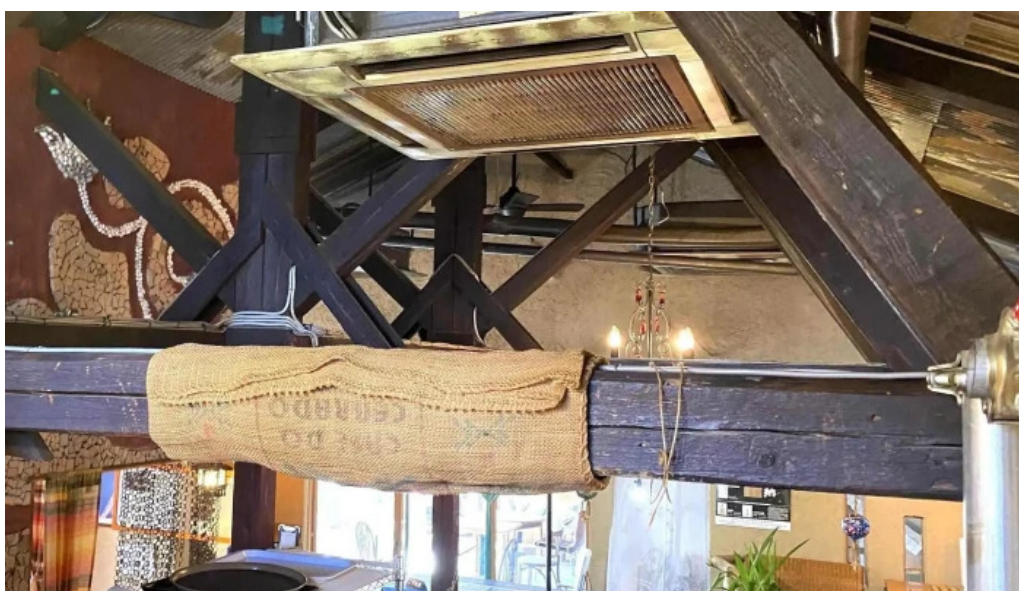
本町キッチン今出屋 comentario 1