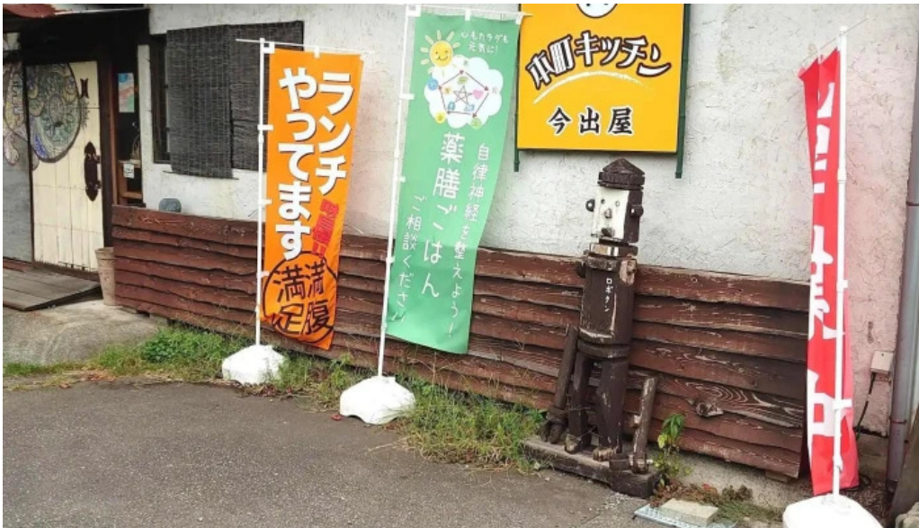
本町キッチン今出屋 comentario 5