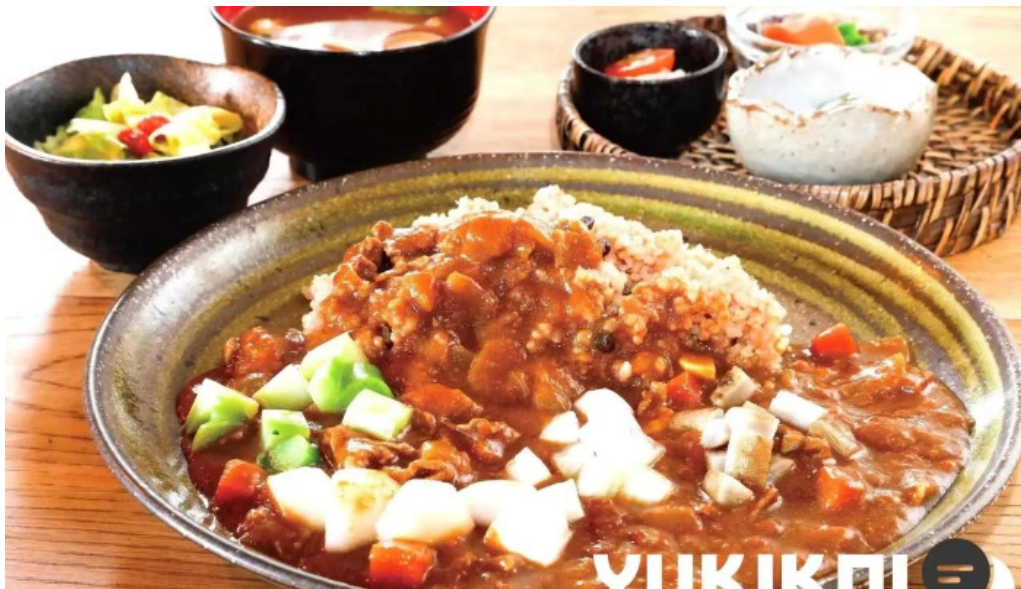
本町キッチン今出屋 料理飲み物