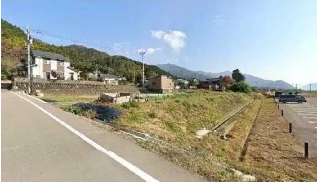
Apero patisserie acoya ストリートビューと 360 ビュー