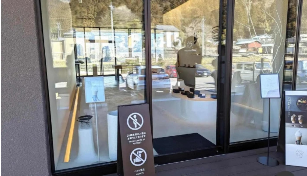
Apero patisserie acoya すべて