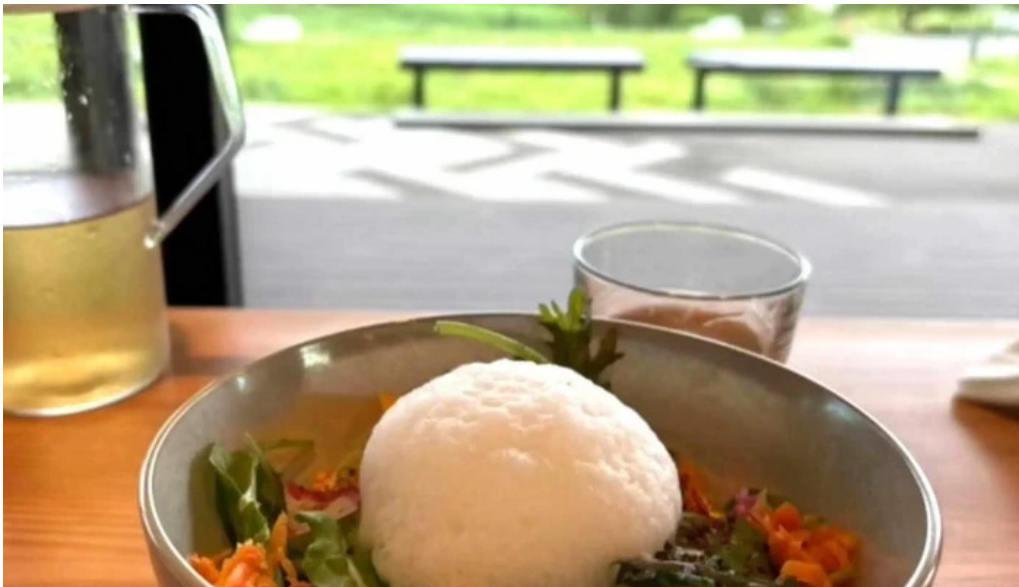
Apero patisserie acoya comentario 5