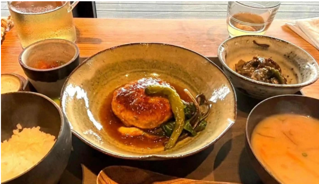
Apero patisserie acoya comentario 6