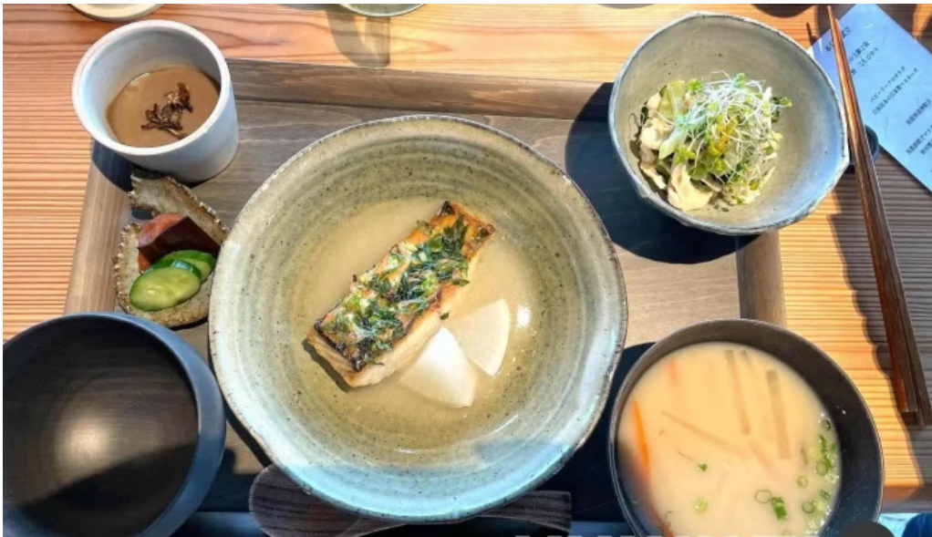
Apero patisserie acoya 最新