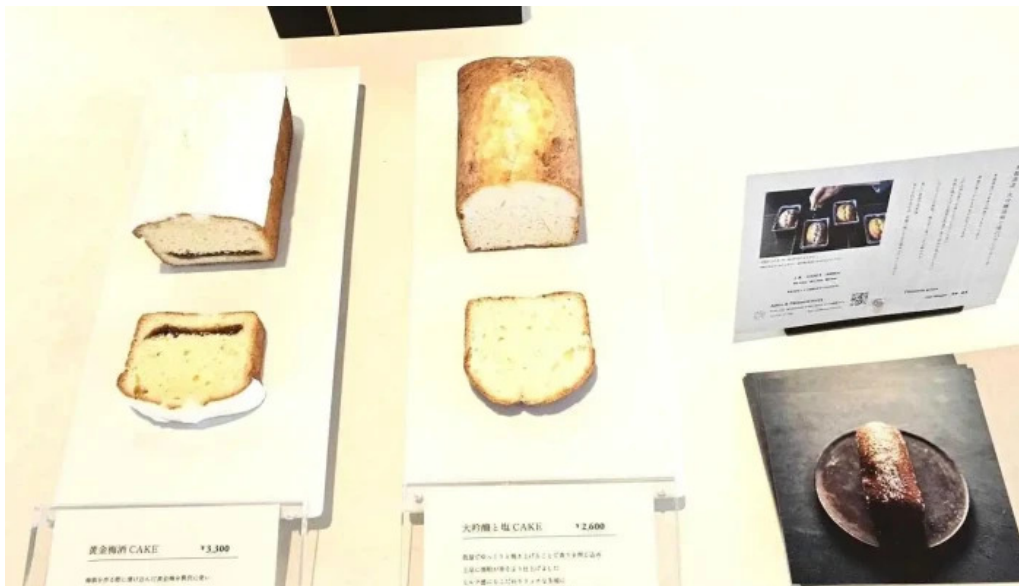
Apero patisserie acoya メニュー