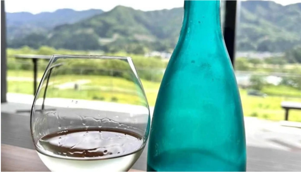
Apero patisserie acoya 日本酒