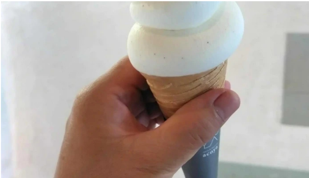
Apero patisserie acoya comentario 4