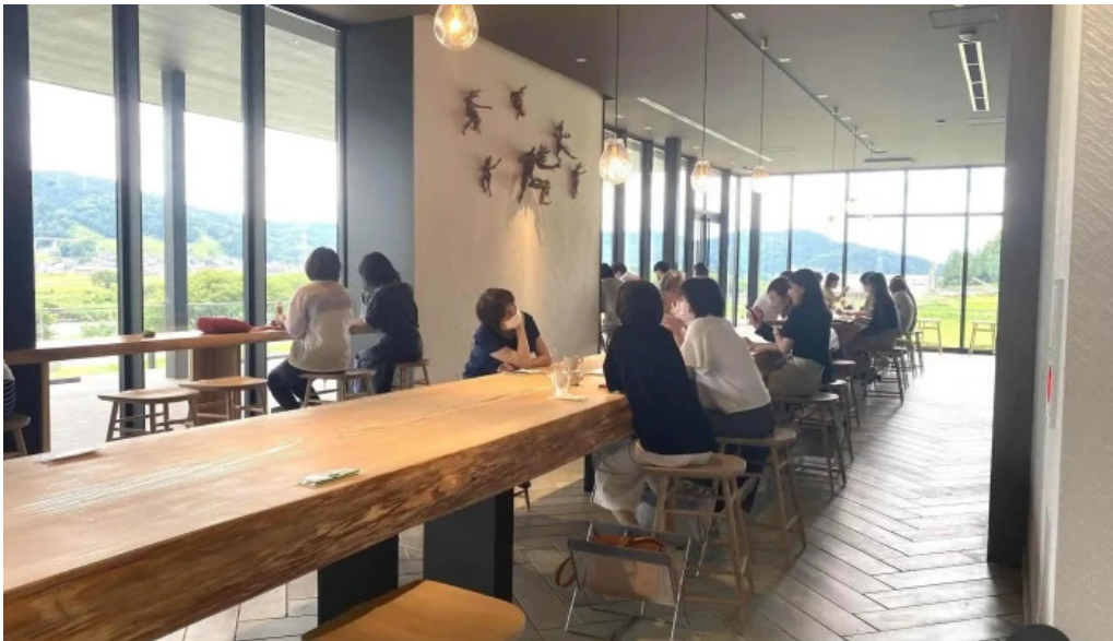
Apero patisserie acoya 雰囲気