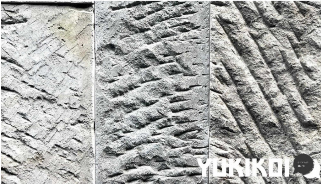
Apero patisserie acoya