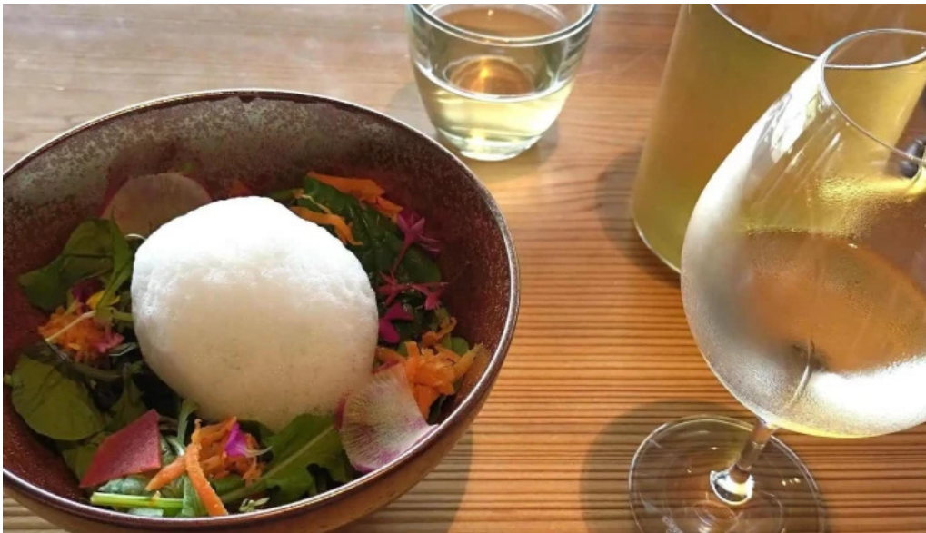
Apero patisserie acoya comentario 2