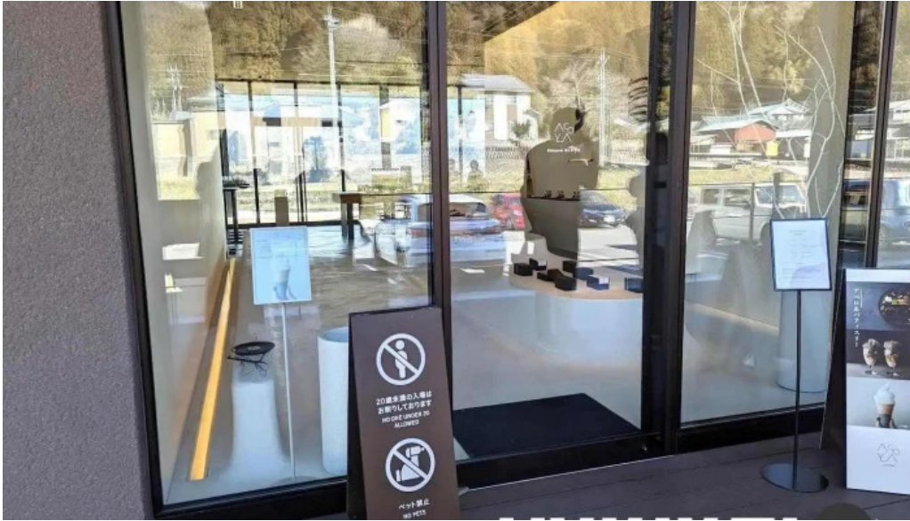
Apero patisserie acoya 永平寺町