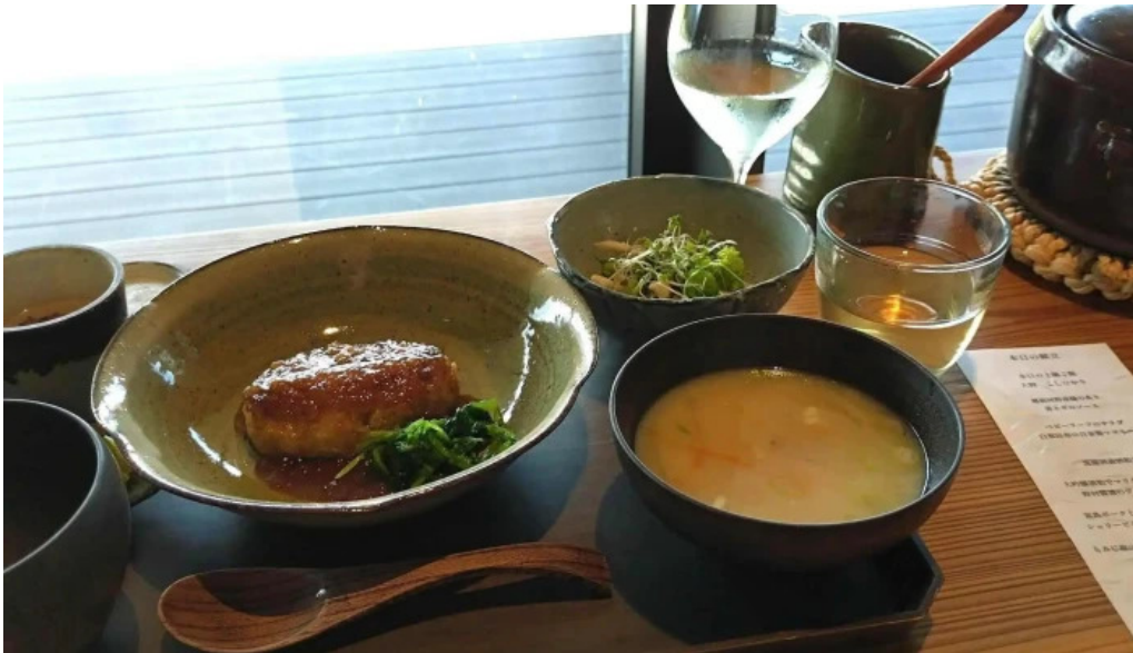
Apero patisserie acoya comentario 3