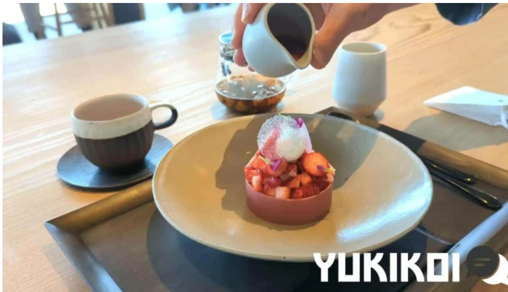
Apero patisserie acoya 動画