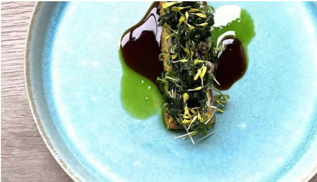
Apero patisserie acoya 料理飲み物