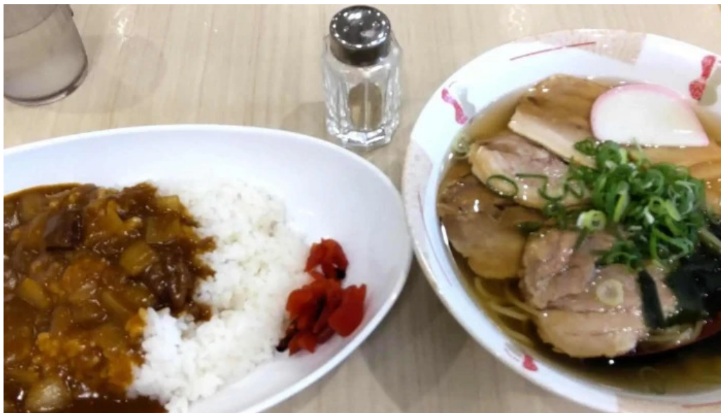
奈良県立医科大学附属病院 レストランroyal instagram