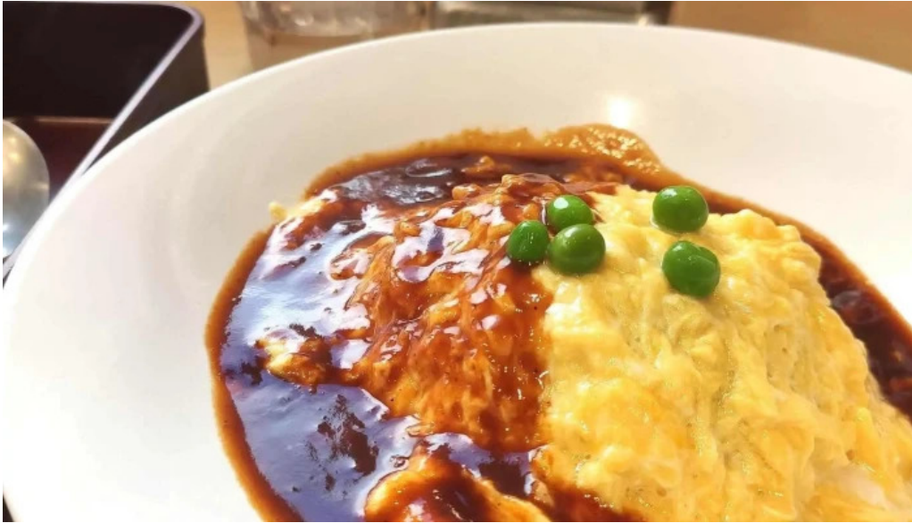
奈良県立医科大学附属病院 レストランroyal 近く