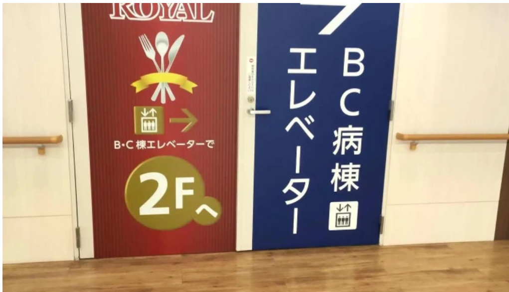
奈良県立医科大学附属病院 レストランroyal 料金