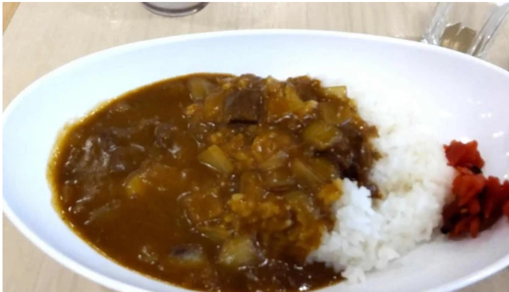
奈良県立医科大学附属病院 レストランroyal 所在地