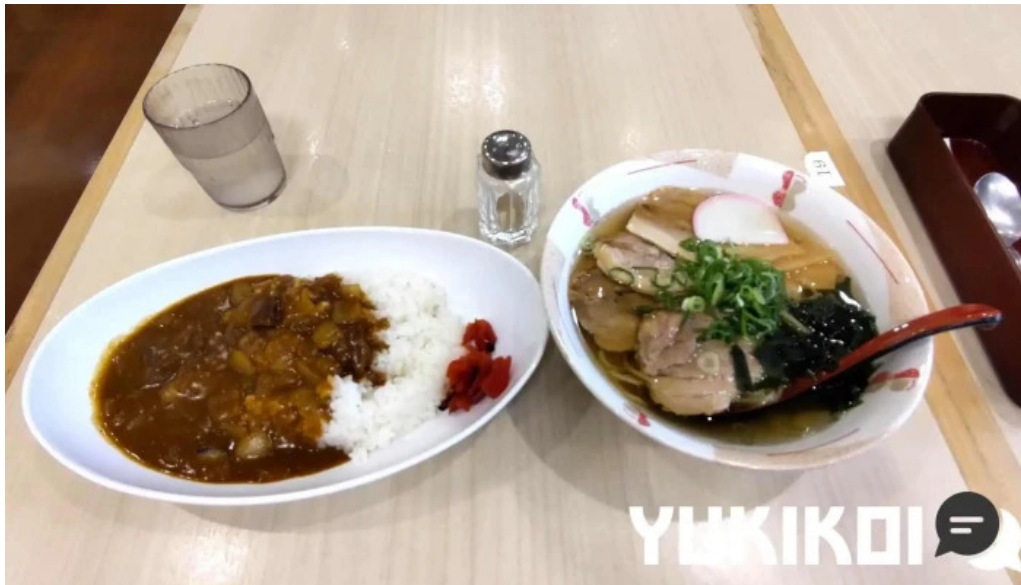
奈良県立医科大学附属病院 レストランroyal 料理飲み物