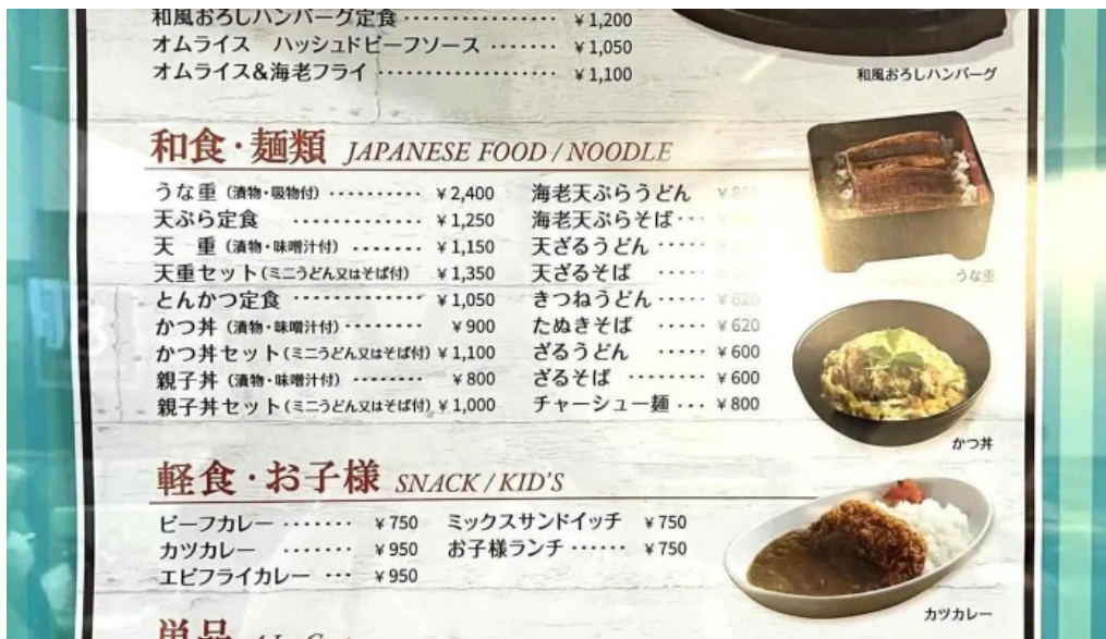
奈良県立医科大学附属病院 レストランroyal メニュー