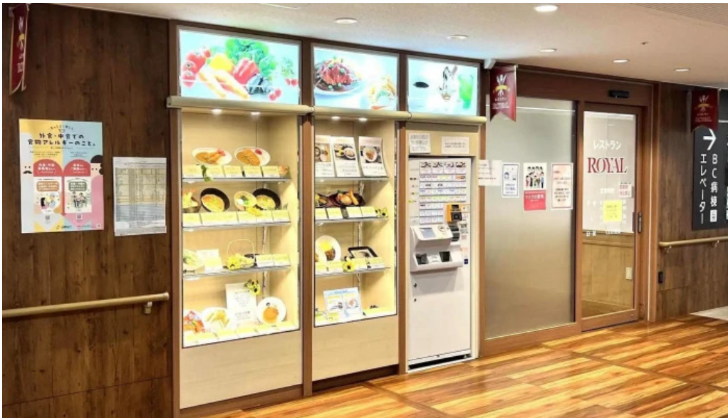
奈良県立医科大学附属病院 レストランroyal 番号