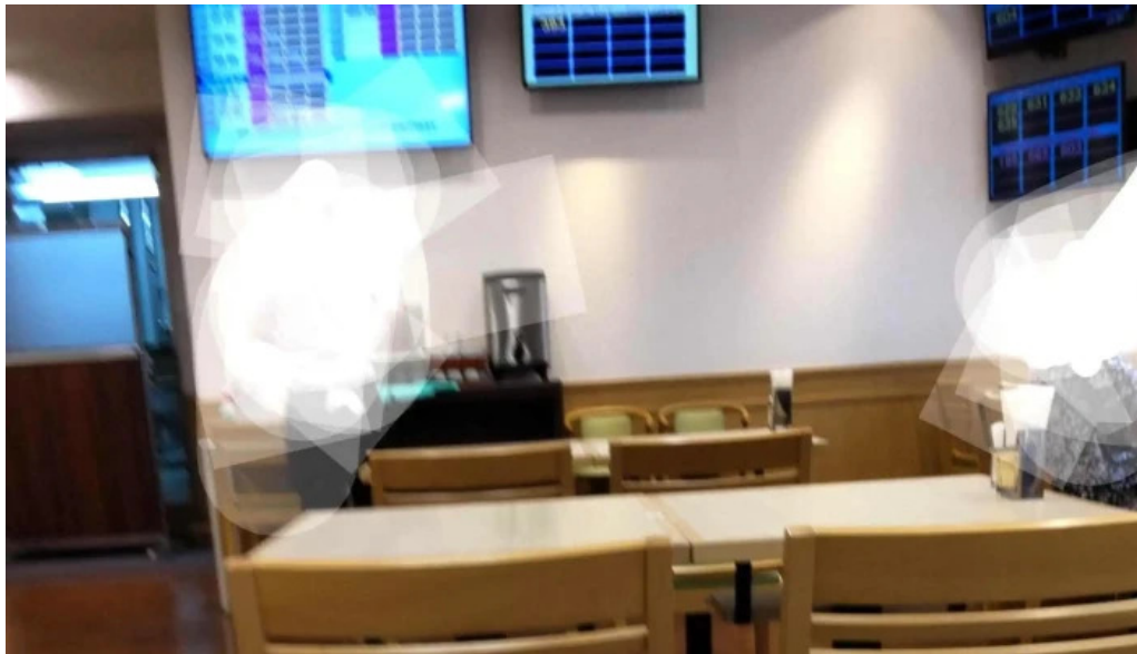
奈良県立医科大学附属病院 レストランroyal 橿原市