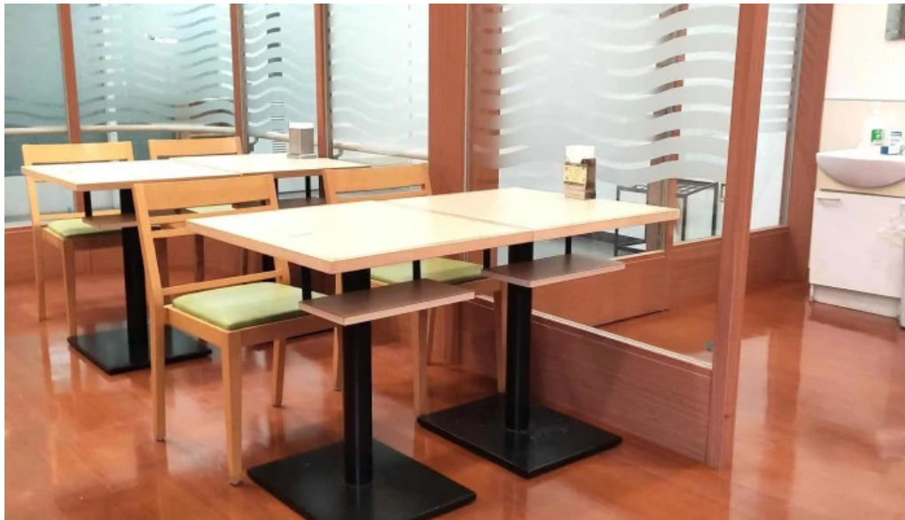
奈良県立医科大学附属病院 レストランroyal 写真