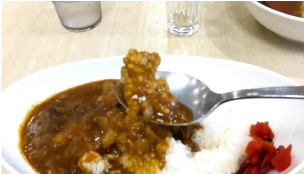
奈良県立医科大学附属病院 レストランroyal エリア