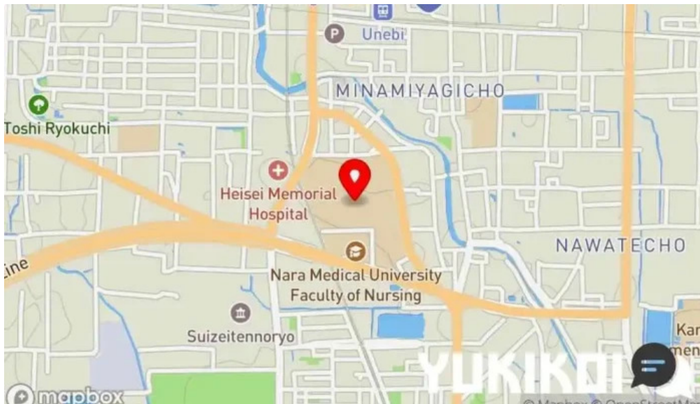
奈良県立医科大学附属病院 レストランroyal 地図