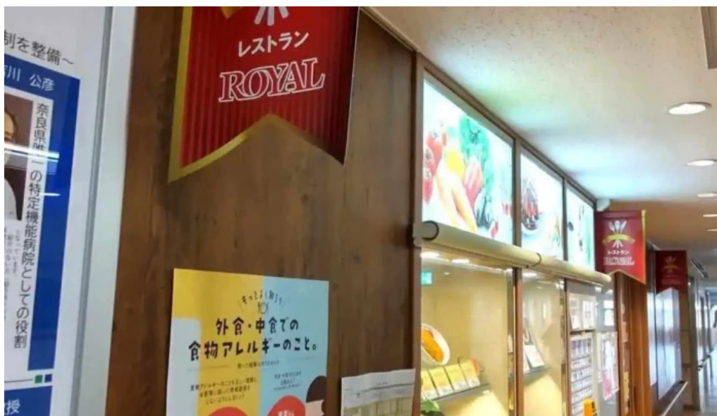
奈良県立医科大学附属病院 レストランroyal 雰囲気