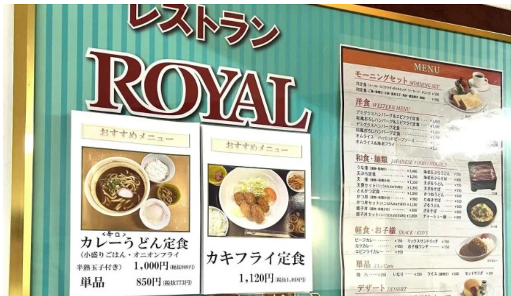
奈良県立医科大学附属病院 レストランroyal プロモーション