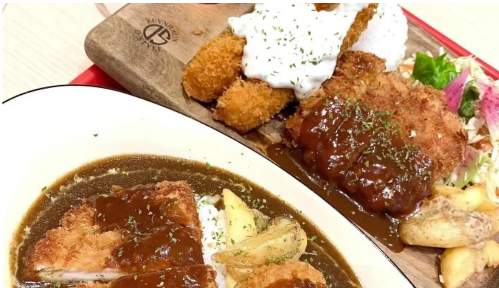
Ranchos kitchen ニトリモール枚方 営業時間