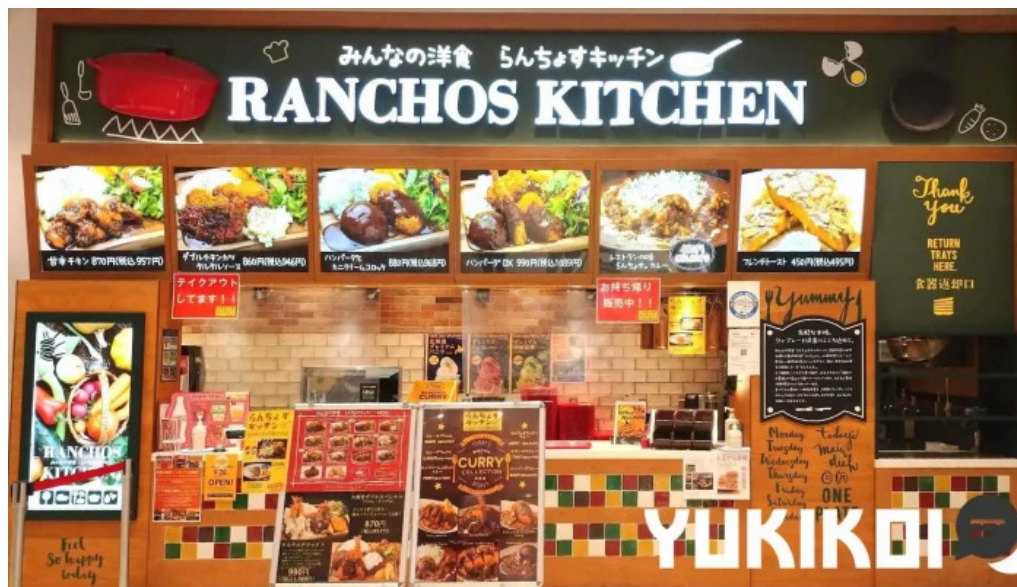
Ranchos kitchen ニトリモール枚方 メニュー