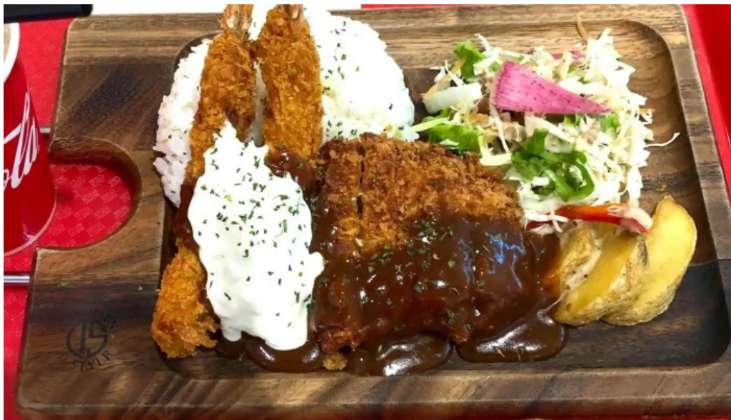
Ranchos kitchen ニトリモール枚方 割引