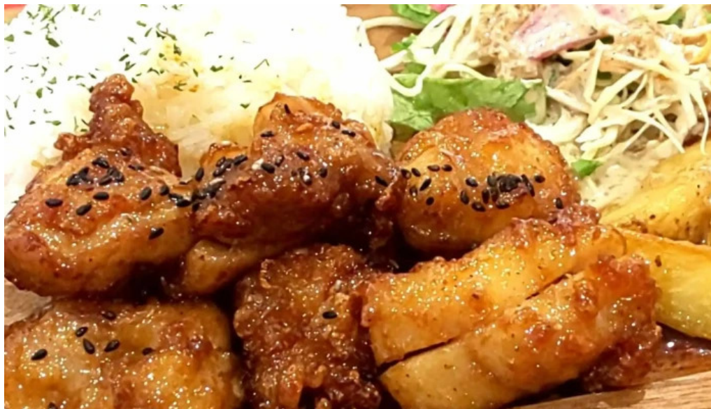
Ranchos kitchen ニトリモール枚方 カタログ