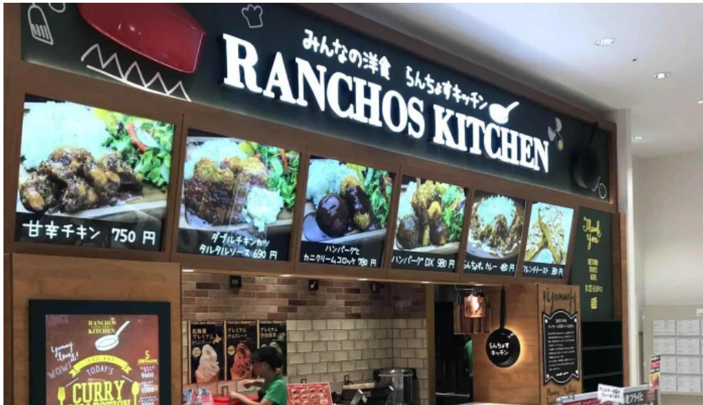
Ranchos kitchen ニトリモール枚方 所在地