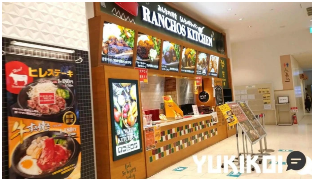
Ranchos kitchen ニトリモール枚方 雰囲気