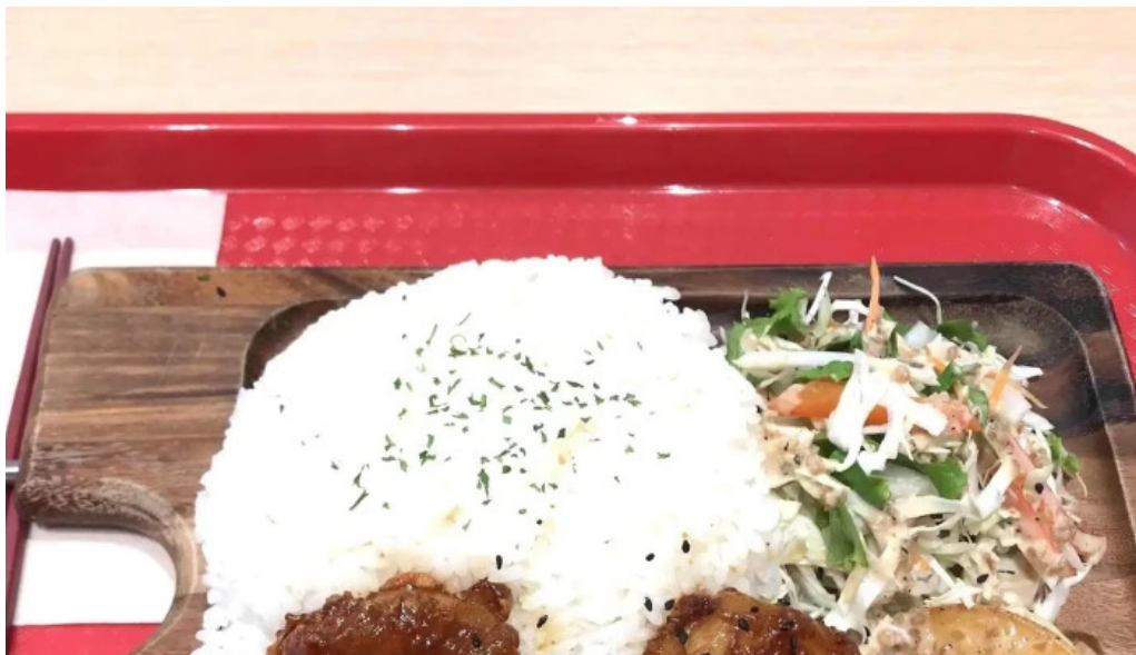
Ranchos kitchen ニトリモール枚方 営業中