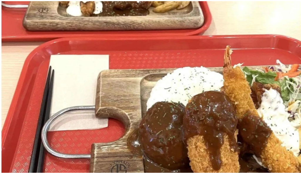
Ranchos kitchen ニトリモール枚方 動画