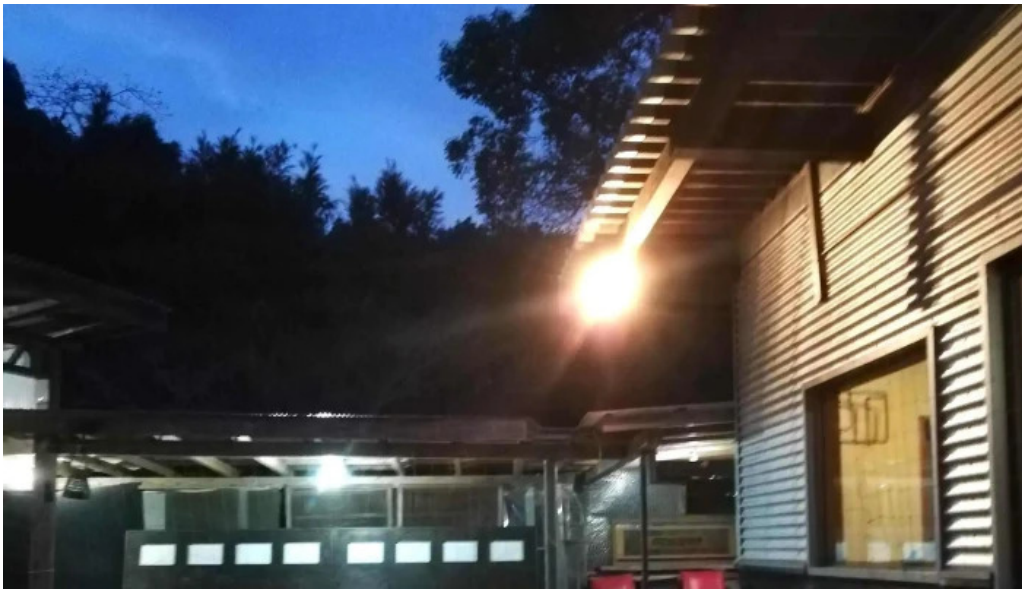
善助ファーム 写真