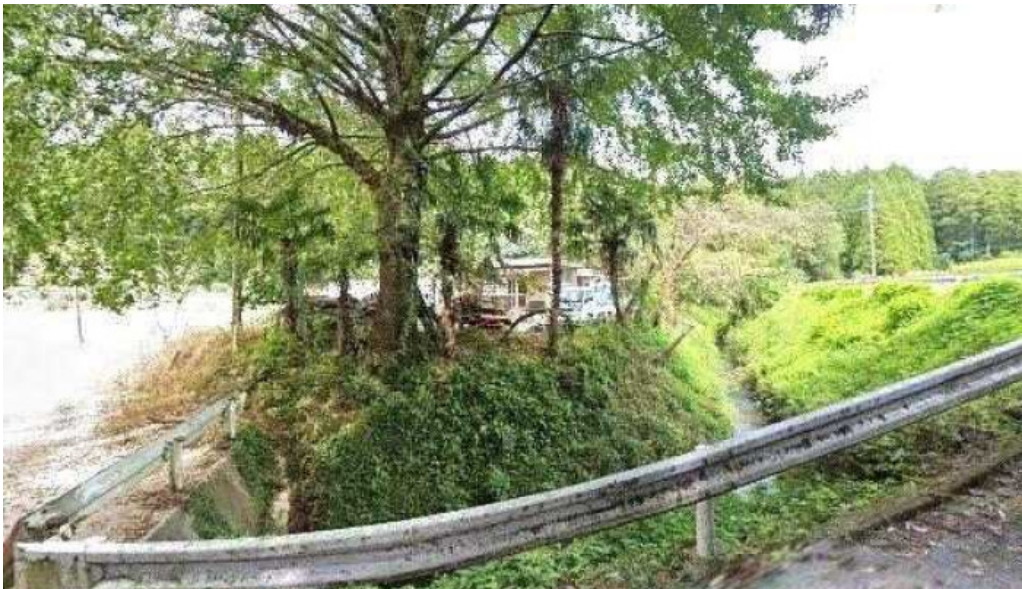
善助ファーム 曾於市