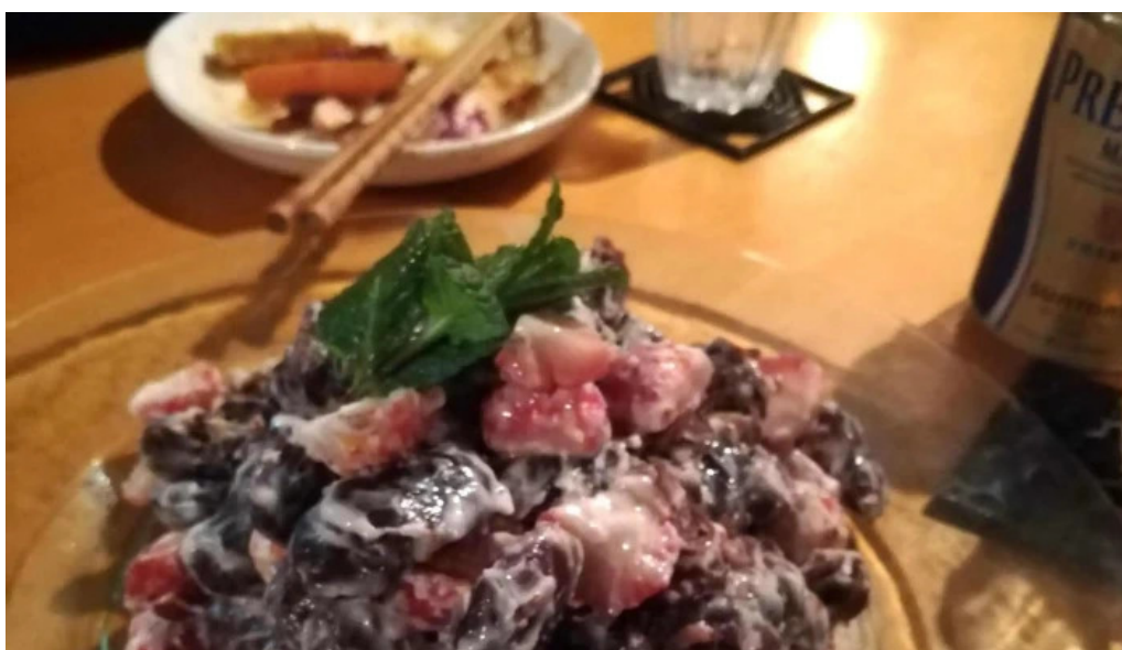
善助ファーム 電話