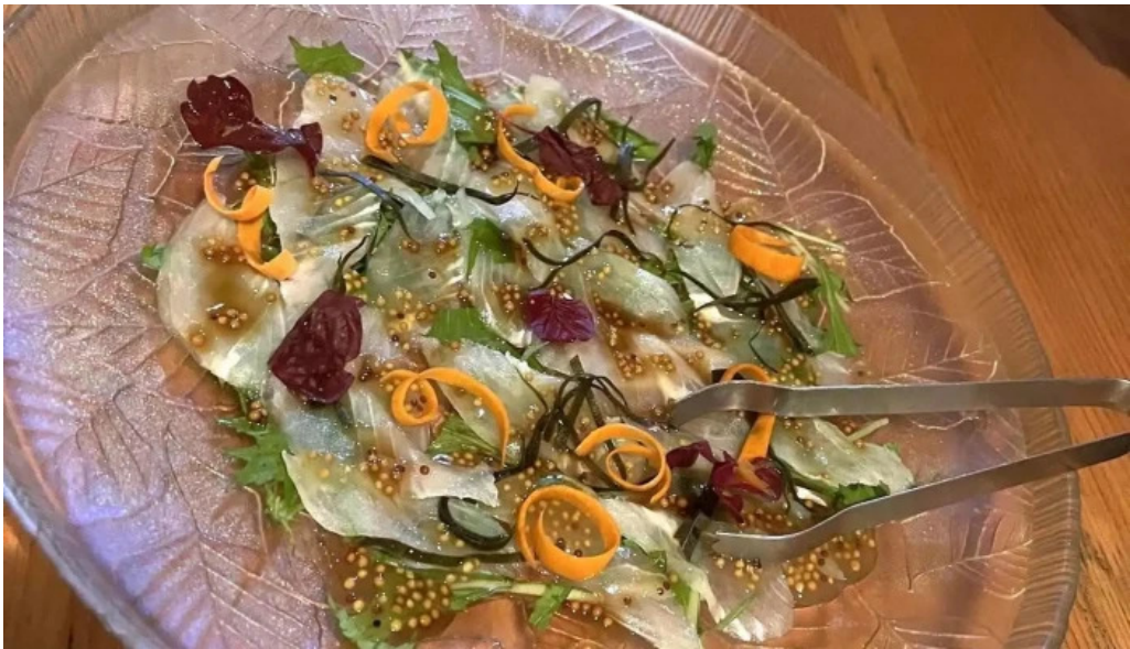
善助ファーム 料理飲み物