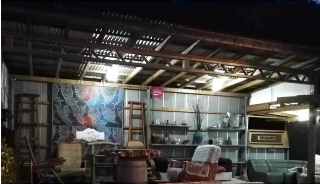
善助ファーム どこ