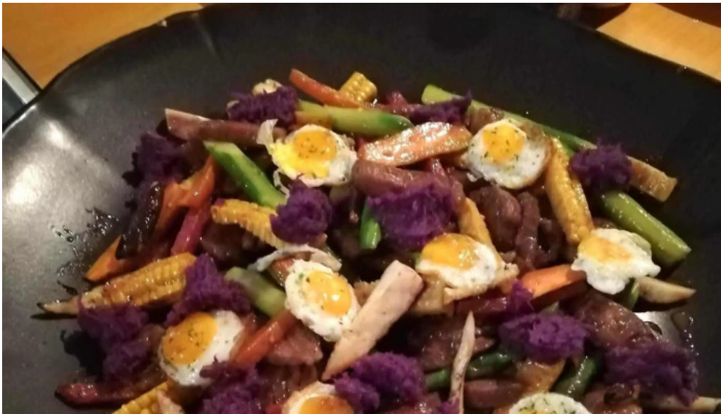
善助ファーム スコア