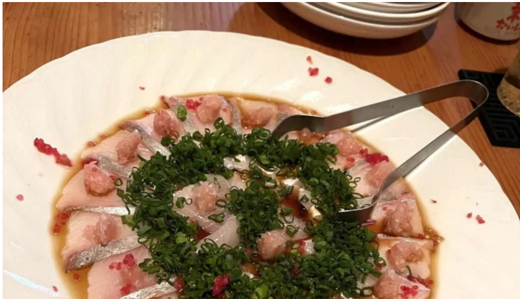
善助ファーム ウェブサイト