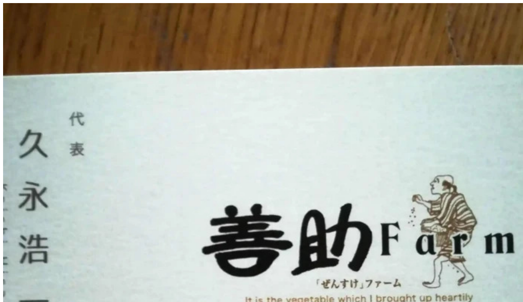
善助ファーム エリア