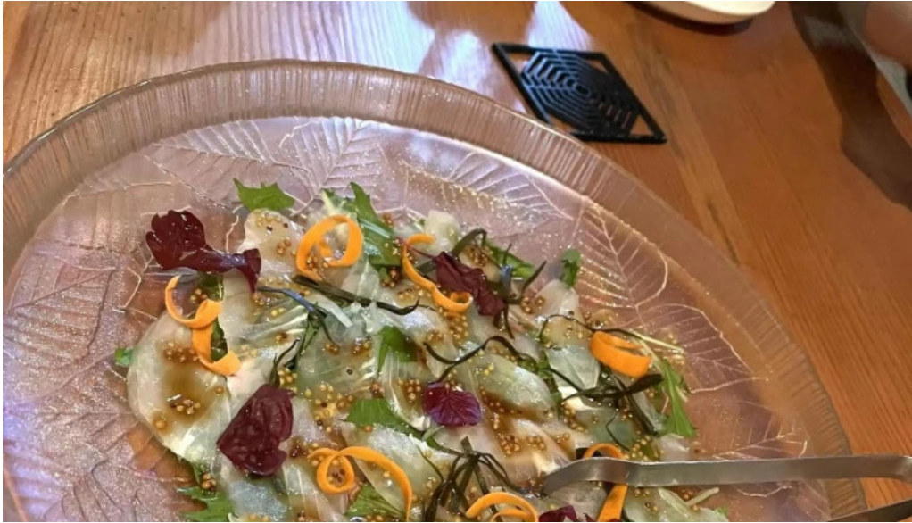
善助ファーム 番号