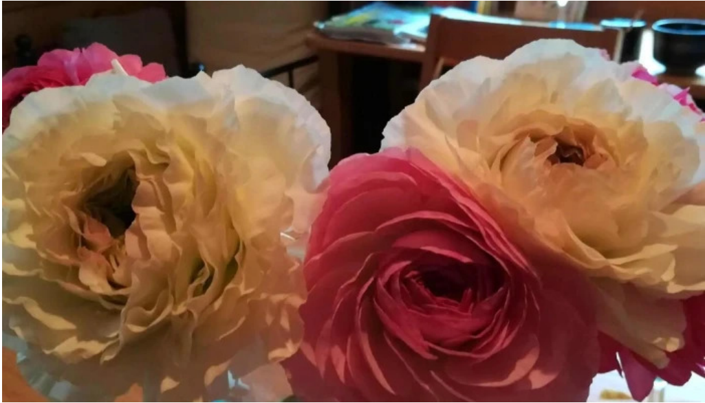
善助ファーム 料金