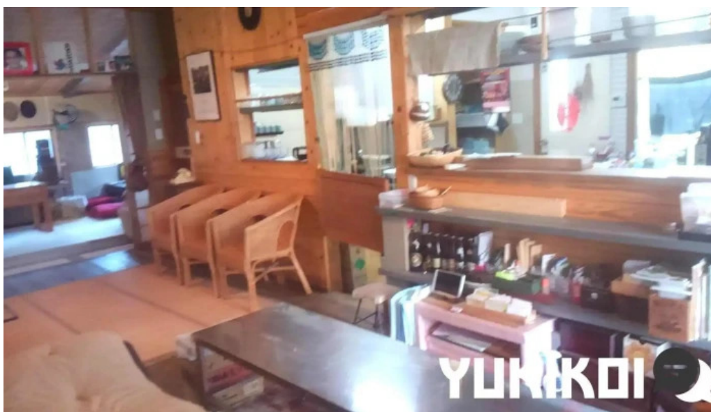
善助ファーム 雰囲気