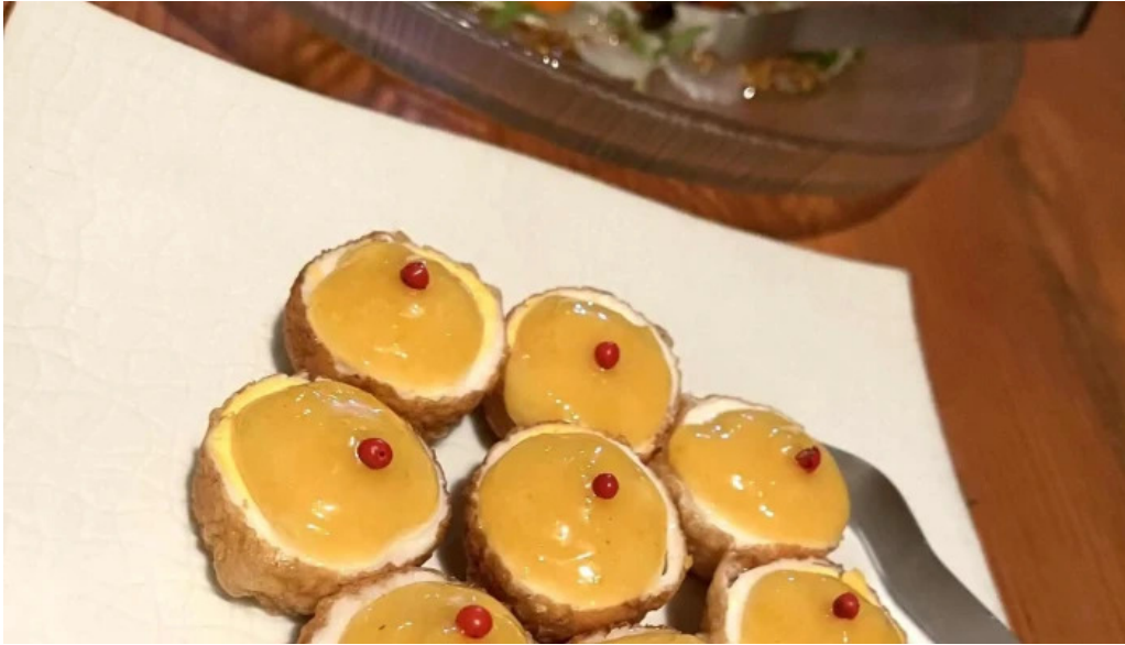
善助ファーム 動画