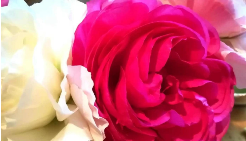
善助ファーム 住所