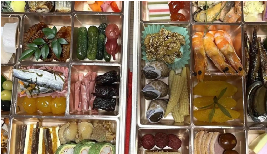
善助ファーム ココミ