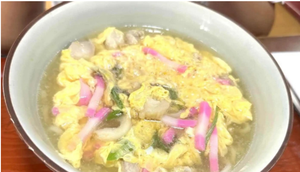
レストラン おおすみ 所在地