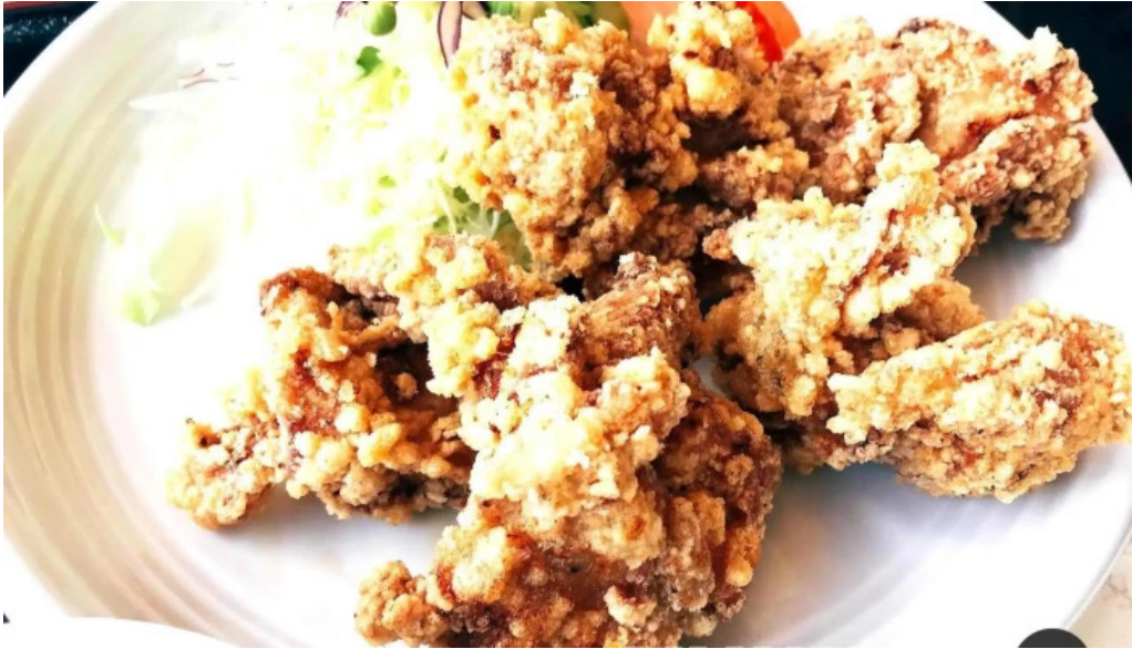
レストラン おおすみ 料理飲み物