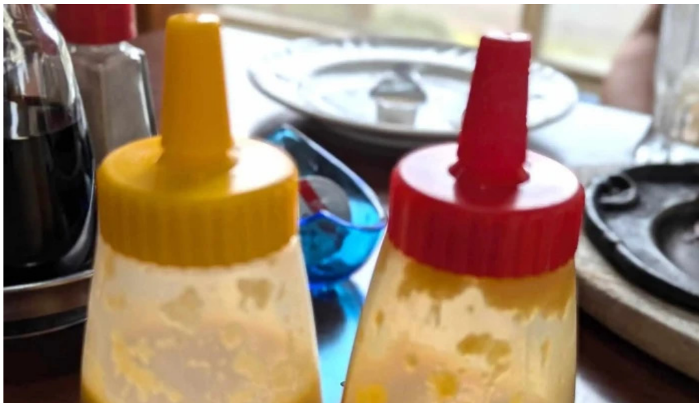
レストラン おおすみ エリア