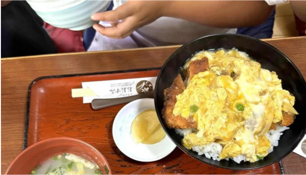
レストラン おおすみ 割引