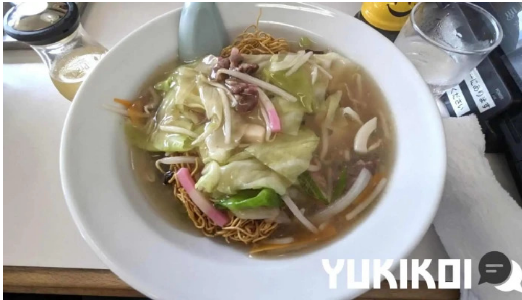
レストラン おおすみ ちゃんぽん