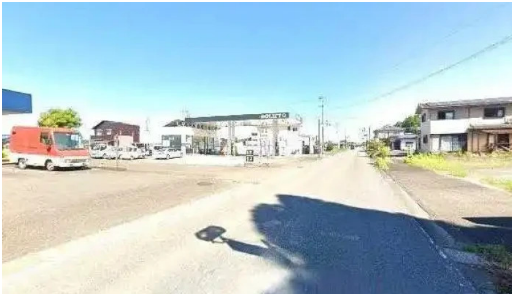
レストラン おおすみ 曾於市