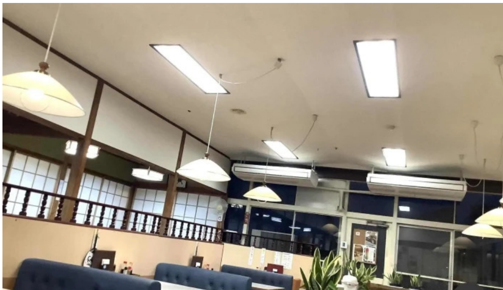
レストラン おすすめ 雰囲気