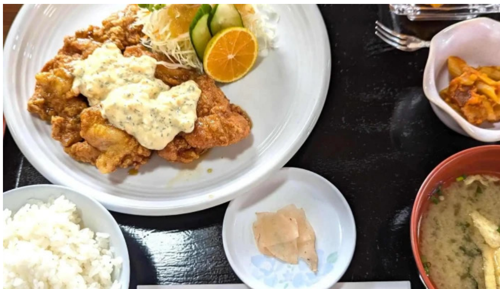
レストラン おおすみ プロモーション