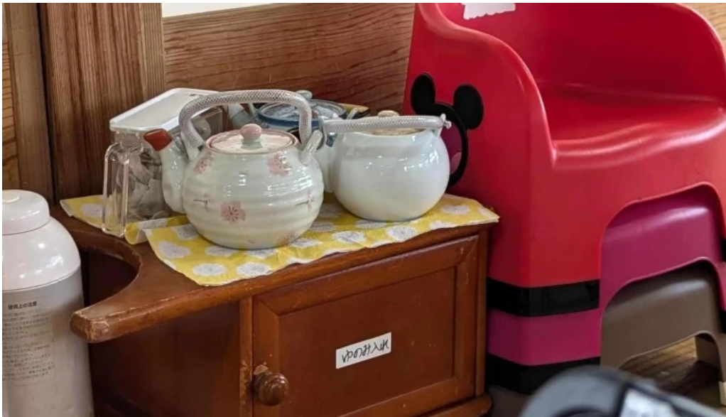
レストラン おおすみ 行き方