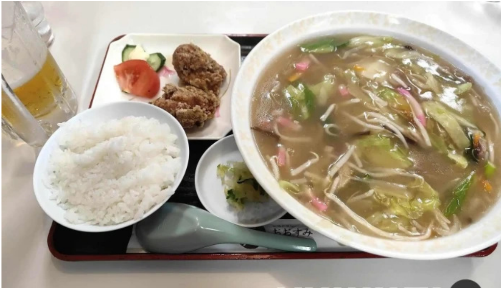
レストラン おおすみ ラーメン