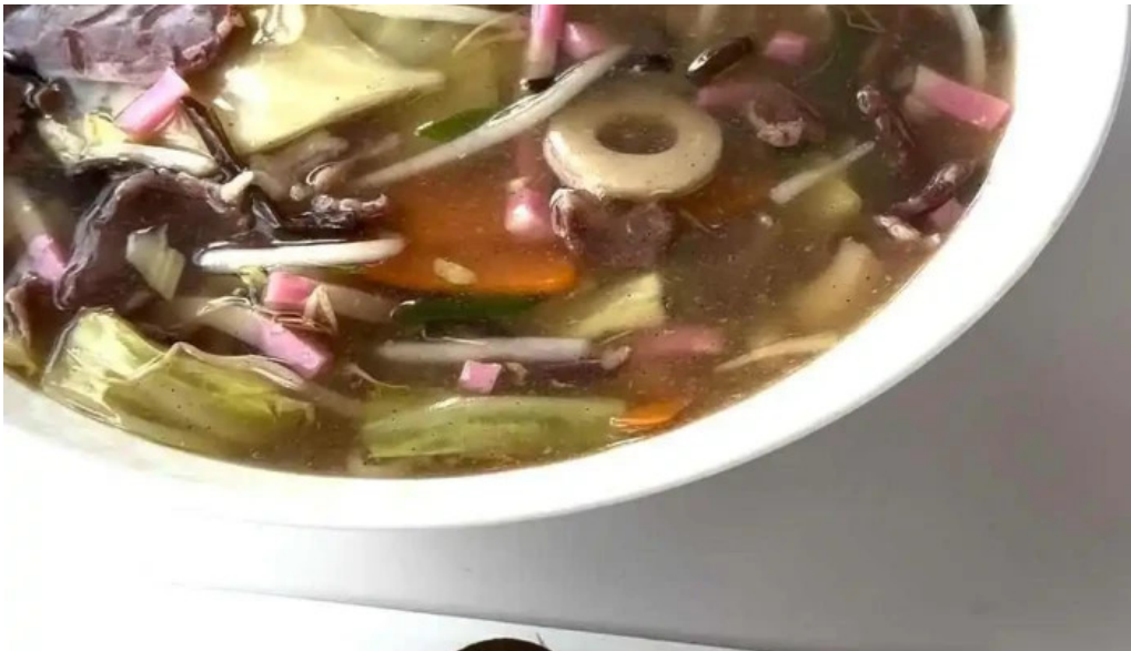
レストラン おおすみ 動画