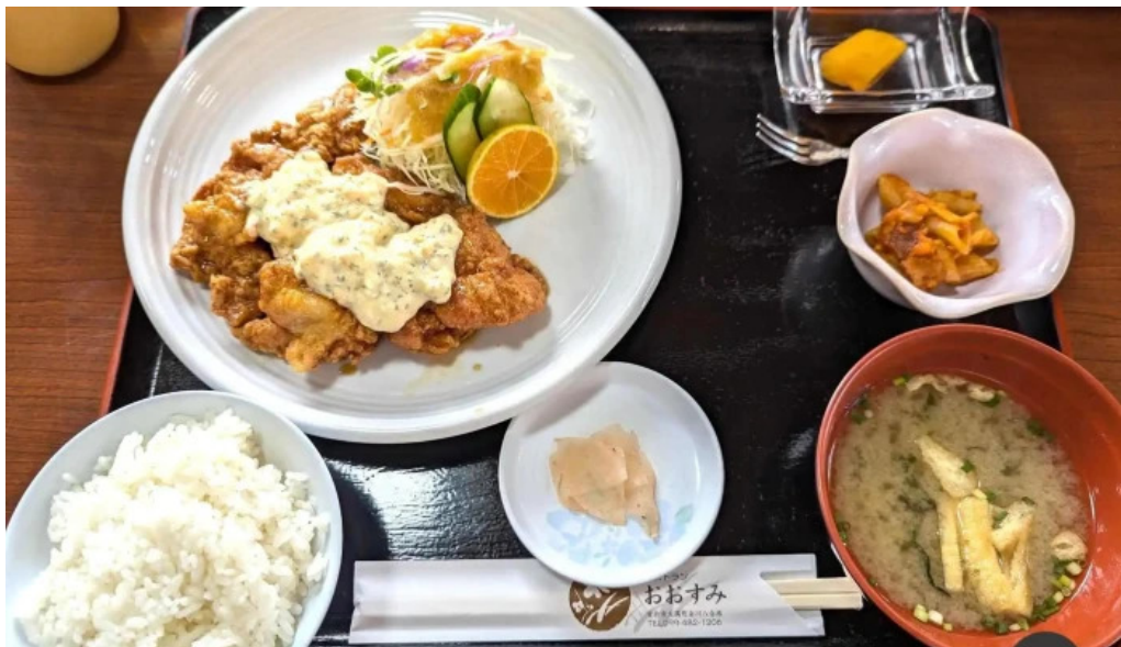
レストラン おおすみ から揚げ