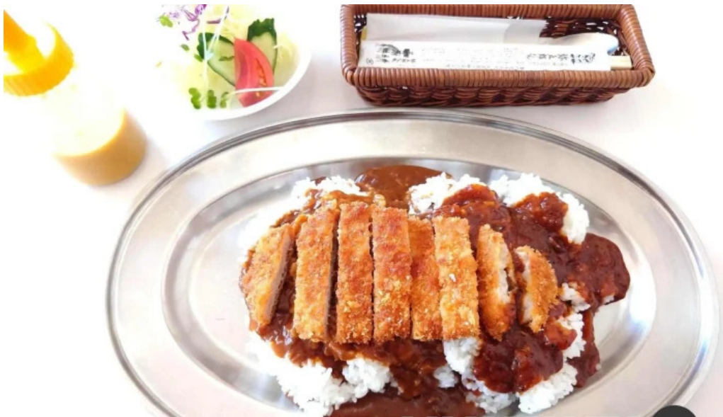
レストラン おおすみ チキンカツ