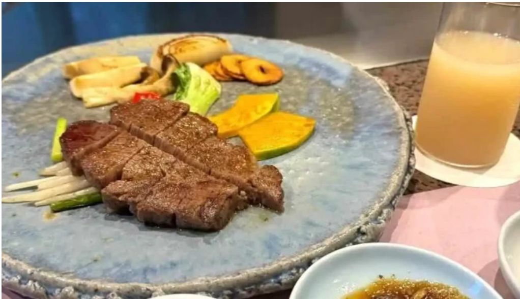
林檎屋 料理飲み物