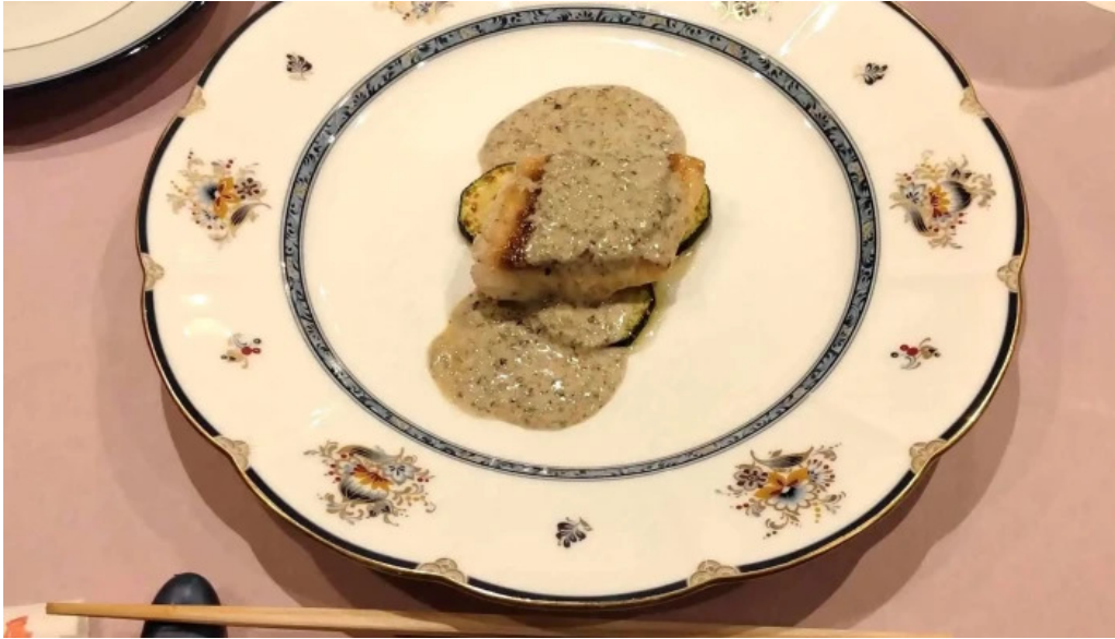
林檎屋 ウェブサイト