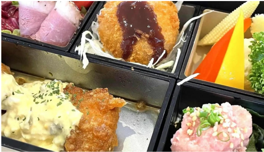
富士山の頂きます 番号