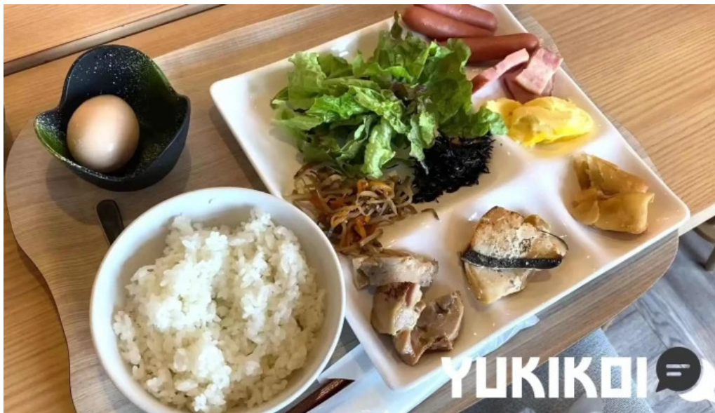
富士山の頂きます 動画