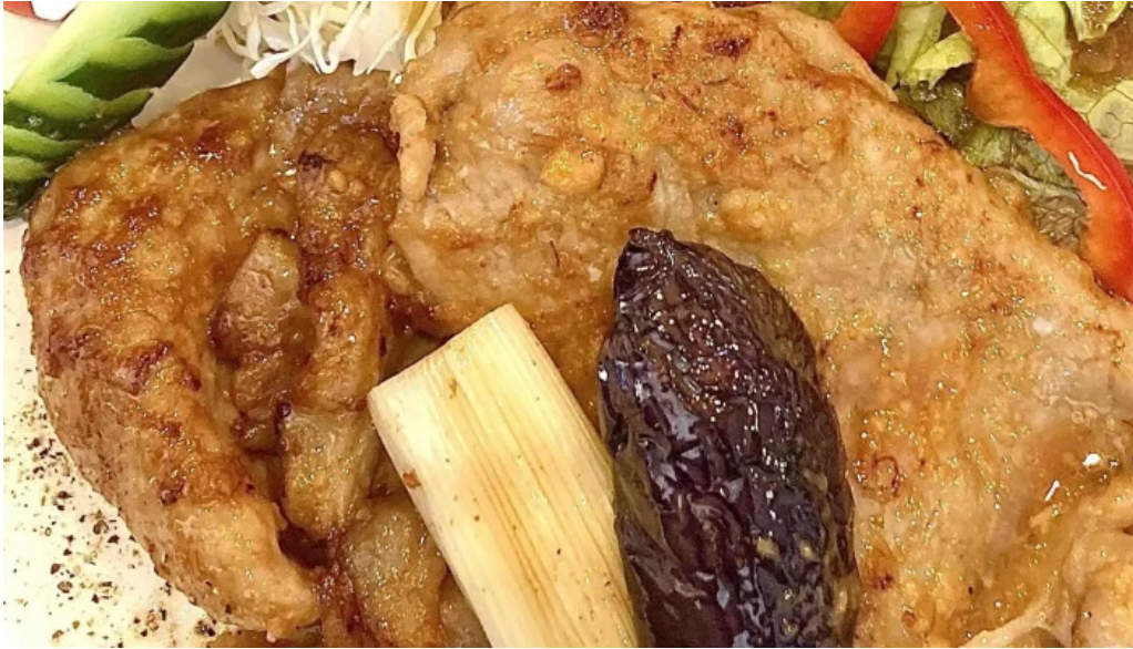
富士山の頂きます エリア