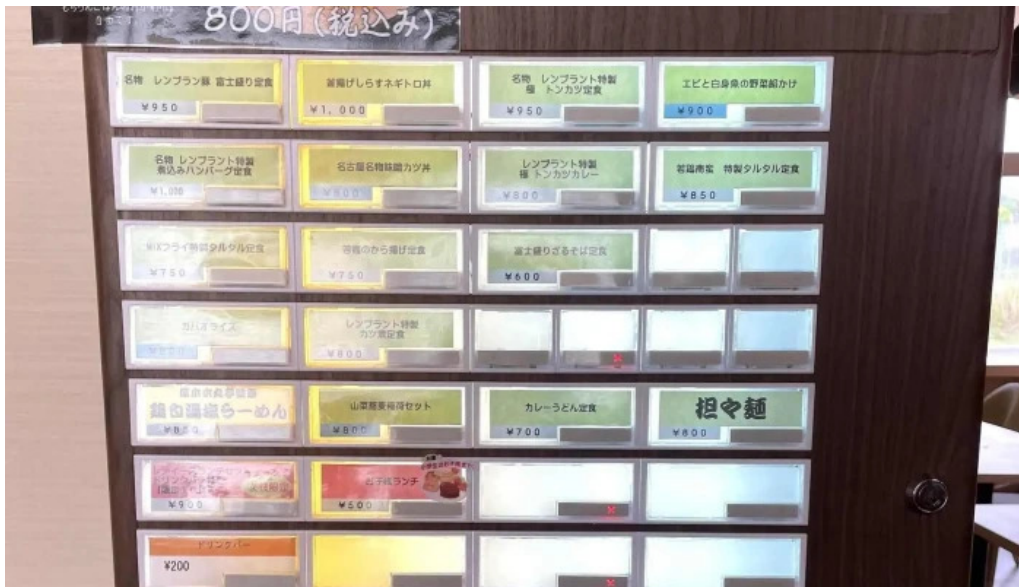
富士山の頂きます 住所