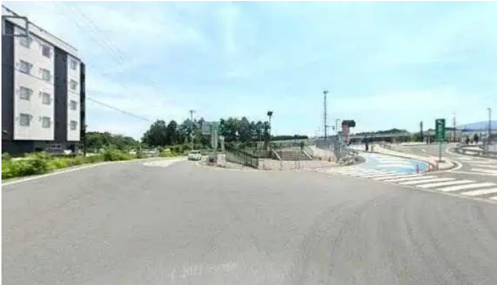
富士山の頂きます 御殿場市