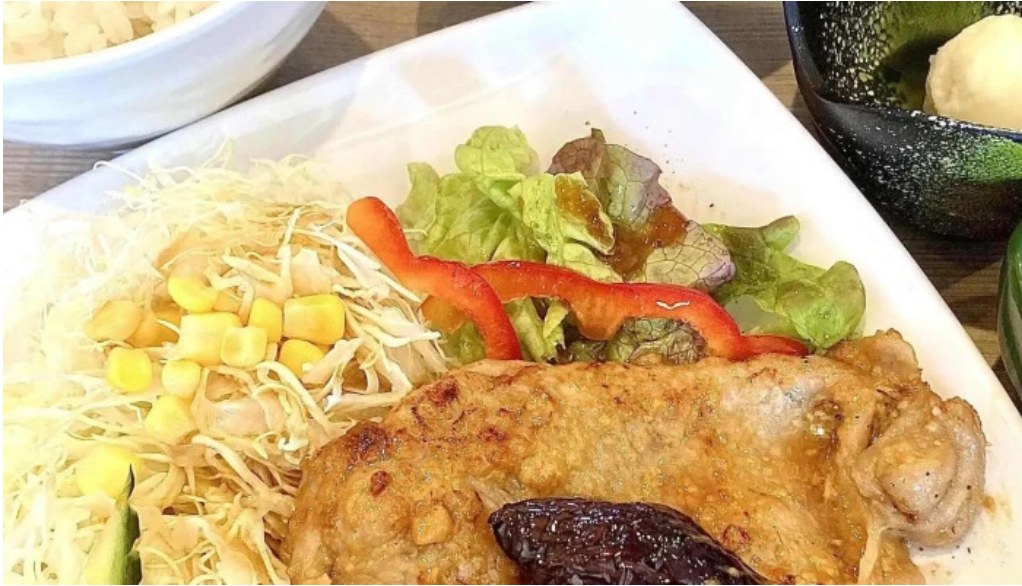
富士山の頂きます 所在地