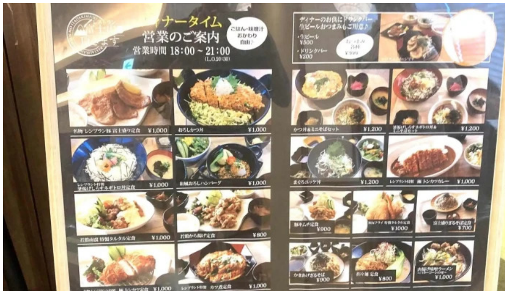
富士山の頂きます プロモーション