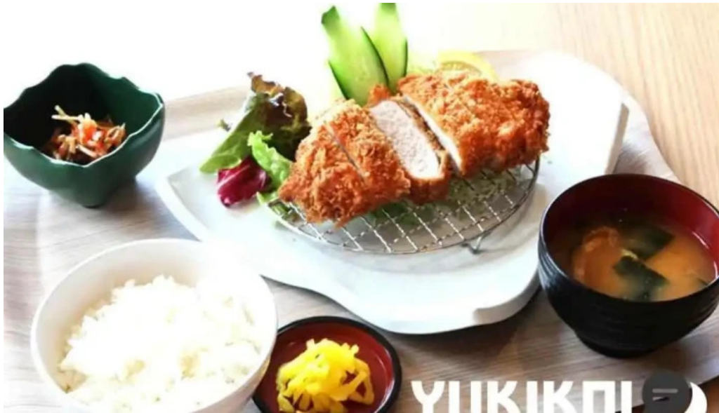
富士山の頂きます 料理飲み物