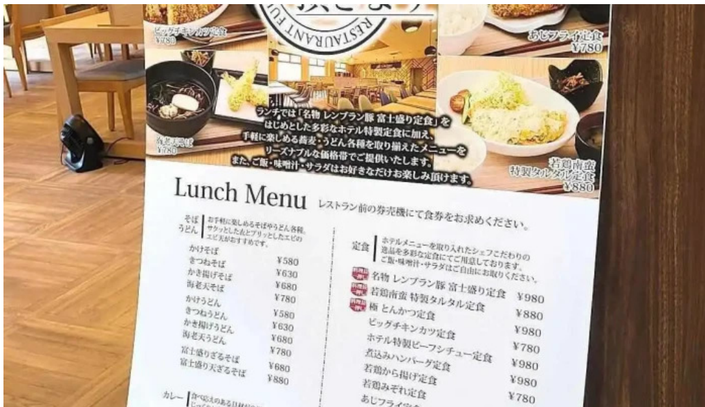
富士山の頂きます メニュー