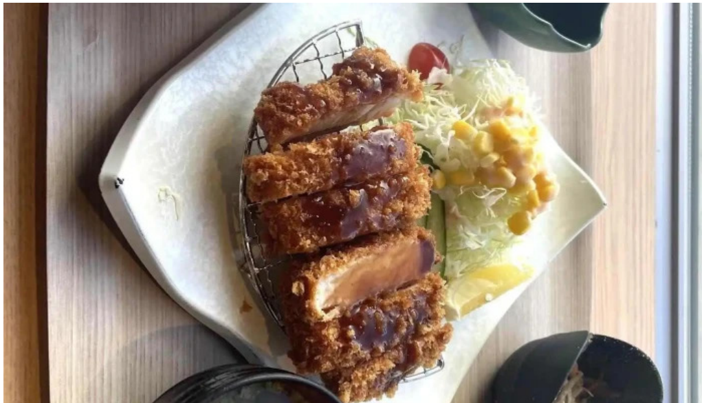
富士山の頂きます 豚カツ