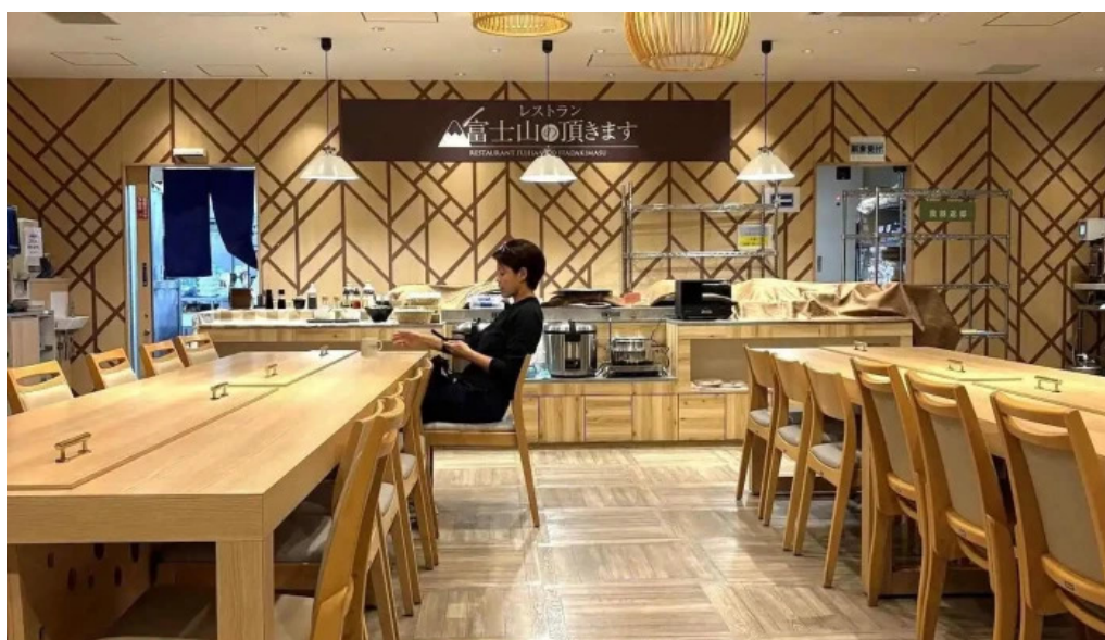
富士山の頂きます 雰囲気