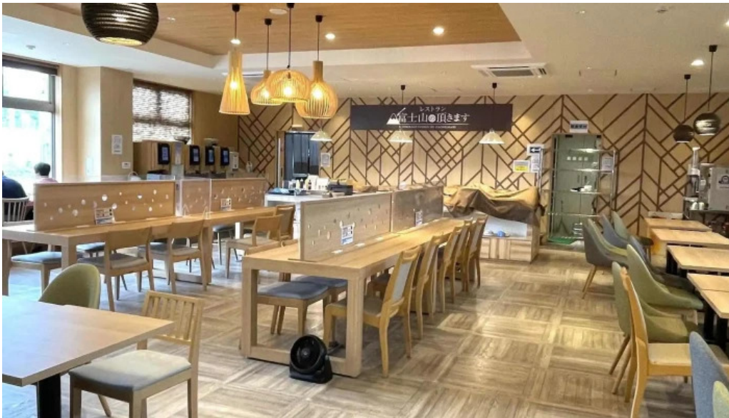
富士山の頂きます どこ