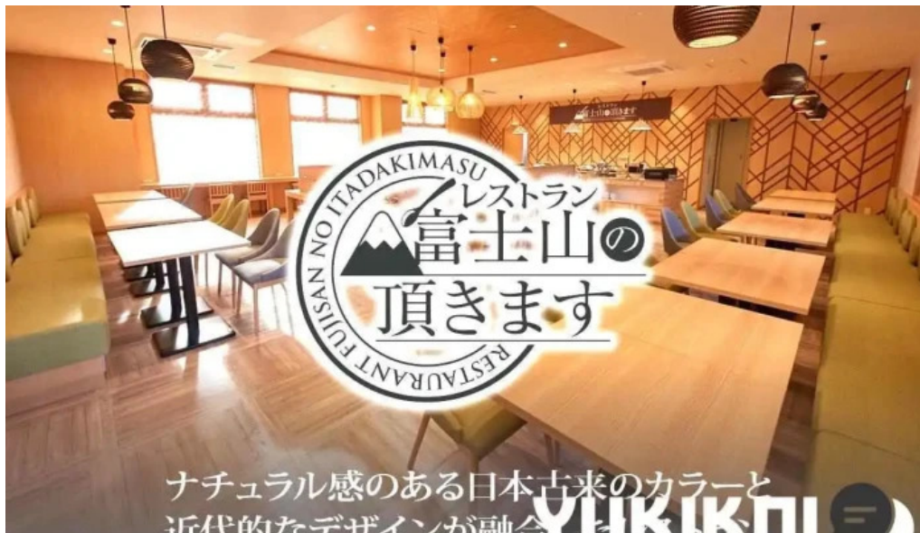
富士山の頂きます