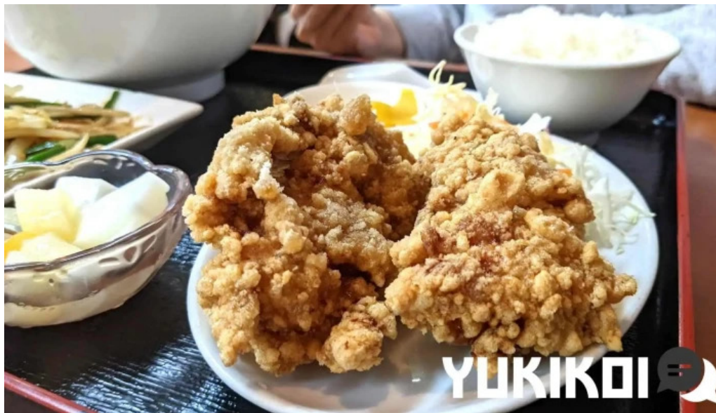
味珍中華料理 から揚げ