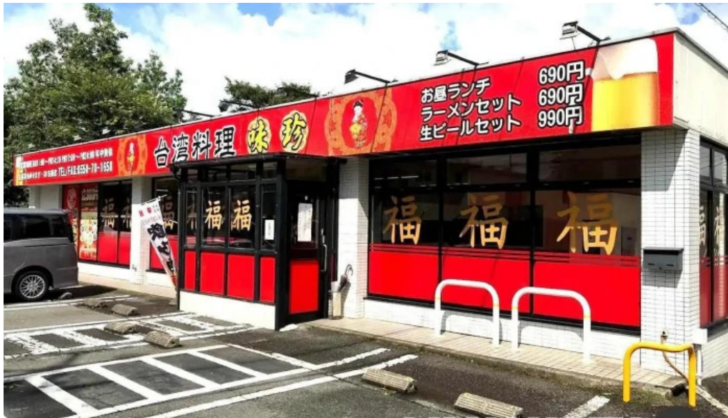
味珍・中華料理 御殿場市