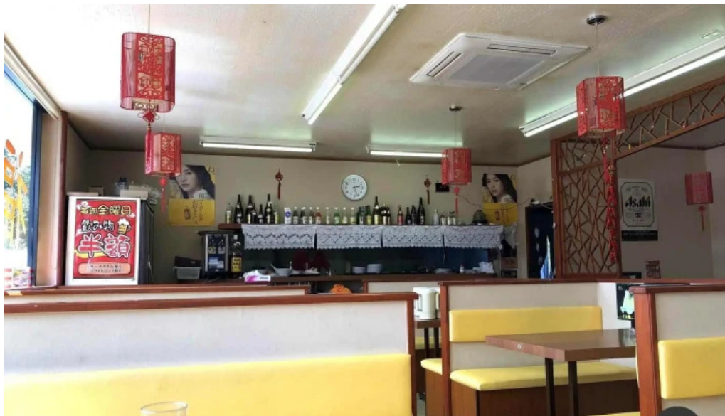
味珍中華料理 雰囲気