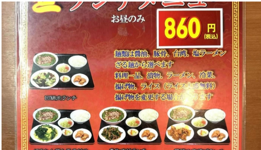
味珍中華料理 番号