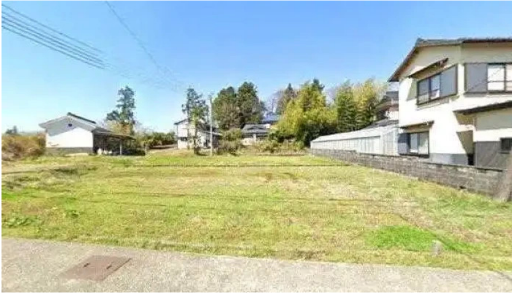
味珍中華料理 御殿場市