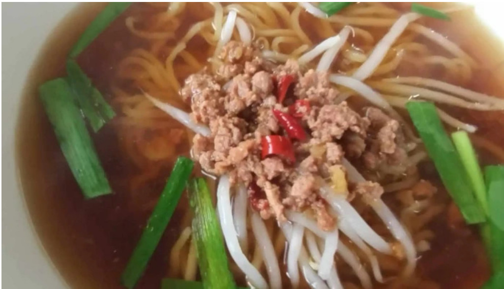
味珍中華料理 写真