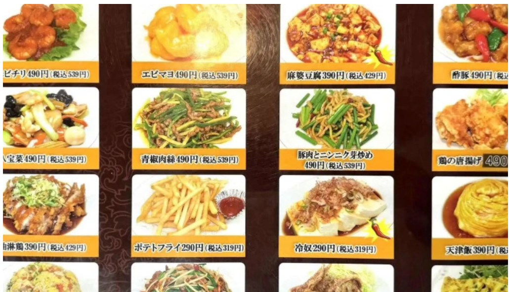
味珍中華料理 営業時間