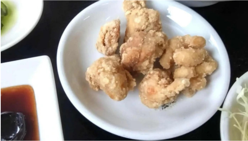
味珍中華料理 割引