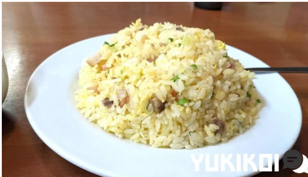
味珍中華料理 焼き飯