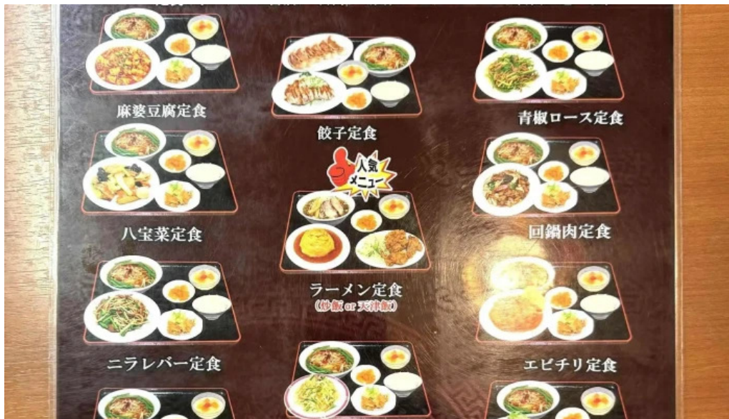
味珍中華料理 エリア