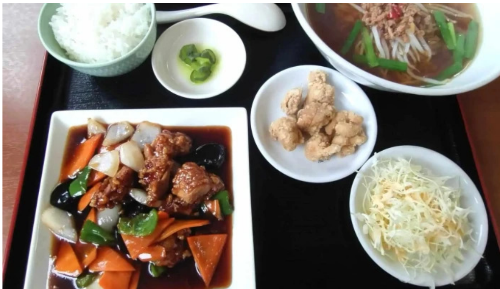
味珍中華料理 スコア