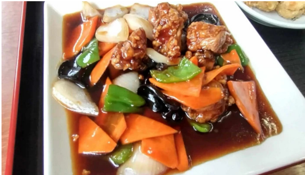
味珍中華料理 営業中