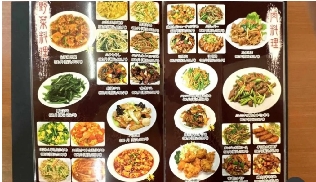
味珍中華料理 メニュー