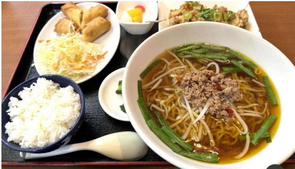
味珍中華料理 料理飲み物