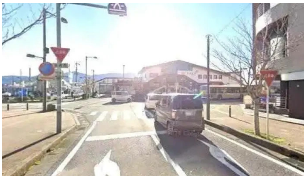
レストラン 御殿場市