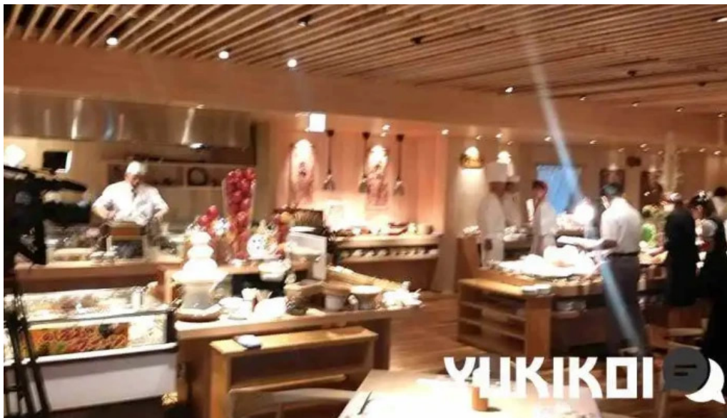
食彩健美 一木一草 雰囲気