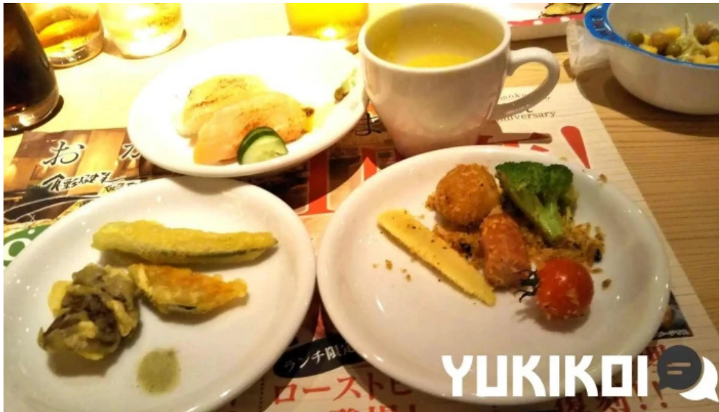
食彩健美 一木一草 料理飲み物