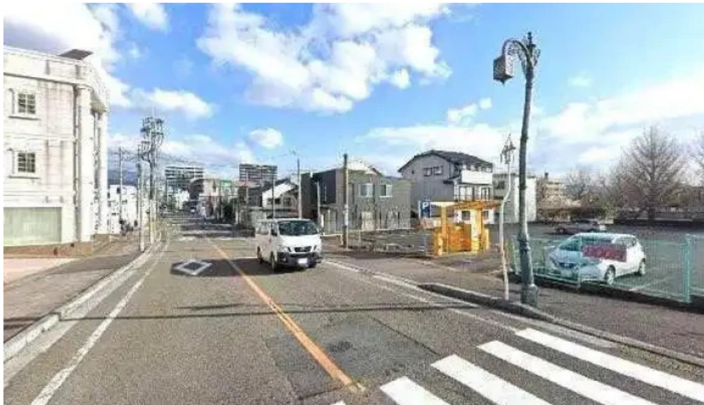
食彩健美 一木一草 延岡市