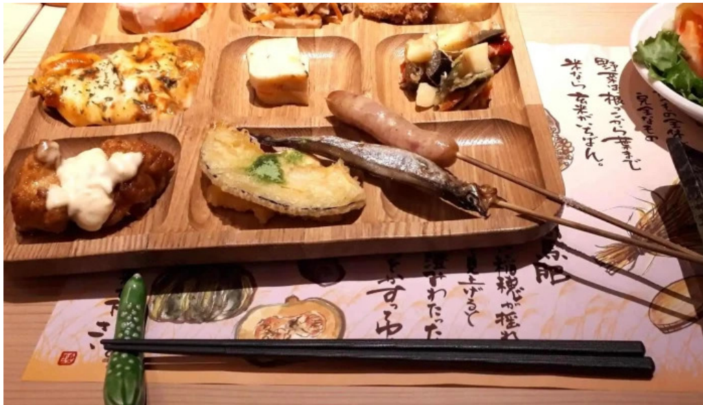
食彩健美 一木一草 instagram