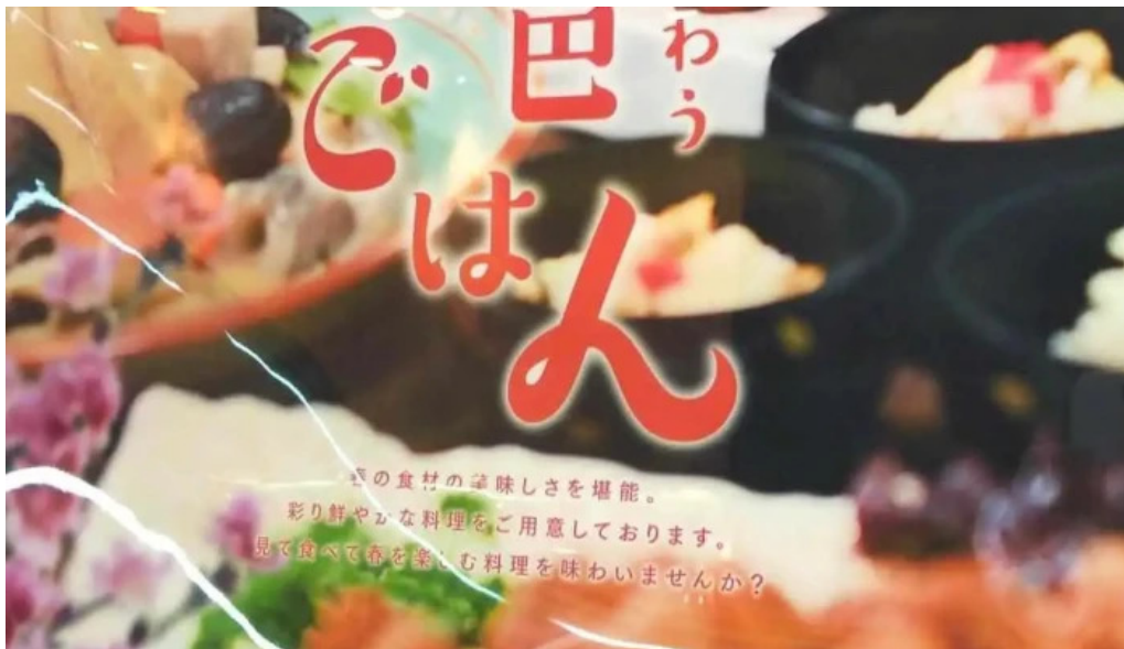
食彩健美 一木一草 メニュー