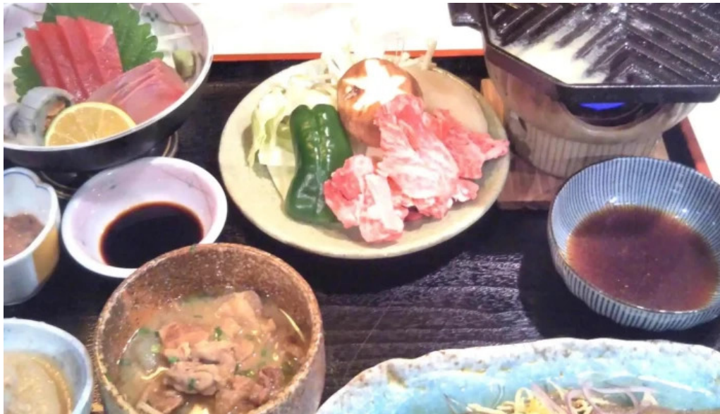
和食亭 こだま 住所