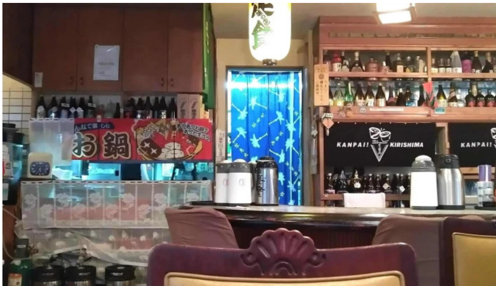
和食亭 こだま ウェブサイト