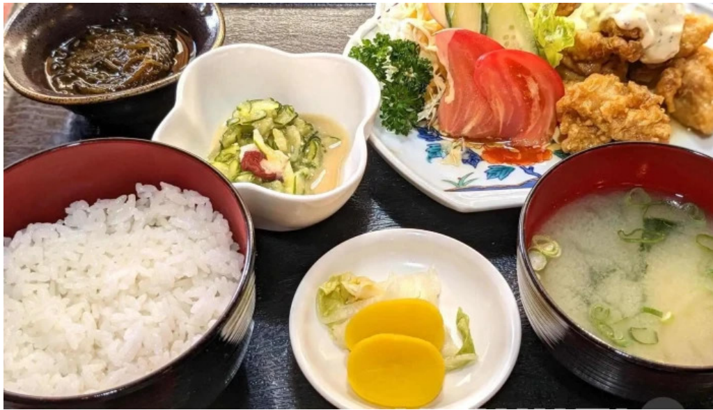
和食亭 こだま 料理飲み物