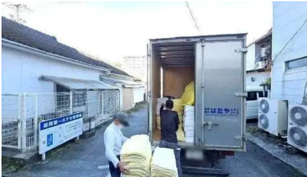
和食亭 こだま 延岡市