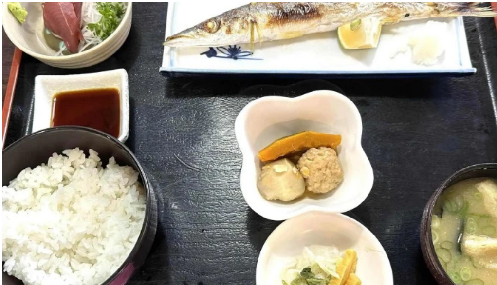
和食亭 こだま エリア