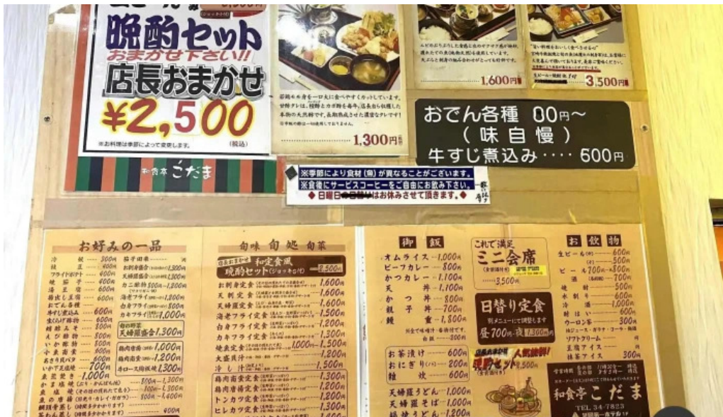
和食亭 こだま メニュー