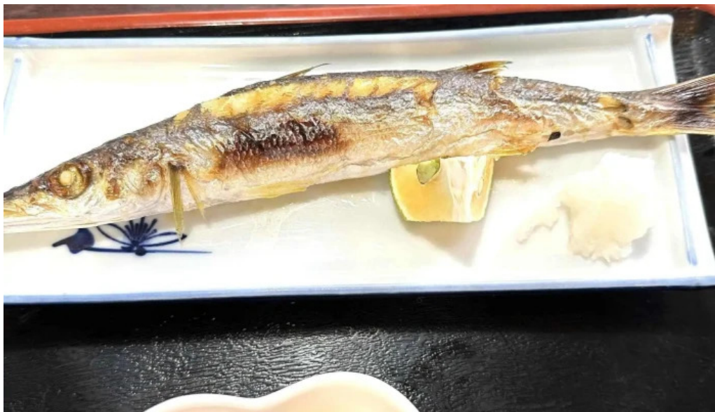
和食亭 こだま 料金