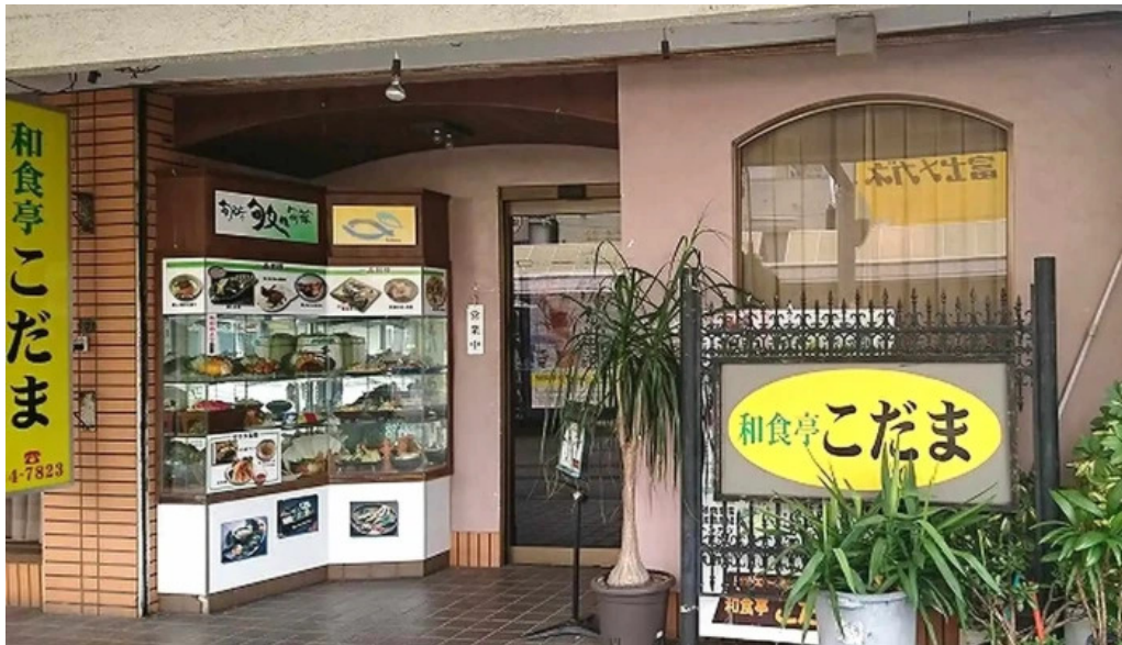
和食亭 こだま 番号