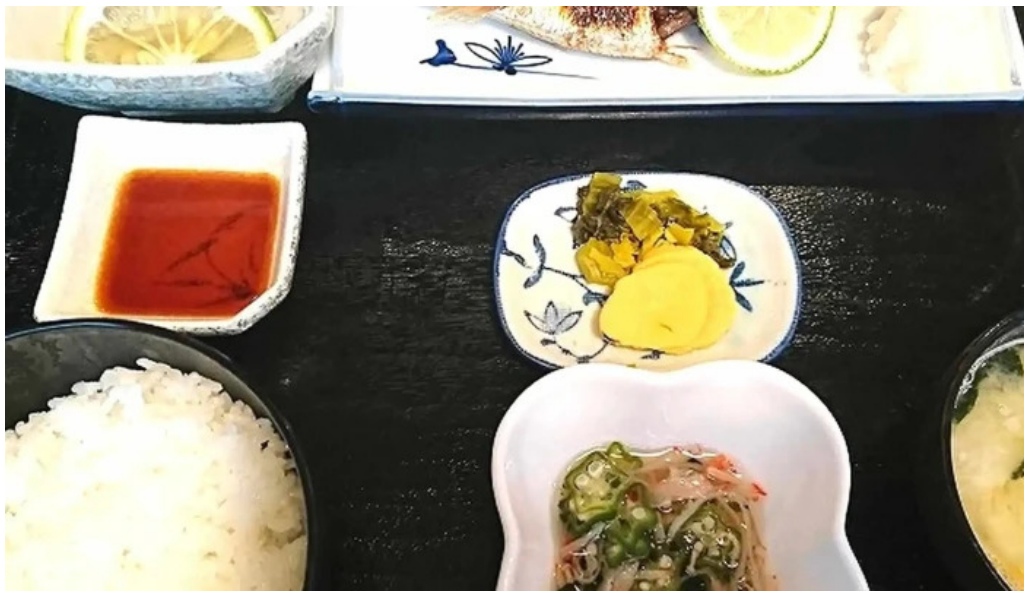
和食亭 こだま 営業時間