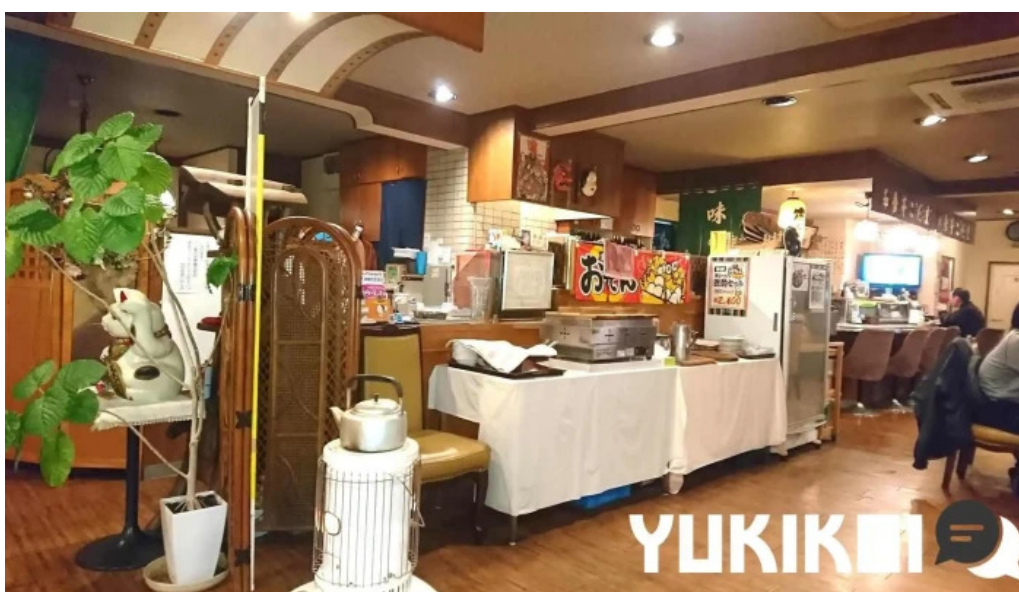
和食亭 こだま 雰囲気