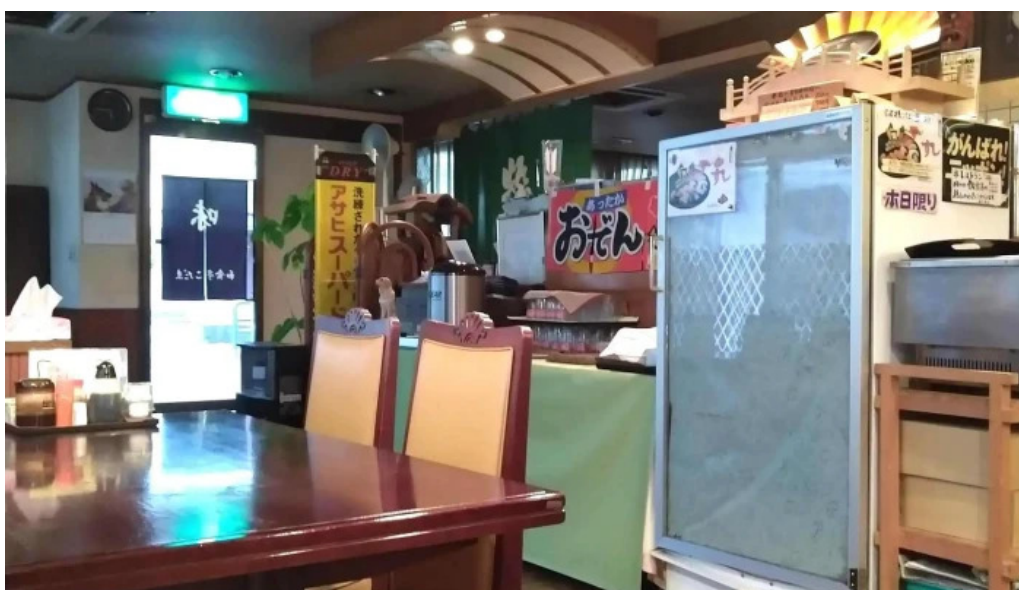
和食亭 こだま 電話