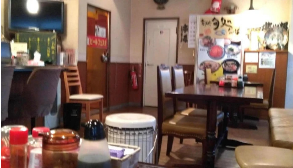
和食亭 こだま 口コミ