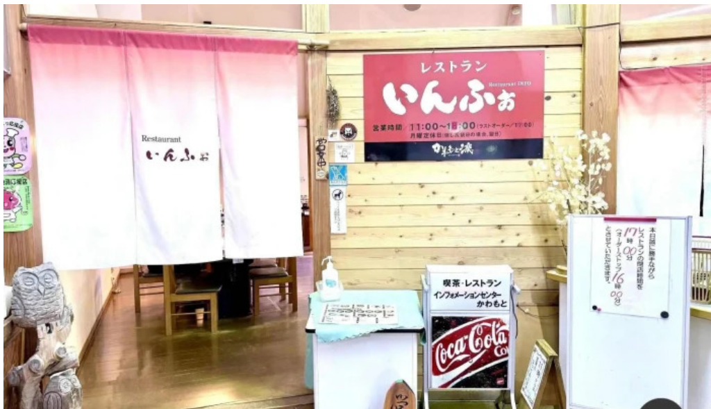
レストランいんぷお すべて