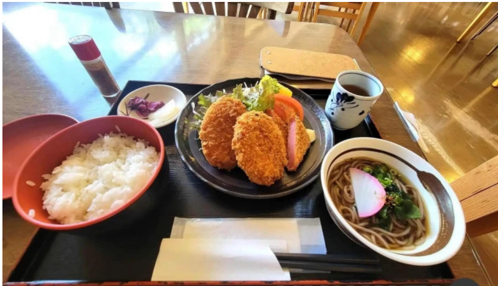
レストランいんぷお 料理飲み物