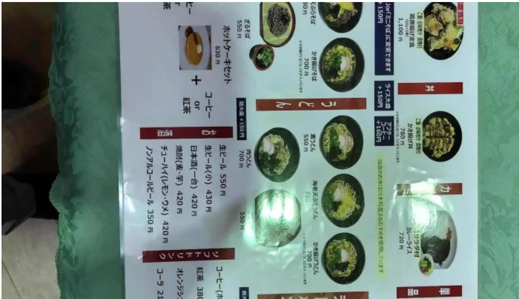
レストランいんぷお 最新