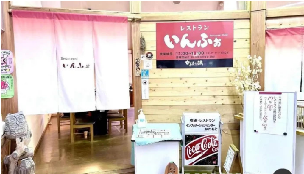
レストランいんぷお 川本町