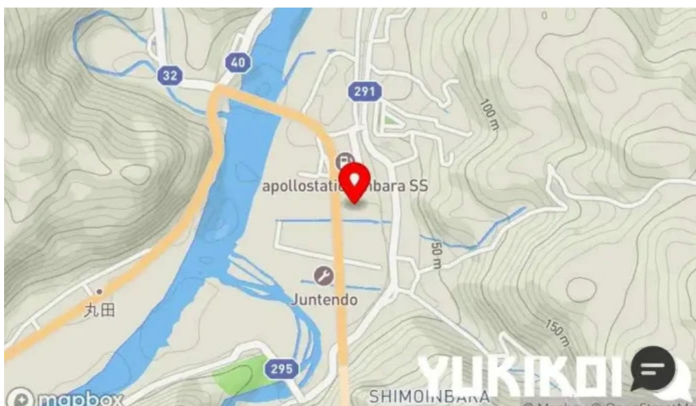
レストランいんぷお地図