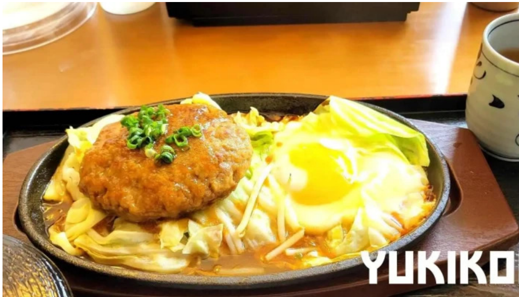
レストランいんぷお カツ丼