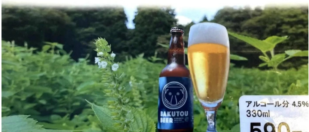
レストランいんぷお comentario 5

(エゴマセゾン) 原材料に川本町産えごま葉を使用して作ったビールで スッキリとした後口だけえ飲んでみちゃんさい。