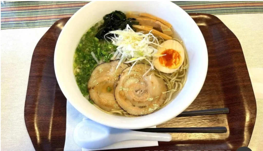
レストランいんぷお ラーメン