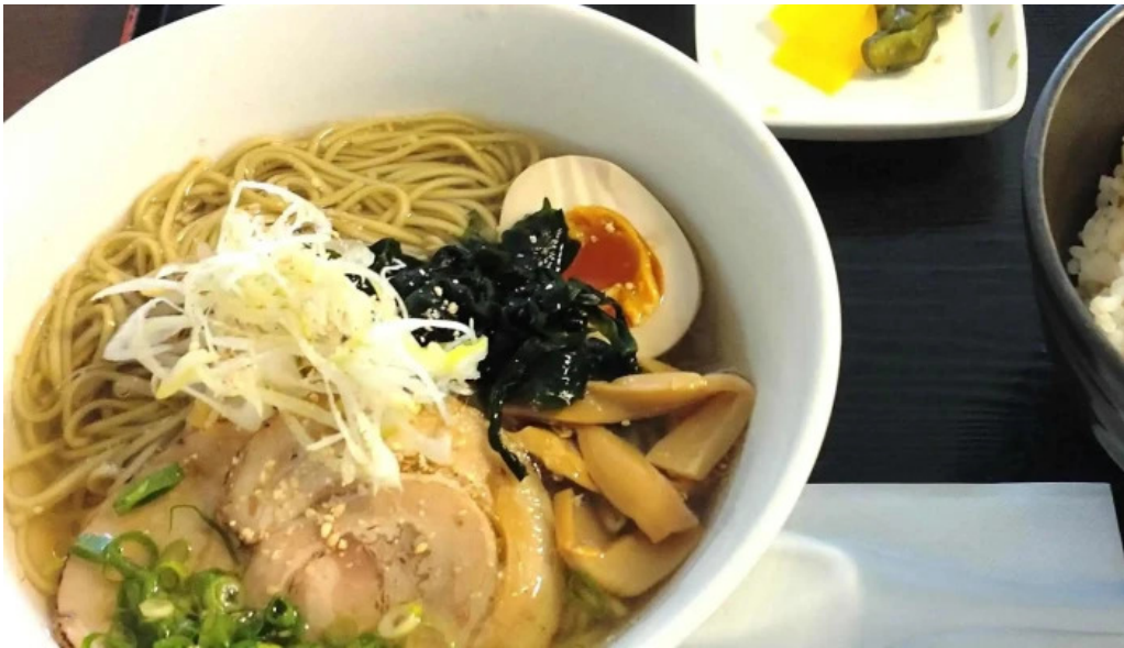
レストランいんぷお comentario 3