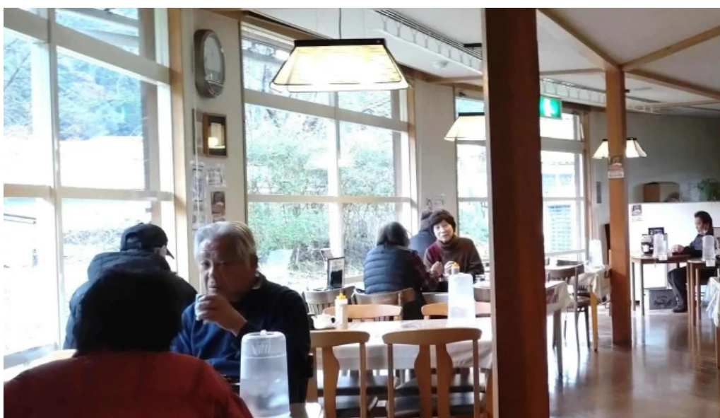
レストランいんぷお comentario 1