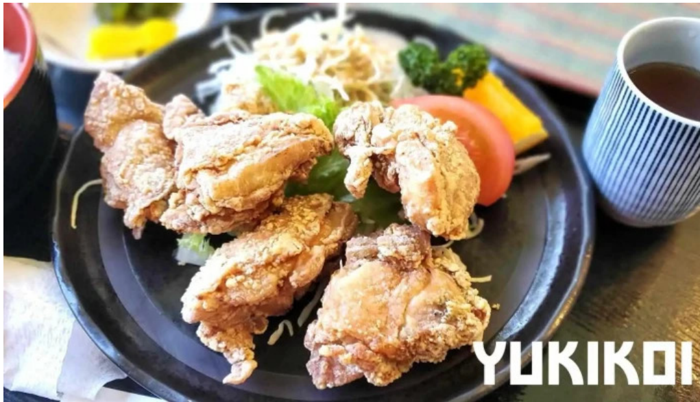
レストランいんぷお から揚げ

(エゴマセゾン) 原材料に川本町産えごま葉を使用して作ったビールで スッキリとした後口だけえ飲んでみちゃんさい。