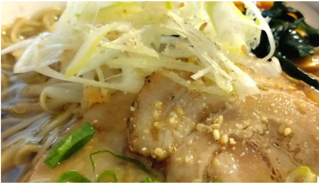
レストランいんぷお comentario 4