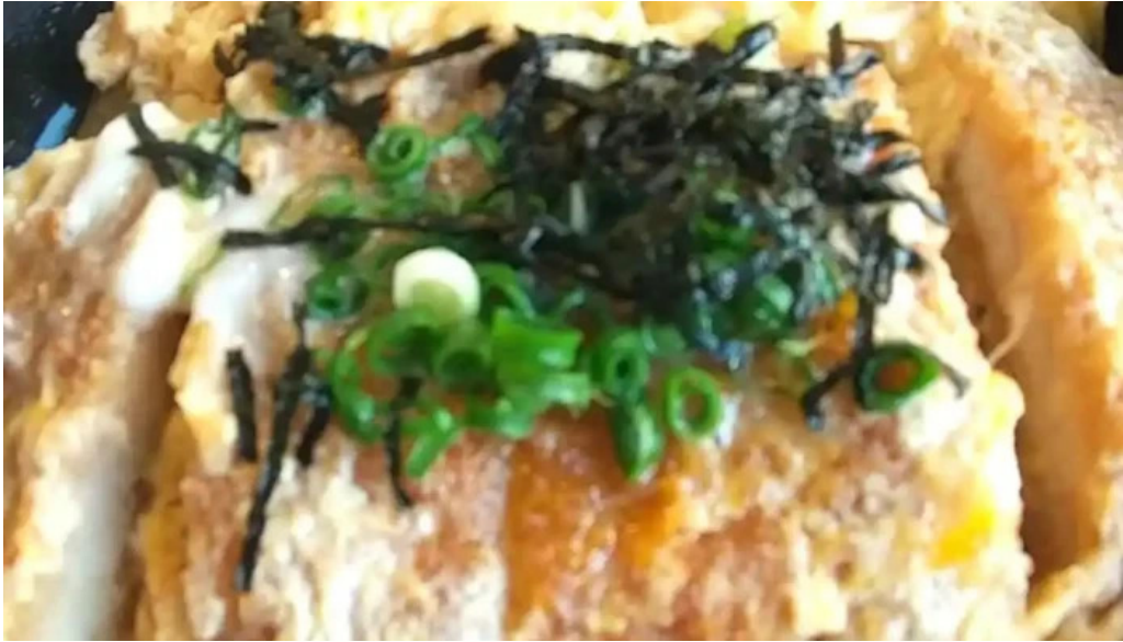
レストランいんぷお 動画