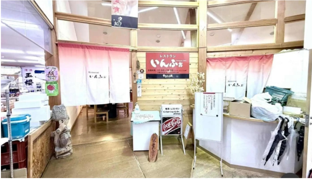
レストランいんぷお 雰囲気