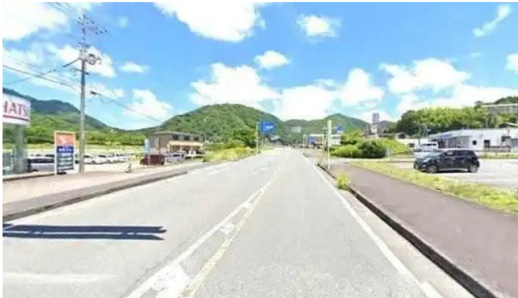
レストランいんぷお ストリートビューと 360 ビュー