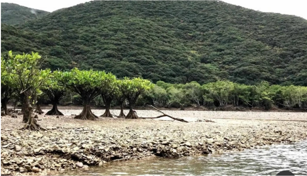
道の駅レストランマングローブ 住用川マングローブ林