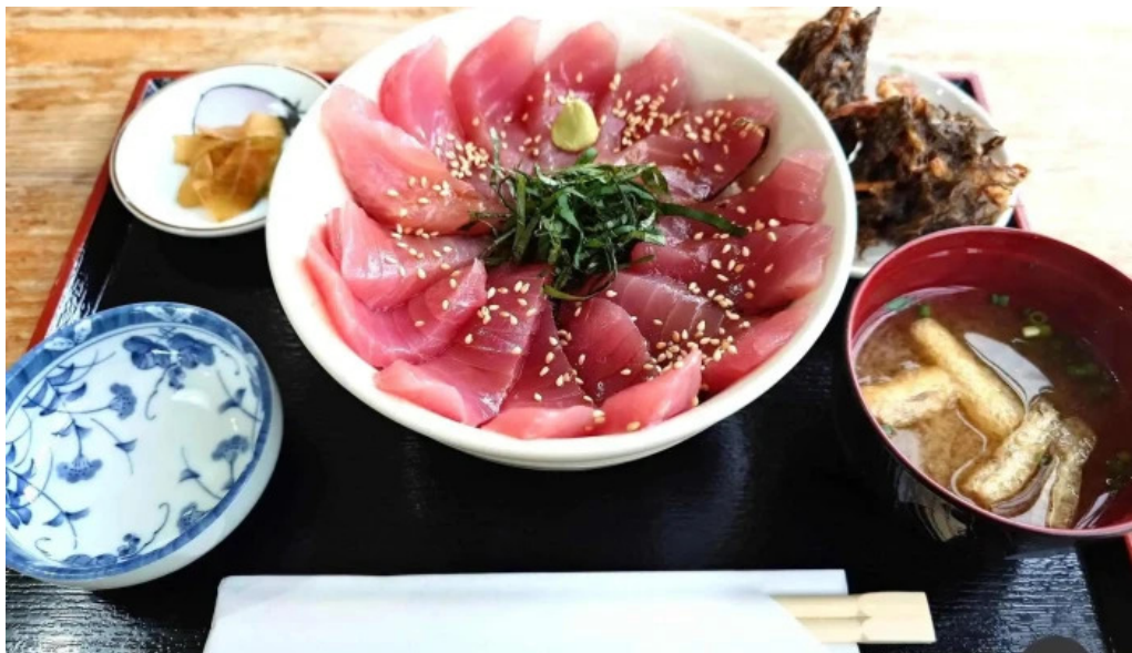
道の駅レストランマングローブ 刺身