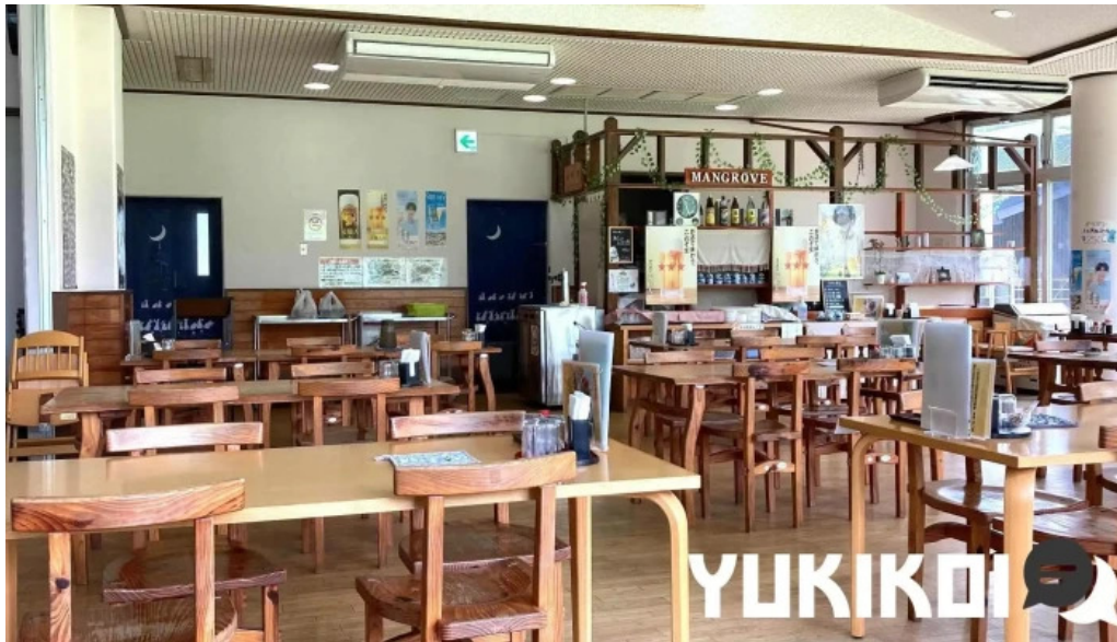
道の駅レストランマングローブ 奄美市