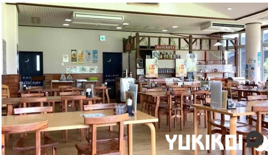
道の駅レストランマングローブ 雰囲気