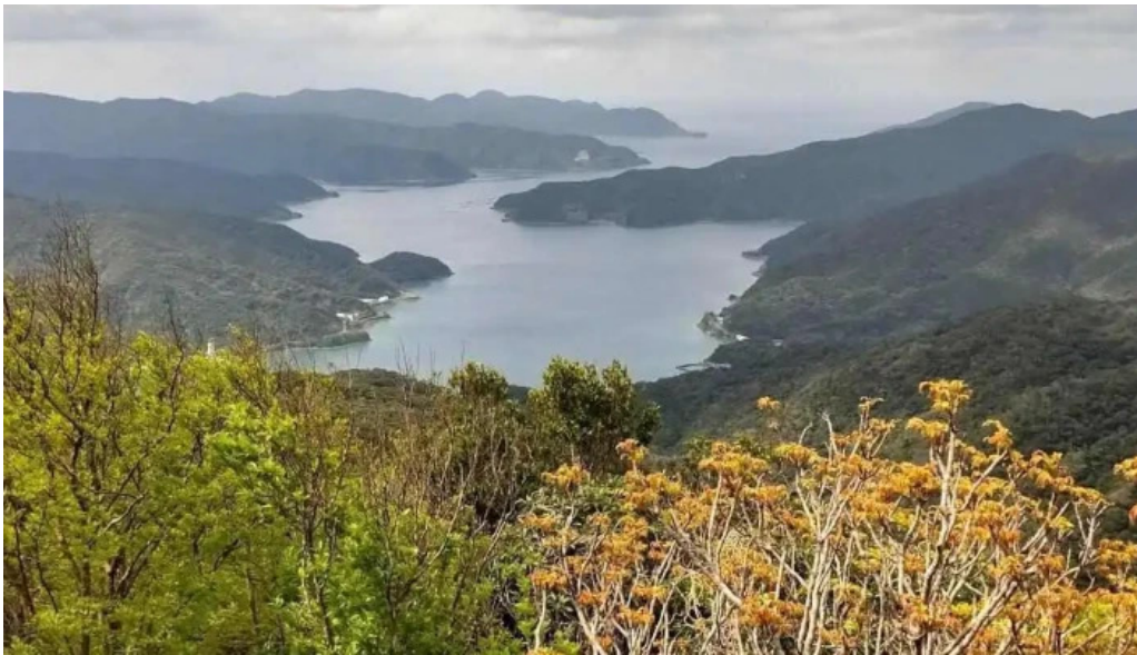
道の駅レストランマングローブ 湯湾岳展望公園