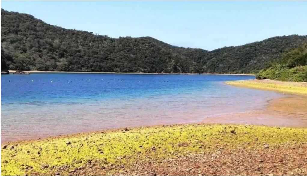
道の駅レストランマングローブ 第18震洋隊基地跡