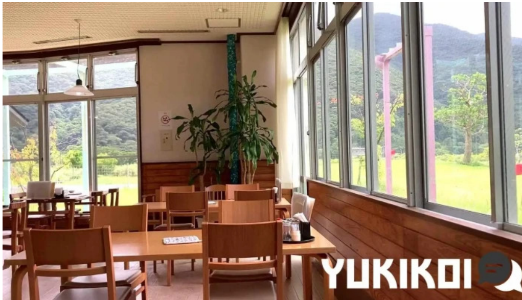
道の駅レストランマングローブ 動画