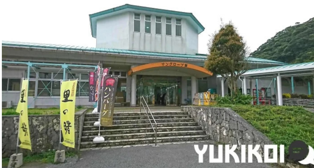
道の駅レストランマングローブ 道の駅 奄美大島住用