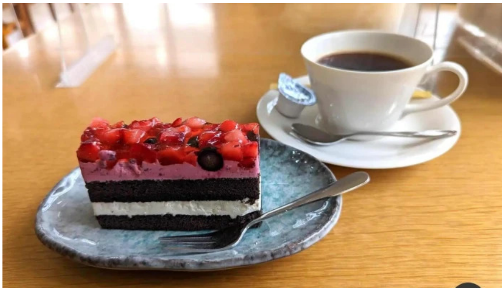
道の駅レストランマングローブ 料理飲み物