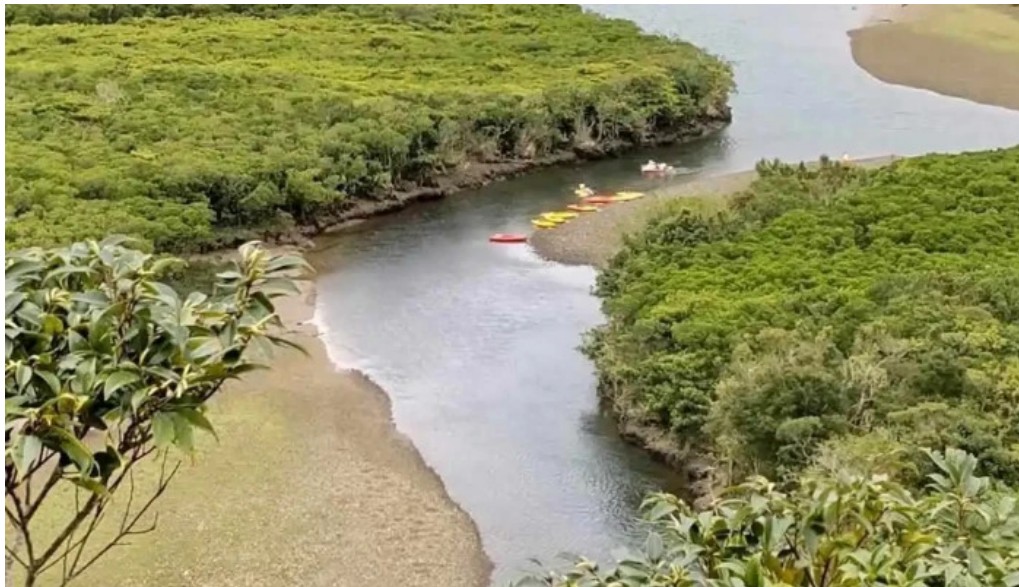
道の駅レストランマングローブ マングローブ展望台