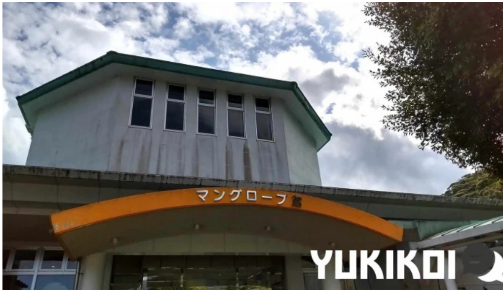
道の駅レストランマングローブ マングローブ館