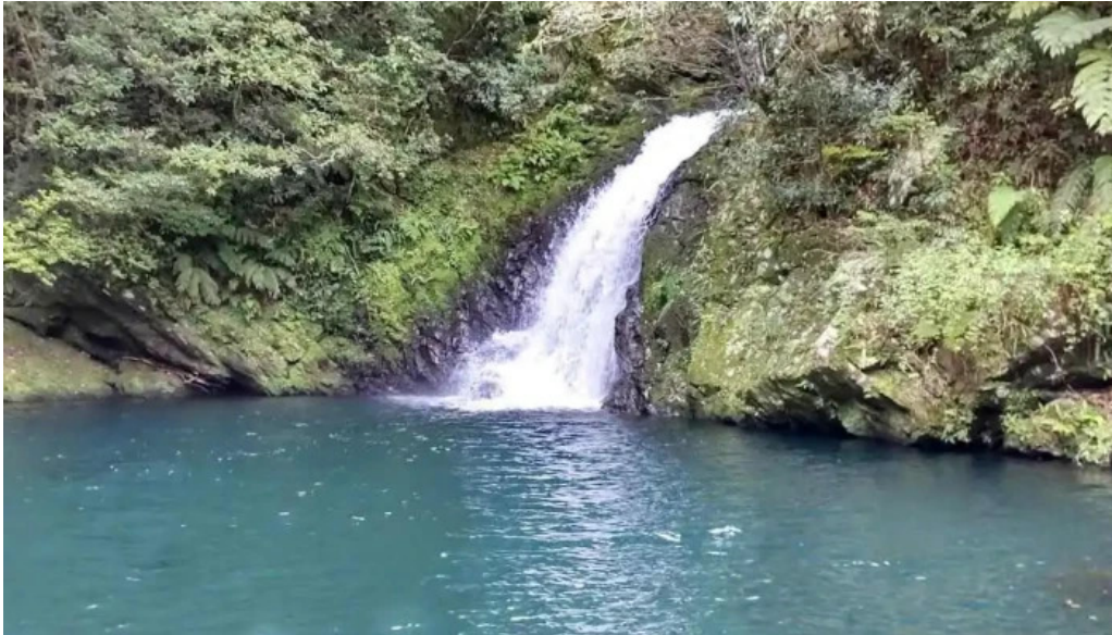
道の駅レストランマングローブ マテリアの滝