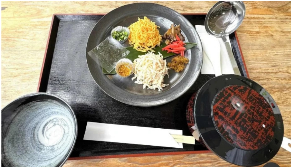
道の駅レストランマングローブ 最新