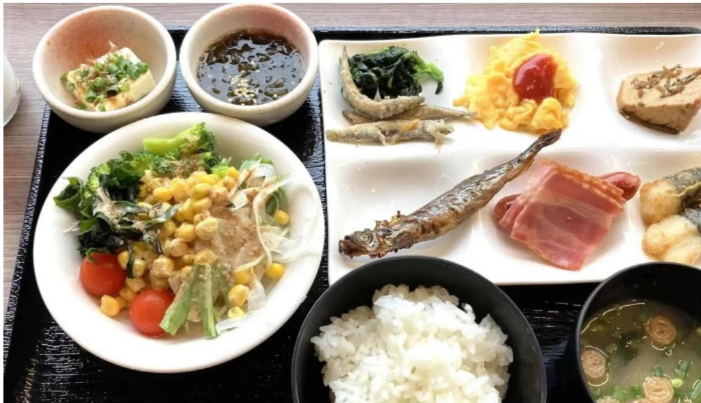
レストラン南風 営業中