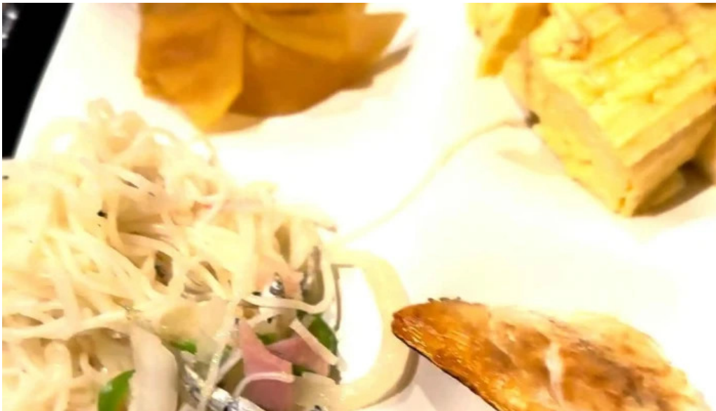
レストラン南風 プロモーション