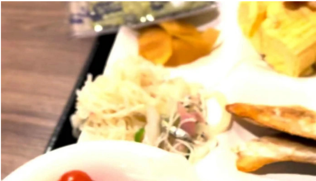
レストラン南風 写真