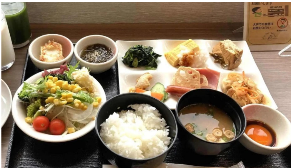
レストラン南風 近く