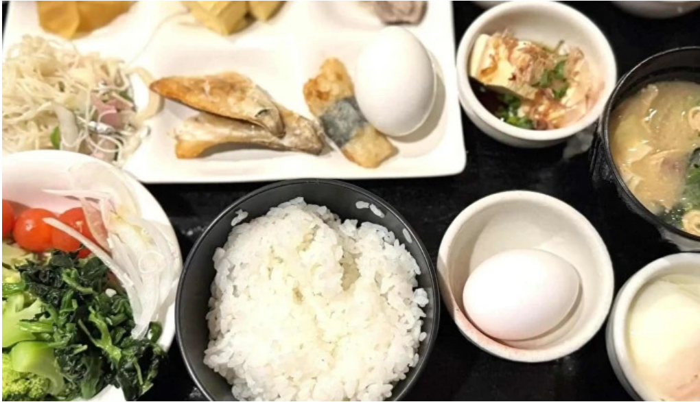
レストラン南風 ウェブサイト