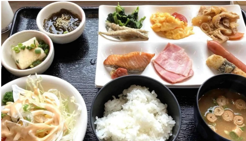
レストラン南風 番号