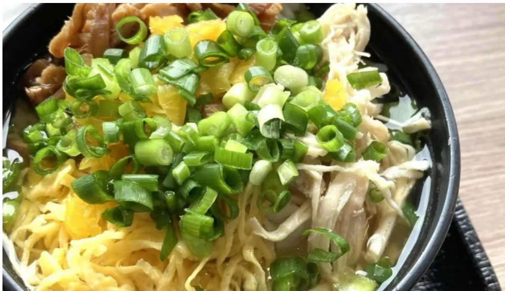
レストラン南風 料金