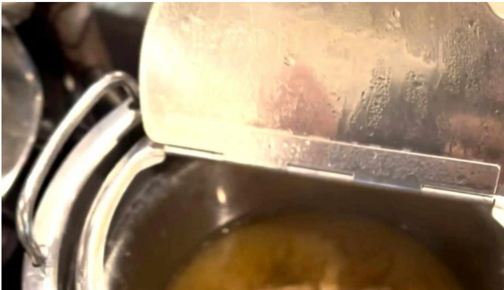
レストラン南風 どこ