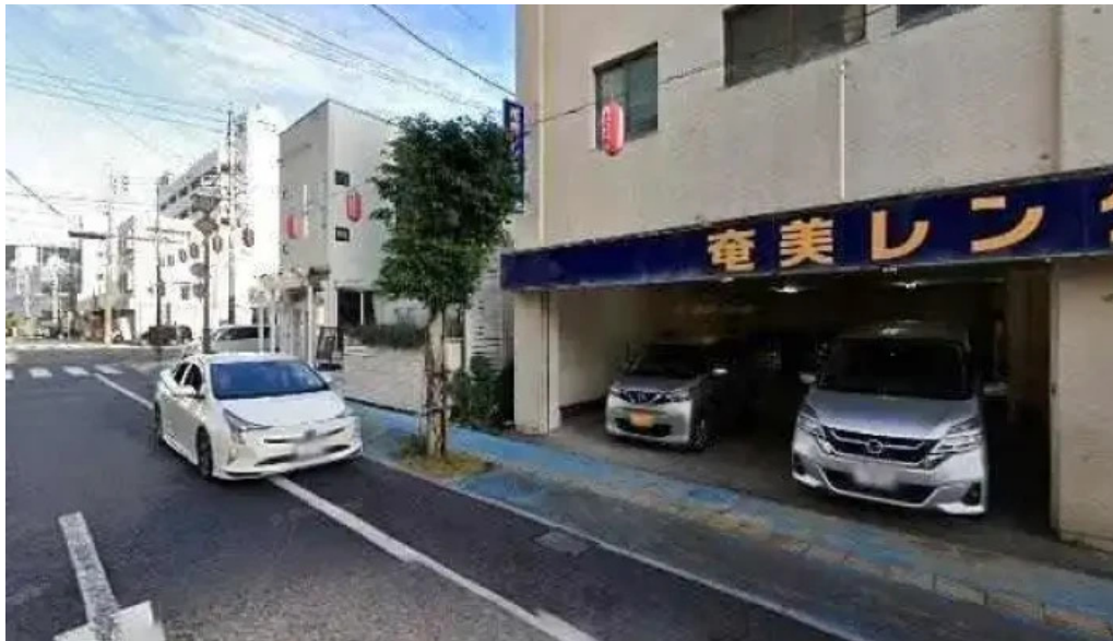
レストラン南風 奄美市