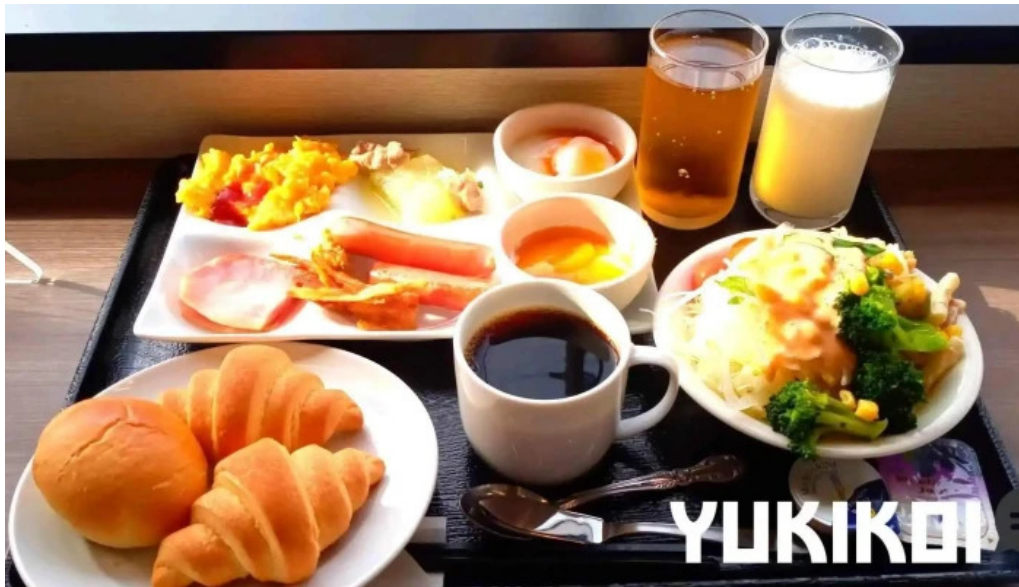
レストラン南風 料理飲み物